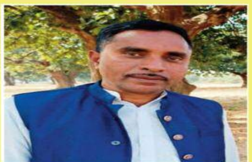
मो क्यूस जिप प्रतिनिधि

शिक्षा, स्वास्थ्य, महिला सशक्तिकरण, रोजगार, बिजली, पेयजल, पक्की सड़क की व्यवस्था हमारी प्राथमिकता। एक बार पुनः सहयोग की अपेक्षा।