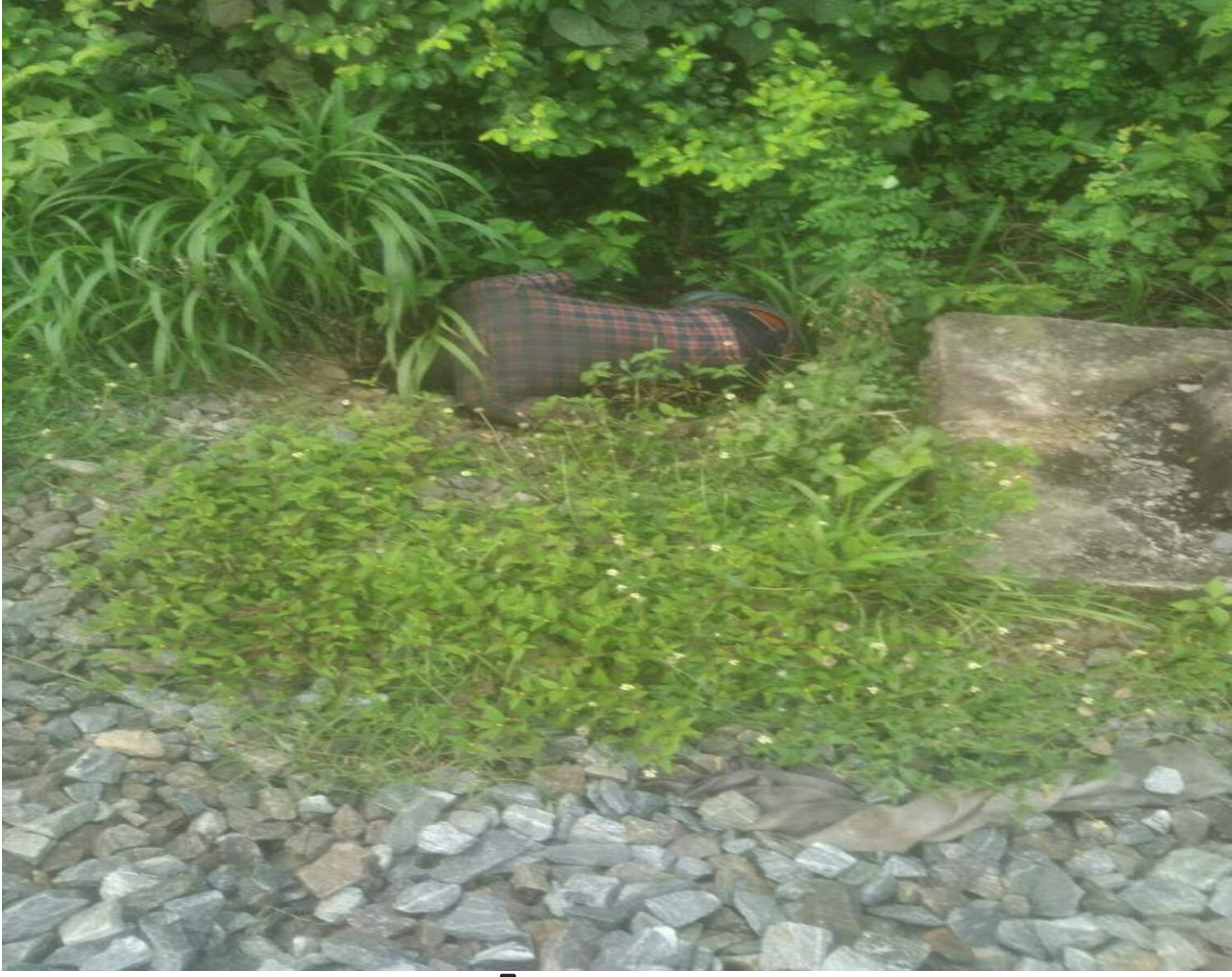
प्रवासी मजदूर का पड़ा शव