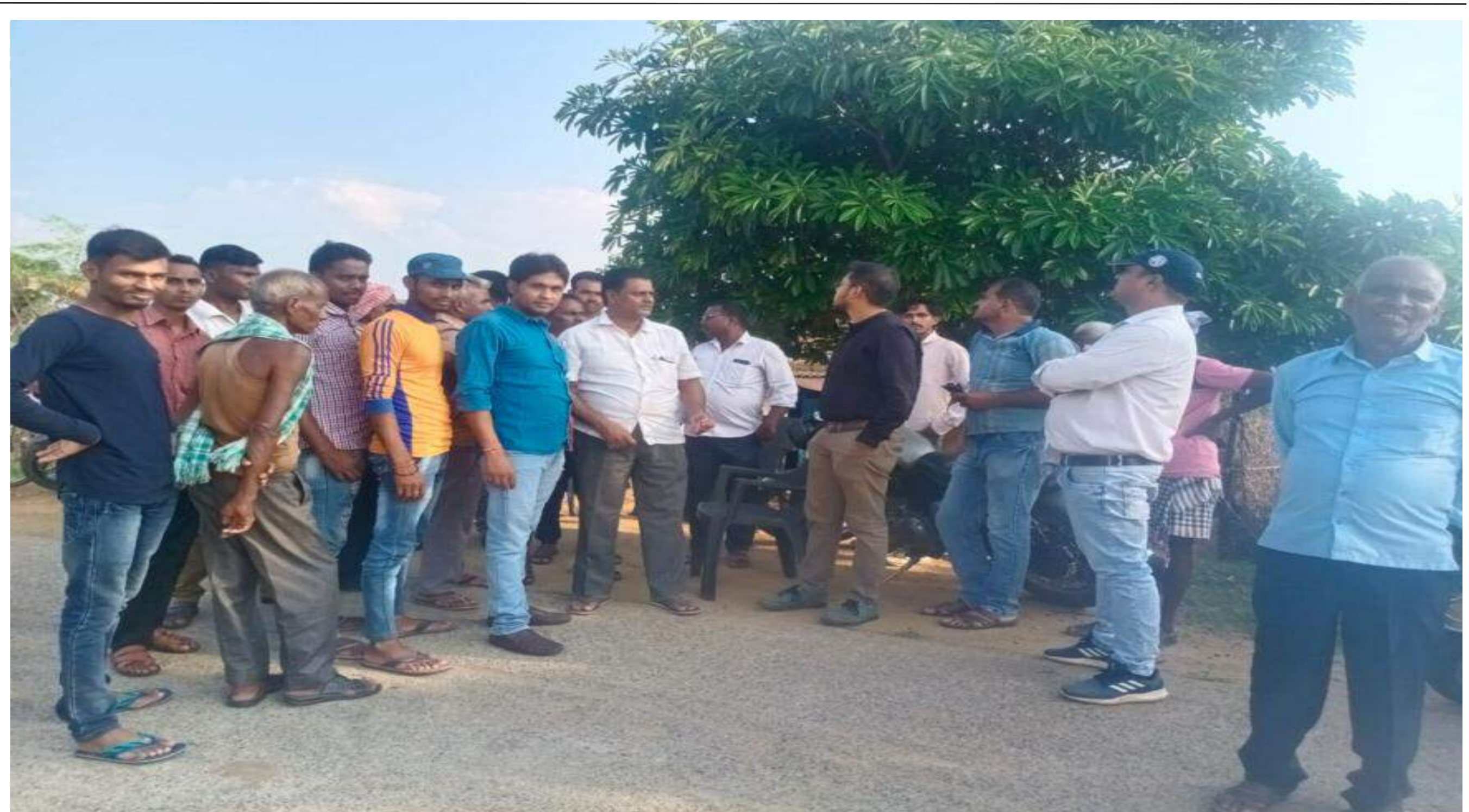
बिजली विभाग के मनमानी के खिलाफ विरोध जताते ग्रामीण