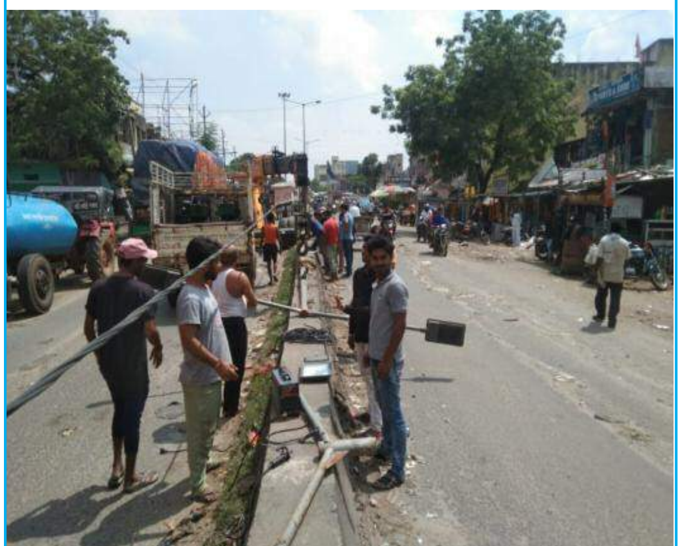
खराब पड़े लाइट को ठीक कराते पूजा समिति के सदस्य

बरही गया रोड में एनटीपीसी के द्वारा कई स्ट्रीट लाइट लगाए गए थे। लेकिन कुछ समय ले बाद लाइट खराब हो गया। पिछले कई महीनों से लाइट खराब पड़े थे। कुछ रोड के किनारे बिखरे पड़े थे। लेकिन कोई अधिकारी खराब पड़े स्ट्रीट लाइट पर ध्यान नहीं दिया। जबकि सप्ताह में बरही के गया रोड से कई विधायक कई मंत्री आते जाते हैं, लेकिन खराब पड़े इस स्ट्रीट लाइट की और किसी का ध्यान नहीं गया। अंत में आने वाले पर्व जैसे दुर्गा पूजा, दीपावली, एवं छठ पूजा को देखते हुए गया रोड दुर्गा पूजा समिति के सदस्यों के द्वारा खराब पड़े स्ट्रीट लाइट को ठीक कराया गया।