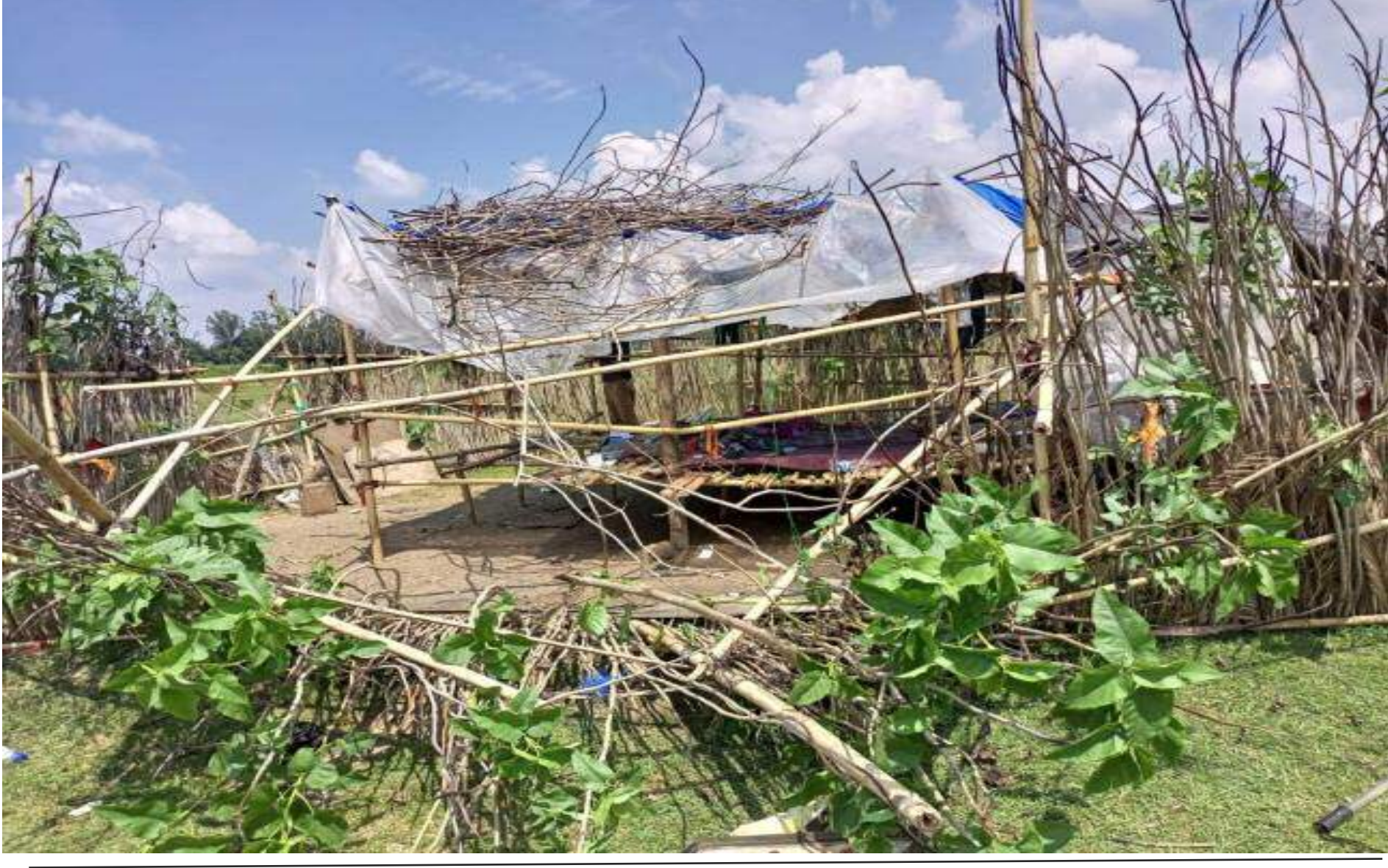
वन भूमि को अतिक्रमण कर बनाया गया झोपड़ी