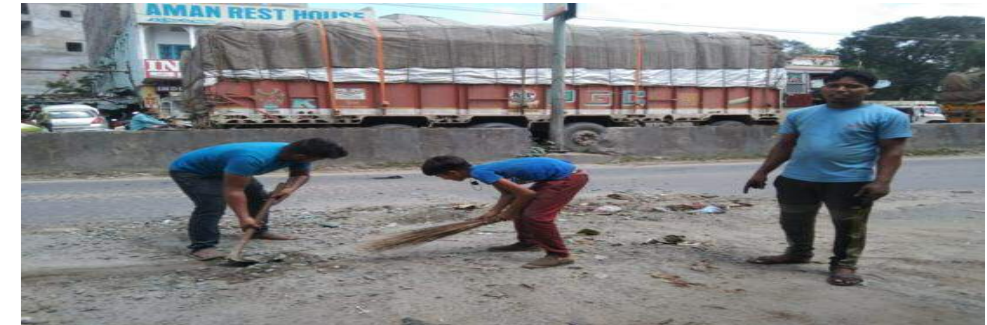
सड़क का गड्ढा भरते दुकानदार

बरही गया रोड मे सड़कों के बीचों बीच कई गड्ढे बन गए है जिससे आवागमन मे मोटरसाइकिल व छोटे गाड़ियों को काफी असुविधा होती है तथा दुर्घटना की भी संभावना बनी रहती है। गया रोड के कुछ दुकानदारों ने इसे देखते हुए अपने दुकान के सामने बने गड्ढे को खुद से भरने का संकल्प लिया तथा श्रम दान कर गड्ढों को भरने का कार्य भी शुरू किया। उन्होंने कहा कि एनएच द्वारा केवल लीपापोती का कार्य किया जाता है। बारिश आते ही इनकी