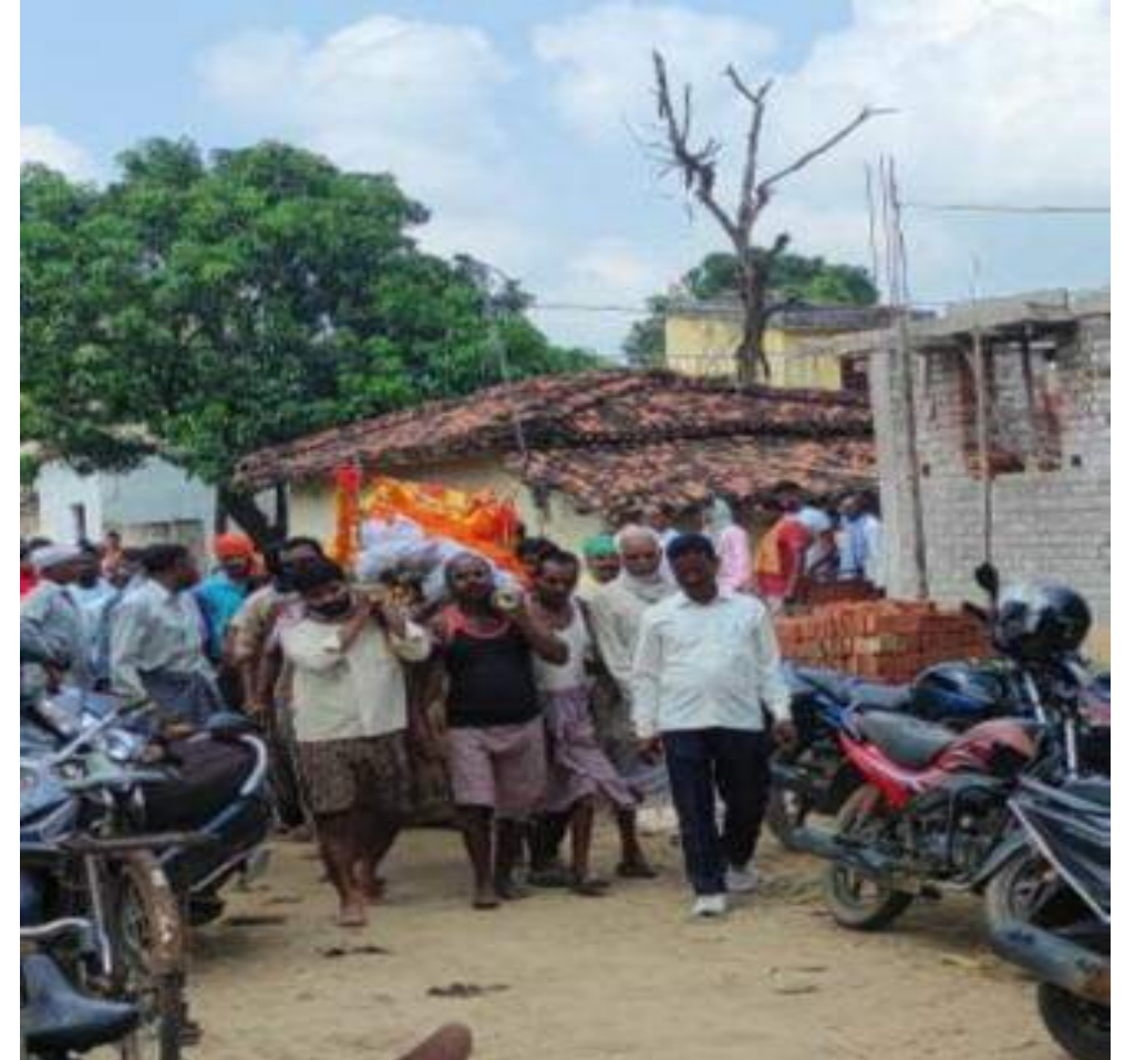
शव यात्रा में शामिल सांसद प्रतिनिधि व अन्य