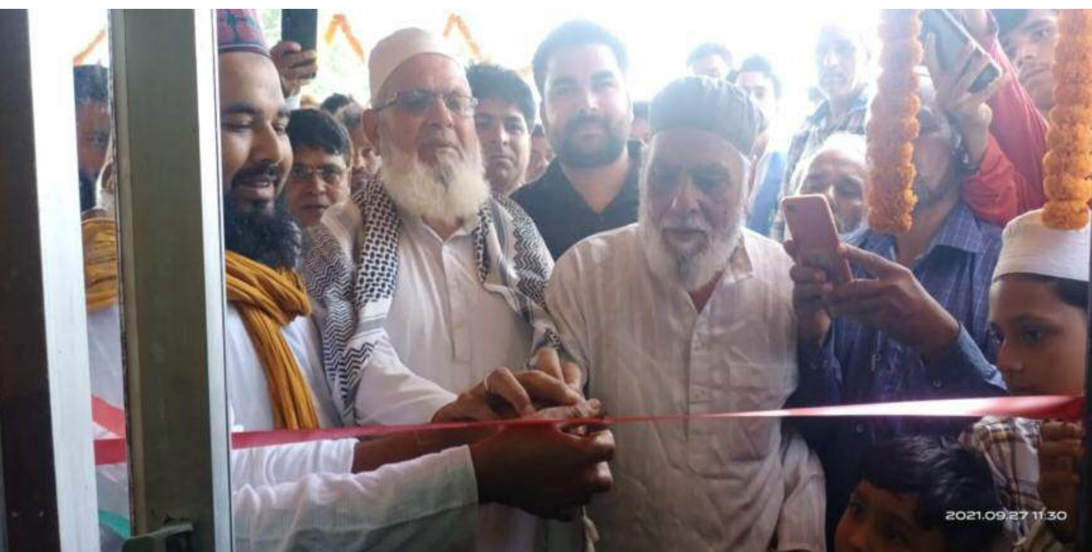
उद्घाटन करते अतिथिगण