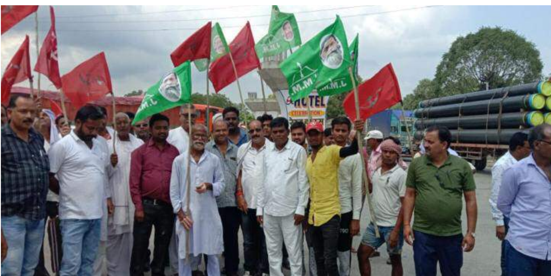
बंद कराते चौपारण के विपक्षी पार्टियां

देश में दस महीने से चल रहा किसान आंदोलन से संयुक्त मोर्चा के तत्वाधान में देश व्यापी हड़ताल से चौपारण में बंद का पड़ा असर कांग्रेस, जेएमएम, लेफ्ट की पार्टियों ने केंद्र सरकार द्वारा तीन कृषि कानून लागू करने के विरोध में 27 सितंबर को देश व्यापी हड़ताल से चौपारण में भी बंद का असर रही। इससे पहले