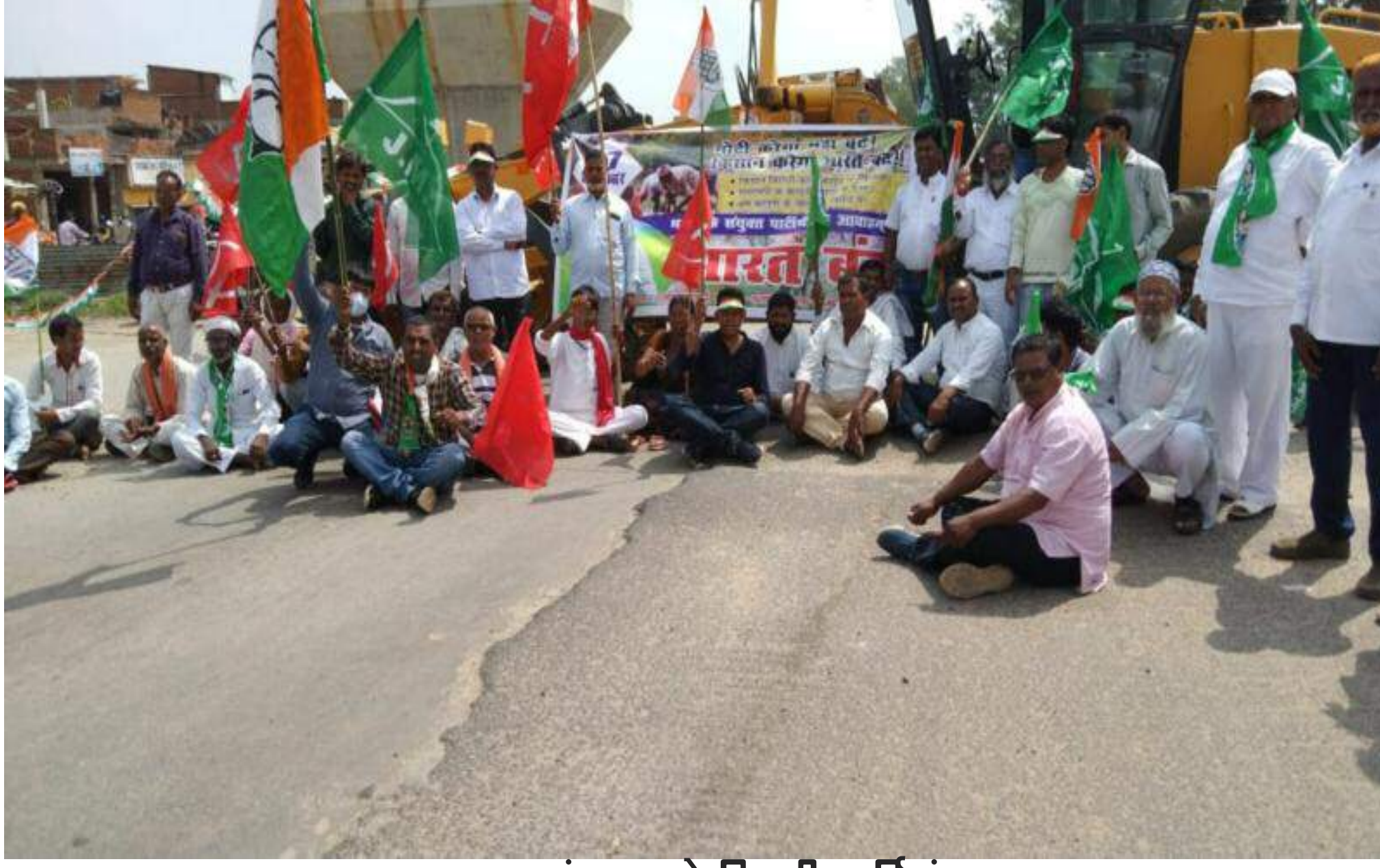
भारत बंद कराते विपक्षी पार्टियां

बरकट्टा प्रखंड मुख्यालय के समीप जीटीरोड में विपक्षी दलों के कार्यकर्ताओं ने मांगों को लेकर घंटो सड़क जाम किया। किसानों के समर्थन में भारत बंद को लेकर झाम. मो. कांग्रेस, भाकपा माले, राजद के नेता बरकट्टा स्थित जीटी रोड पर उतरकर सड़क जाम किया। मौके पर उन्होंने कहा की कृषि कानून के विरोध में किसानों के अह्वान के साथ बरकट्टा में महागठबंधन खड़ा है। इस दौरान पुलिस ने जाम कर रहे लोगों को पुलिस ने गिरफ्तार कर रिहा कर दिया। सभी पार्टियों ने एक संयुक्त प्रेस विज्ञप्ति जारी कर कहा कि देश में मोदी सरकार किसानों के खिलाफ कृषि काला कानून लाकर किसानों के साथ अन्याय कर रही है। अंबानी अडानी के हाथों किसानों को गुलाम बनाने की साजिश रच रही है। अभी 10 महीनों से किसान धरने पर बैठे हैं 700 किसान शहीद हो चुके हैं और मोदी सरकार चुपचाप बैठी हुई है और नए श्रम कानून लाकर मजदूर वर्ग को गुलाम बनाकर कॉरपोरेटों के हाथ मजबूत कर रही है। दो करोड़ रोजगार देने की बात कहकर सत्ता में आए लेकिन सभी सरकारी संपत्तियों को निजी करण कर उल्टी नौकरियां