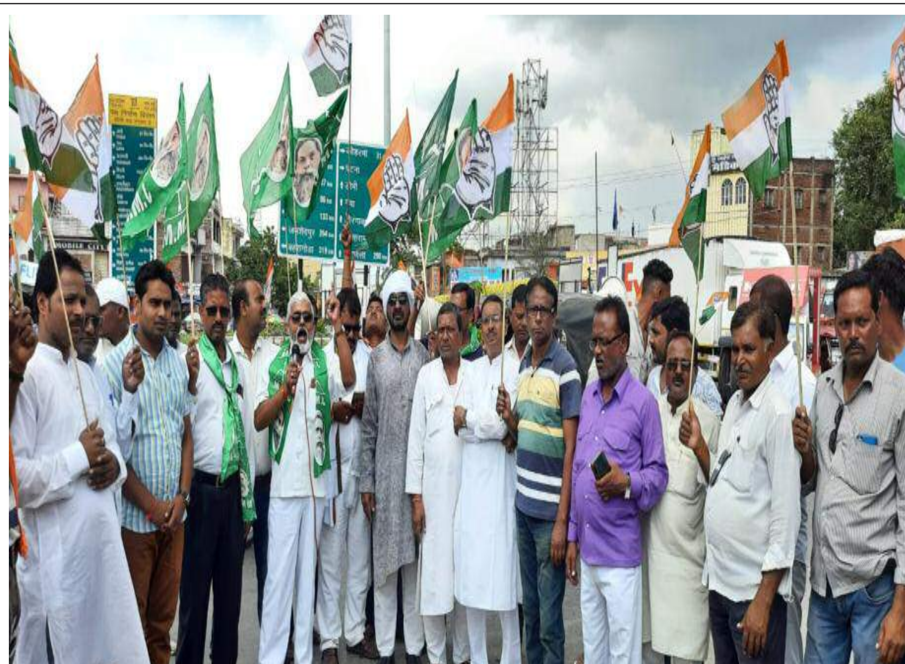
बरही चौक जाम करते विपक्षी पार्टी के लोग

केंद्र सरकार तीनो कृषि कानून को रद्द करने, बढ़ती महंगाई एवं मोदी सरकार की तानाशाही रचैया के खिलाफ भारतीय संयुक्त किसान मोर्चा एवं विपक्षी दलों के द्वारा बुलाई गई भारत बंद का व्यापक असर बरही चौक पर दिखा। सुबह 10 बजे काँग्रेस, झामुमो एवं भाकपा माले का कार्यकर्ता बरही चौक पर पहुंचे एवं बरही चौक जाम कर दिए। जाम के वजह गया रोड, धनबाद रोड, हजारीबाग रोड एवं तिलैया रोड में लगभग 2 से 3 किमी तक लंबी जाम लग गई। जिसके वजह से राहगीरों को काफी परेशानी हुई। लंबी दूरी की यात्री वाहन नहीं चले। हालांकि बरही के चारो मार्गों में संचालित दुकान एवं प्रतिष्ठान खुले रहे। जाम के साथ बरही चौक पर नुककड़ सभा का आयोजन किया गया। जिसमें अध्यक्षता एवं संचालन काँग्रेस प्रखंड अध्यक्ष