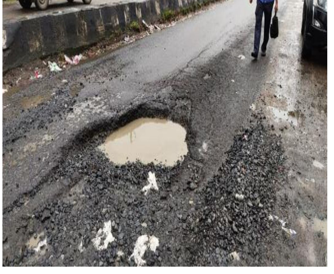
सड़क में बने गड्ढे

बरही धनबाद रोड में स्थित वैष्णवी ऑटोमोबाइल के सामने पिछले एक महीनों से रोड में बड़े बड़े गड्ढे बन गए हैं। जिससे बाइक सवार राहगीरो को