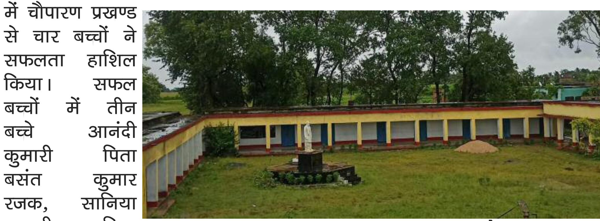
बसंत नारायण उच्च वि० चौपारण