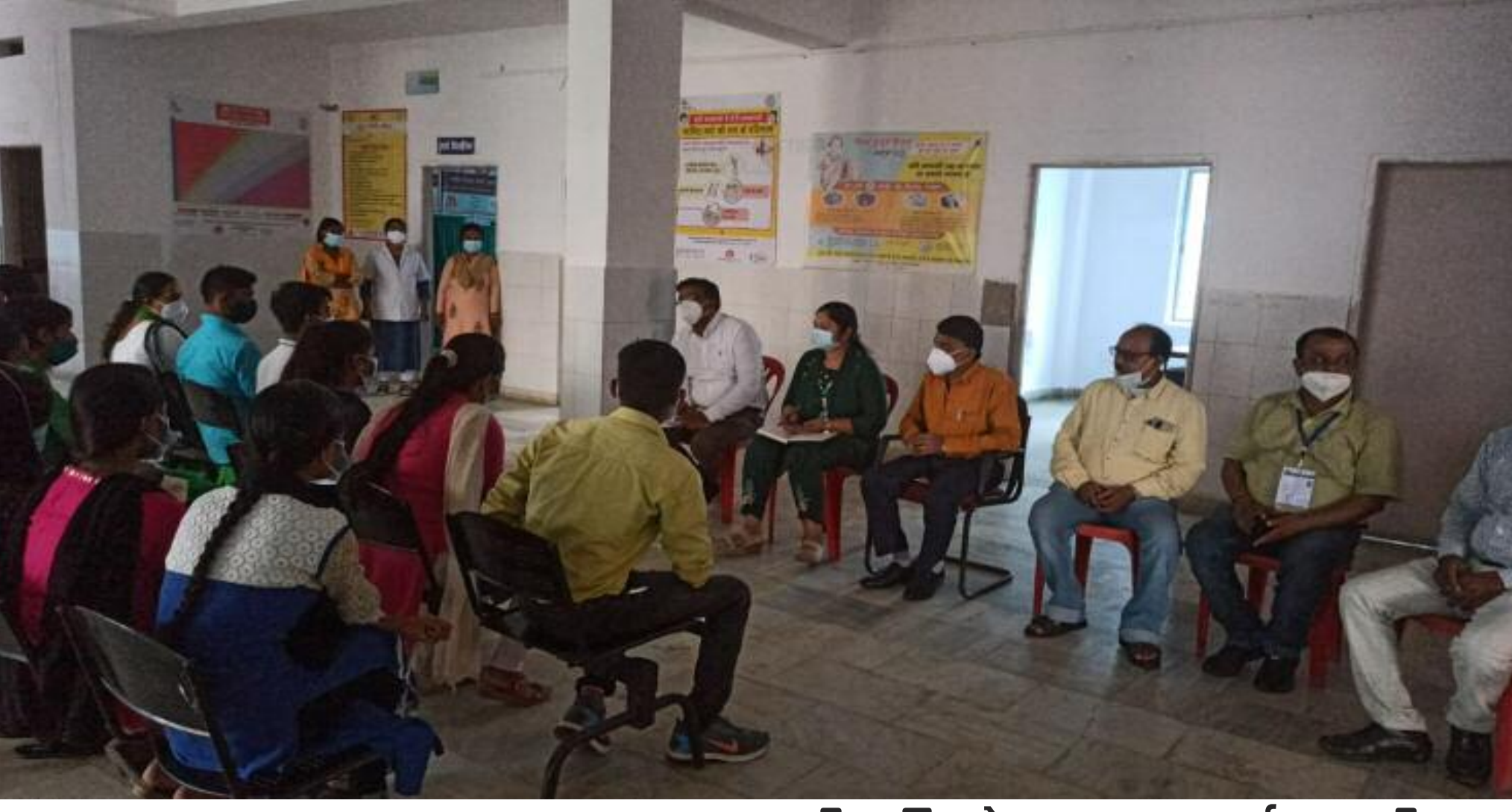
राष्ट्रीय किशोर स्वास्थ्य कार्यक्रम की जानकारी लेते केंद्रीय एवं राज्य स्तरीय टीम