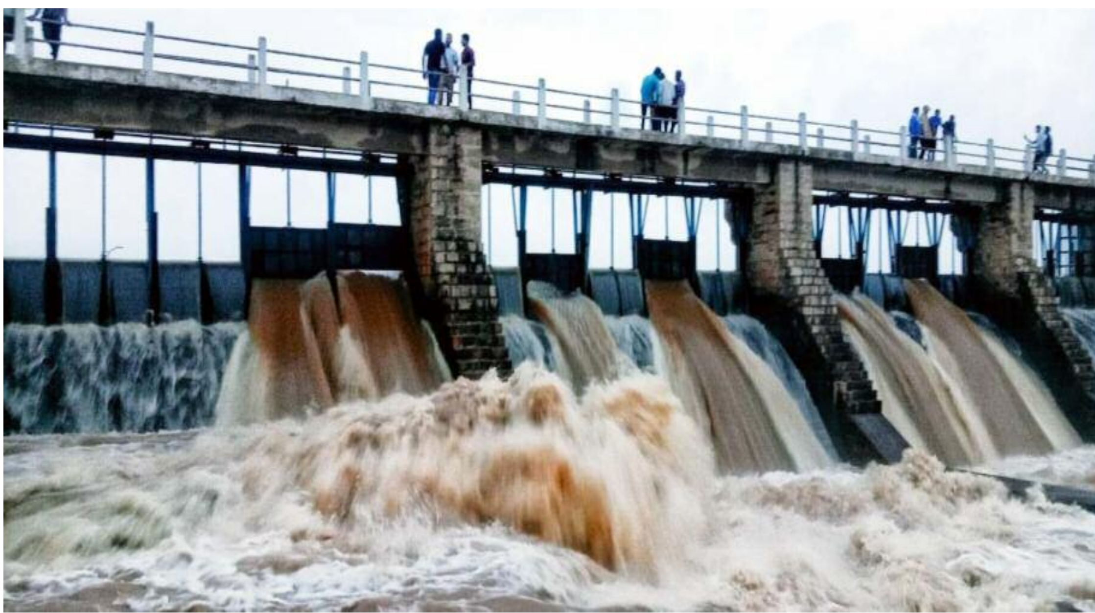
जमुनिया डैम का पाटख खुला

खबर है। इसके अलावा प्रखंड के अन्य कई गांवों में भी कच्चे घर ढहने या आंशिक क्षतिग्रस्त होने की सूचना है। इस चक्रवाती मूसलाधार बारिश के कारण घर ढहने से पीड़ित