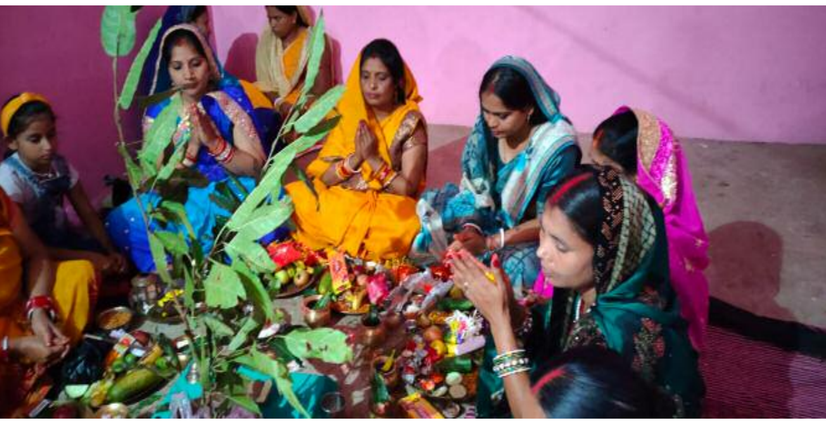
जितिया व्रत करती एनआरसी की महिलाएं

बरही में शांति सौहार्द, श्रद्धा व भक्तिभाव के साथ जितिया पर्व मनाया गया। महिलाएं अपने बच्चों की दीर्घायु एवं परिवार की सुख समृद्धि के लिए निर्जला उपवास रखकर पूरी विधि विधान के साथ पूजा अर्चना की। पूजा अर्चना का कार्य बुधवार देर रात तक चली। जितिया व्रत के पहले दिन महिलाएं सूर्योदय से पहले जागकर स्नान करके पूजा की। उसके बाद भोजन ग्रहण की। दूसरा दिन निर्जला उपवास रखी। अगले दिन सुबह सुबह स्नान के बाद पूजा अर्चना करते हुए पारण की। पारण के दिन सात तरह की सब्जियां बनाने की परंपरा का पालन करते नजर आईं। पंडित सुरेश