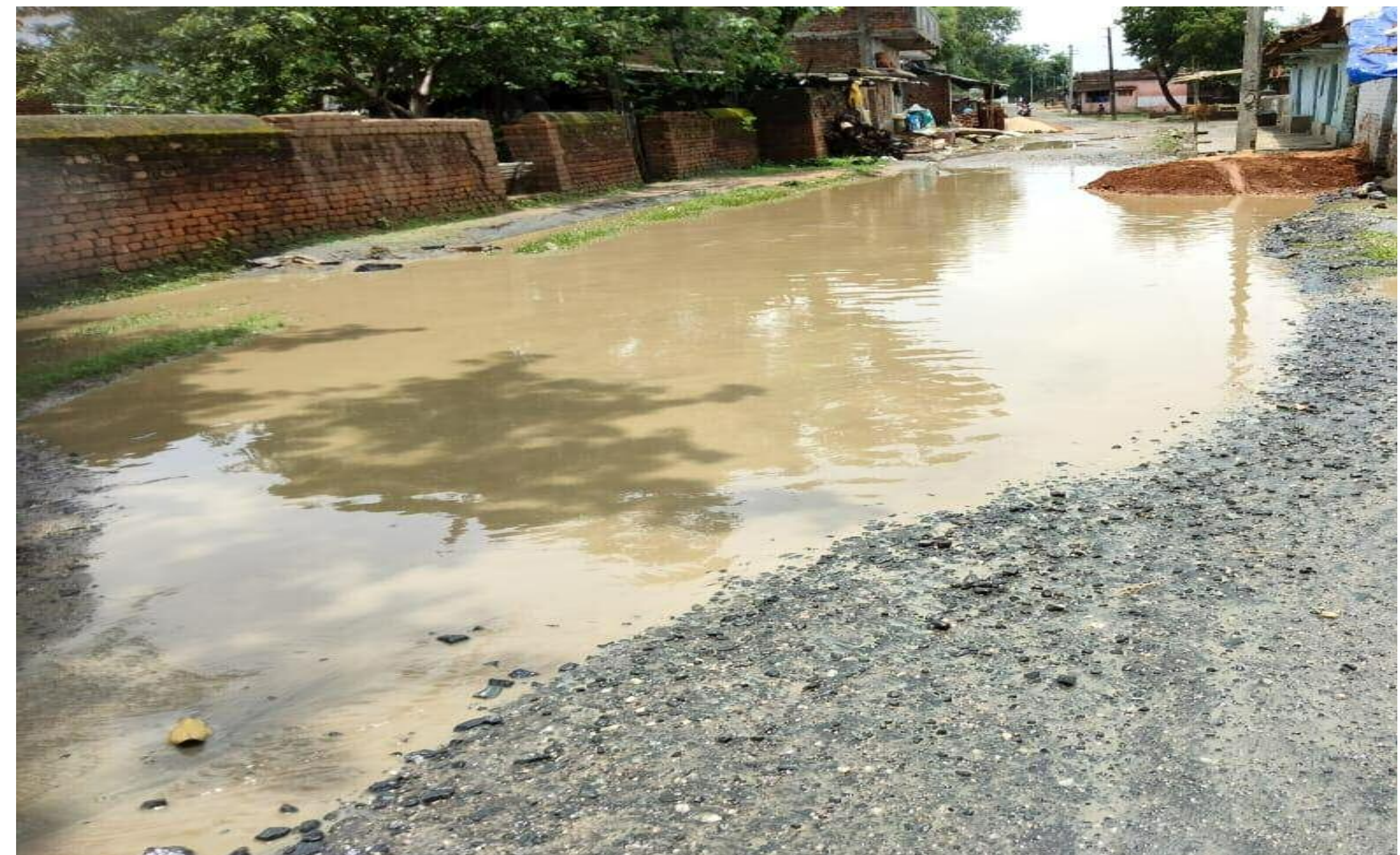
टाटीझरिया लाइन होटल से डहरभंगा रोड की जर्जर स्थिति

टाटीझरिया लाईन होटल से छोटा डहरभंगा तक की लगभग दो किलोमीटर मुख्य सड़क की स्थिति बंद से बदतर हो चुकी है। स्थिति ऐसी हो चुकी है कि अब रिश्तेदार भी आने में आनाकानी करने लगे हैं। यहां के ग्रामीण बरसात आते ही नारकीय जीवन जीने को मजबूर हो जाते हैं। निकासी की व्यवस्था नहीं होने से बरसाती पानी सड़क में जमा हो जाता है। लगातार बारिश के बाद स्थिति भयावह हो गई है। यदि आप इस रास्ते से सफर करते हैं तो आपको एक तालाब होकर गुजरना होगा। माफ कीजिये यहां तालाब लिखना मजबूरी भी हो गया है। आप दूर से ही इसे देखकर यही कहेंगे। यहां सड़क पर लगभग 100 फीट लंबाई तक सड़क पर तालाब-सा दृश्य दिख जाएगा। इसके मरम्मत के लिए ग्रामीणों ने सैकड़ों बार जनप्रतिनिधियों व प्रशासनिक पदा.