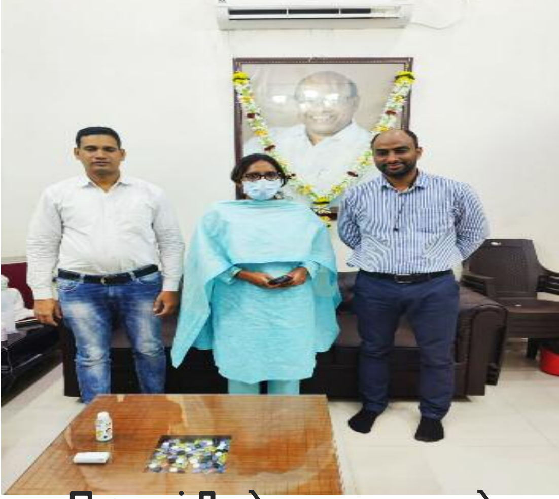
शिक्षा मंत्री से मुलाकात करते