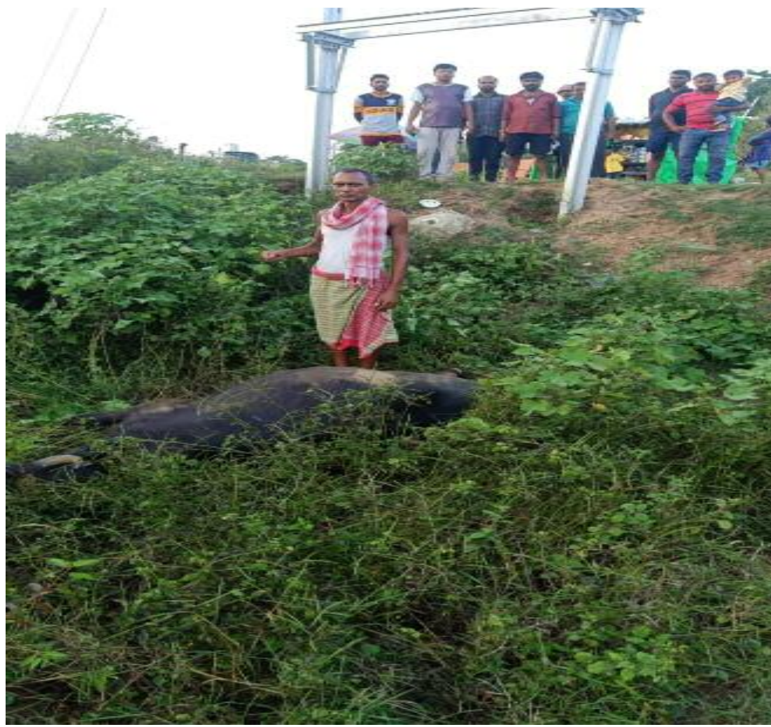
मृत पडा पशु