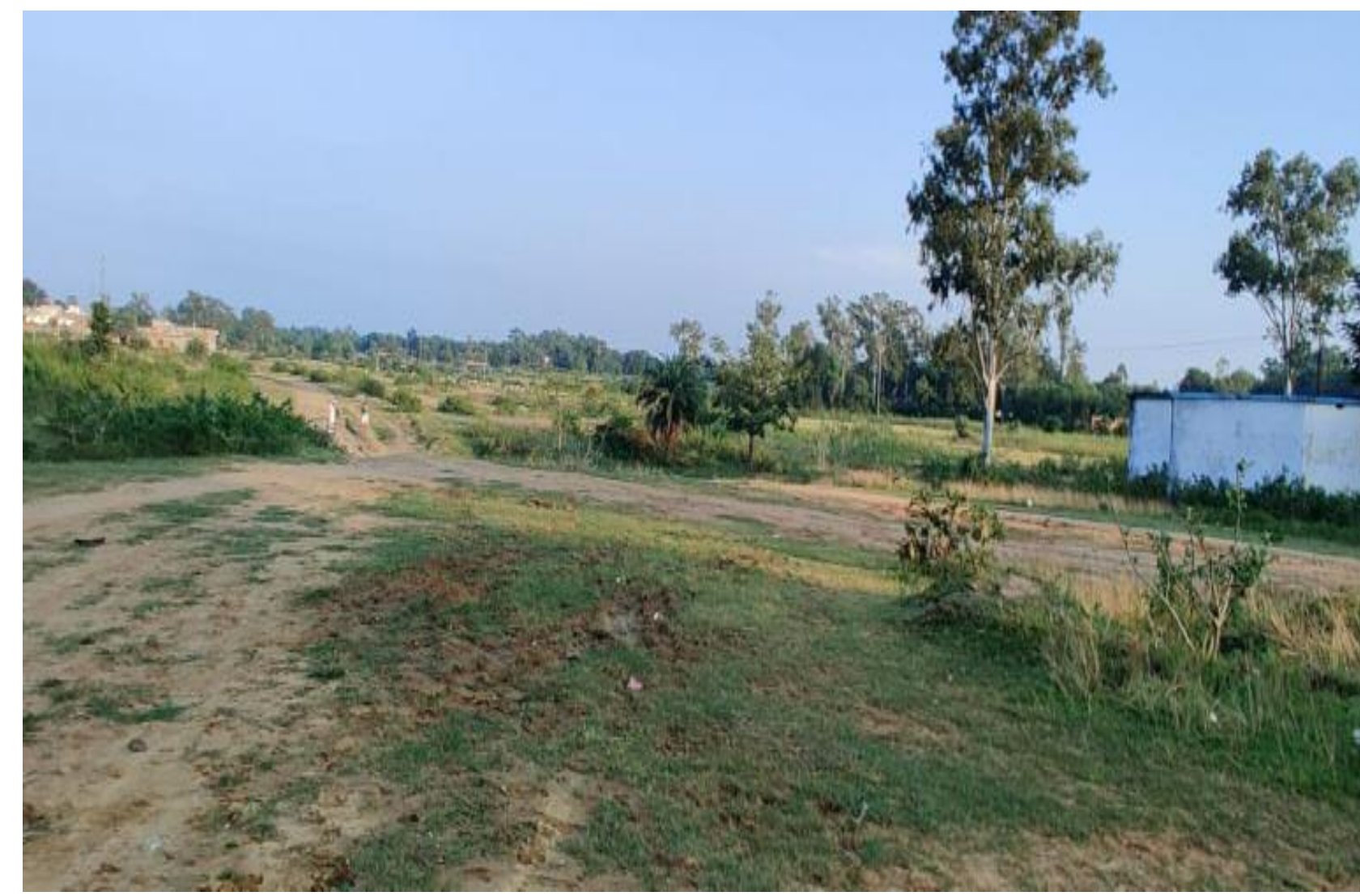
बरही इंटर कॉलेज की खाली पड़ी जमीन, इसी पर है नजर