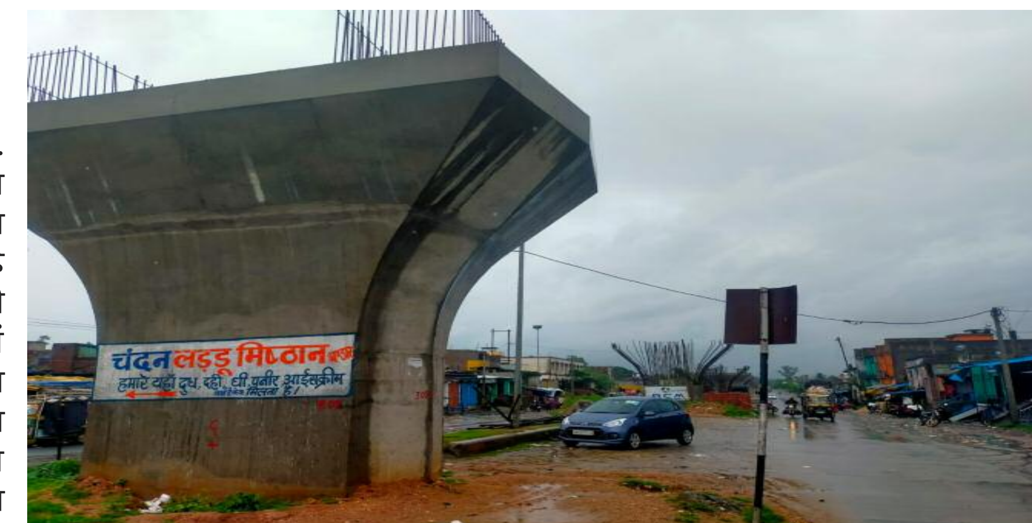
निर्माणाधीन एनएच 2 सड़क कार्य

बरकट्टा एनएच 2 सिक्सलेनिंग फ्ला. ईओवर निर्माण से प्रभावित रैयतों को अब तक एनएचएआई द्वारा मुआवजा देने को लेकर अनिश्चितता बरकरार है ज्ञात हो इसी मुआवजा वितरण की समस्या को लेकर बरकट्टा अंचल में 28 सितम्बर व 1 अक्टूबर को भूअर्जन विभाग का शिविर का आयोजन किया गया लेकिन बरकट्टा बाजार में बसे केशरहिन्द प्रभावित परिवारों का दुख दर्द की चर्चा तक नहीं हुई मुआवजा देने की बात तो बहुत दूर है बरकट्टा एनएच 2 को सिक्सलेनिंग फ्लाईओवर निर्माण में बड़ी संख्या में बरकट्टा के रैयतों ने अपना दुकान मकान को पुलिस प्रशासनिक दबाव में तोड़ दिया गया मुआवजा के नाम पर आज तक एक फूटी कौड़ी नहीं मिली मिला तो सिर्फ आश्वासन कुल मिलाकर कहा जाए तो बरकट्टा के रैयतों को सिर्फ एनएचएआई व अधिकारियों द्वारा सिर्फ बेवकूफ व अंधेरे में रखकर काम किया गया आज हालात यह है कि रैयत मुआवजा की मांग के लिए किस अधिकारी से करे समझ में नहीं आता है ध्यान रहे वर्ष 2018 में मुआवजा की बात कह कर रिलायंस इंफ्रास्ट्रक्चर