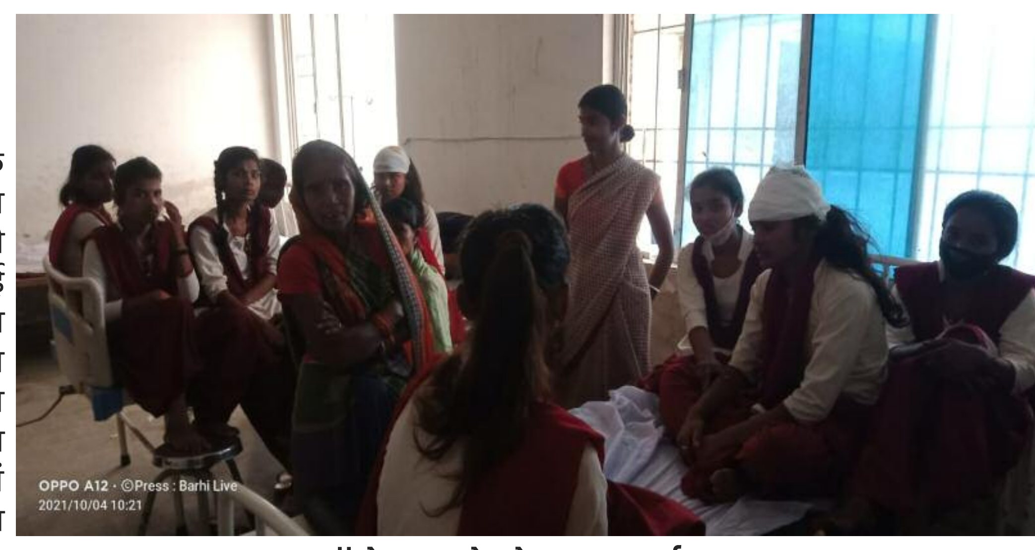
ऑटो पलटने से घायल हुई छात्रा