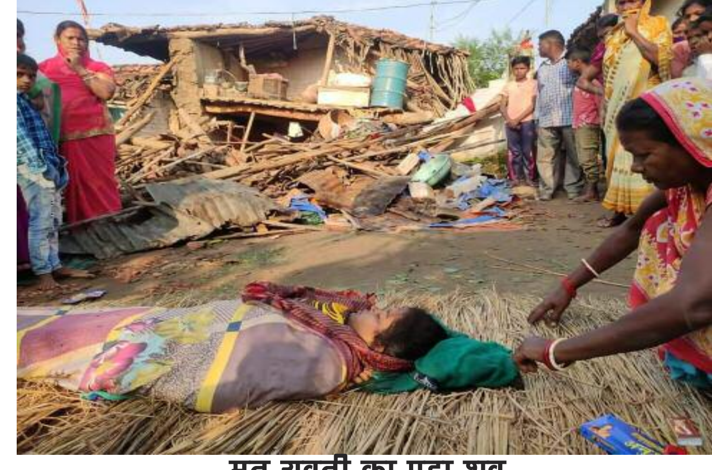
मृत युवती का पड़ा शव