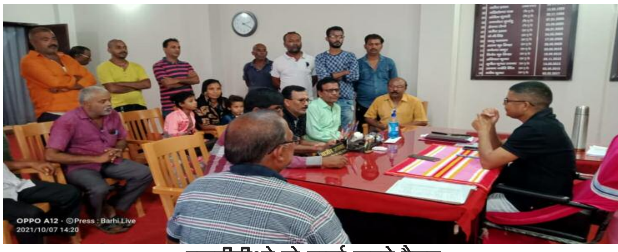
एसडीपीओ से वार्ता करते रैयत