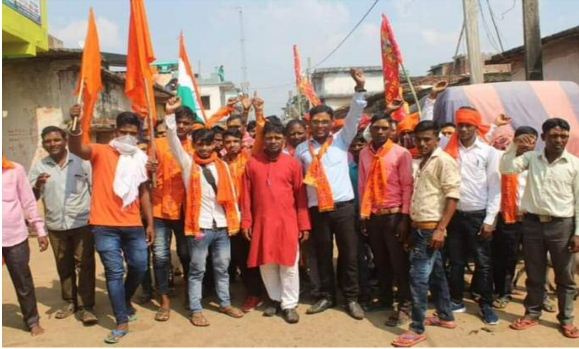
शारदीय नवरात्र की कलशयात्रा में शामिल श्रद्धालु

विष्णुगढ़ समेत आसपास के इलाकों के कई दुर्गा मंदिरों में कलश स्थापन के साथ शारदीय नवरात्र का प्रारंभ हो गया। नवरात्र के पहले दिन गुरुवार को मां शैलपुत्री की पूजा अर्चना की गई। कई श्रद्धालुओं ने अपने घरों में भी विधि विधान से घट की स्थापना कर शारदीय नवरात्र के अनुष्ठान की शुरुआत की। प्रखंड के बकसपुरा में शारदीय नवरात्र को लेकर भव्य कलशयात्रा निकाली गई। गांव के देवी मंडप से कलश यात्रा का शुभारंभ किया गया। गाजे-बाजे के साथ निकली कलशयात्रा में बड़ी संख्या में महिला पुरुष श्रद्धालु शामिल हुए। ध्वज-पताका लेकर कतारबद्ध होकर मां का जयकारा लगाते श्रद्धालु बकसपुरा, रखवा, सेहदा, टेंगरिया, करहनी खेत, डोमागढ़ा होते हुए उत्तरवाहिनी जमुनियां नदी तट पहुंचे। जहां वैदिक मंत्रोच्चार के बीच श्रद्धालुओं ने कलशपात्र में जल भरा। पुनः श्रद्धालु जल से भरा कलश उठाकर जयकारा लगाते हुए