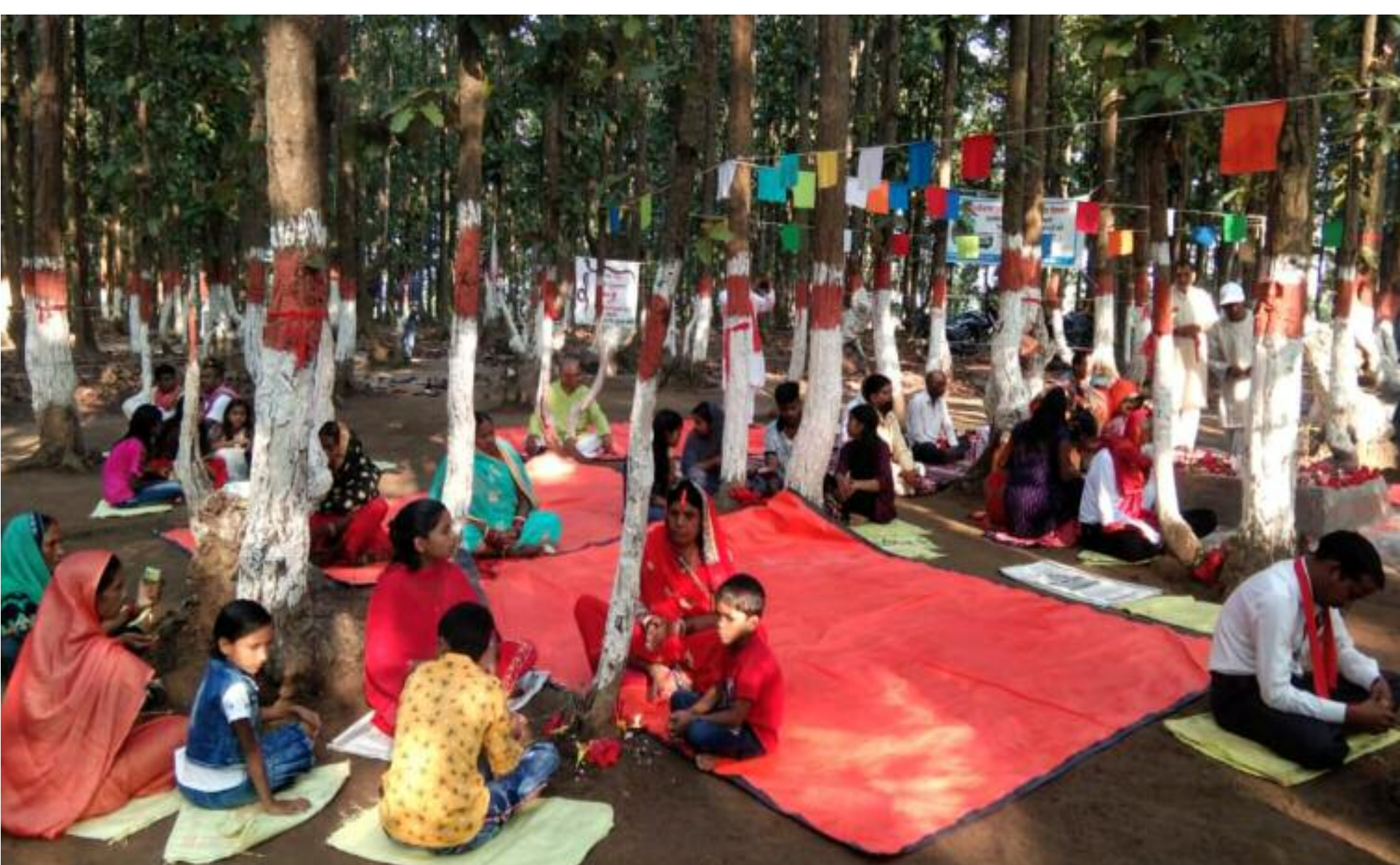
वृक्षों का पूजा करते लोग