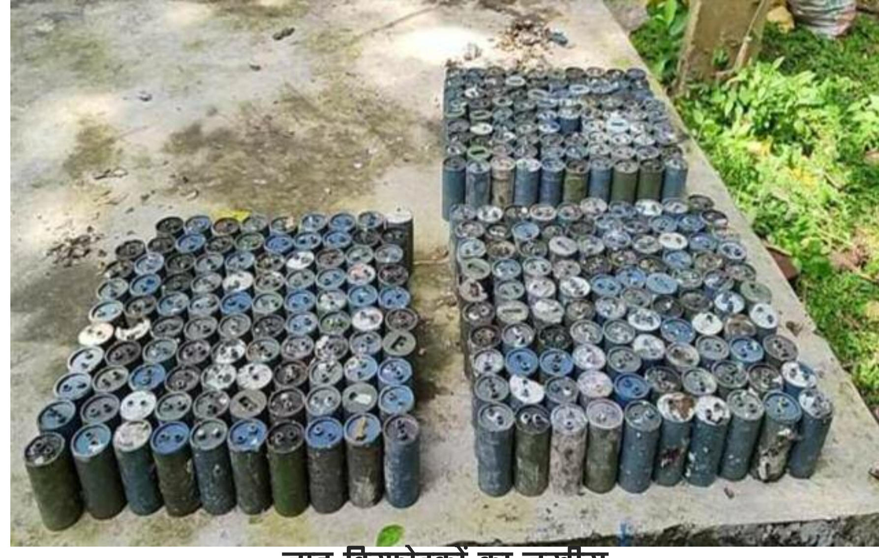
जप्त विस्फोटकों का जखीरा