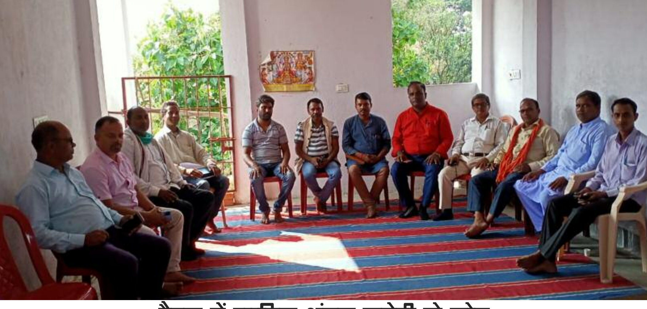
बैठक में शामिल अंचल कमेटी के लोग