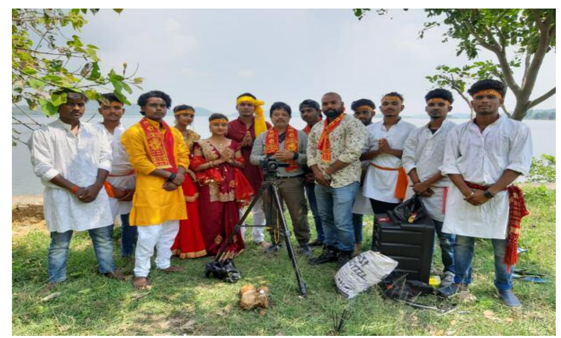
शूटिंग करते कलाकार