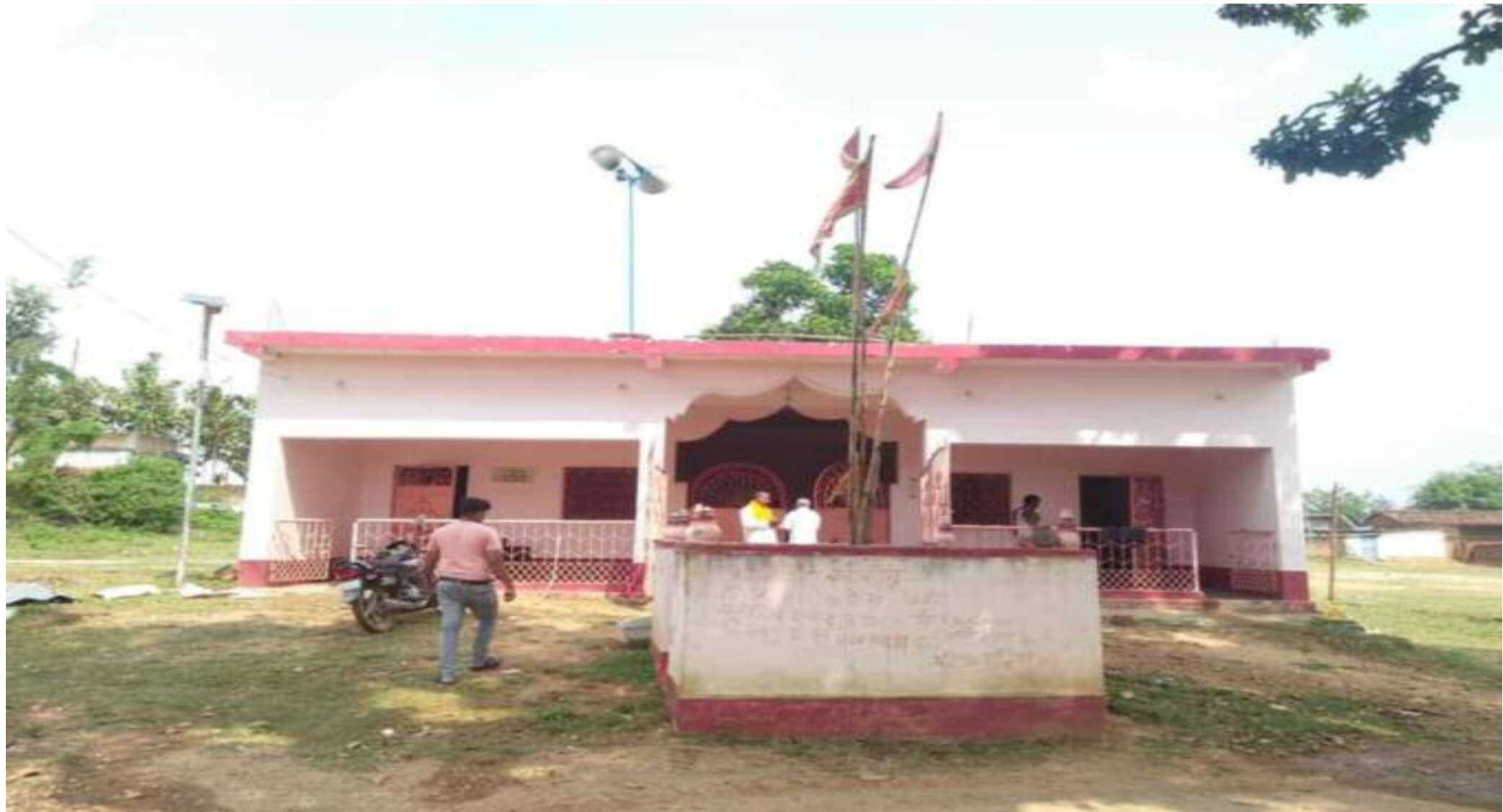
गाल्होवार शिव मंदिर