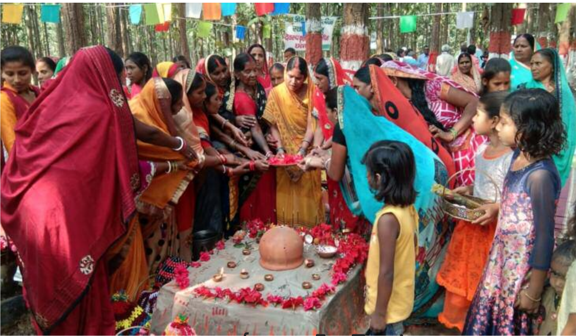
पूजा अर्चना करती महिलाएं