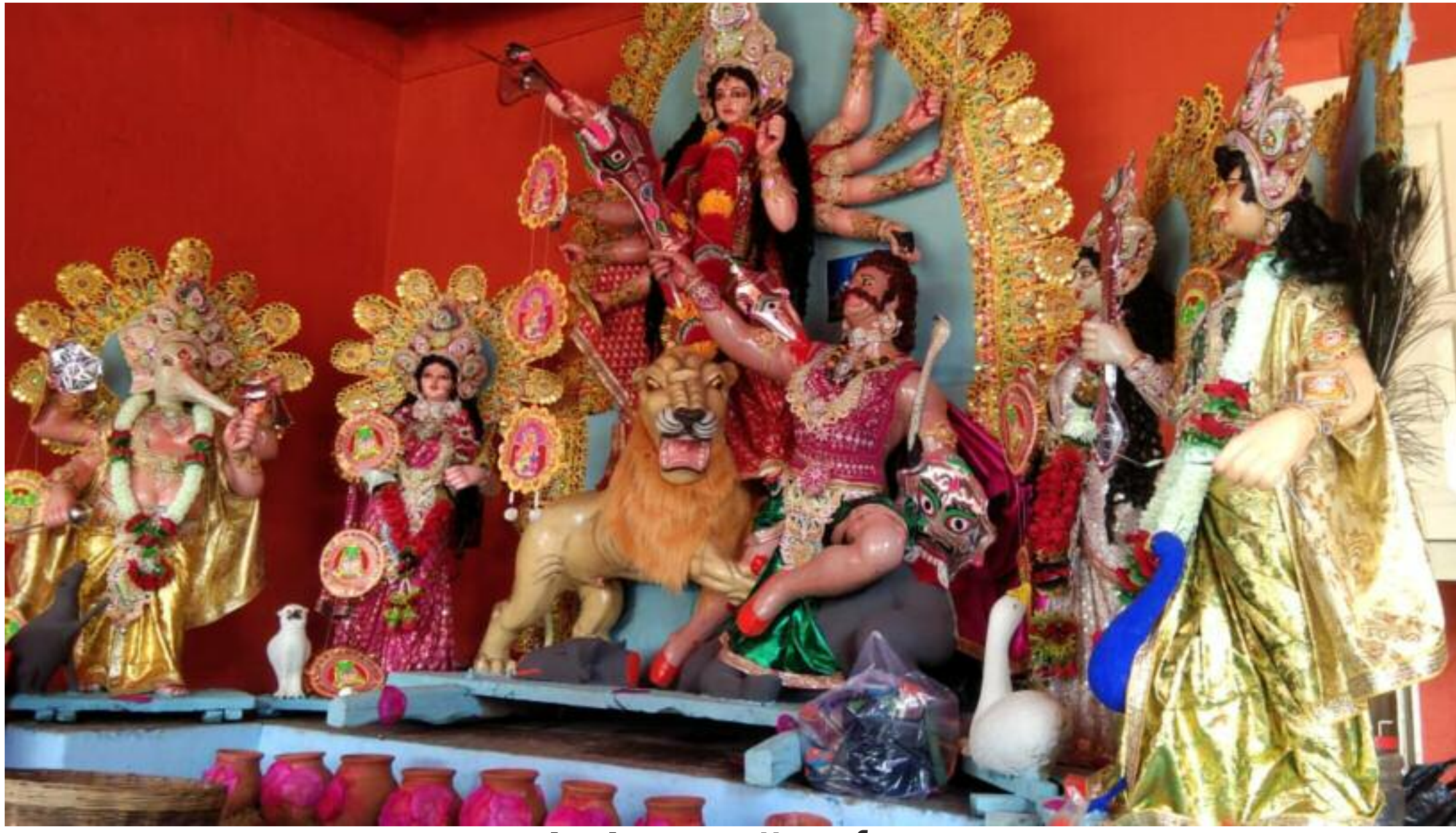
पट खुलने के बाद मां दुर्गा की प्रतिमा

टाटीझरिया प्रखंड क्षेत्र में मां दुर्गा की प्रतिमा का पट खुलते ही विभिन्न पूजा पंडालो व देवी मंडपों में मां दुर्गा के दर्शन के लिए श्रद्धालुओं की भीड़ उमड़ पड़ी। जगह-जगह पंडितों के द्वारा मंत्रोच्चार के साथ माहौल भक्तिमय हो उठा है। वहीं मां दुर्गा के जयकारों से पूजन स्थल गूंज उठे हैं। मंगलवार को मां के सातवें स्वरूप मां कालरात्रि की पूजा धूमधाम के साथ किया गया। पूजा को लेकर श्रद्धालुओं में काफी उत्साह देखा जा रहा है, टाटीझरिया के सार्वजनिक दुर्गापूजा, झरपो और कोल्हू के दुर्गा मंडप में विधिवत पूजा-अर्चना की जा रही है। पूजा के दौरान कोरोना संक्रमण से बचाव को लेकर पूरा ख्याल रखा जा रहा है। टाटीझरिया दुर्गापूजा कमेटी का दुर्गापूजा का इतिहास 40 वर्ष पुराना है। यहां 1981 से दुर्गापूजा मनाया जा रहा है। यहां की आस्था और परंपरा अटूट है। नवरात्र के दौरान यहां आस्था का सैलाब उमड़ता है। पूरा क्षेत्र भक्तिभाव में विभोर होता है। टाटीझरिया प्रखंड के डहरभंगा, बोधा, बेरहो, होलंग, धरमपुर, डुमर, बेडम, मुरुमातु, केसडा, गोधिया, घुघलिया, खंभवा, बांडीह, अमनारी, टाटी, मुरुमातु समेत अन्य