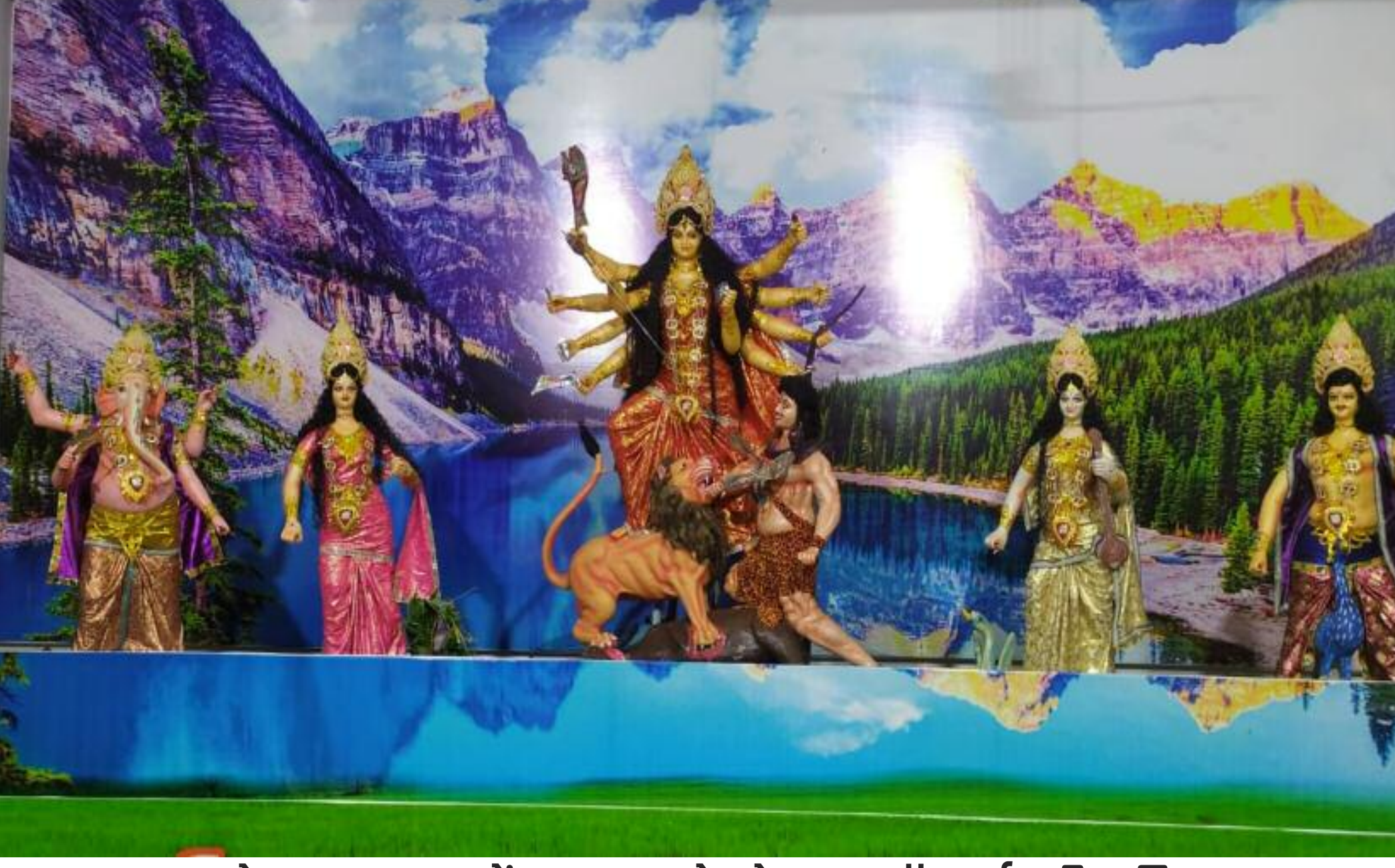
रसोइया धमना में पट खुलने के बाद मां दुर्गा की प्रतिमा

बरही में दुर्गा पूजा के अवसर पर नवरात्र के सप्तमी में विभिन्न पूजा पंडालों का पट खोल दिया गया। मां दुर्गा की प्रतिमा का पट खुलते ही विभिन्न पूजा पंडालों व देवी मंडपों में मां दुर्गा के दर्शन के लिए श्रद्धालुओं की भीड़ उमड़ पड़ी। बरही में कई पंडाल आकर्षक तौर पर लाइट सजा के साथ सजाया गया है। जगह-जगह पंडालों के द्वारा मंत्रोच्चार के साथ वातावरण भक्तिमय हो गया है। वहीं मां दुर्गा के जयकारों से पूजन स्थल गूंज उठे हैं। मंगलवार को मां के सातवें स्वरूप मां कालरात्रि की पूजा धूमधाम के साथ किया गया। पूजा को लेकर श्रद्धालुओं में काफी उत्साह देखा जा रहा है, बरही के सार्वजनिक दुर्गापूजा रसोइया धमना, करियातपुर, बरसोत