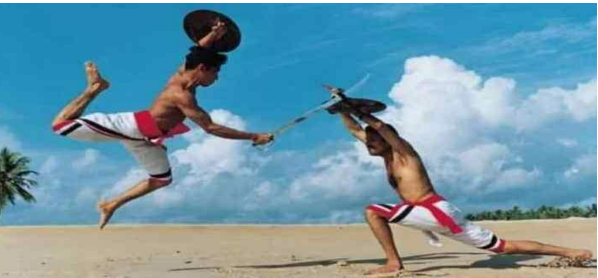
गतका खेल का एक नमूना