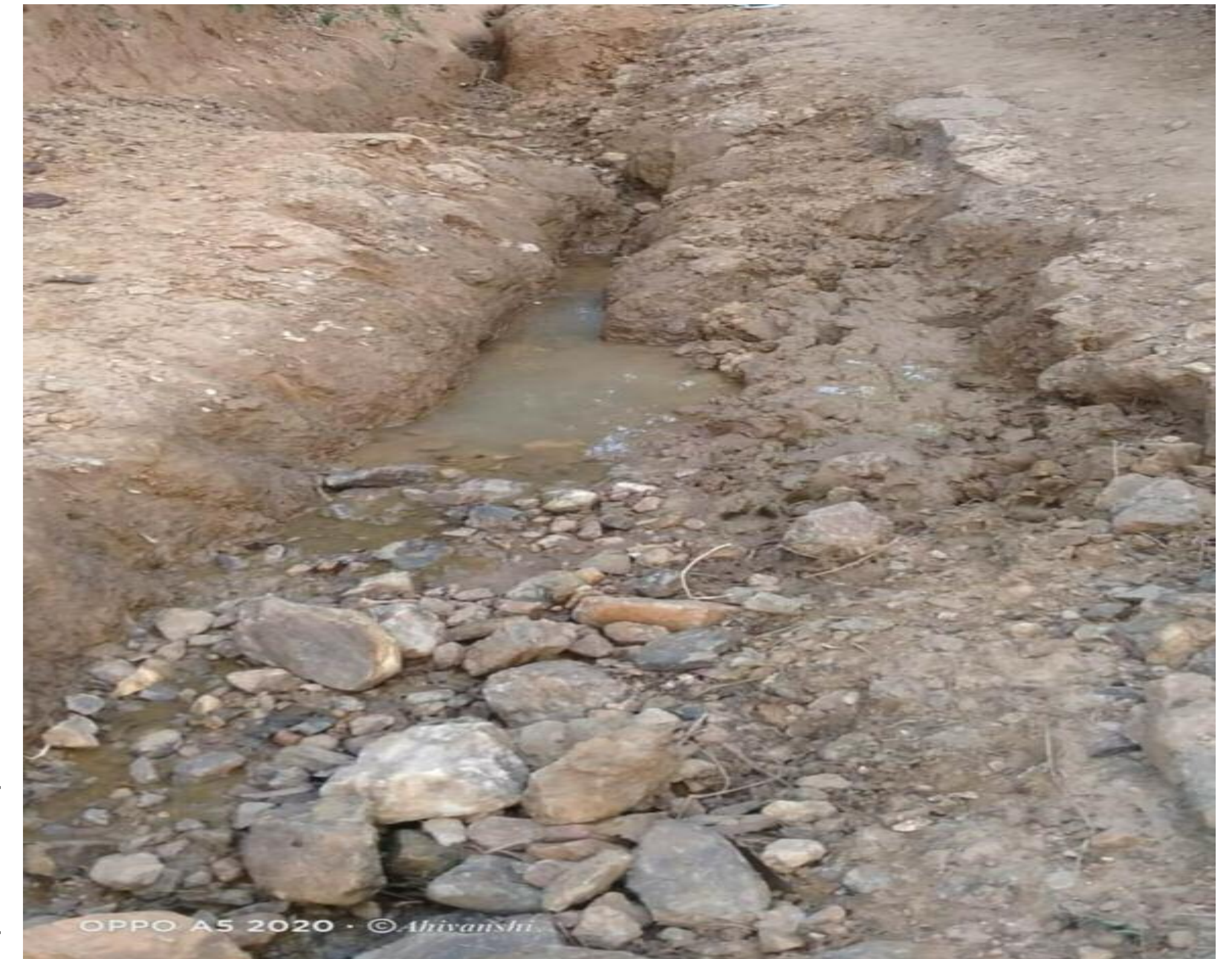
जर्जर सड़क की स्थिति