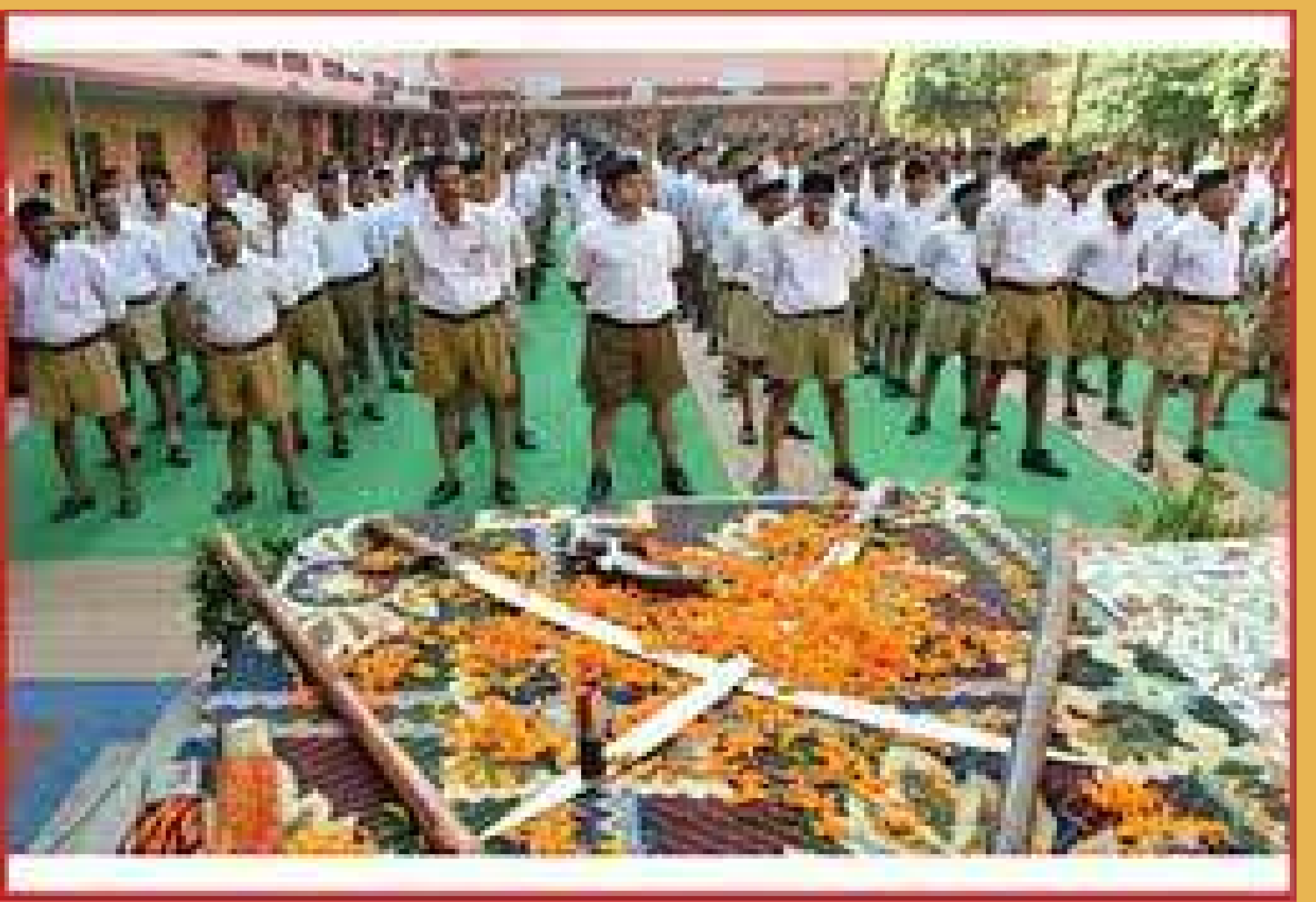
शस्त्र पूजन ( फाइल फोटो)