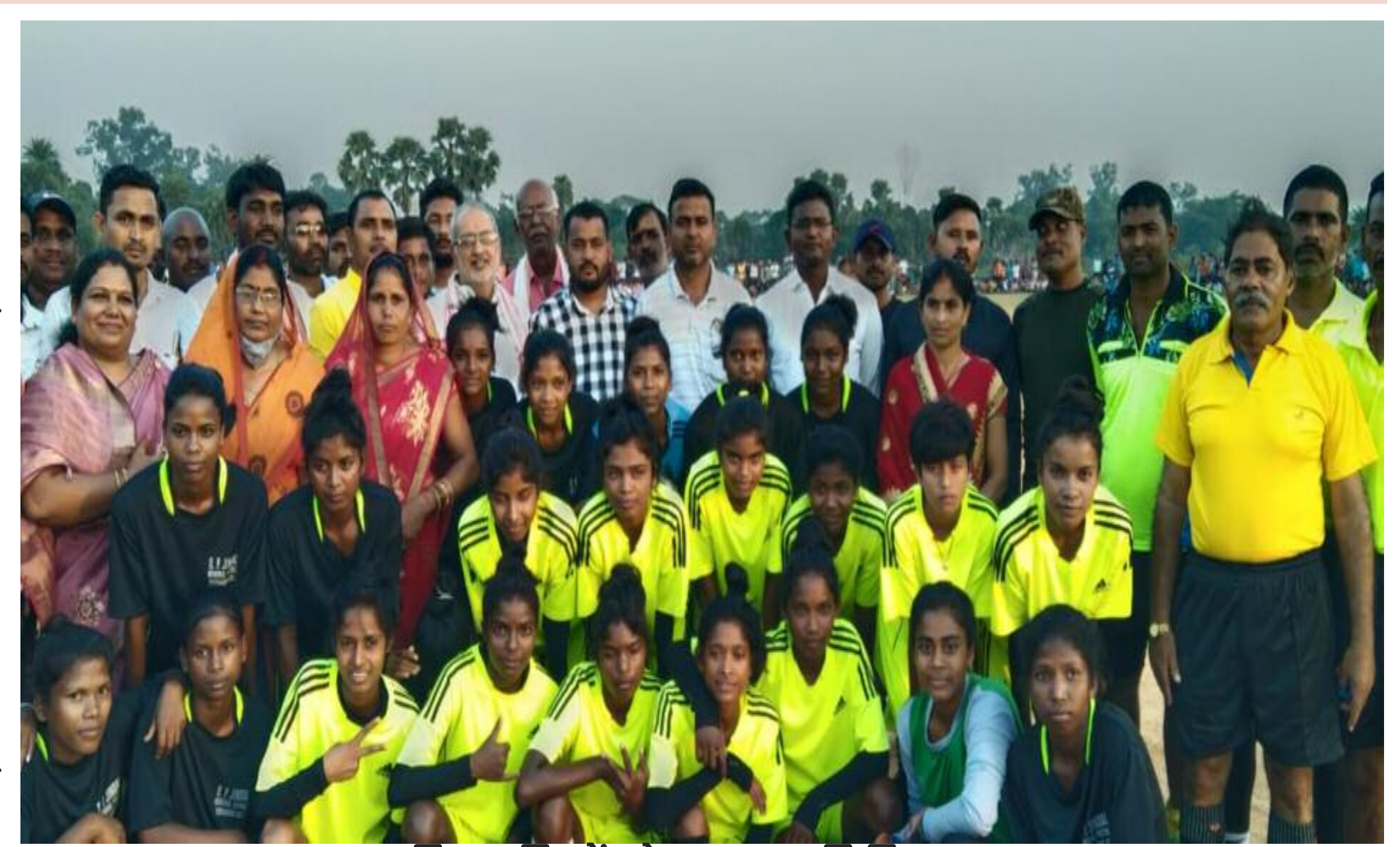
खिलाड़ियों के साथ अतिथि गण