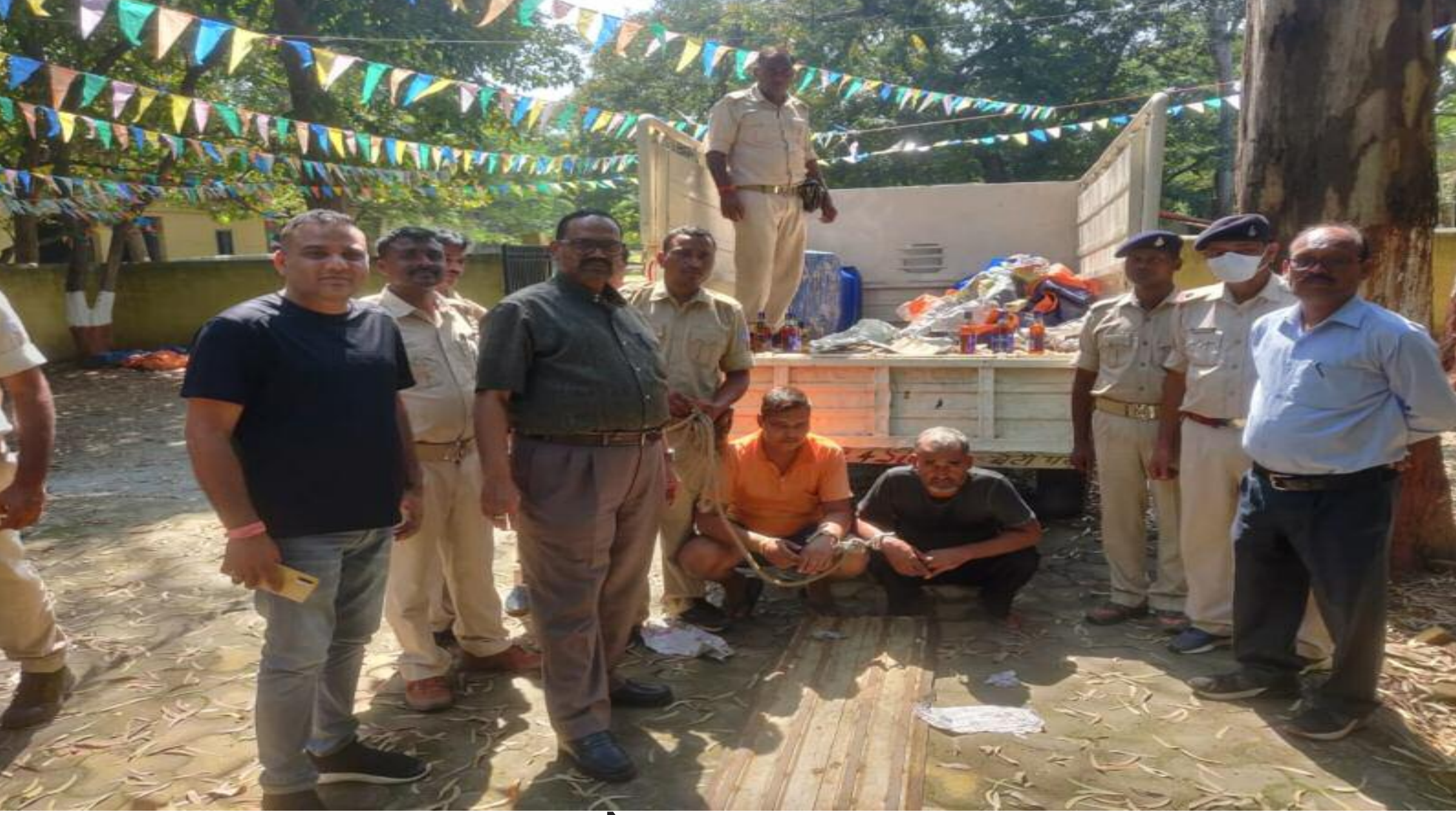
पकड़े गए शराब तस्कर