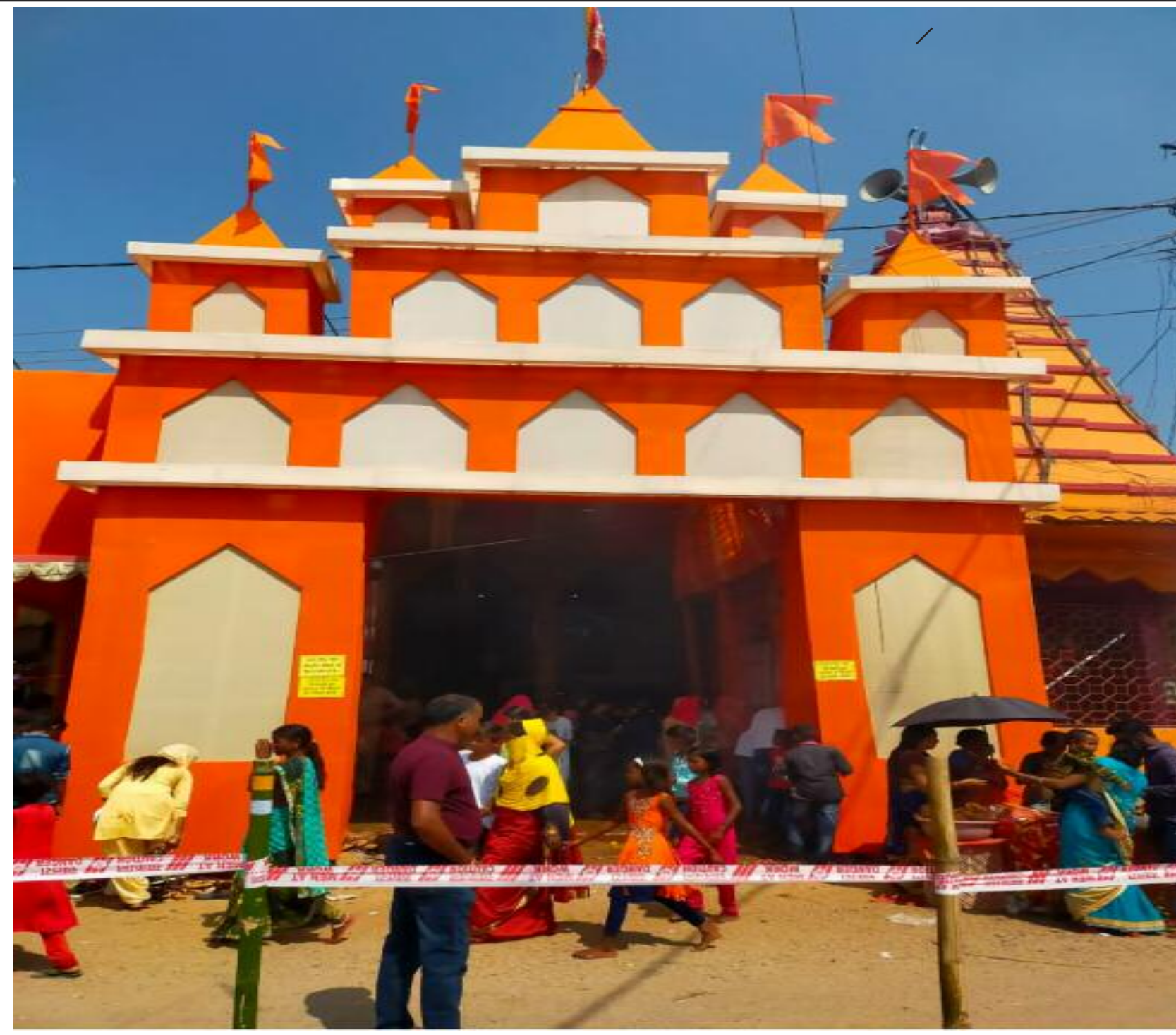
माँ दुर्गा की शोभा बढाता पूजा पंडाल