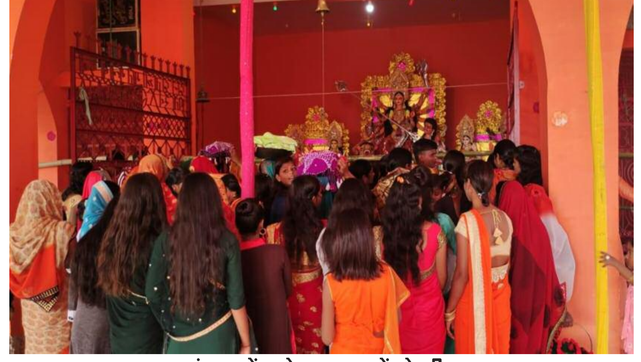
पंडाल में लगे श्रद्धालुओं के भीड़

टाटीझरिया। नवरात्र की अष्टमी को दुर्गा मंदिरों में मां दुर्गा के आठवें स्वरूप महागौरी की आराधना की गई। टाटीझरिया, झरपो और कोल्हू के पंडालों में मां का पूजन-अर्चना करने के लिए श्रद्धालु दिनभर पहुंचते रहे। पूरे दिन मंदिरों में गहमागहमी के बीच मां का जयकारा गूंजता रहा। इस बीच उपवास रखकर विधि-विधान से पूजा-अर्चना किया गया। वहीं बने दुर्गा पंडालों में मां के दर्शन के लिए ग्रामीण क्षेत्रों से भारी संख्या में लोगों के आने से देर शाम तक मेला जैसा दृश्य रहा। भक्तों के जयकारे तथा भक्तिगीतों