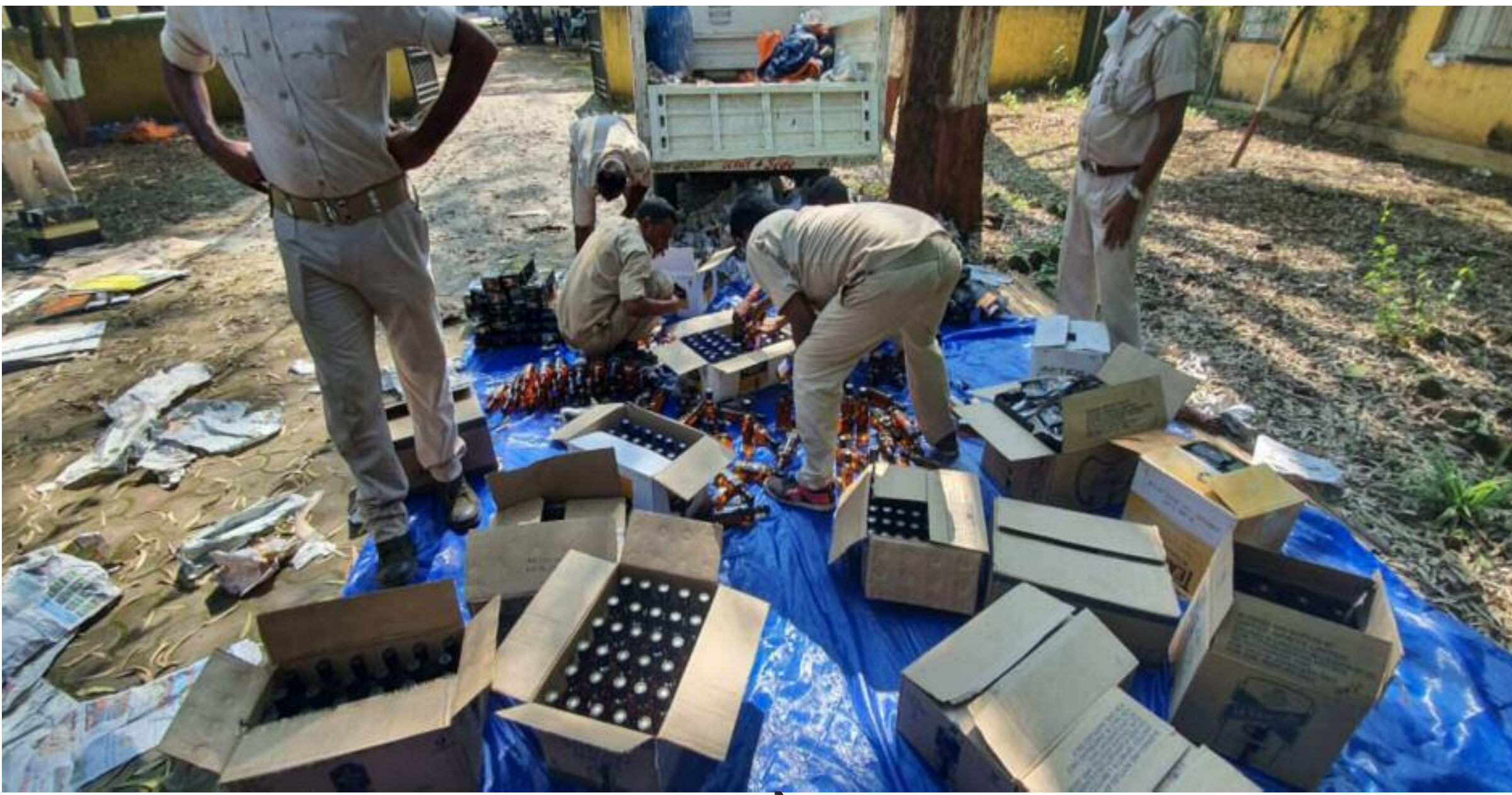
बरामद किए गए अवैध शराब व रिप्ट