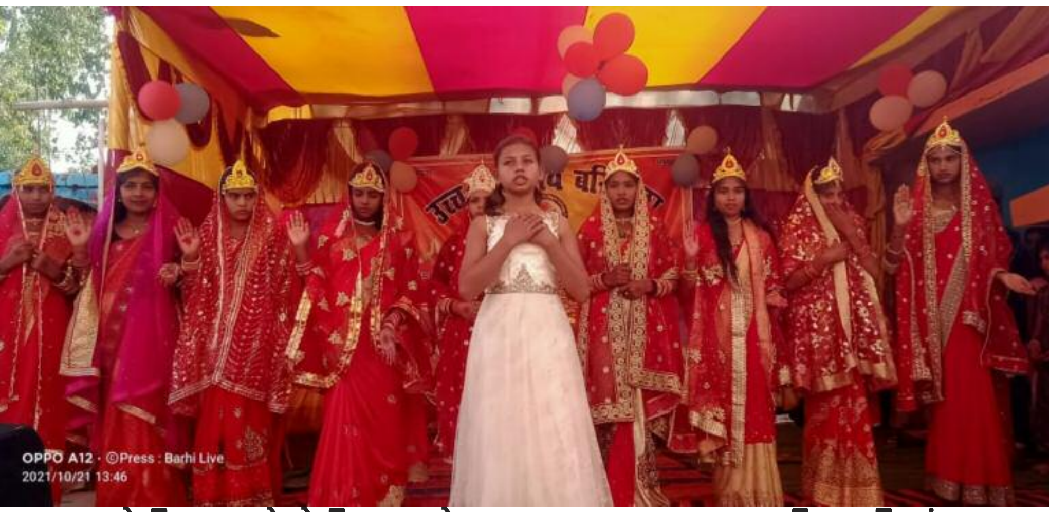
बेटी बचाओ बेटी पढ़ाओ पर नाटक प्रस्तुत करती बच्चियां