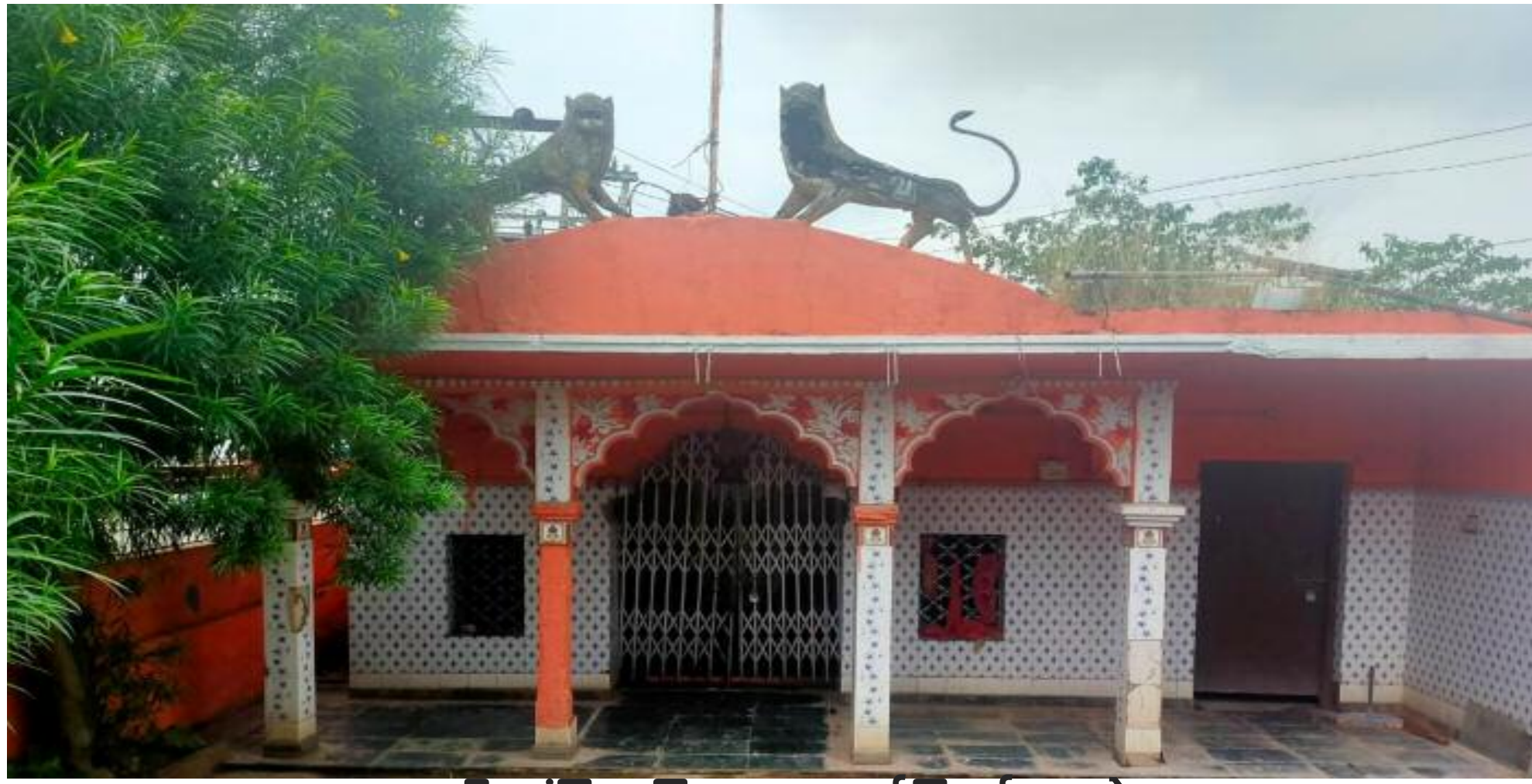
काली मंदिर जिसका पुनर्निर्माण होगा