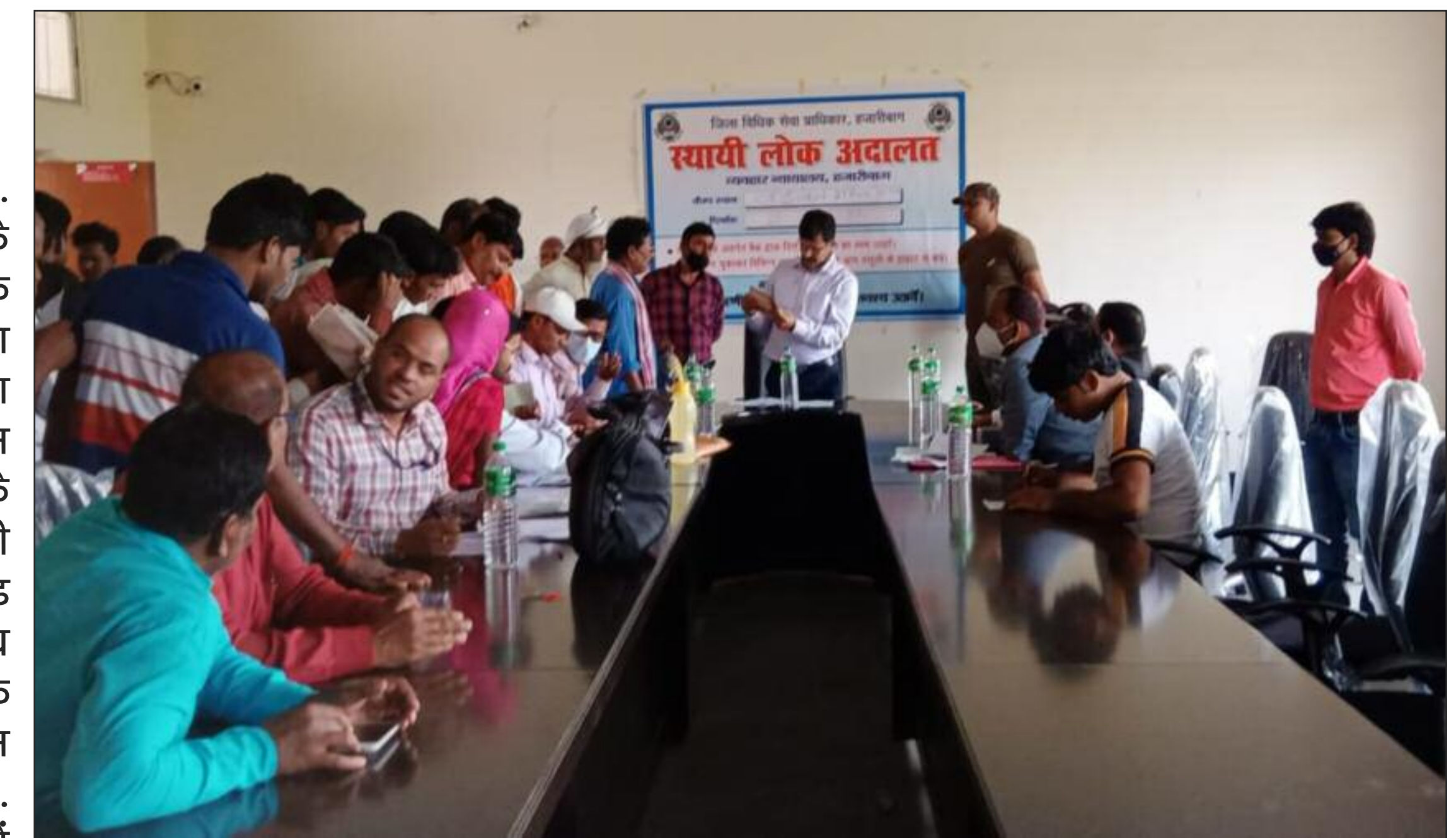
लोक अदालत में पहुंचे फरियादी