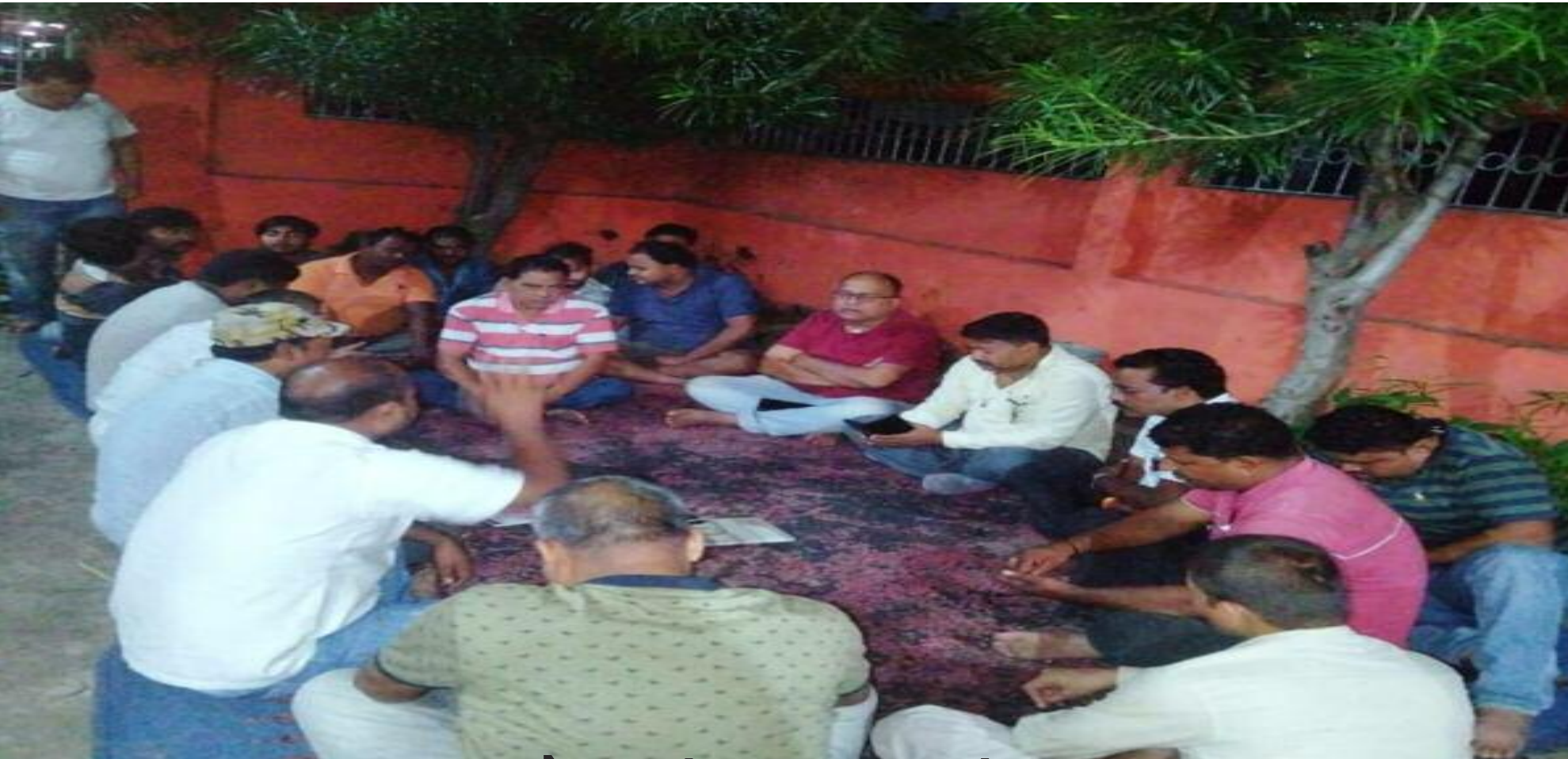
बैठक में उपस्थित लोग