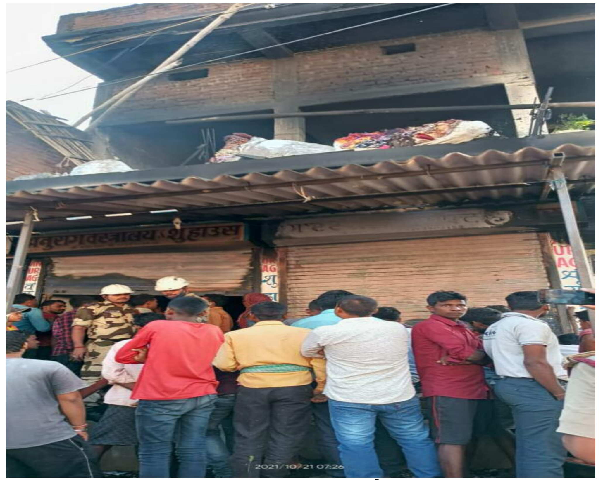
आग बुझाते दमकल कर्मी व अन्य