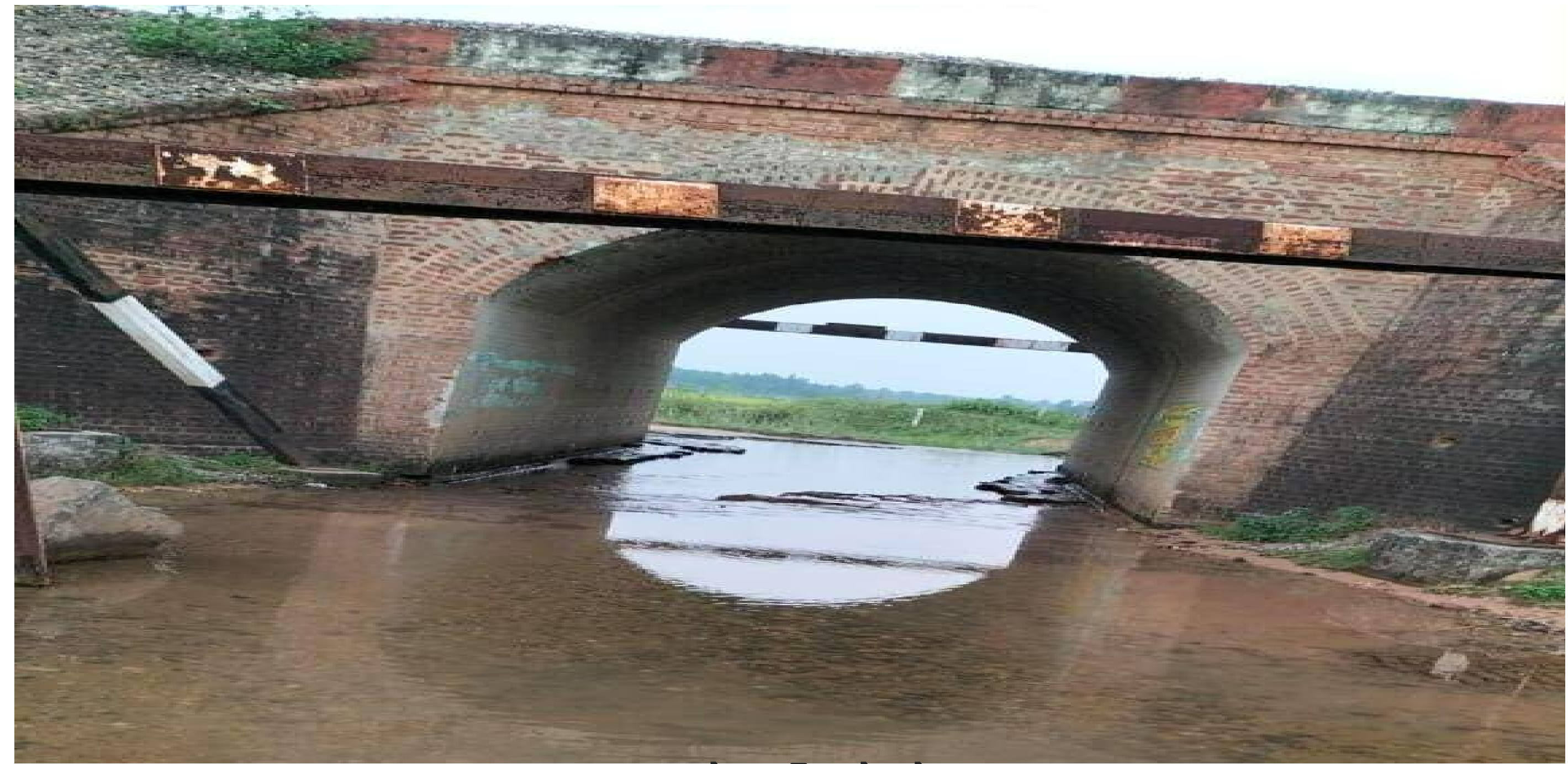
तालाब में तब्दील रेलवे पुल