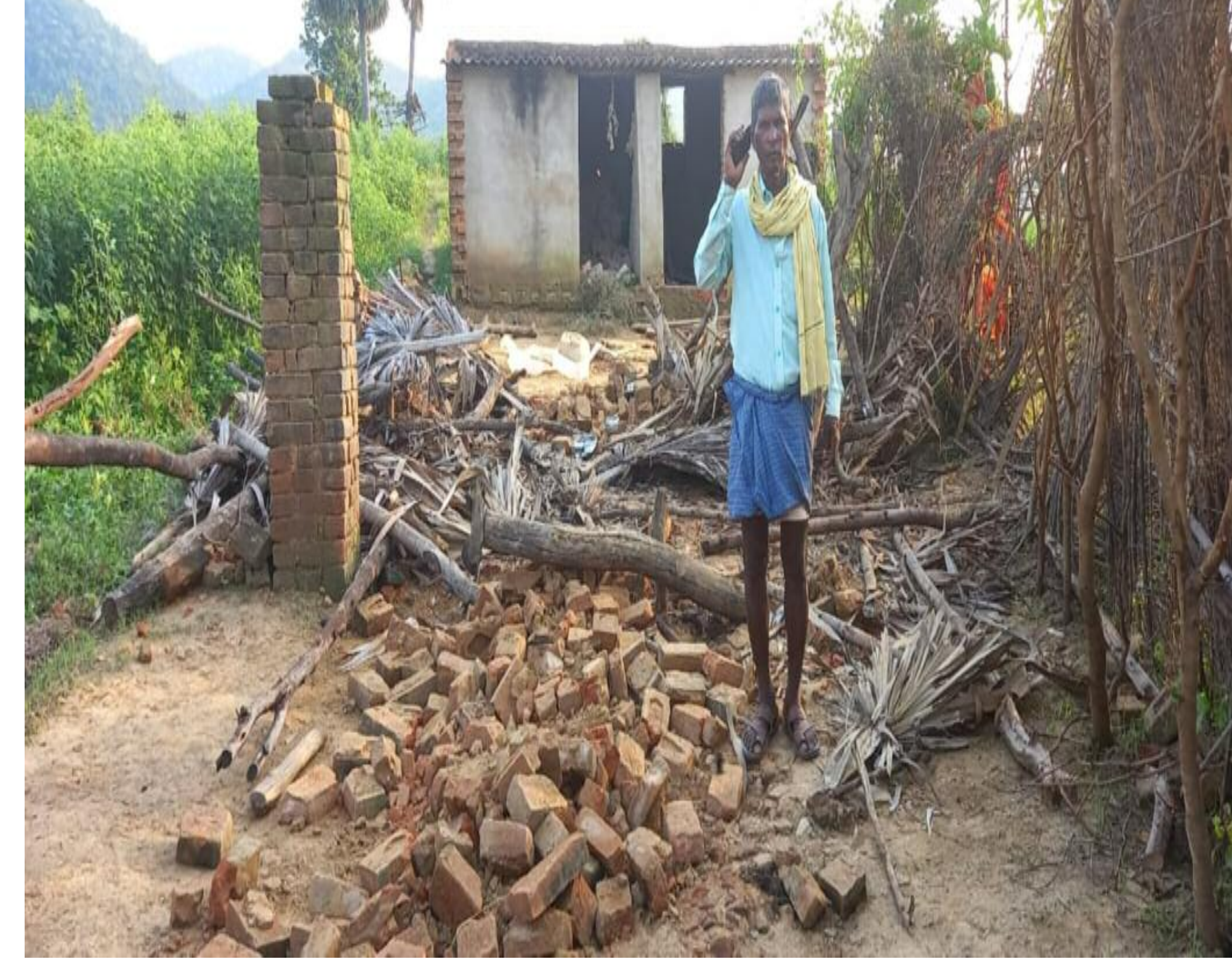
हाथियों द्वारा ध्वस्त मकान को दिखाता पिंडित व्यक्ति