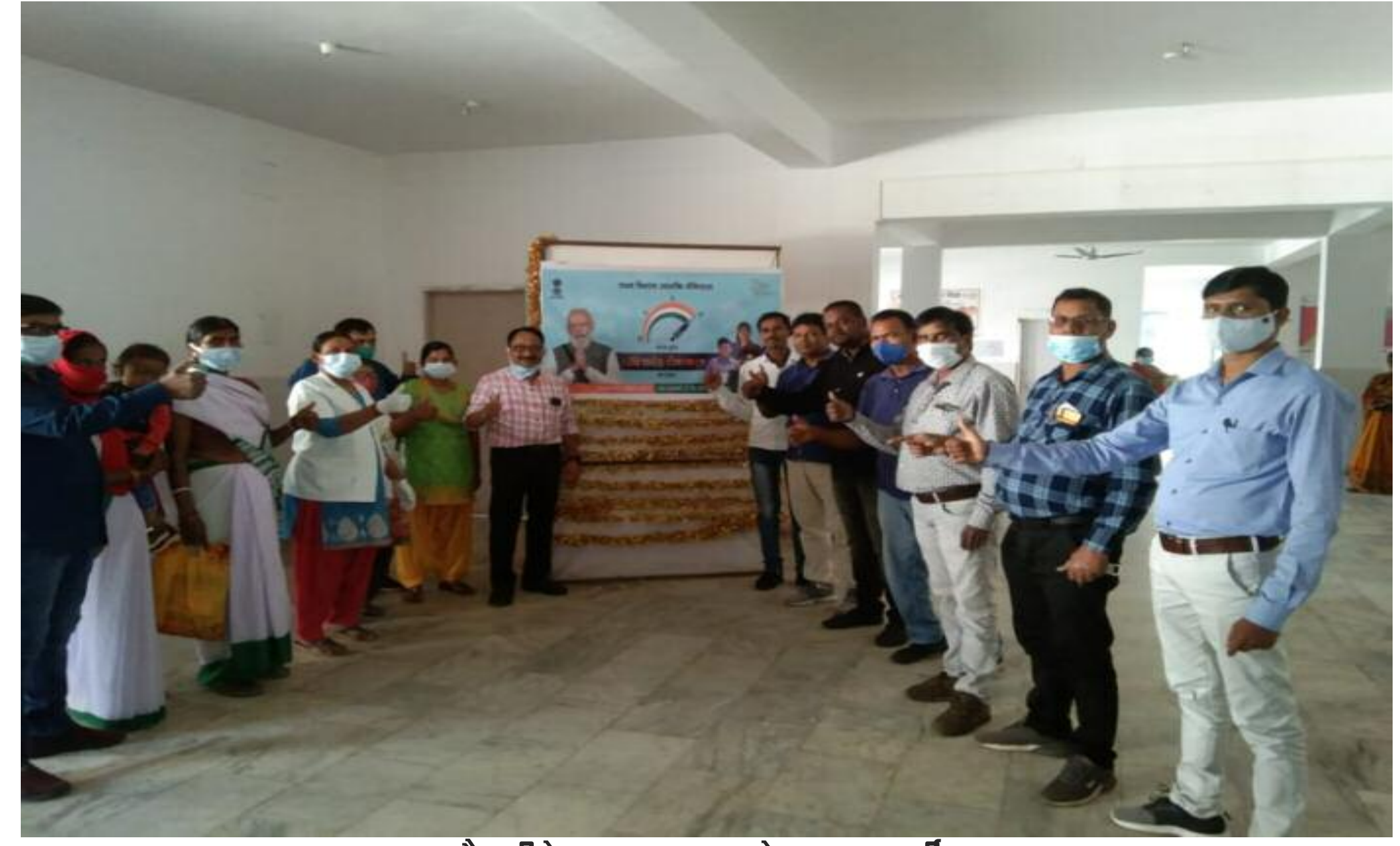
वैक्सीनेशन उत्सव मनाते स्वास्थ्यकर्मी

वैक्सीन पूरा किया गया है इस अवसर पर उन्होंने आमजनों से अपील करते हुए कहा कि कोविड टीकाकरण से सुरक्षा तो बढ़ी ही है। अब एक बड़ी आबादी ऐसी है जिसे दोनों टीके लग चुके हैं जिससे संक्रमण में भी कमी आई है। लेकिन इसका मतलब ये