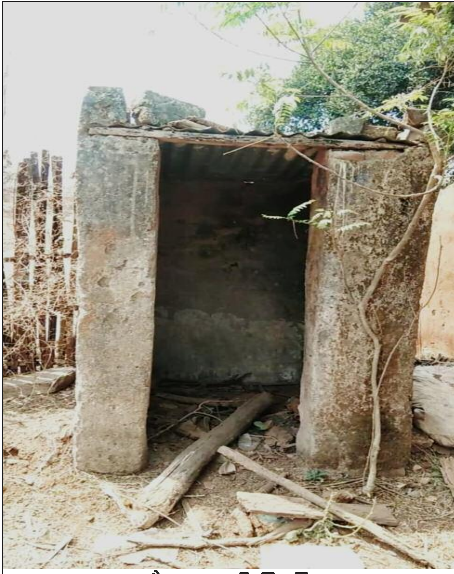
शौचालय की स्थिति

स्वच्छ भारत मिशन ग्रामीण के तहत शौचालय निर्माण के लिए अनुदान पर करोड़ों रुपये खर्च करने के बावजूद आधे से अधिक की आबादी आज भी खुले में शौच जाते हैं। सरकारी संकल्पों के मुताबिक टाटीझरिया प्रखंड को खुले में शौच से मुक्त प्रखंड घोषित कर दिया जा चुका है। आलम यह है कि लाख कोशिशों के बावजूद लोग बाहर में ही शौच जाते हैं। शौचालय के उपयोग को लेकर गांव, पंचायत और प्रखंड स्तर तक बैठकों का दौर चलाया गया। हालांकि पहले से हालात सुधरे जरूर हैं। प्रखंड के टाटीझरिया, डहरभंगा, धरमपुर, डुमर, भराजो, खैरा, बेडम, झरपो पंचायत के कई गांवों में मनरेगा और पीएचईडी से रुपये देकर शौचालय बनाए गए हैं। बने शौचालयों में से पचास फीसदी से भी कम