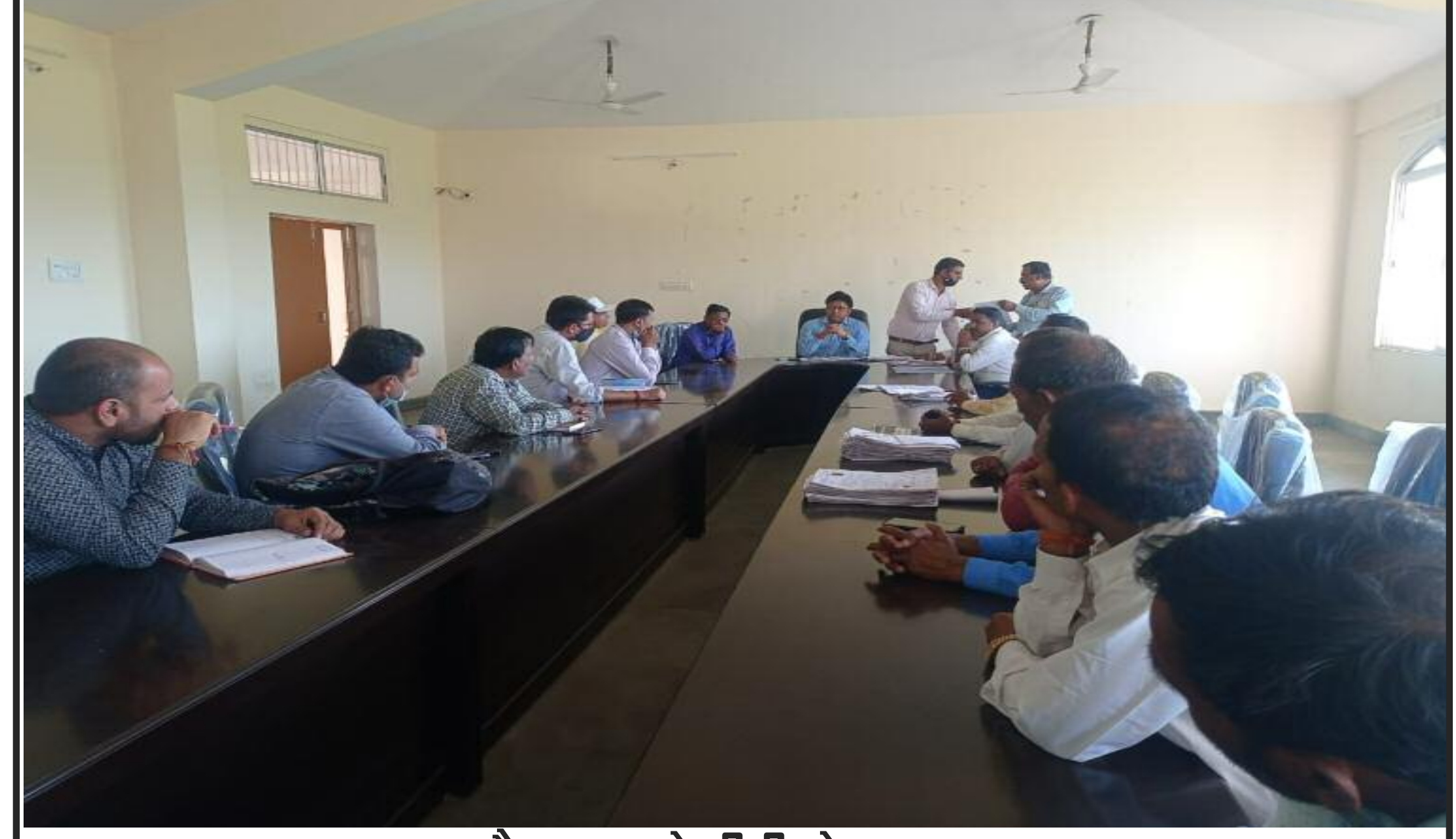
बैठक करते बीडीओ व अन्य