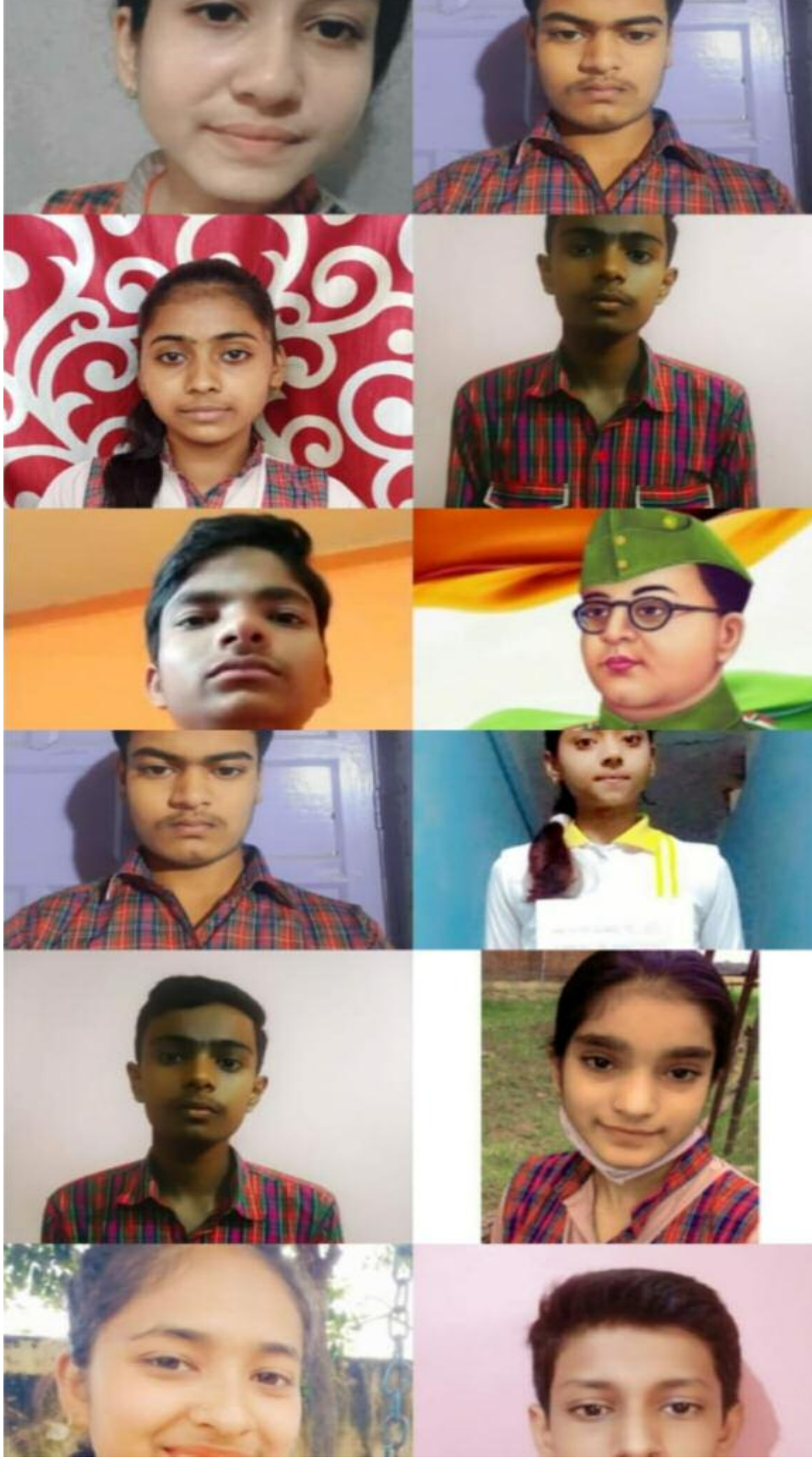
कार्यक्रम में बेहतर प्रदर्शन करने वाले प्रतिभागी