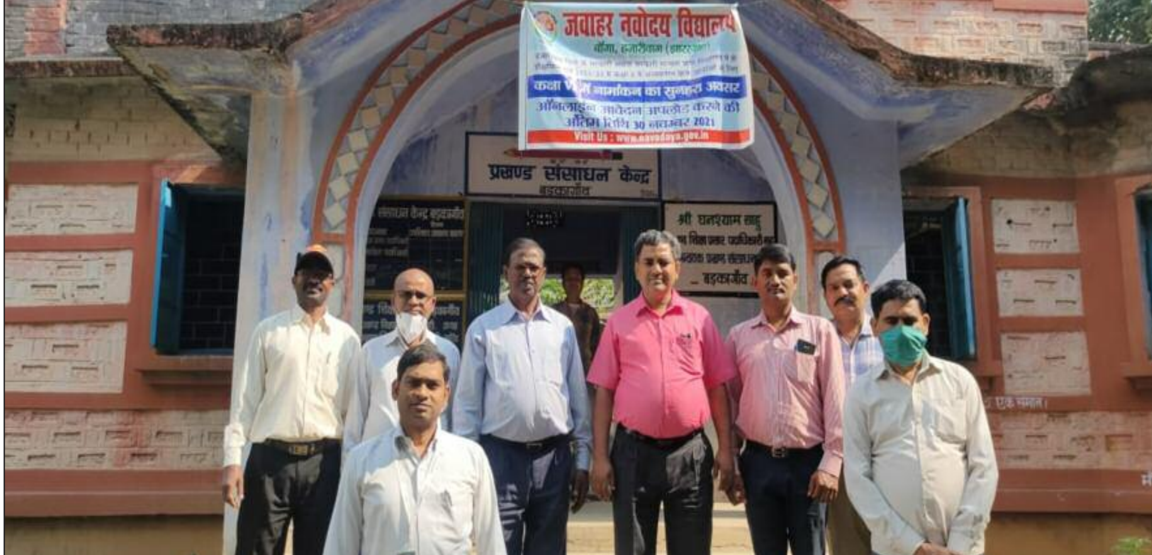
बैठक में उपस्थित पदाधिकारी एवं शिक्षक गन

नवोदय विद्यालय में वर्ग छ: में प्रवेश हेतु प्रवेश परीक्षा के लिए ऑनलाइन आवेदन की शुरुवात कर दी गई है। बड़कागांव प्रखंड से 365 अभियार्थियों के प्रवेश परीक्षा में शामिल होने का लक्ष्य है। प्रवेश परीक्षा के लिए ऑनलाइन आवेदन जमा करने की अंतिम तिथि 30 नवंबर तक निर्धारित की गई है। विद्यालय में प्रवेश के लिए 75 प्रतिशत स्थान ग्रामीण क्षेत्रों में अवस्थित विद्यालयों के छात्र छात्रों के लिए आरक्षित किया गया है।