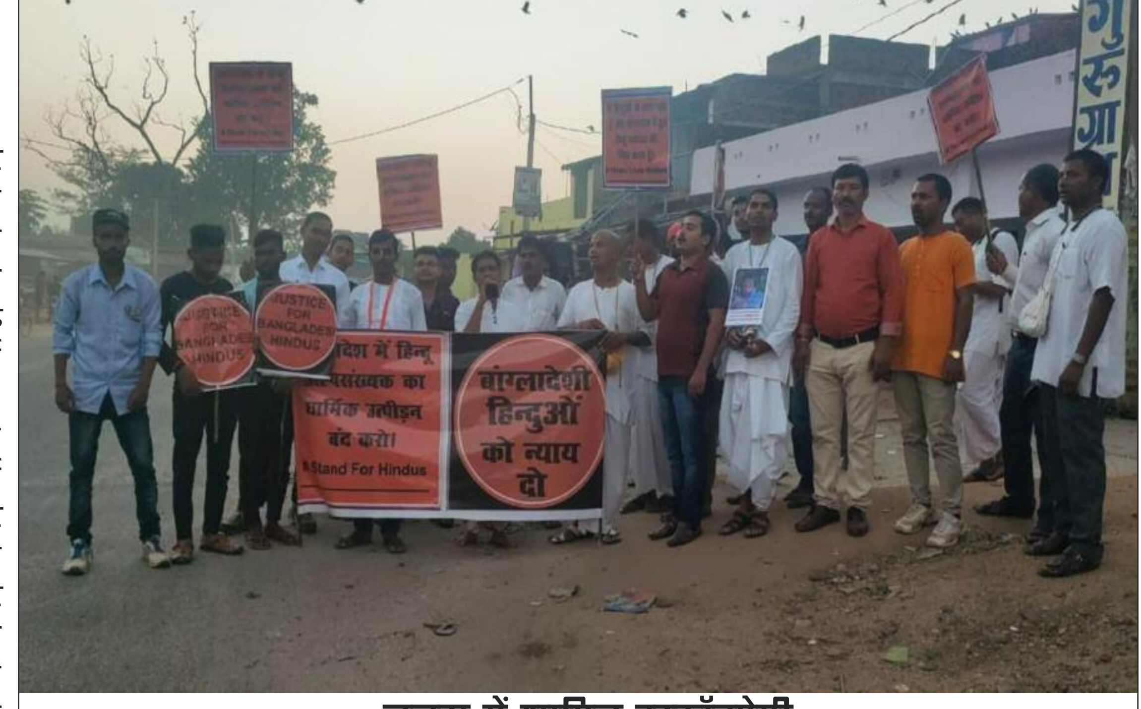
जुलूस में शामिल इस्कॉनप्रेमी