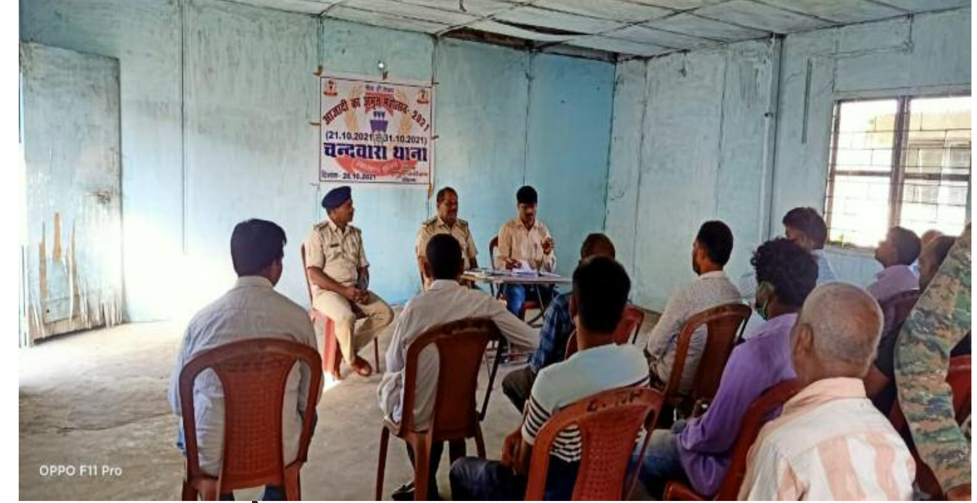
बैठक करते प्रशासनिक पदाधिकारी