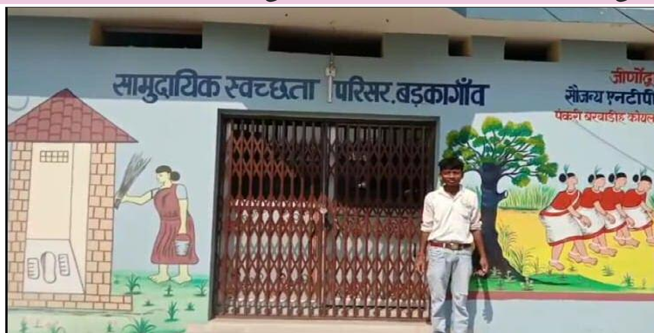
बड़कागांव सामुदायिक स्वच्छता परिसर