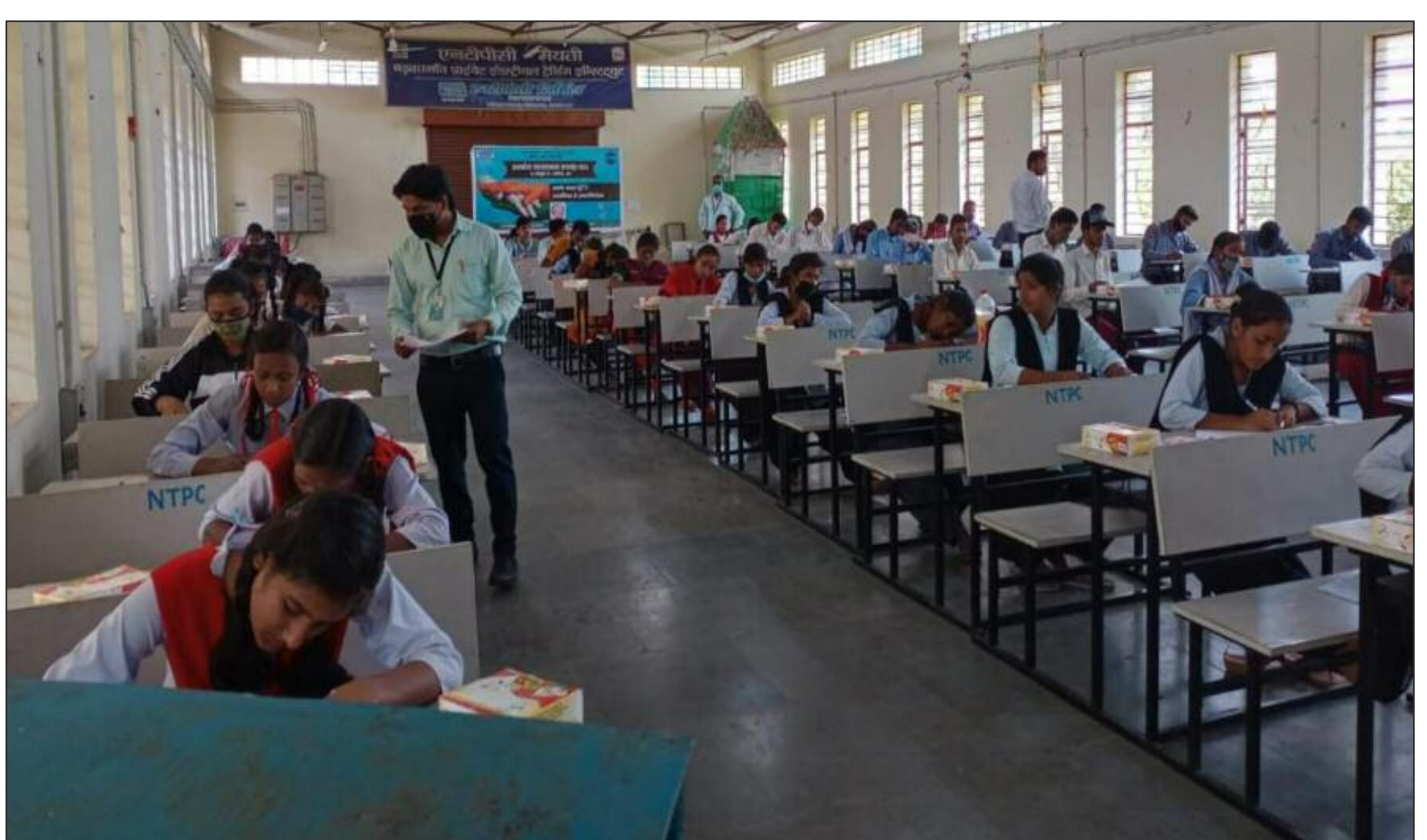
प्रतियोगिता में शामिल विद्यार्थी

एनटीपीसी कोयला खनन परियोजना पकरी बरवाडीह के तत्वधान से एनटीपीसी आईटीआई कॉलेज में सतर्कता जागरूकता सप्ताह 26 अक्टूबर से 1 नवंबर तक मनाया जा रहा है। इस अवसर पर परियोजना के विभिन्न स्कूल, कलेज एवं आईटीआई संस्थानों के बीच सतर्कता जागरूकता के संदर्भ में निबंध प्रतियोगिता का आयोजन एनटीपीसी द्वारा औद्योगिक प्रशिक्षण संस्थान डेंगा में किया गया। सतर्कता प्रतियोगिता में काफी उत. सुकता दिखाते हुए कस्तूरबा बालिका आवासीय विद्यालय बड़कागांव की छात्रा, जीडीएम बालिका विद्यालय बड़कागांव, बड़कागांव हाई स्कूल, करणपुरा कलेज बड़कागांव, एवं एनटीपीसी आईटीआई प्रशिक्षुओं ने मुख्य रूप से भाग लिया। एनटीपीसी आईटीआई के