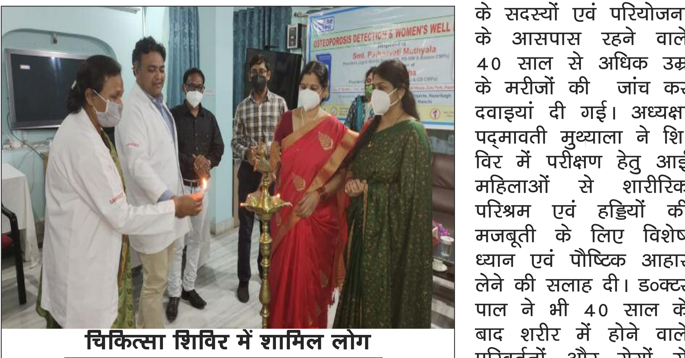
चिकित्सा शिविर में शामिल लोग