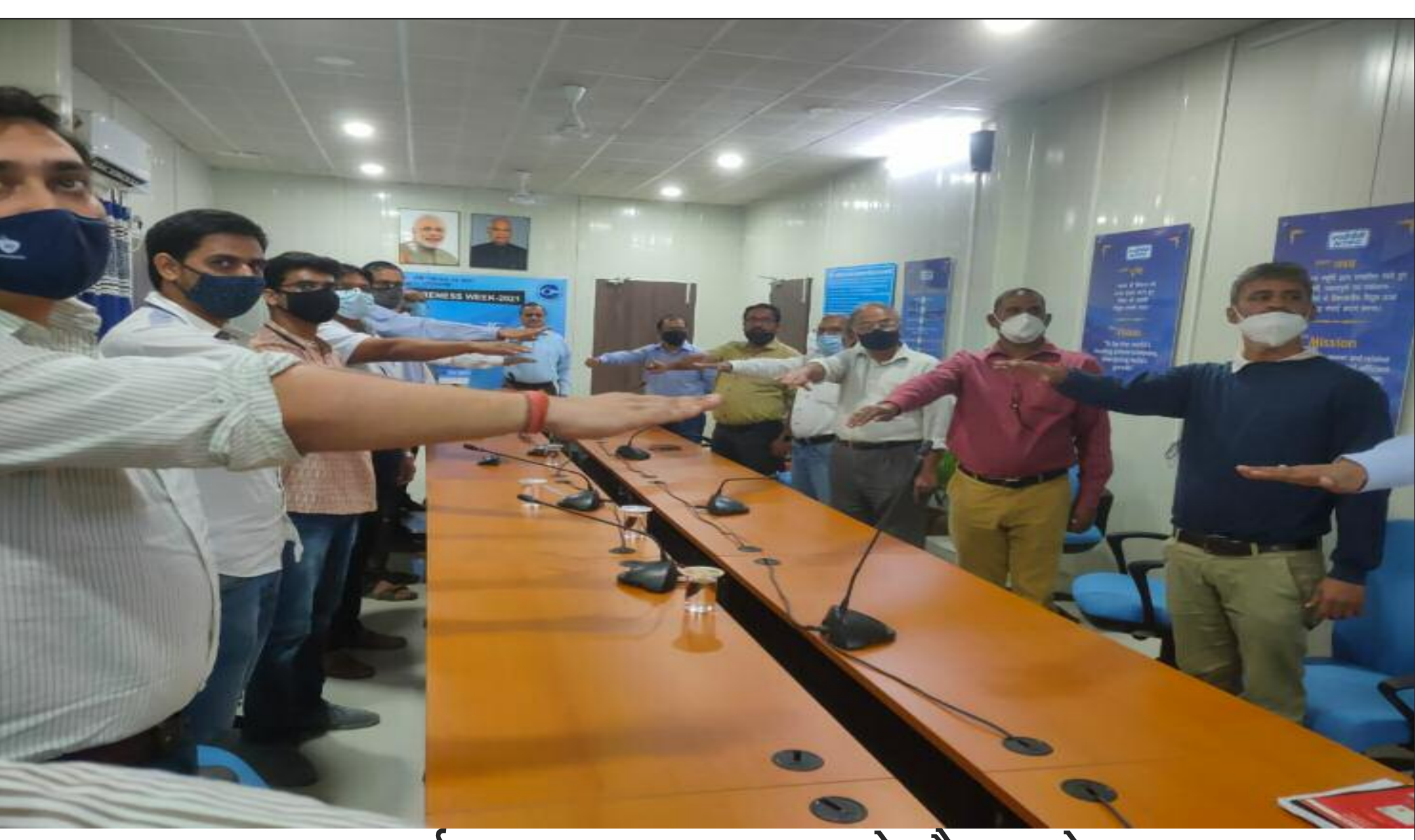
सतर्कता जागरूकता सप्ताह में मौजूद लोग