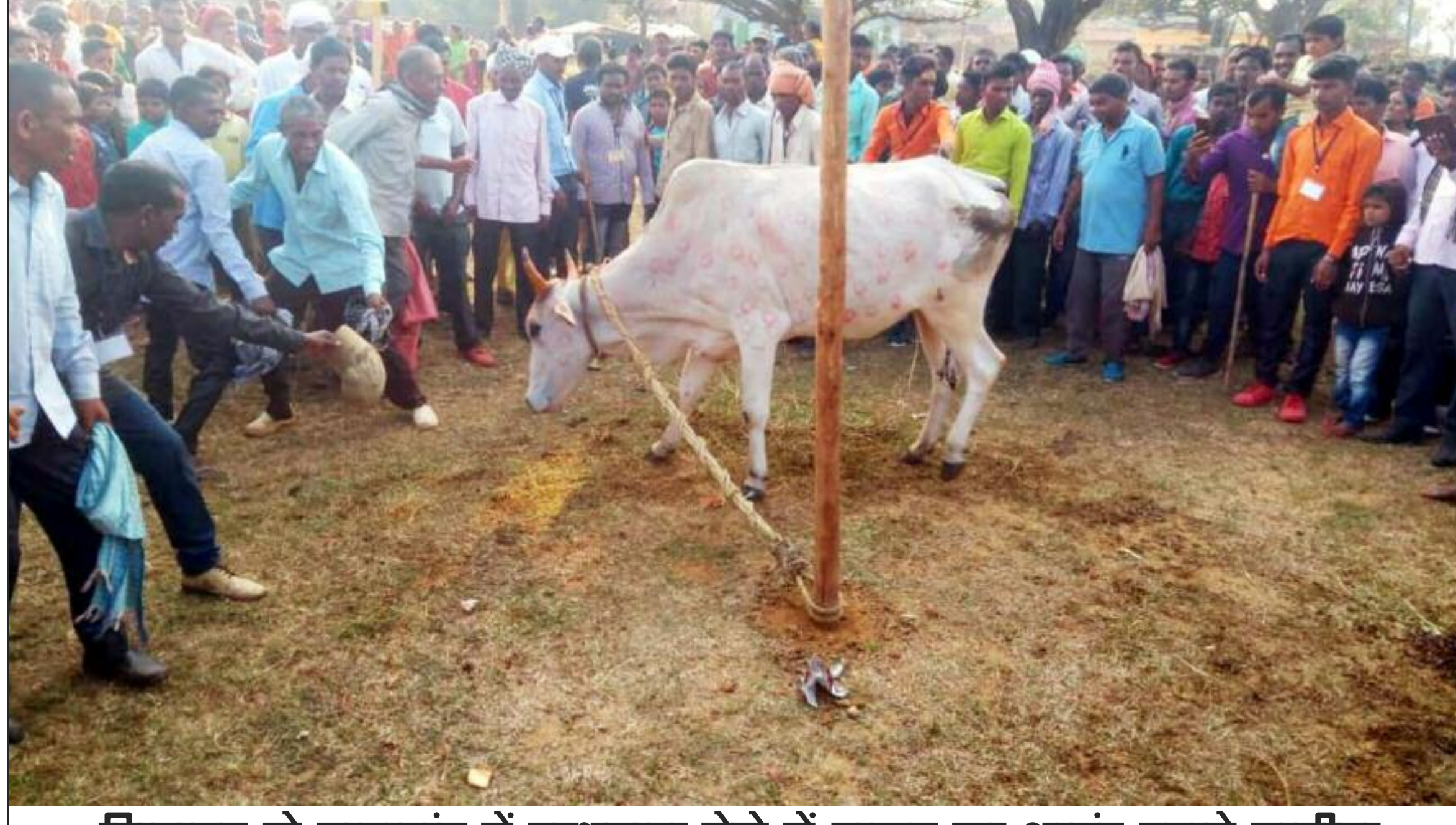
विष्णुगढ़ के नावाटांड में बरधखुड़ा मेले में उत्सव का आनंद उठाते ग्रामीण

विष्णुगढ़ के विभिन्न इलाकों में शनिवार को गौधन पूजन पर सोहराय सह बरधखुड़ा मेला का आयोजन धूमधाम से किया गया। बनासो के नावाटांड, चटकरी, तेलनियांटांड, भेलवारा समेत अन्य गांवों में आयोजित मेला में काफी संख्या में लोग शामिल हुए और पारंपरिक उत्सव का आनंद उठाया। अहले सुबह पशुपालक किसानों ने गोहाल एवं आंगन की साफ-सफाई कर पशुधन को बेहतर तरीके से सजाकर पूजा की। दीपावली के दूसरे दिन अधिकांश गांवों में पारंपरिक बरधखुड़ा उत्सव की प्राचीन परंपरा रही है। इसमें किसान अपने पशुधन को तेल सिंदूर लगाकर एक खूटे में मवेशी को बांधकर ढोल नगाड़े और