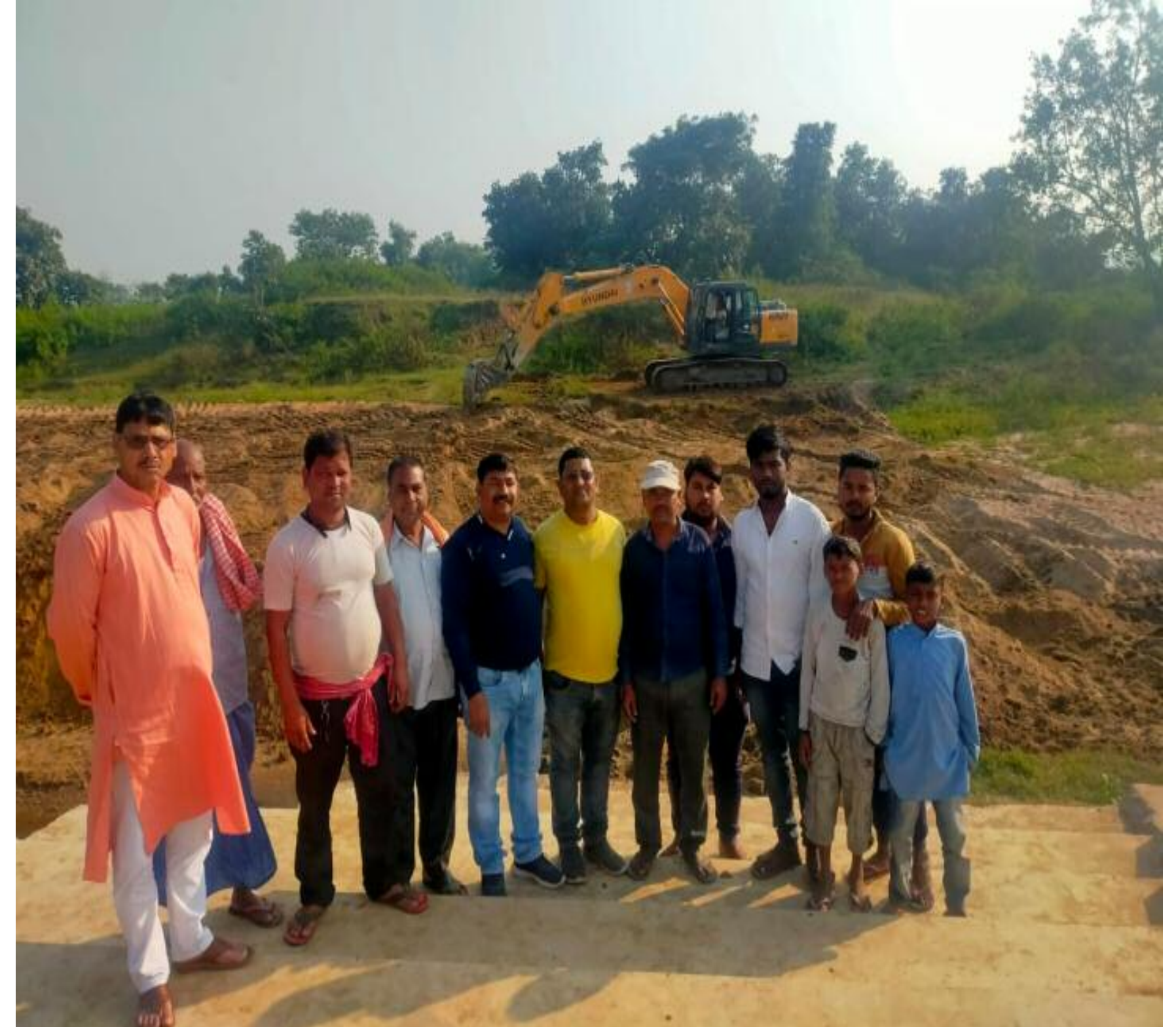
छठ घाट की सफाई करते लोग

बरकट्टा लोकआस्था का महापर्व छठ को देखते हुये प्रखण्ड का महत्वपूर्ण व प्रसिद्ध बेलवा नदी छठ घाट बरकट्टा की घाट की सफाई स्थानीय विधायक अमित यादव की पहल पर पोकलेन व जेसीबी की मदद से की जा रही है ज्ञात हो बेलवा नदी छठ घाट की स्थिति काफी खराब थी विधायक अमित यादव पिछले सप्ताह छठ घाट का निरीक्षण करके आवश्यक दिशा निर्देश युवकों को दिए थे इसी की निमित आज पोकलेन से पूरे घाट की सफाई की सफाई की गई साथ ही एनएच फोरलेन से लेकर छठ घाट तक मजदूर लगाकर घाट की सफाई की जा रही है ज्ञात हो इस घाट पर छठ पूजा समिति के युवकों द्वारा आकर्षक रूप से साज सज्जा लाइटिंग व लाउडस्पीकर लगाया जाता है वही स्थानीय युवकों की पहल पर श्रद्धालुओं द्वारा छठ के दूसरे अर्घ्य के दिन भव्य भंडारे का आयोजन अम्बेडकर क्लब के