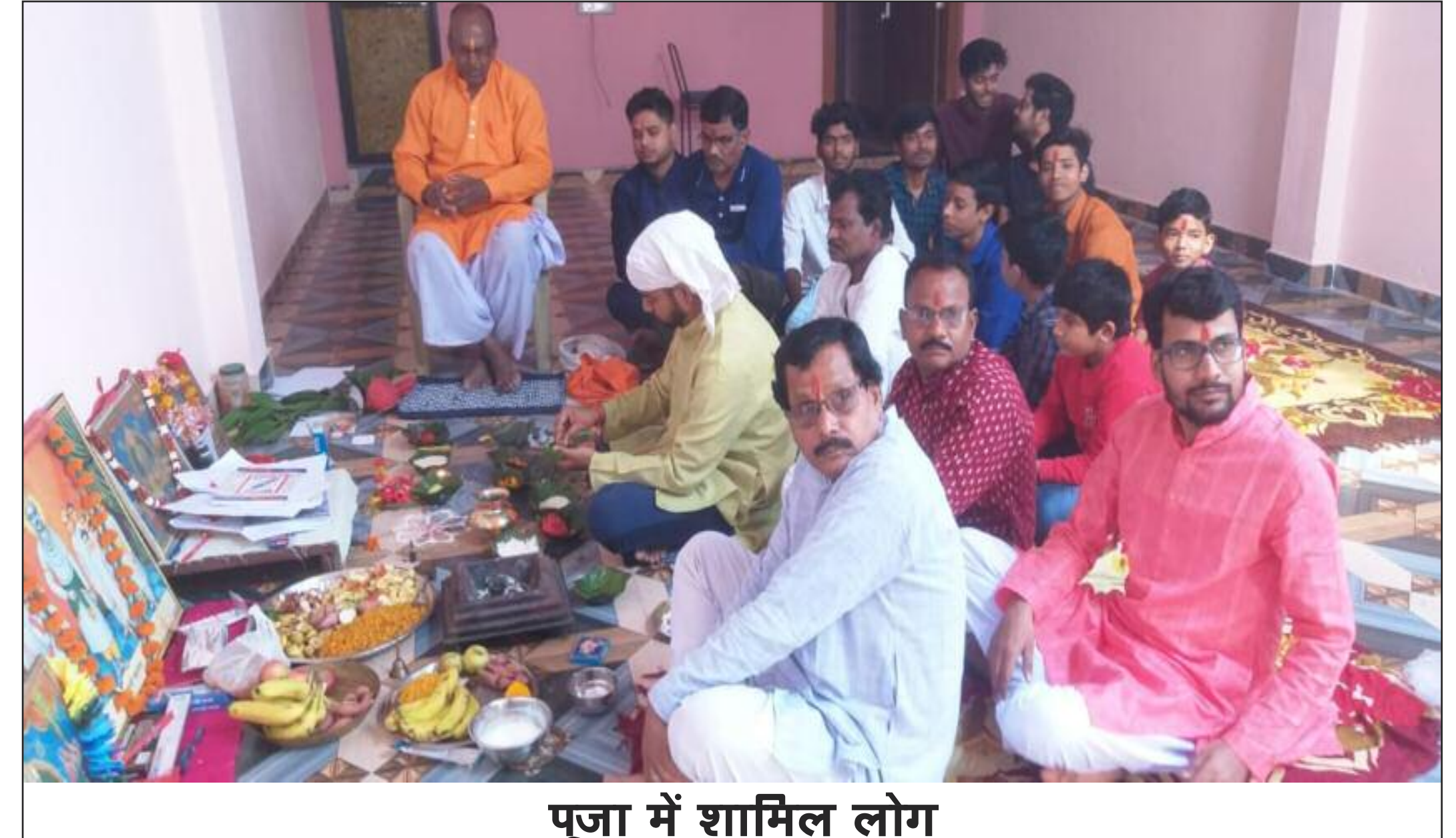
पूजा में शामिल लोग

बड़कागांव में चित्रांश परिवार के लोगों ने धूमधाम से भगवान चित्रगुप्त की पूजा की। पूजा को लेकर लोग अहले सुबह से ही पूजा की तैयारी में जुट गए थे। पूजा के दौरान लोगों ने अपनी अपनी कलम दवात भगवान चित्रगुप्त के समक्ष समर्पित किया एवं पूरे 1 वर्ष की आमद और व्यय का लेखा जोखा प्रस्तुत किया गया। पूजा के पश्चात लोगों ने प्रसाद ग्रहण किया। पूजा के बाद लोगों ने पूरे दिन कलम से लेखनी कार्य रूफ से बंद रखा। मौके पर पूजा में शामिल लोगों में