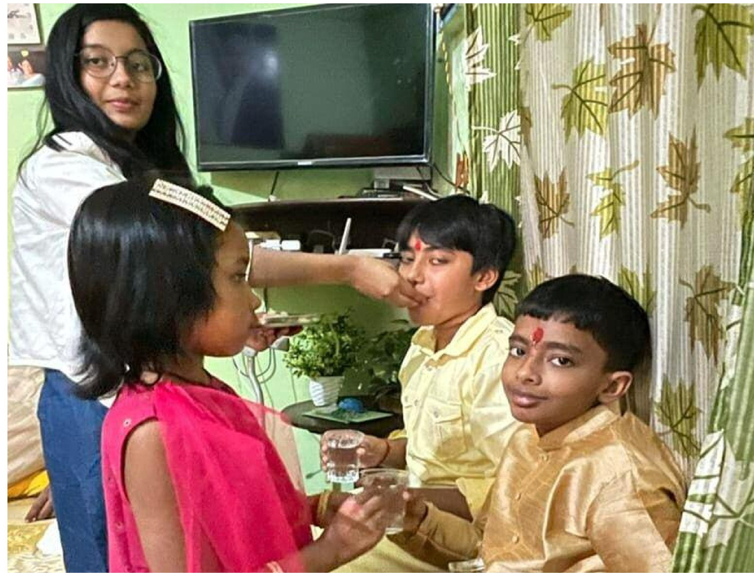
न्यू कॉलोनी में भैया दूज मनाते बच्चे