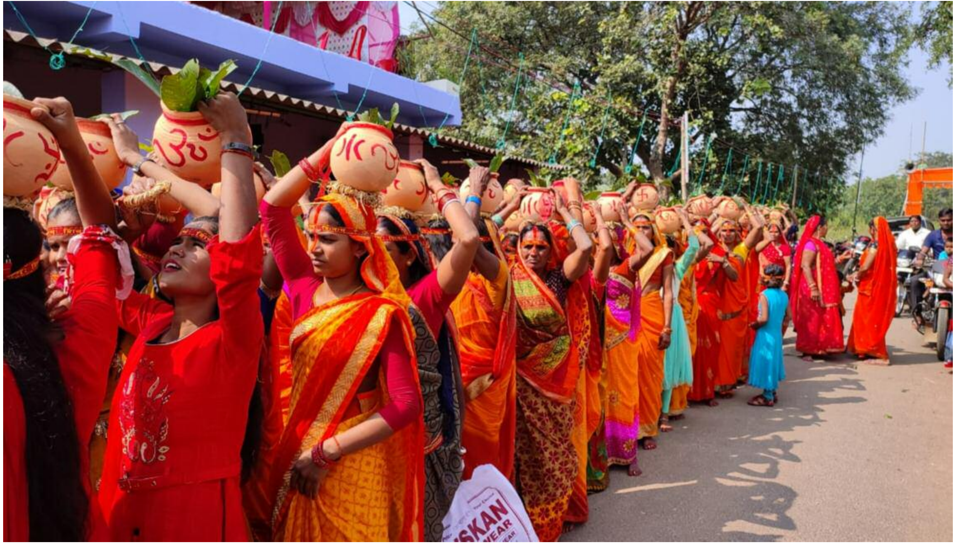
कलश यात्रा में शामिल महिलाएँ