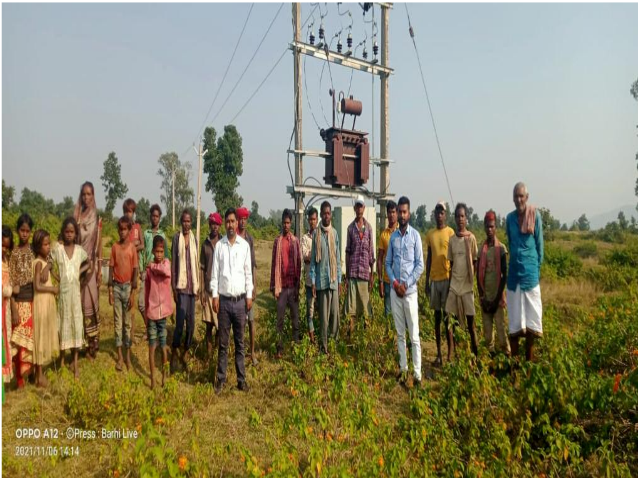
बिरहोरों के लिए निःशुल्क बिजली कनेक्शन की माग करते बिरहोर