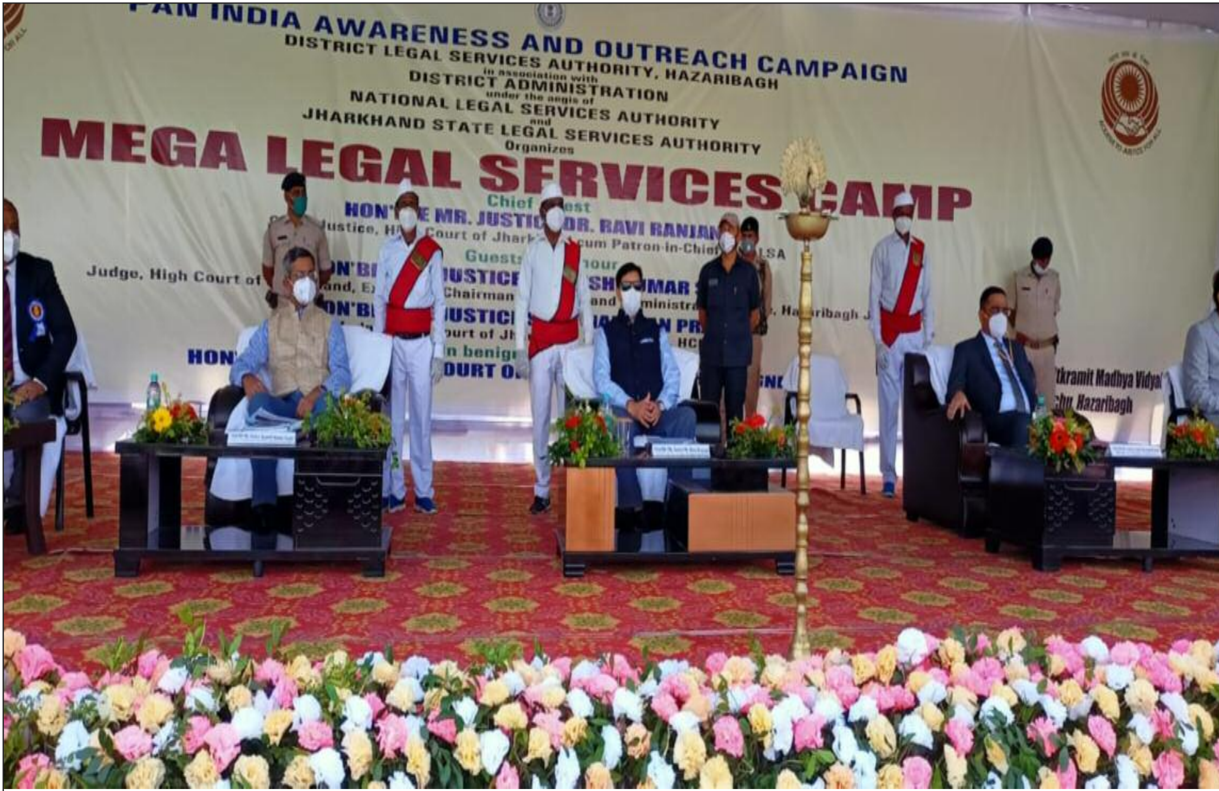
कैम्प में शामिल मुख्य न्यायाधीश

इस कैम्प में लगभग 42 अलग-अलग स्टोलों को लगाया गया मेघा लीगल सेवा कैम्प में 42 अलग-अलग स्टोलों को लगाया गया जिसमें महा विधिक सेवा शिविर जिला विधिक सेवा प्राधिकरण, आजादी का अमृत महोत्सव साम. दायिक स्वास्थ्य केंद्र चुरचू, कृषि प्रौद्योगिकी प्रबंधन अभिकरण, जिला मत्स्य कार्यालय, मनरेगा महात्मा गांधी राष्ट्रीय ग्रामीण रोजगार गारंटी योजना, जिला ग्रामीण विकास अभिकरण, जल जीवन मिशन स्वच्छ भारत मिशन, ग्रामीण विकास विभाग झारखंड स्टेट लाइवलीहुड प्रमा. शन सोसाइटी, सीनी टाय ट्रस्ट एवं सपोर्ट संस्था के द्वारा स्मार्ट गांव कजरी, चुरचू नारी ऊर्जा फार्मर प्रोड्यूसर कंपनी लिमिटेड जन जागरण केंद्र मशरूम की खेती कृषि पशुपालन एवं सहकारिता विभाग कृषि उत्पादन बाजार समिति सोना सोबरन धोती साड़ी योजना प्रदान संस्था सामाजिक सुरक्षा कोषांग मुख्यमंत्री पशुधन विकास