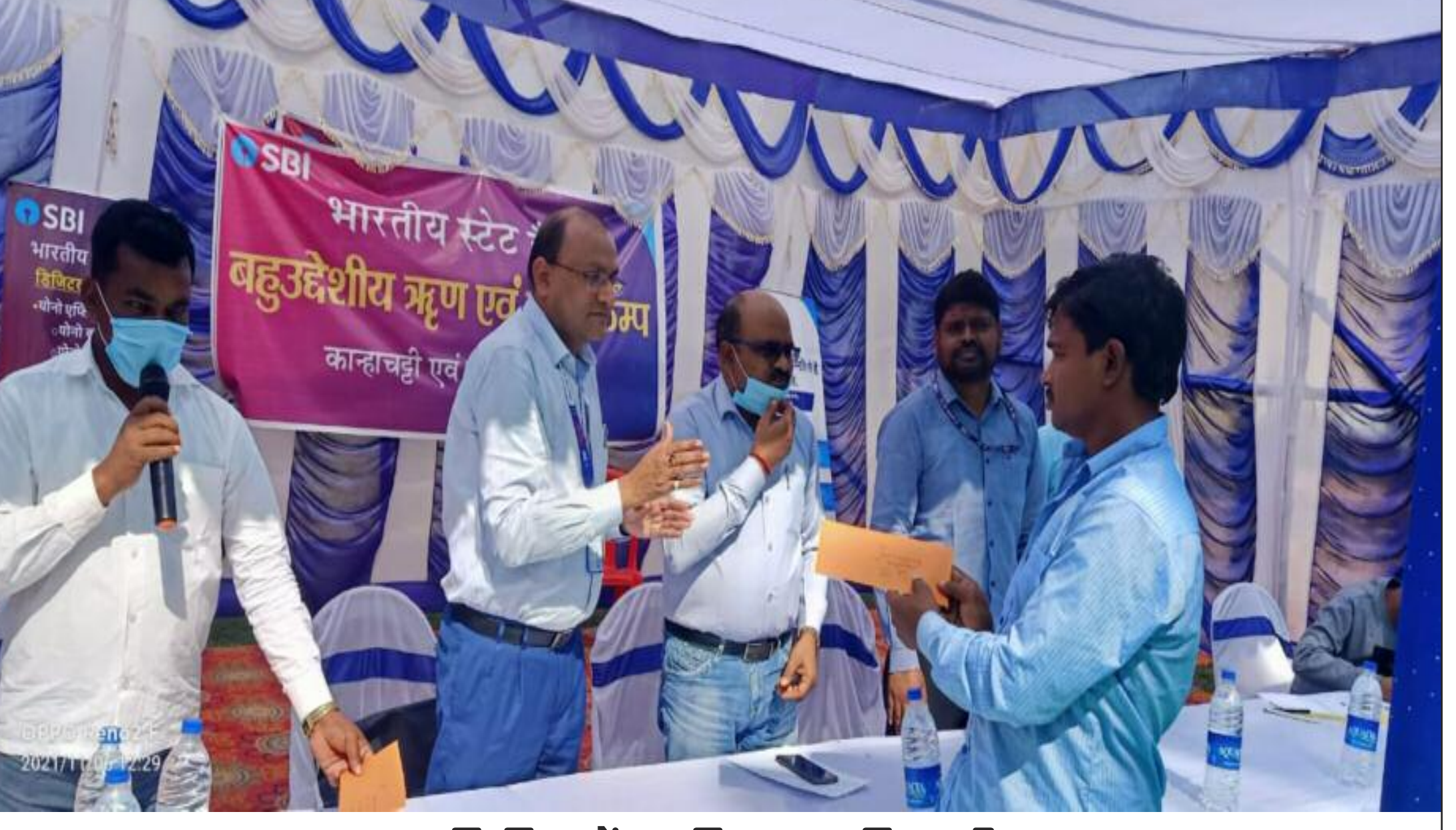
शिविर में शामिल पदाधिकारी

सहायता एसजीएस 17 लाख के ऋण वितरित किए गए एवं इसके अतिरिक्त पर्सनल लोन एवं दो पेंशन लोन का भी स्वीकृति पत्र का वितरण किया गया। इस शिविर में कुल 557 व्यक्तियों को प्रधानमंत्री सुरक्षा बीमा योजना के दायरे में लाया गया, 105 व्यक्तियों को प्रधानमंत्री जीवन ज्योति योजना के अंतर्गत निमित्त किया गया। अटल पेंशन योजना भी 20 लोगों को किया गया। सबसे ज्यादा के सी