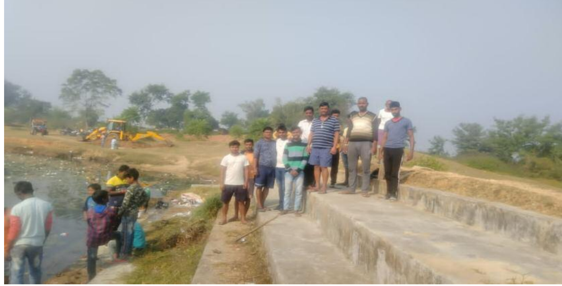
छठ घाट का निरीक्षण व सफाई करते समाजिक कार्यकर्ता

छठ घाट का किया गया साफ सफाई व छठ व्रतियों के लिए बनाया सुविधायुक्त