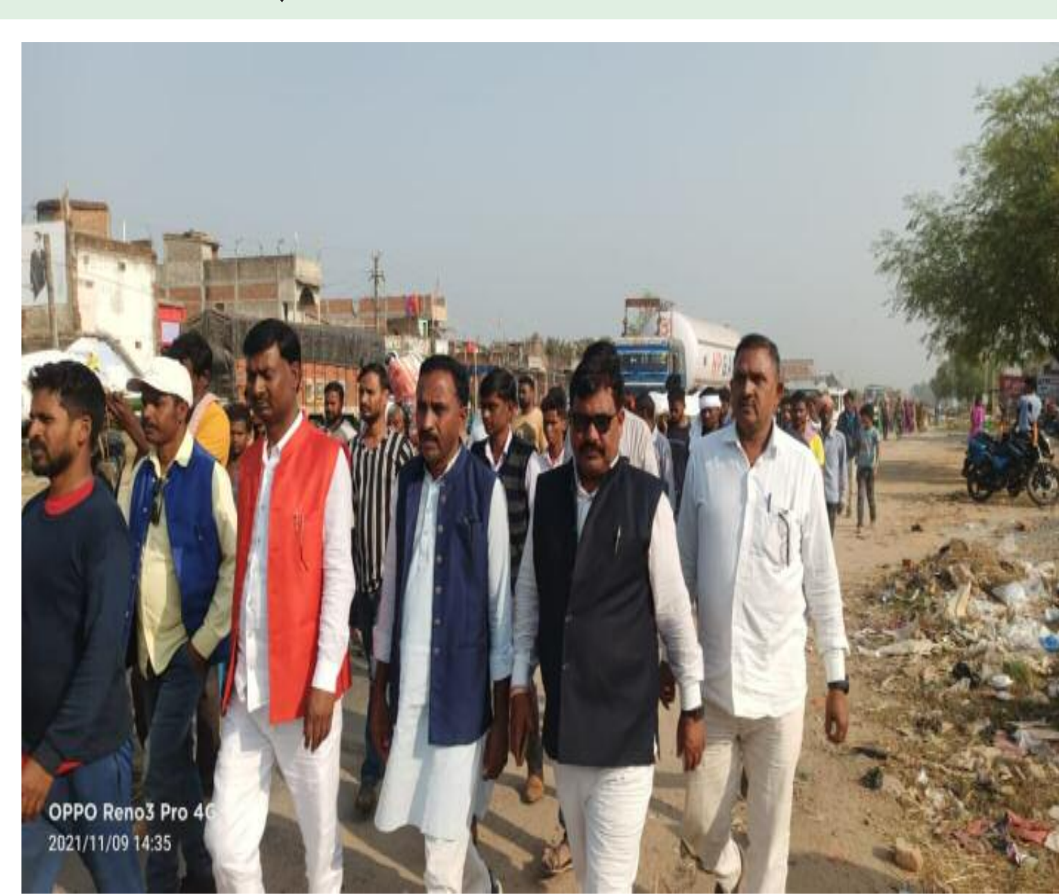
अंतिम यात्रा में शामिल लोग