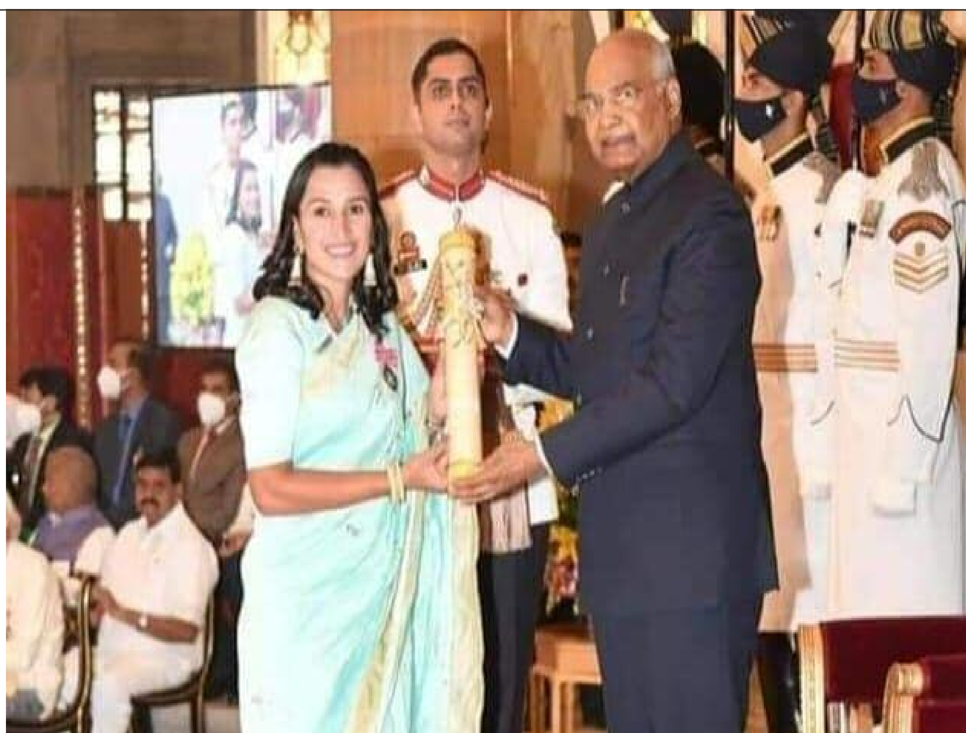
पद्मश्री से सम्मानित प्रजापति समाज की विभूतियां