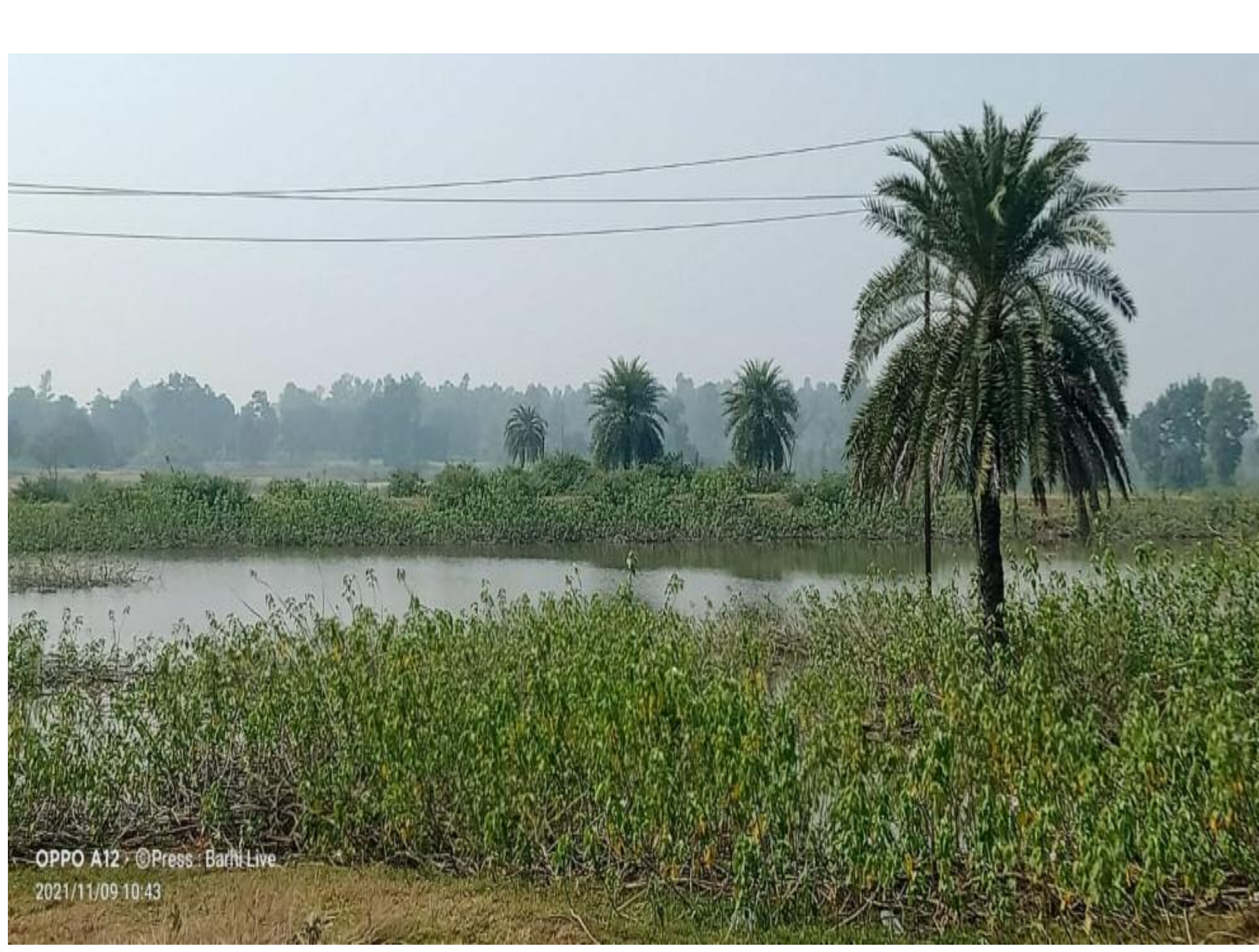
यहीं है मनहुस तालाब जिसमें बच्चे की डूबने से मौत