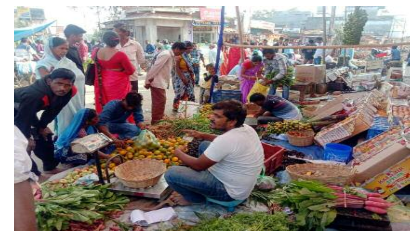
छठ को लेकर सब्जी फल की दुकान में खरीदारी करते लोग

सूर्योपासना के अनुपम आस्था का लोकपर्व छठ महापूजा को लेकर विष्णुगढ़ बाजार में मंगलवार को काफी गहमागहमी रही। बाजार में छठ पूजा में उपयोग किए जाने वाले विविध फलों के अलावा पूजन सामग्रियों की दर्जनों दुकानें सजी हैं। आसमान छूती महंगाई के बावजूद छठव्रती अपने सामर्थ्य के अनुसार फलों एवं पूजन सामग्री की खरीदारी कर रहे हैं। छठव्रती पूजा में उपयोग वाले सभी सामग्री जुटाने में लगे हैं। छठ पूजा के लिए कोसी, पीतल या बांस का सूप, दउरा, साड़ी, गन्ना, नारियल, फल समेत हर छोटे-बड़े सामान की खरीदारी