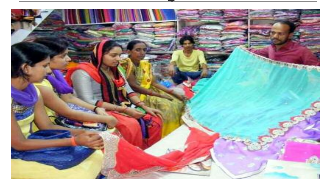
छठ को लेकर साड़ी की खरीदारी करती महिलाएं

करने लगे हैं। बाजार अदरक 40, गाजर में सेव 400-600, सुथनी 100, रुपए पेटी, केला मूली 20, नाशपती 200-500 रुपए, शरीफा 200, कांधी, संतरा 400, नारियल 20 रुपए का अमरुद 50, पानीफल 50, डेंभा 10 रुपए से ही दूध की जुगाड़