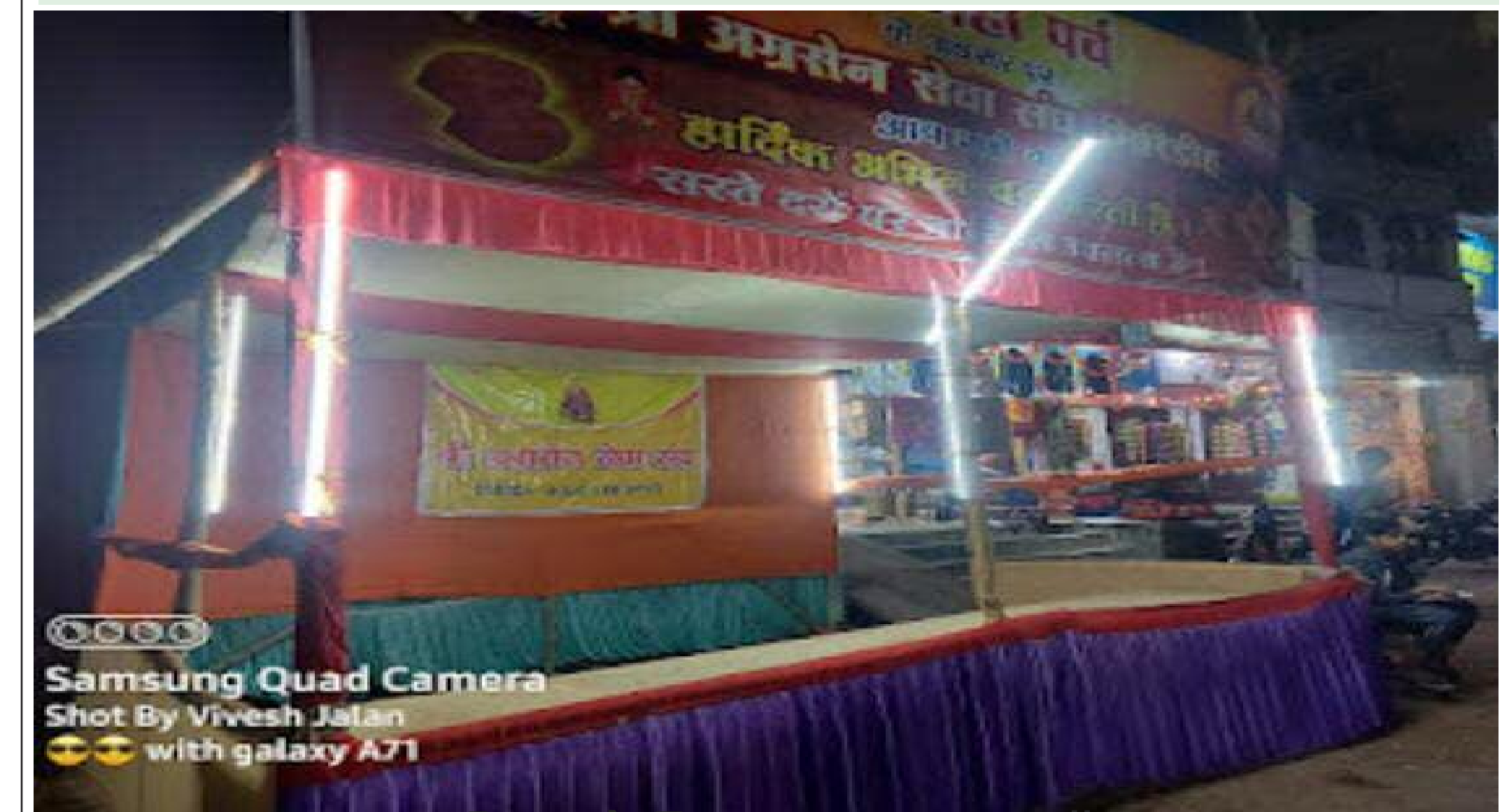
नारियल के लिए सजाया गया स्टॉल