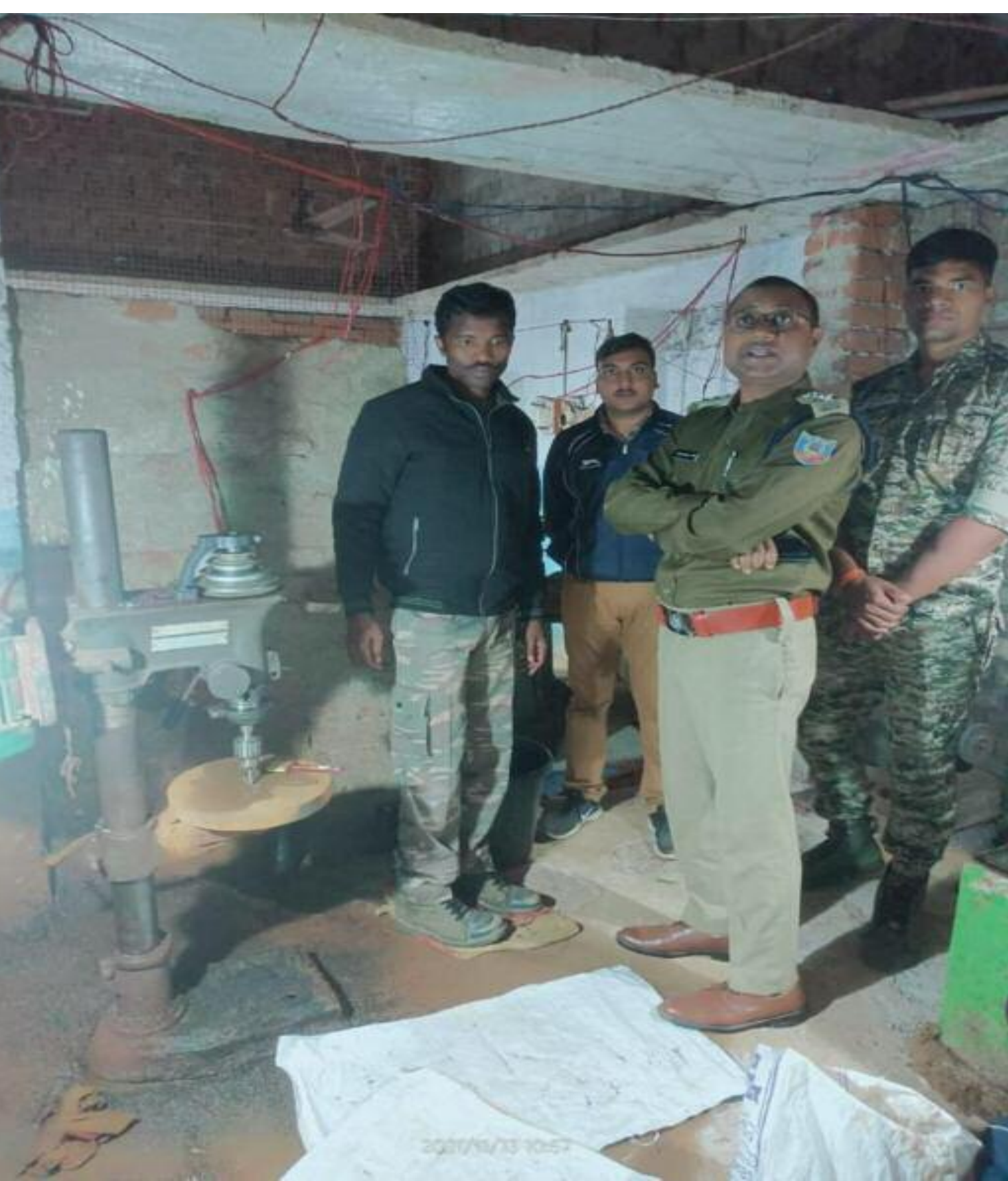
अवैध हथियार फैक्ट्री में छापेमारी करती पुलिस की टीम