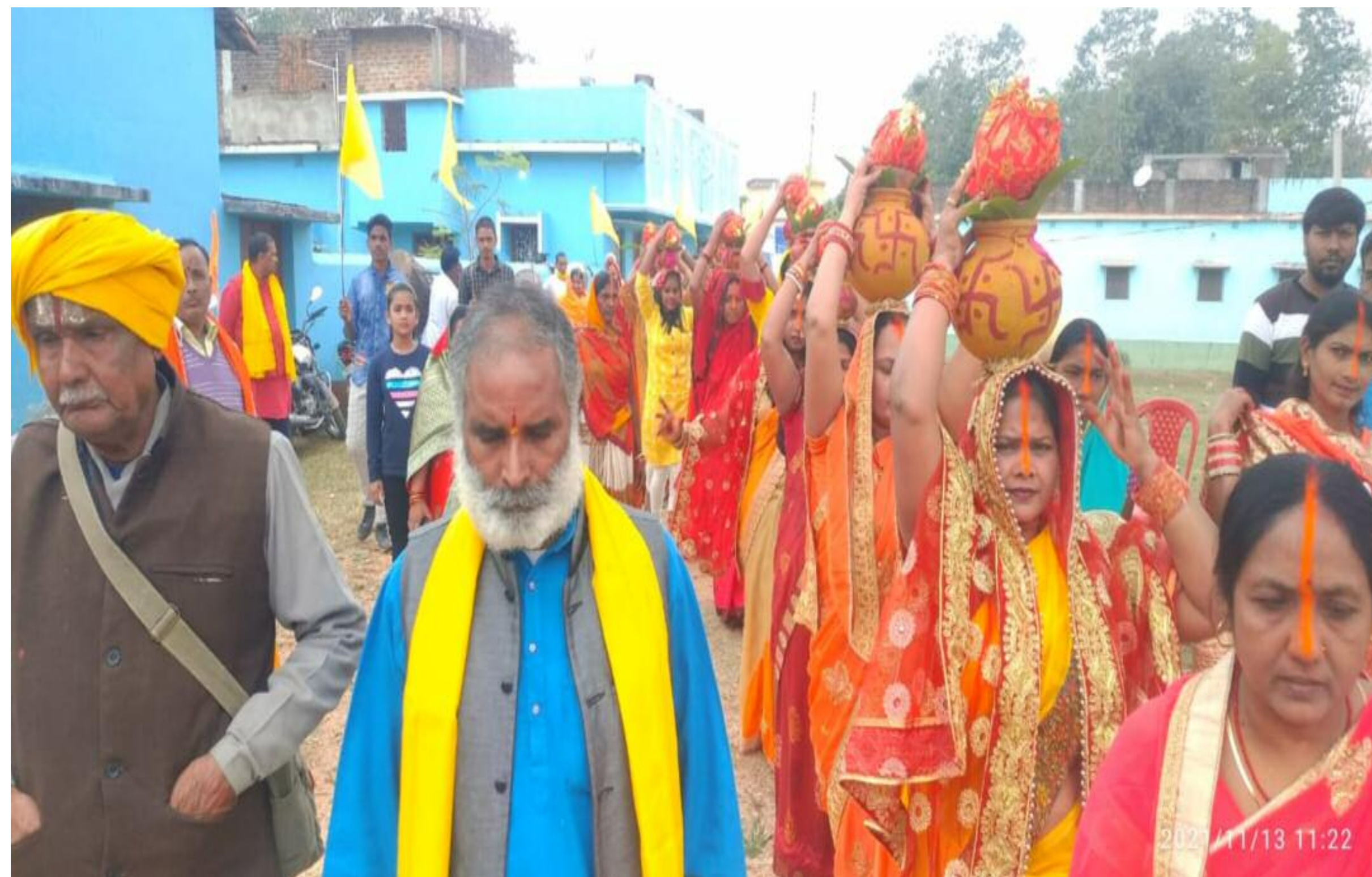
कलश यात्रा में शामिल महिलाएं व भक्तगण