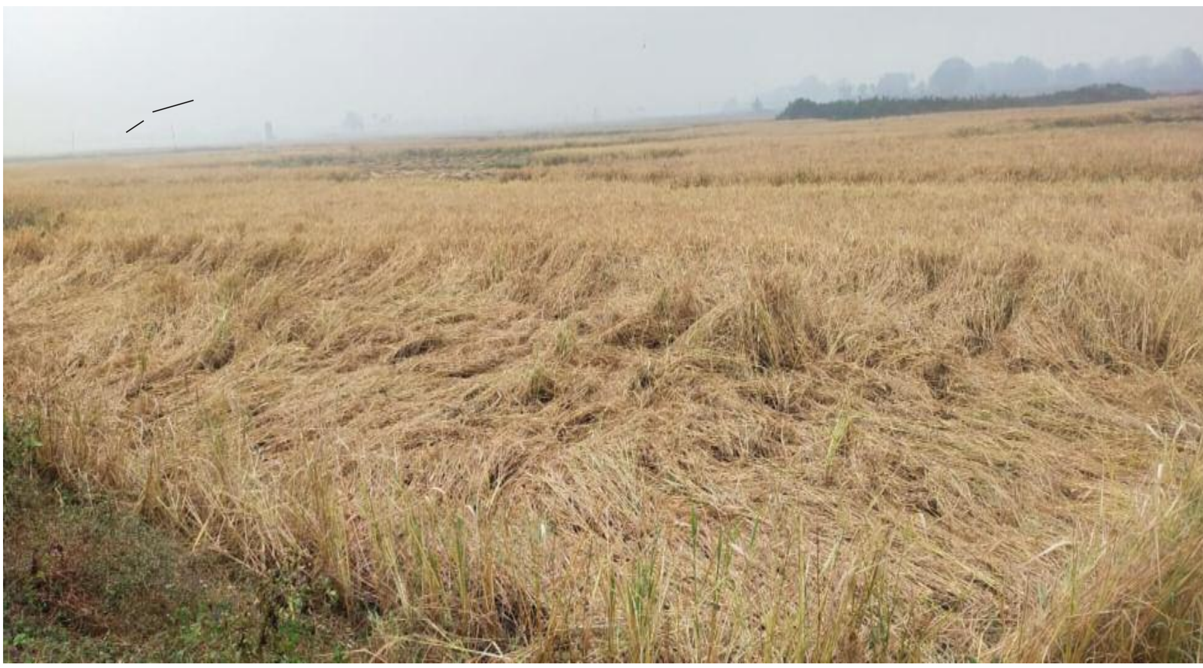
धान की खेत में पके हुए धान की बाली

बंगाल की खाड़ी में बने कम दबाव के चक्रवात के कारण बड़कागांव प्रखंड में शनिवार को दिन भर हल्की हल्की बारिश होती रही। बारिश के कारण तापमान में भी कमी आई है और ठंड बढ़ गई है। वहीं बारिश के कारण सब से ज्यादा प्रभावित किसान हो रहे हैं। एक ओर जहां कोरा ना काल में किसान प्रभावित हुए वहीं अब बारिश ने किसानों के चेहरे पर चिंता उत्पन्न कर दी है। धान की खड़ी फसल को नुकसान होने के डर से किसान चिंतित हो गए हैं। शनिवार की सुबह से जारी बारिश के कारण खड़ी फसल को नुकसान हो सकता है। दरअसल खेतों में धान की फसल पक गई है। किसान