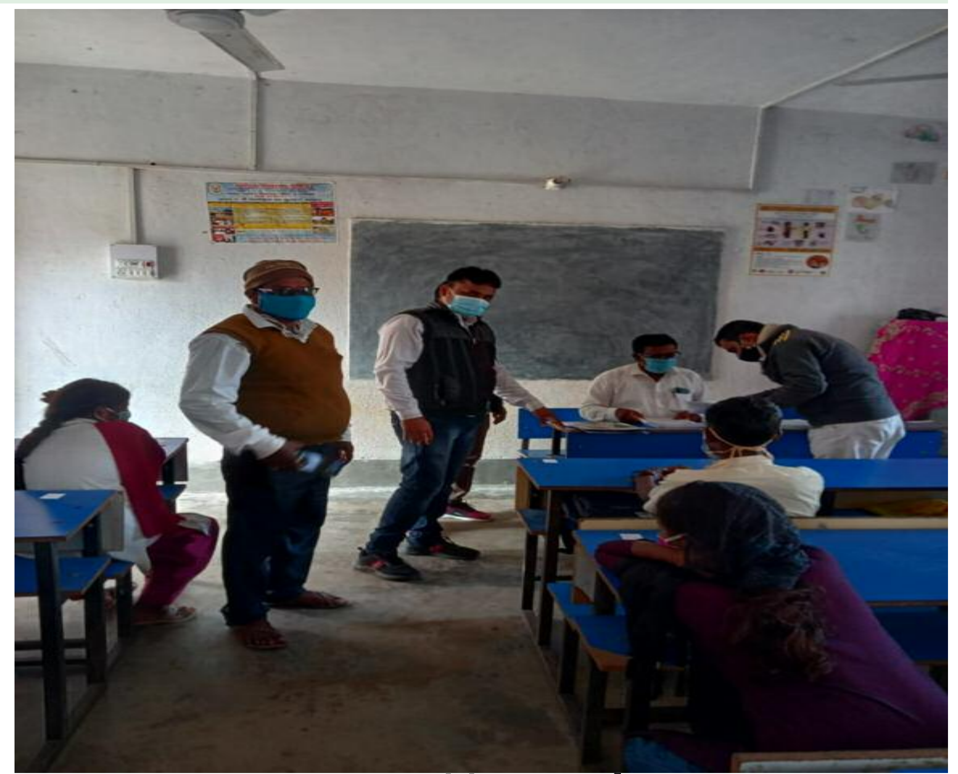
परीक्षा देते परीक्षार्थी

प्रखण्ड के विभिन्न सरकारी, मान्यता प्राप्त व निजी विद्यालयों में शुक्रवार को राष्ट्रीय उपलब्धि सर्वेक्षण का आयोजन किया गया राष्ट्रीय उपलब्धि सर्वेक्षण के लिए बरकट्टा प्रखण्ड से 15 स्कूलों का चयन किया गया जिसमें कक्षा 3,5,8 एवं 10 वीं के आंकलन के उद्देश्य से नमूना आधारित राष्ट्रीय उपलब्धि सर्वेक्षण (एनएस) किया गया प्रखण्ड में एनएस के लिए छोटानागपुर हाई स्कूल बेडो. कला, 30 मध्य विद्यालय चांद गढ़, रेसिडेंशियल पब्लिक स्कूल बेडो. कला, 30 मध्य विद्यालय तुईयो, 30 मध्य विद्यालय शिलाडीह, 30 म0 विद्यालय जवारपहापुर, कन्या 30 उच्च विद्यालय बेलकपी, बेसिक स्कूल बेलकपी, प्रोजेक्ट कन्या उच्च विद्यालय बरकट्टा, प्रोजेक्ट हाई स्कूल गैड़ा, 30 म विद्यालय तुर्कबाद, मदर्सा कोनहारा, 30 म0 विद्यालय कोनहारा, बाल श्रमिक विद्यालय बण्डा सिंघा समेत 15 केंद्रों पर शिक्षा के स्तर, भौ. तिक स्थिति व विद्यालय प्रबंधन का सर्वेक्षण किया गया इस सर्वेक्षण में 510 छात्र व लगभग 75 शिक्षकों ने भाग लिया इस कार्य में सीआरपी बीआरपी बतौर फील्ड इन्.