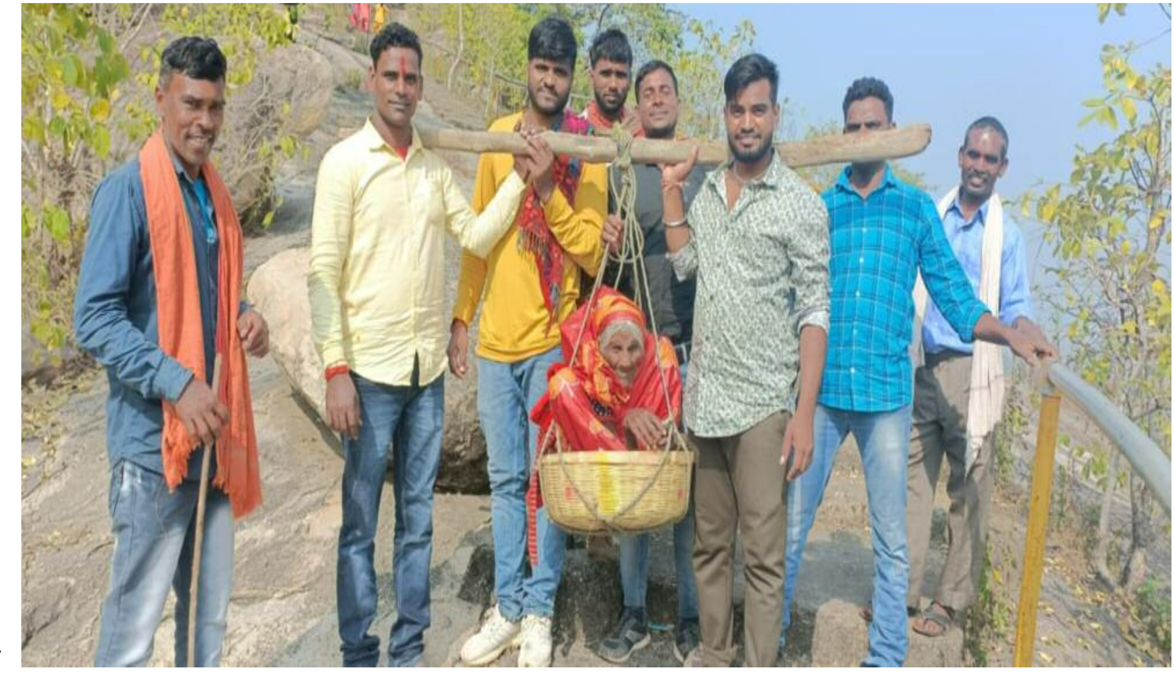
माता पिता को दर्शन के लिए ले जाते परिजन