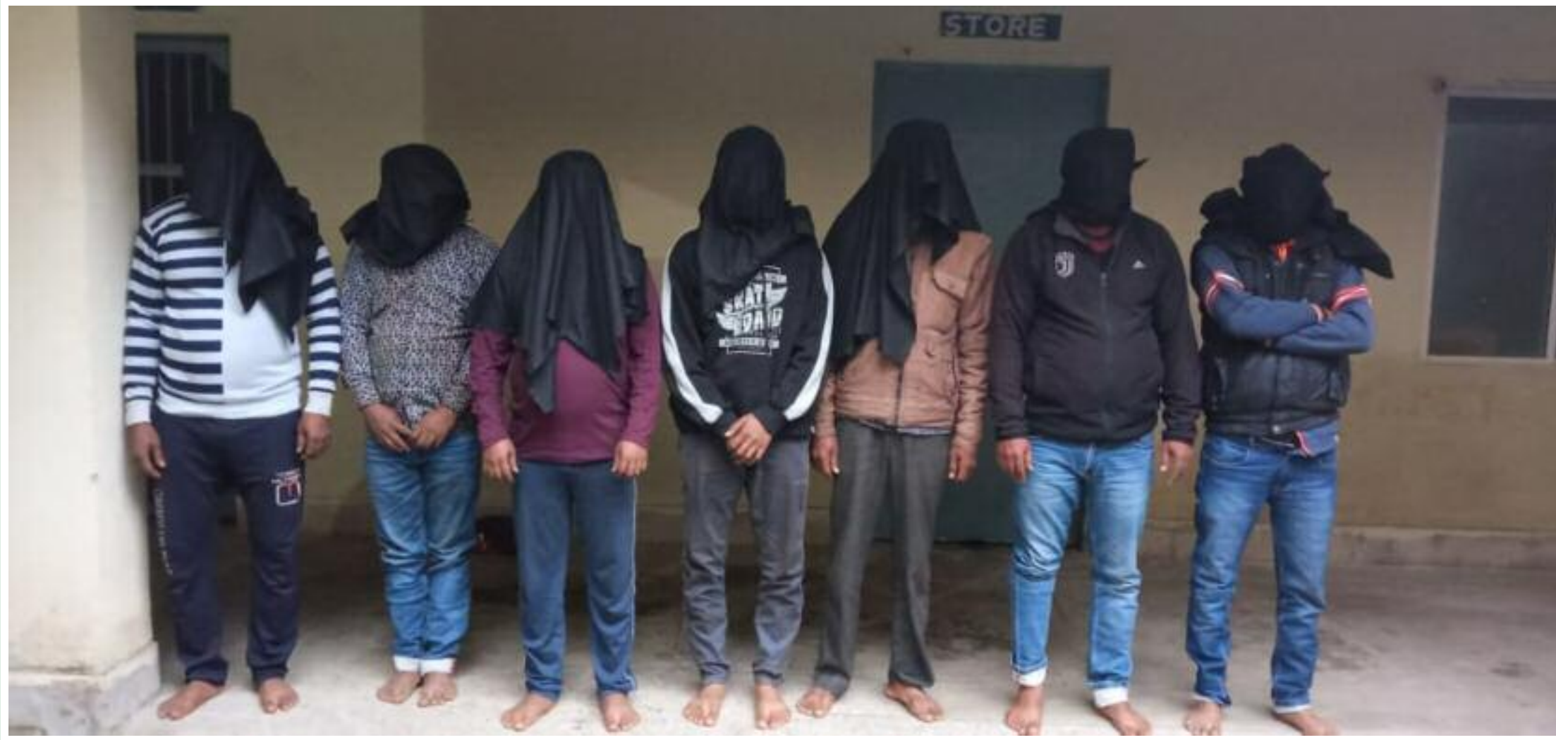
गिरफ्तार किए गए हथियार तस्कर