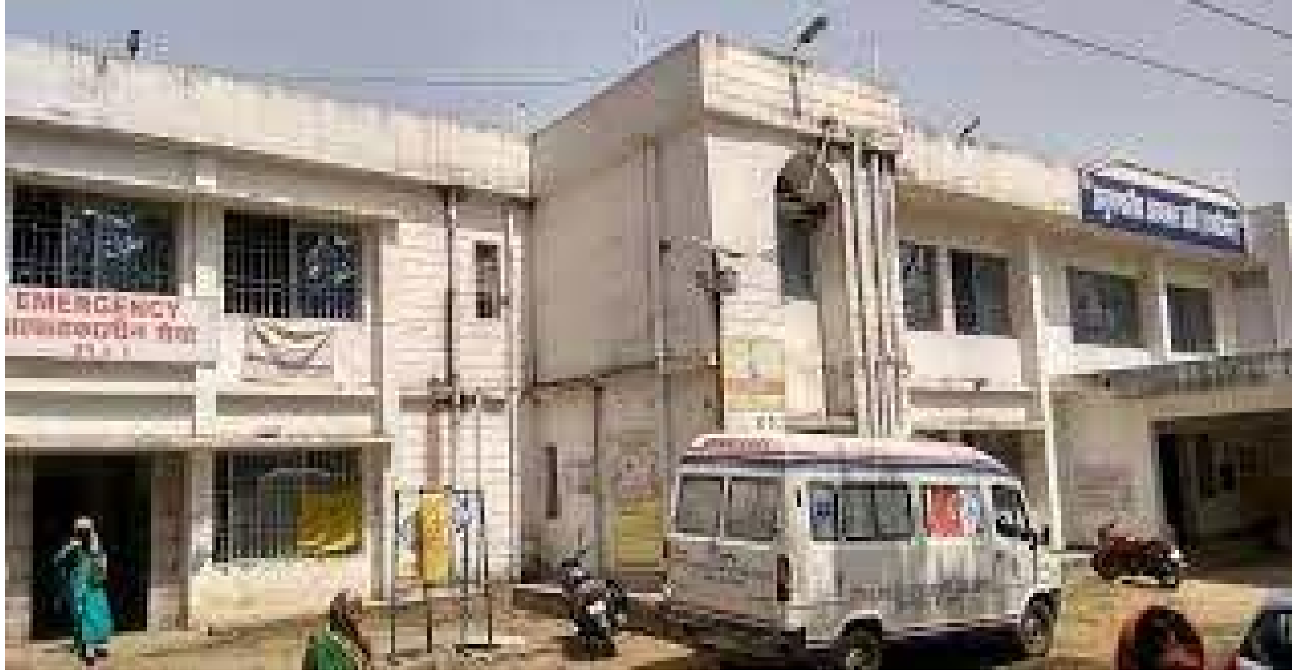
बरही अनुमंडलीय अस्पताल

फण्ड का रोना रोने वाला अनुमंडलीय अस्पताल बरही को फण्ड उपलब्ध होने के बाद भी अब तक सविदा कर्मियों को मानदेय मिल पाया है और न ही सहिया एवं वीएलई को इंसेंटिव मिल पाया है। जिसके कारण स्वास्थ्यकर्मियों को काफी फजीहत उठानी पड़ रही है। एक सप्ताह फण्ड अलॉट हो गया है। बावजूद पिछले तीन माह से एनएचएम कर्मियों को मानदेय नहीं मिल पाया है। वहीं पिछले आठ माह से सहिया को उनका इंसेंटिव नहीं मिल पाया है। इतना ही नहीं कोरोना काल में जान जोखिम में डालकर कोविड वैक्सीनेशन कार्य में डाटा एंट्री