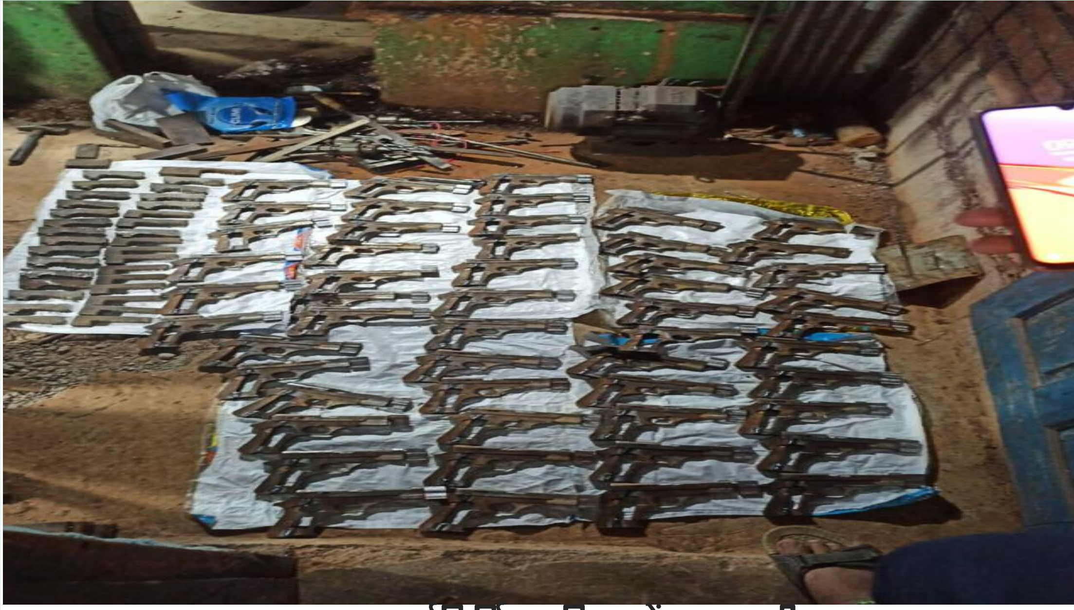
बरामद अर्द्धनिर्मित हथियारों का जखीरा

विष्णुगढ़ थाना से महज दो सौ मीटर की दूरी पर एनएच 100 किनारे सातमील मोड़ में जमुनियां नदी के पास एक पक्के मकान में अवैध संचालित आर्म्स फैक्ट्री का भंडाफोड़ हुआ है। इस फैक्ट्री से बड़ी मात्रा में अर्द्धनिर्मित हथियारों का जखीरा बरामद किया गया है। गुप्त सूचना पर बिहार से पहुंची एसटीएफ टीम ने विष्णुगढ़ पुलिस के सहयोग से यह कार्रवाई की। इस अवैध धंधे में शामिल सात तस्करों को मौके पर से गिरफ्तार किया गया। इनमें बोकारो जिला के तीन तथा बिहार के मुंगेर जिला के चार तस्कर शामिल हैं। इसमें एक कुख्यात हथियार तस्कर है। बताया जाता है कि गिरफ्तार किए गए तस्करों का नेटवर्क झारखंड से लेकर बिहार तक फैला हुआ है। इन दिनों बिहार के मुंगेर जिला में कई अवैध आर्म्स फैक्ट्री संचालित है। इनका कनेक्शन झारखंड के भी हथियार तस्करों से है। बिहार एसटीएफ ने कुछ इसी तरह का खुलासा किया है। दरअसल मुंगेर के हथियार तस्करों की निशानदेही पर विष्णुगढ़ में छापेमारी की गई। जिसमें