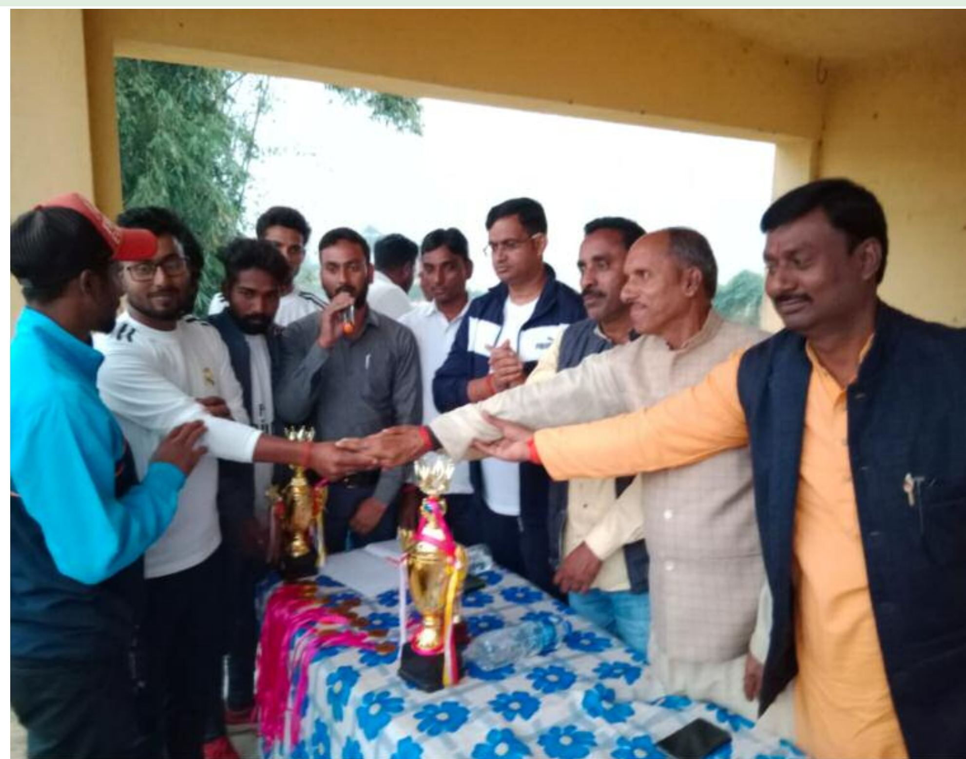
विजेता टीम को पुरस्कृत करते जन प्रतिनिधि