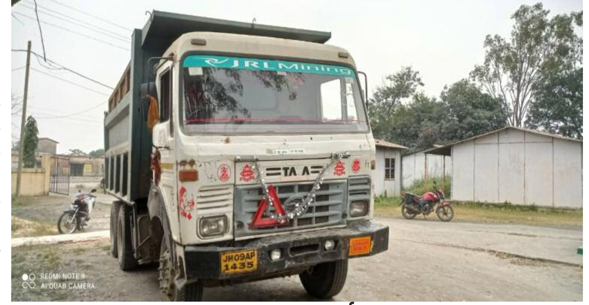
पकड़ा गया हाईवा

थाना के समीप बिना वैध काग. जात- चालान के गिद्दी परिवहन करने वाले एक हाईवा को चंदवारा अंचलाधिकारी रामरातन बरनवाल ने जप्त कर चंदवारा थाना को सुपुर्द कर दिया तथा इसकी सूचना जिला खनन पदाधिकारी कोडरमा को आवश्यक कार्यवाही हेतु भेजा। उक्त हाईवा जेएच 09 एपी/ 1435 ढाब थाम से गिद्दी लोड कर कोड. रमा की ओर जा रहा था। इस दौरान क्षेत्र भ्रमण के लिए निकले अंचलाधिकारी ने वाहन को रोककर चालान नही दिखाया गया। चालान की मांग किया। वाहन तत्पश्चात अंचलाधिकारी द्वारा