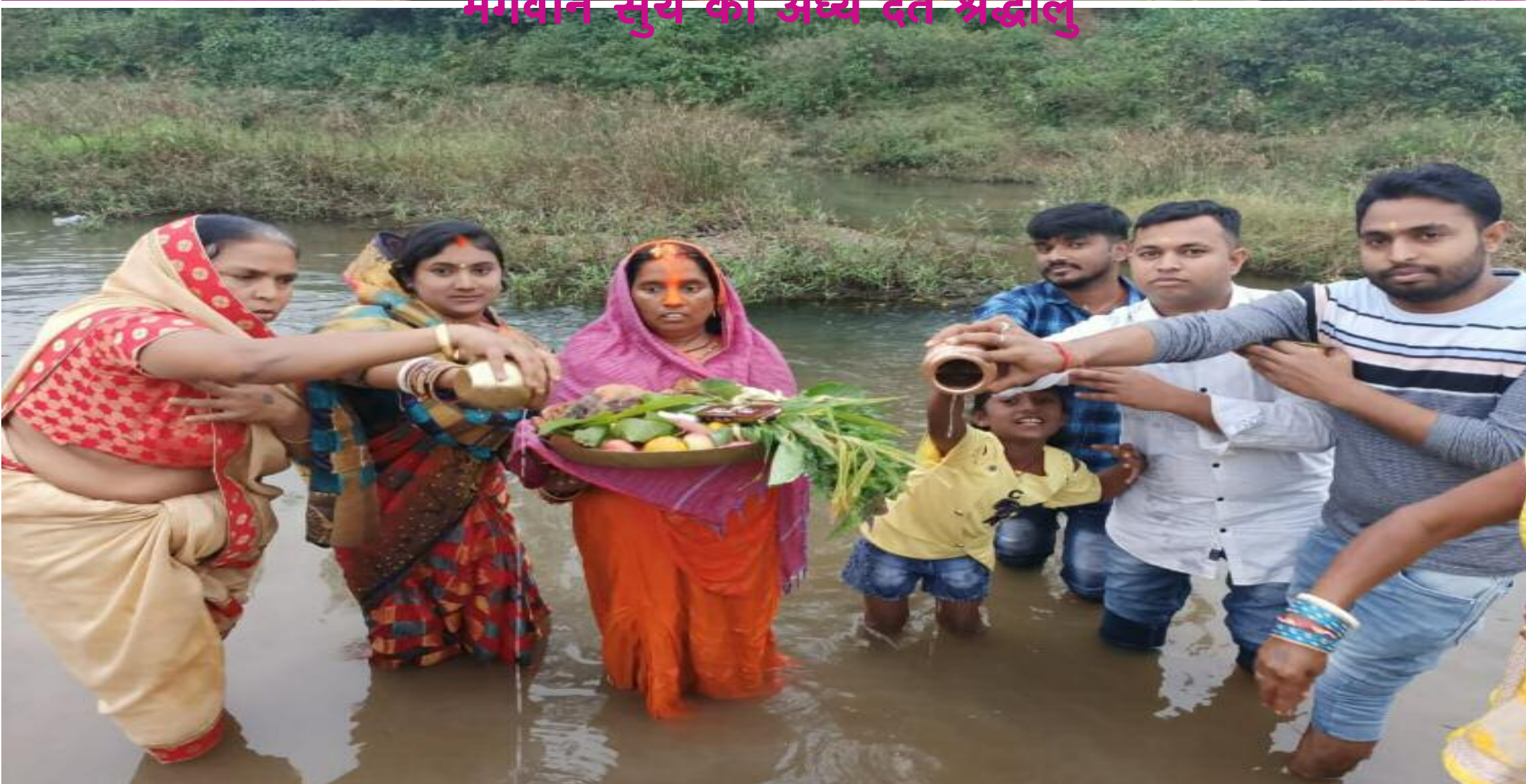
पर्व भी कहते हैं जो पूरे आस्था के साथ संपन्न हुआ।