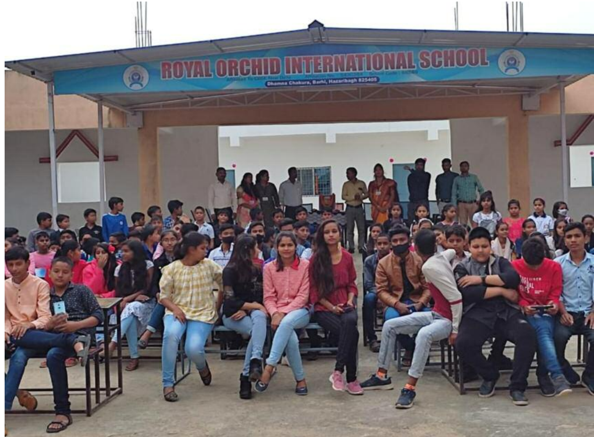
कार्यक्रम में मौजूद बच्चे