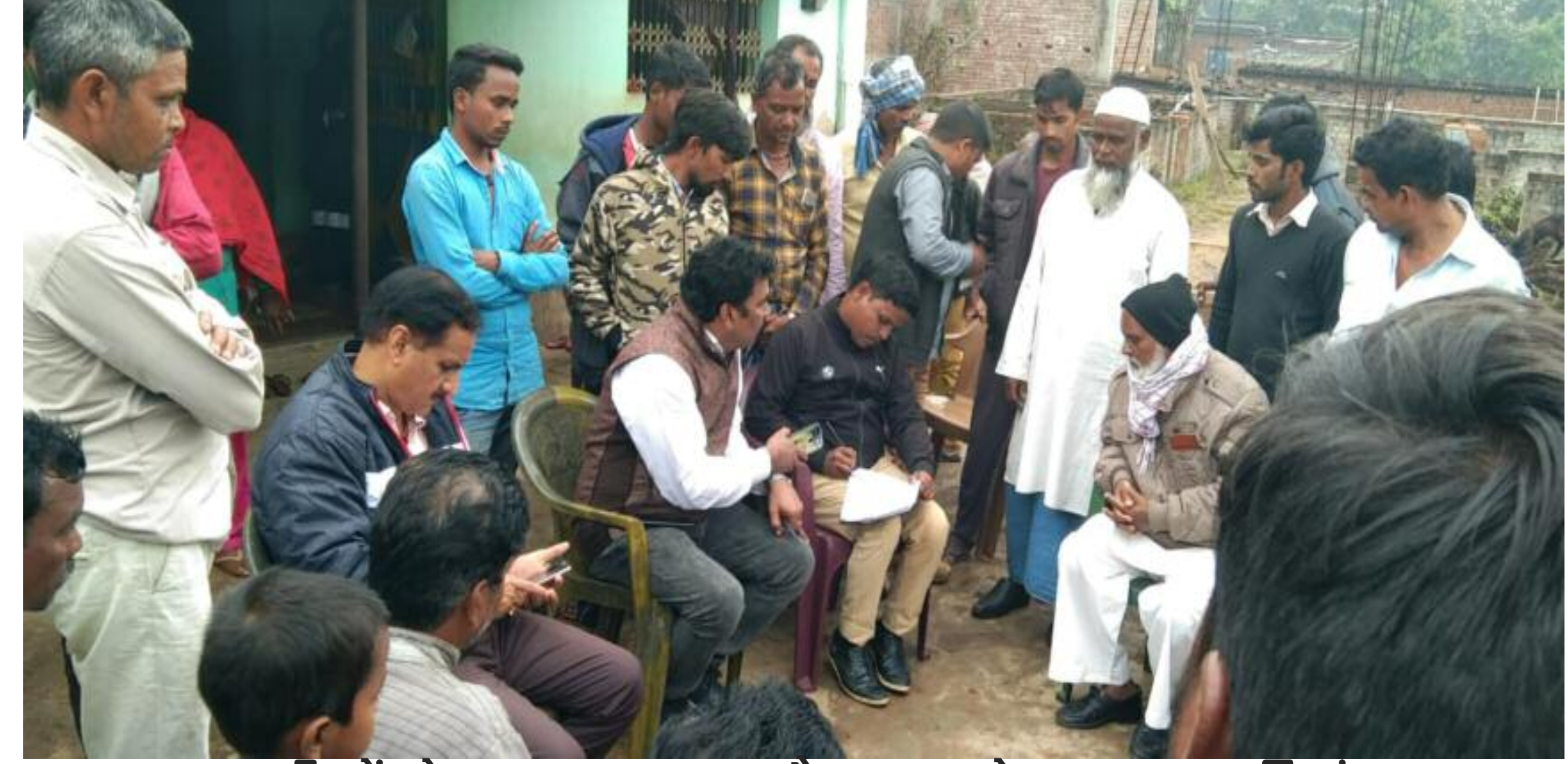
ग्रामीणों के साथ प्राक्कलन तैयार करते सहायक अभियंता