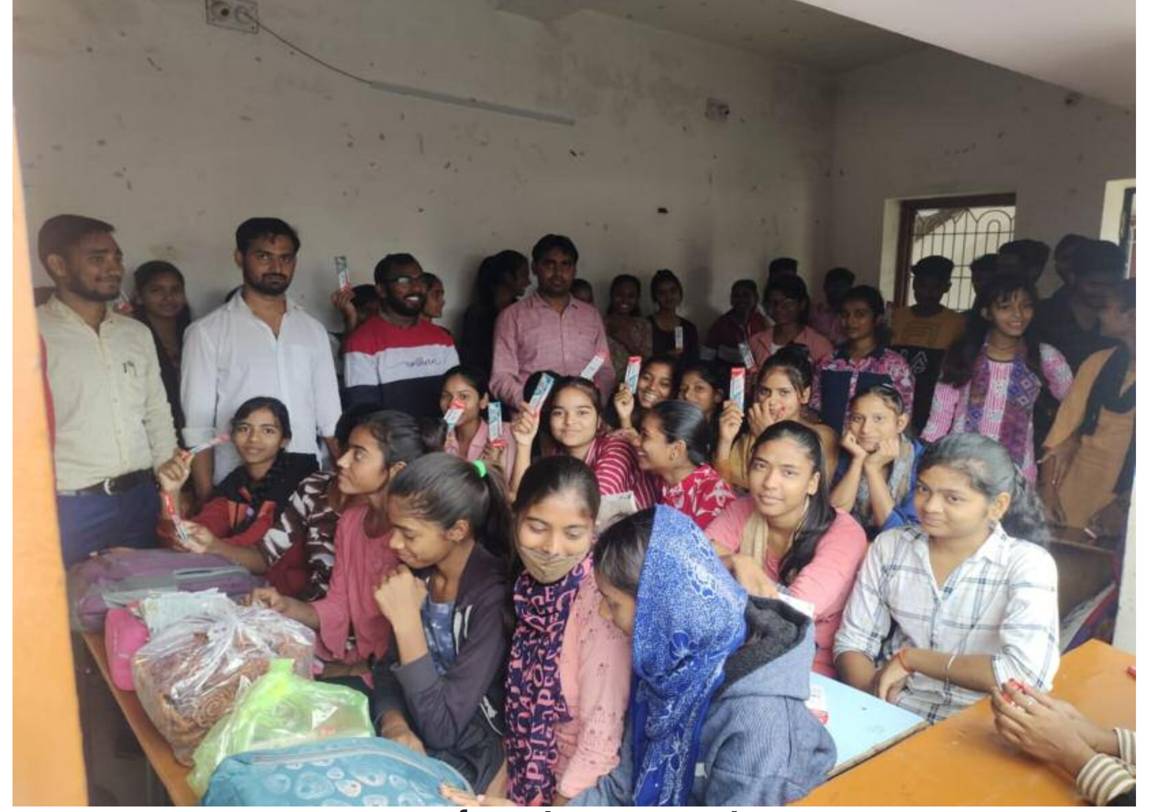
कार्यक्रम में शामिल बच्चे