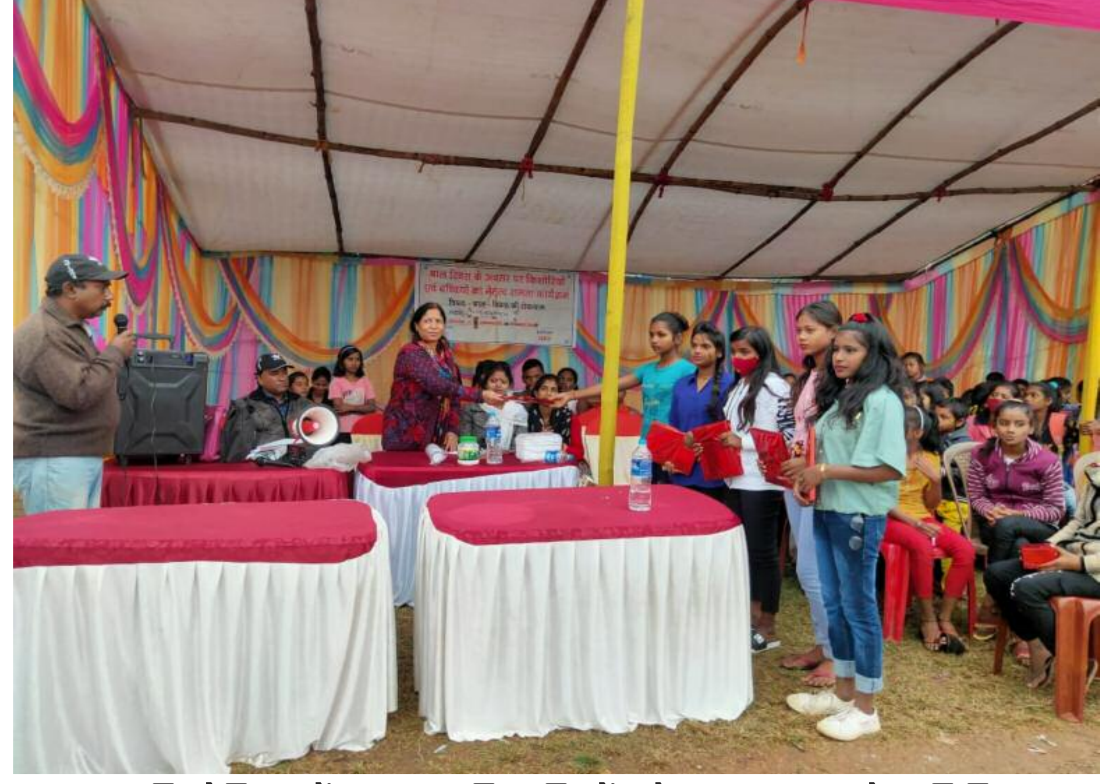
प्रतियोगिता में सफल प्रतिभागियों को पुरस्कृत करते अतिथि