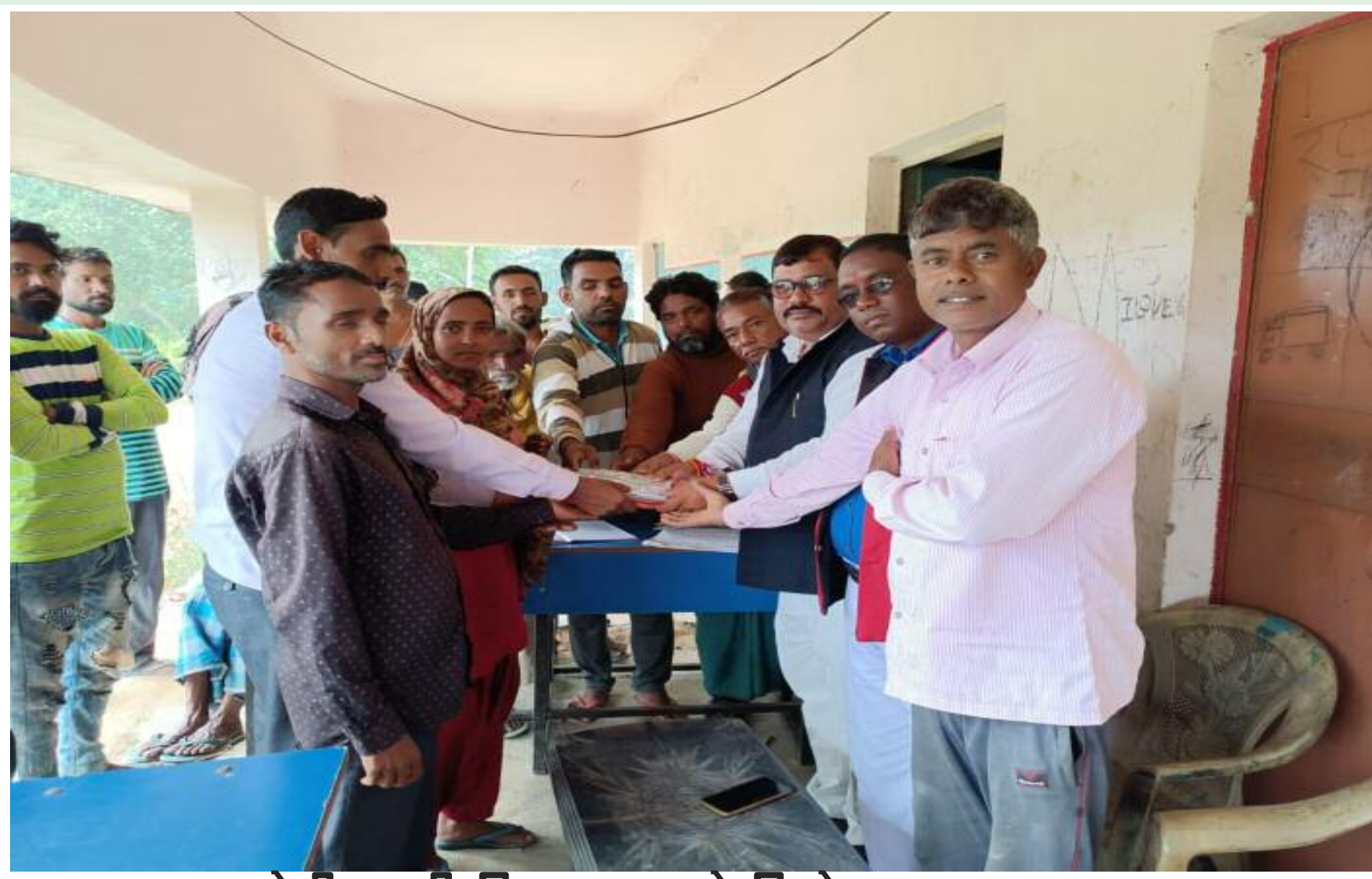
धोती साड़ी वितरण करते बिनोद यादव व अन्य

सोना सोबरन योजना के तहत केदारुत पंचायत के घियाही गांव में धोती, साड़ी एवं लुंगी वितरण कार्यक्रम का आयोजन किया गया। बतौर मुख्य अतिथि विधायक प्रतिनिधि विधान सभा बिनोद कुमार यादव ने 50 लाभुकों के बीच धोती, साड़ी एवं लुंगी का वितरण किया। इस अवसर पर उन्होंने कहा कि चुनाव पूर्व किए गए घोषणा के अनुरूप सरकार गरीबों को वस्त्र उपलब्ध करवा रही है। जिससे गरीबों को काफी राहत मिल रही है। सरकार ने जितने भी वायदे चुनाव के दौरान की है। सभी वायदे पूरे किए जा रहे हैं। यह सरकार गरीबी की सरकार है। मौके पर जिला महासचिव सह विधानसभा विधायक प्रतिनिधि बिनोद यादव, मो