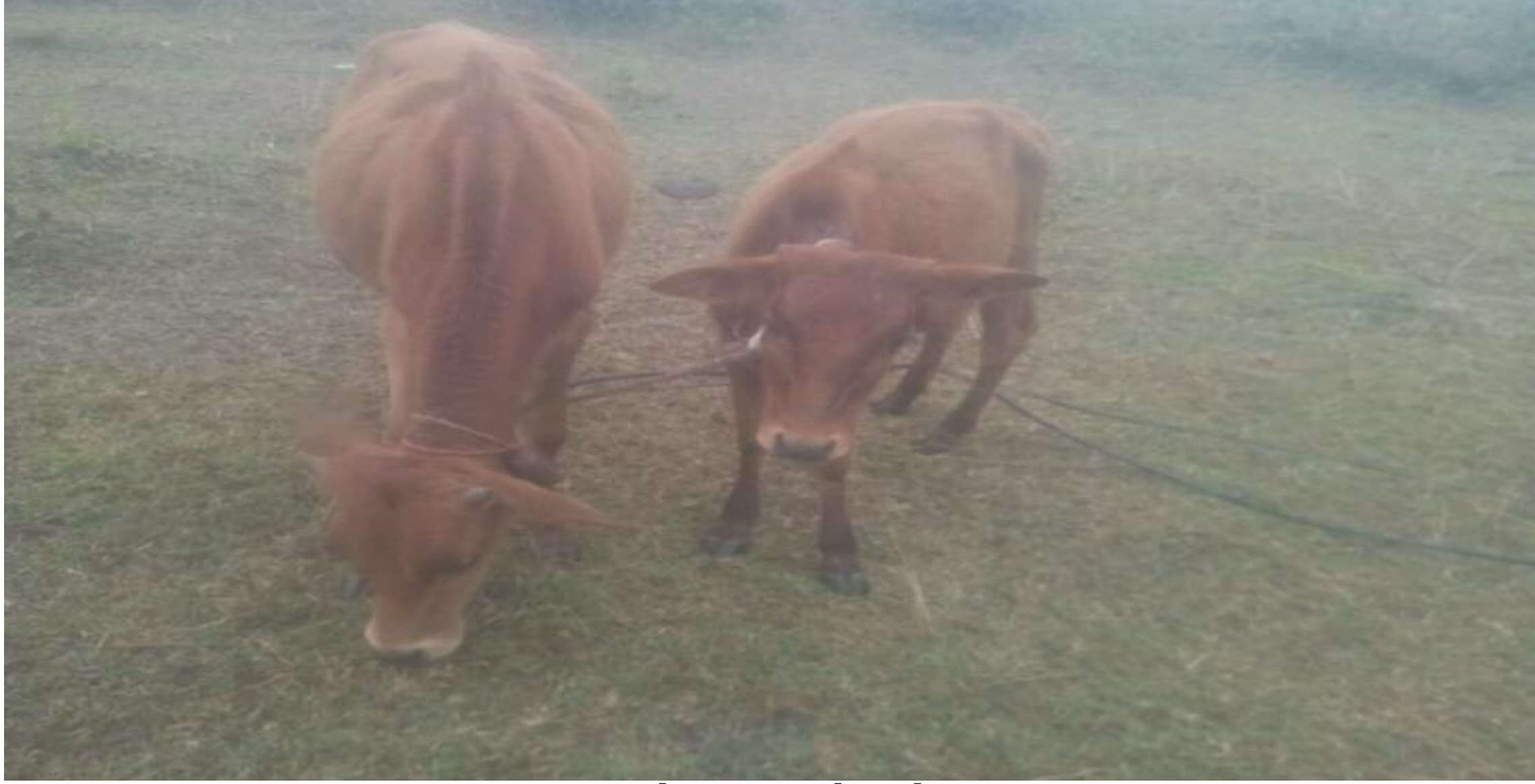
ठंड से सिकुड़ते मवेशी

झमाझम बारिश से बढ़ा दी ठंडा। शनिवार को दिन व रात में भी लगातार मु. सलाधार बारिश और दूसरे दिन में दिनभर कोहराम और हल्की बारिश से ठंड को बढ़ा दिया है। यह मु. सलाधार बारिश से पूर्व, ठंड बहुत कम में अनुमान लगाया जा रहा था। लेकिन झमाझम बारिश ने ठंड बढ़ावा दिया है। बारिश से पूर्व लोगों को बिन स्वेटर पहन देखा जा रहा था, लेकिन यह झमाझम बारिश ने लोगों की हालत गंभीर कर दी है। प्रखण्ड के अंतर्गत अनेकों जगहों पर बारिश के बाद अब आग में तापते हुए लोगों को देखा