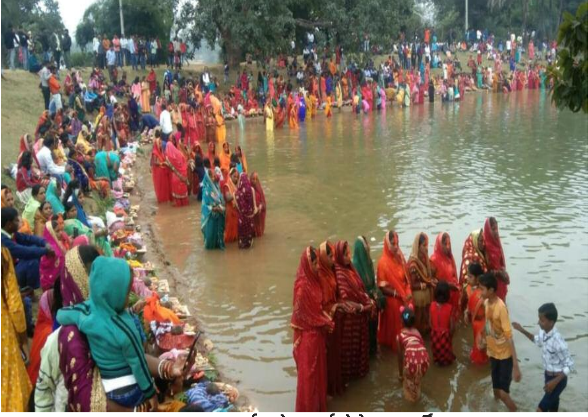
भगवान सूर्य को अर्घ्य देते छठवर्ती

लोक आस्था का तीन दिवसीय इतवारी छठ अस्ताचलगामी सूर्य को अर्घ्य अर्पित करने के साथ रविवार को संपन्न हो गया। बरही के विभिन्न छठ घाटों में सैकड़ों छठप्रतियों ने अस्ताचलगामी सूर्य को अर्घ्य अर्पित किया। पर्व को लेकर घाटों में श्रद्धालुओं की भीड़ उमड़ी। वही दिन में बरही बाजार भी पूजन सामग्रियों से पटा रहा। लोग अपनी जरूरत के अनुसार सामानों की खरीददारी की। बरहीडीह छठ घाट, रसोइयाधामना छठ घाट, कोरियाडीह छठ घाट, बेहराबाद छठ घाट, गौरिकर्मा छठ घाट, विजैया छठ समेत अन्य छठ घाटों पर लोगों ने अर्घ्य दिया। इसके पूर्व निवास स्थलों से डाला में पूजन सामग्री लेकर घाटों महिलाएं घाटों में गईं। यहां सूर्य भगवान की अराधना कर अर्घ्य अर्पित की। इस अवसर पर छठ मंड्या के गीतों से शहर गुंजायमान होता रहा। छठप्रतियों ने कहा कि कहा कि पर्व को मनाने छठ पर्व मनाने का मुख्य