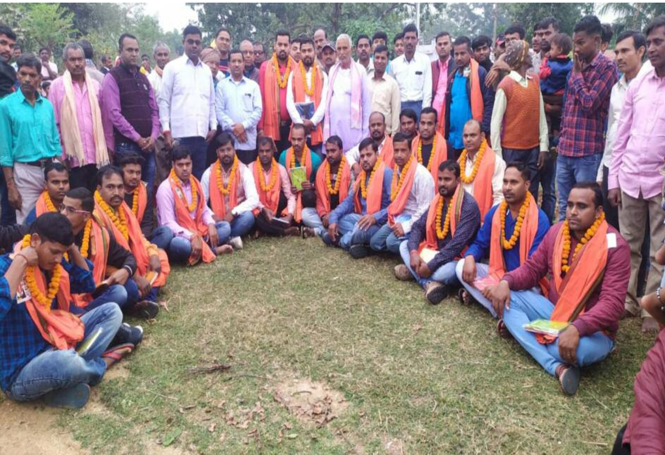
सम्मानित किये गये सदस्य