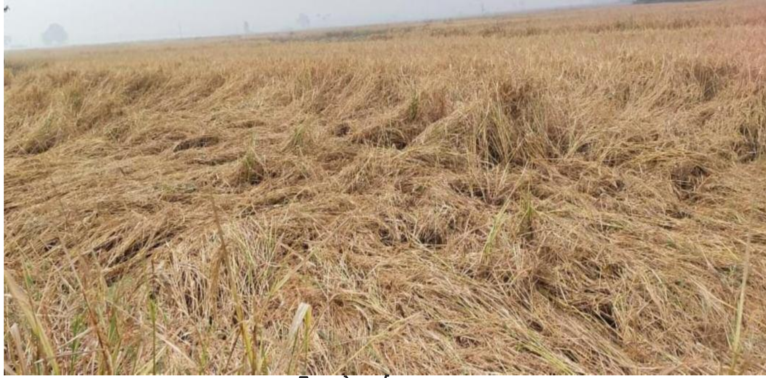
बारिश से बांदा हुआ फसल