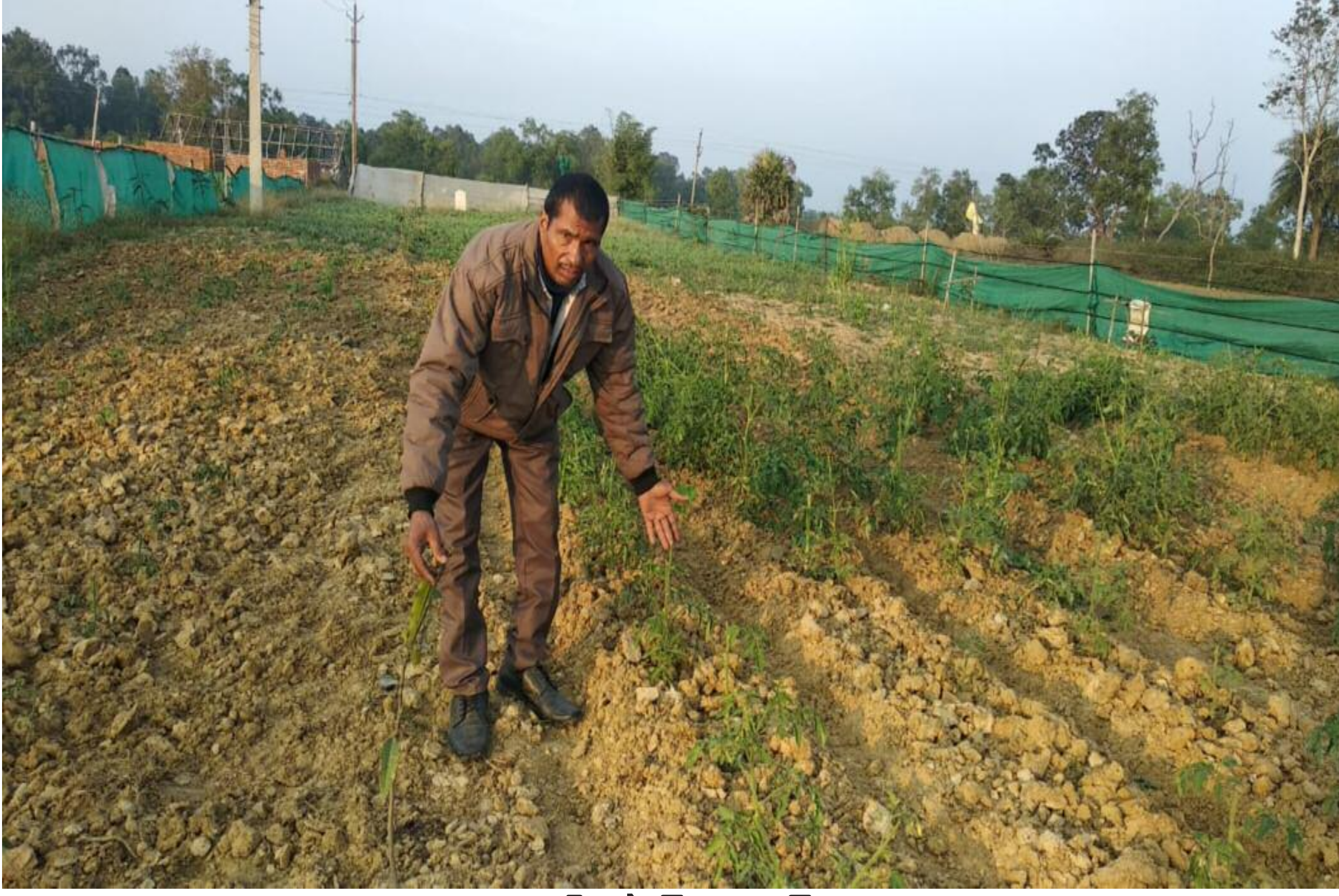
बागवानी को दिखाता किसान