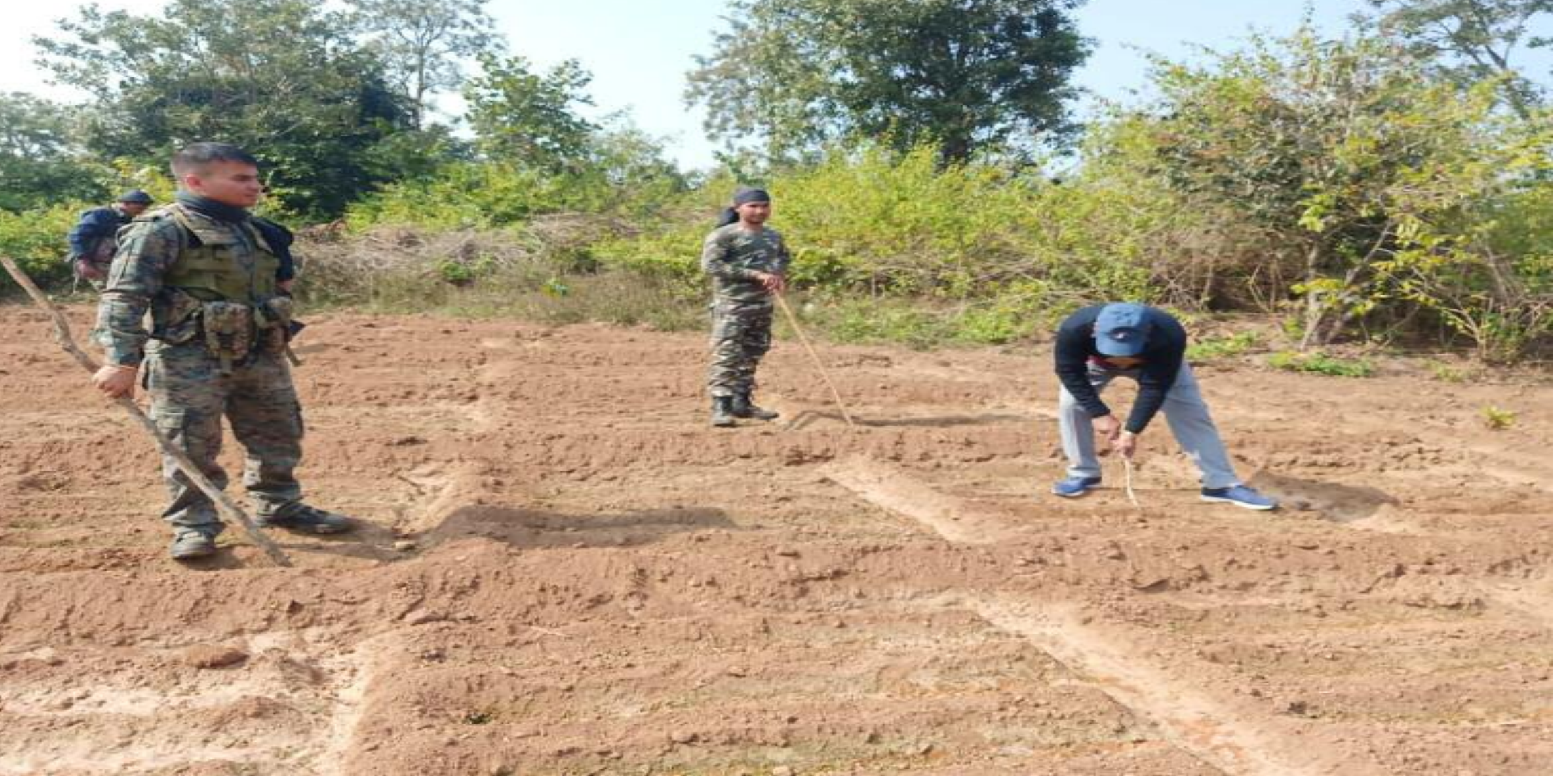
पोस्ता विरोधी अभियान चलाते