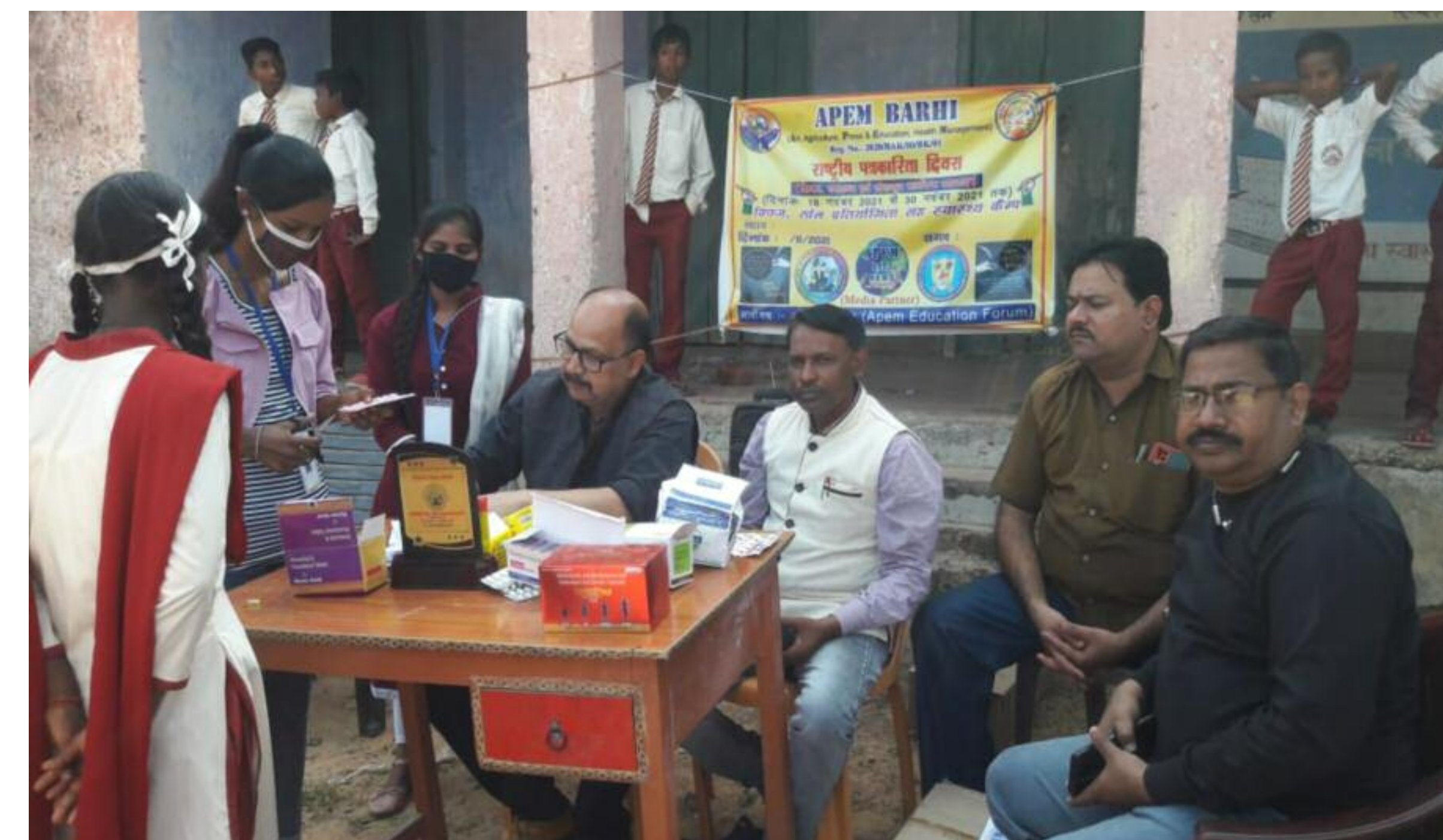
स्वास्थ्य जांच शिविर में जांच कराती स्कूली बच्चियां