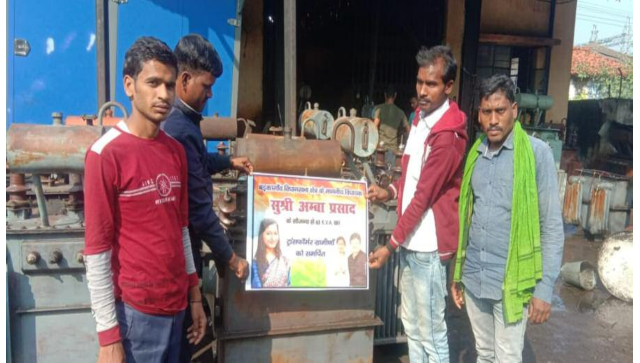
ग्रामीणों को उपलब्ध ट्रांसफार्मर

बड़कागांव प्रखंड अंतर्गत गरसुल्ला पंचायत के ग्राम लूरुंगा मे पिछले कई दिनों से ट्रांसफार्मर खराब होने की वजह से वहां के ग्रामीण अंधेरे में रहने के लिए बेबस थे मामला विधायक दिया गया जिसे विधायक संज्ञान लेते हुए विधायक ने तुरन्त 63 केवीए का ट्रांसफार्मर ग्रामीणों को उपलब्ध कराई इस अवसर पर विधायक अंबा प्रसाद ने कहा की क्षेत्र में किसी भी तरह की समस्या होने पर सीधा मुझसे संपर्क करें, ग्रामीणों की हर