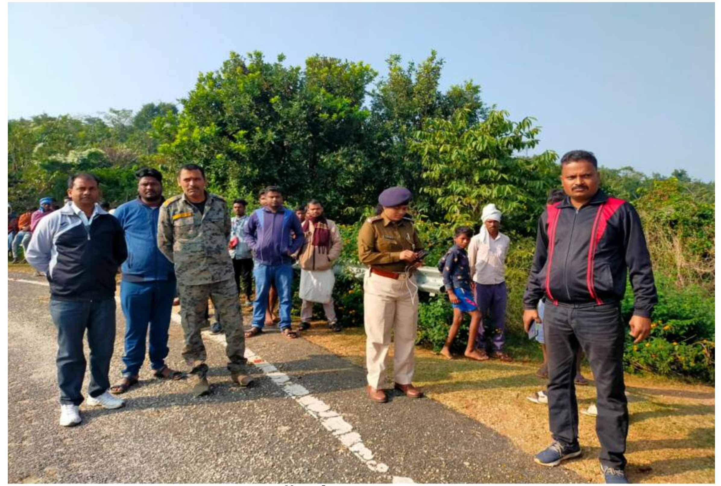
जाँच में जुटी प्रशासन