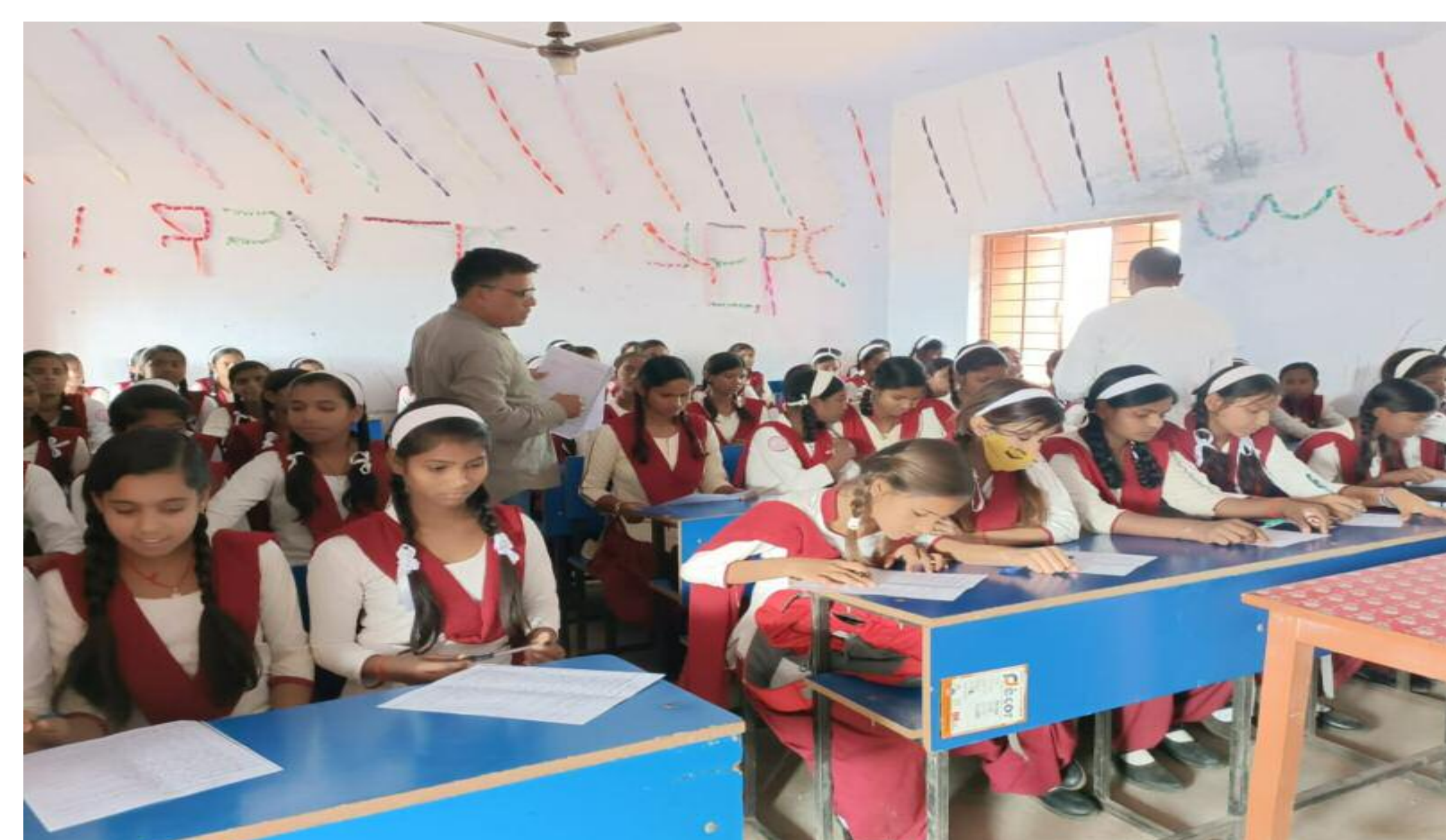
विज प्रतियोगिता में शामिल प्रतिभागी