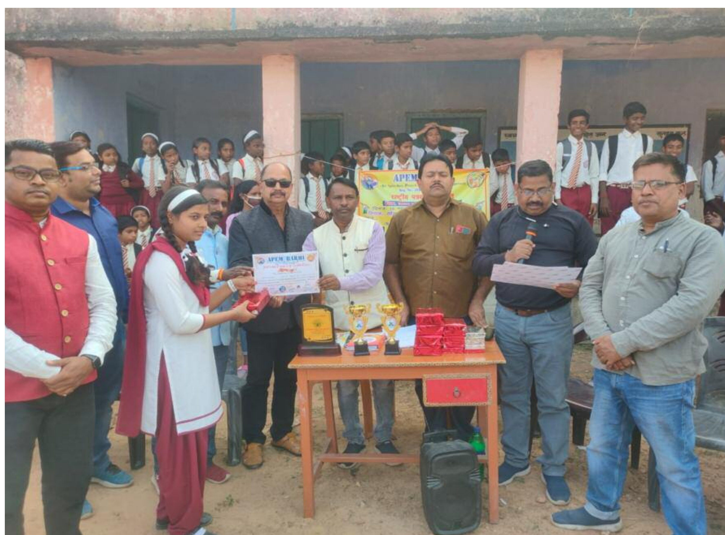
पुरस्कार वितरण करते अपेम के अधिकारी