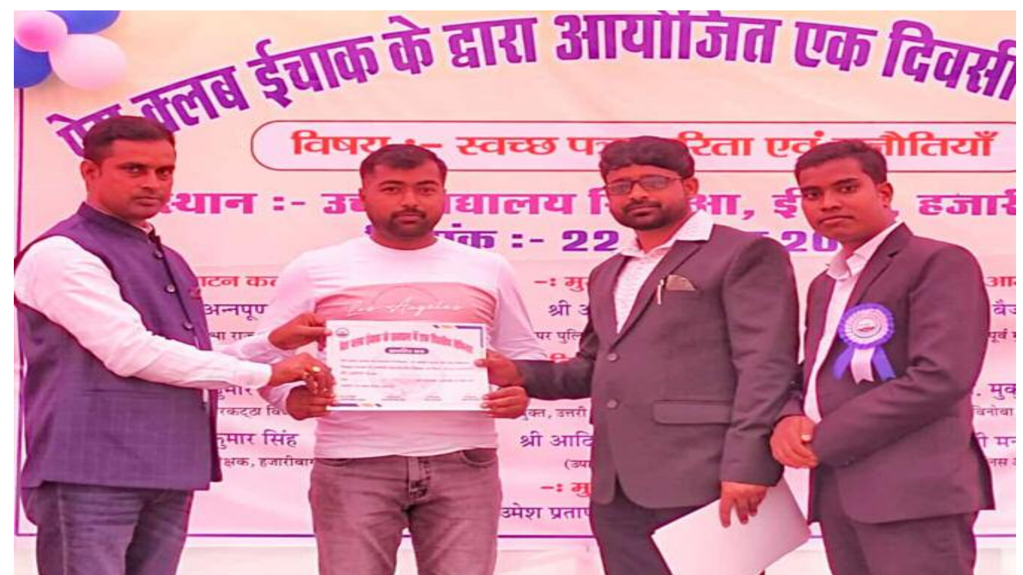
सम्मानित होते बरही अंचल के पत्रकार गण