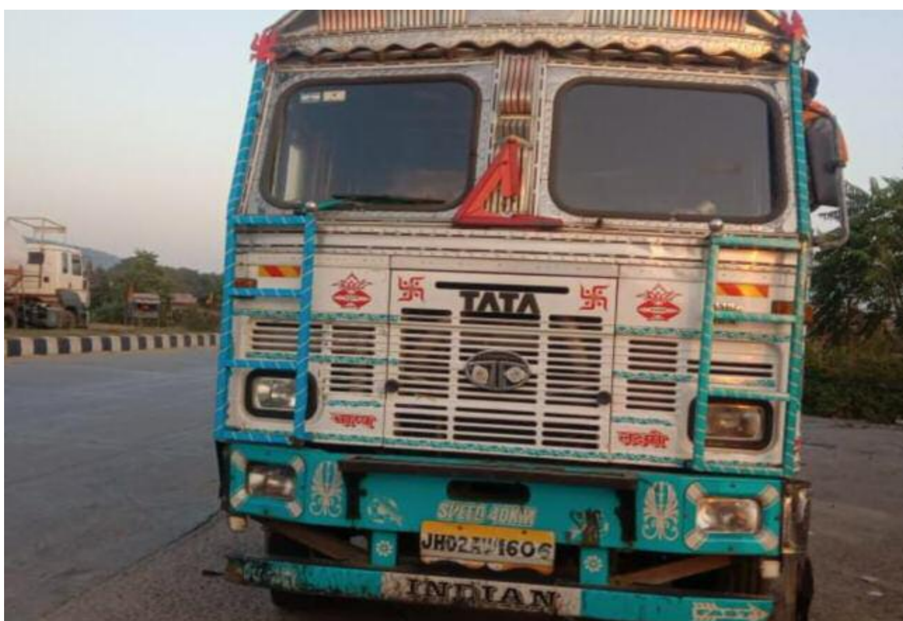
जप्त किए गए ट्रक