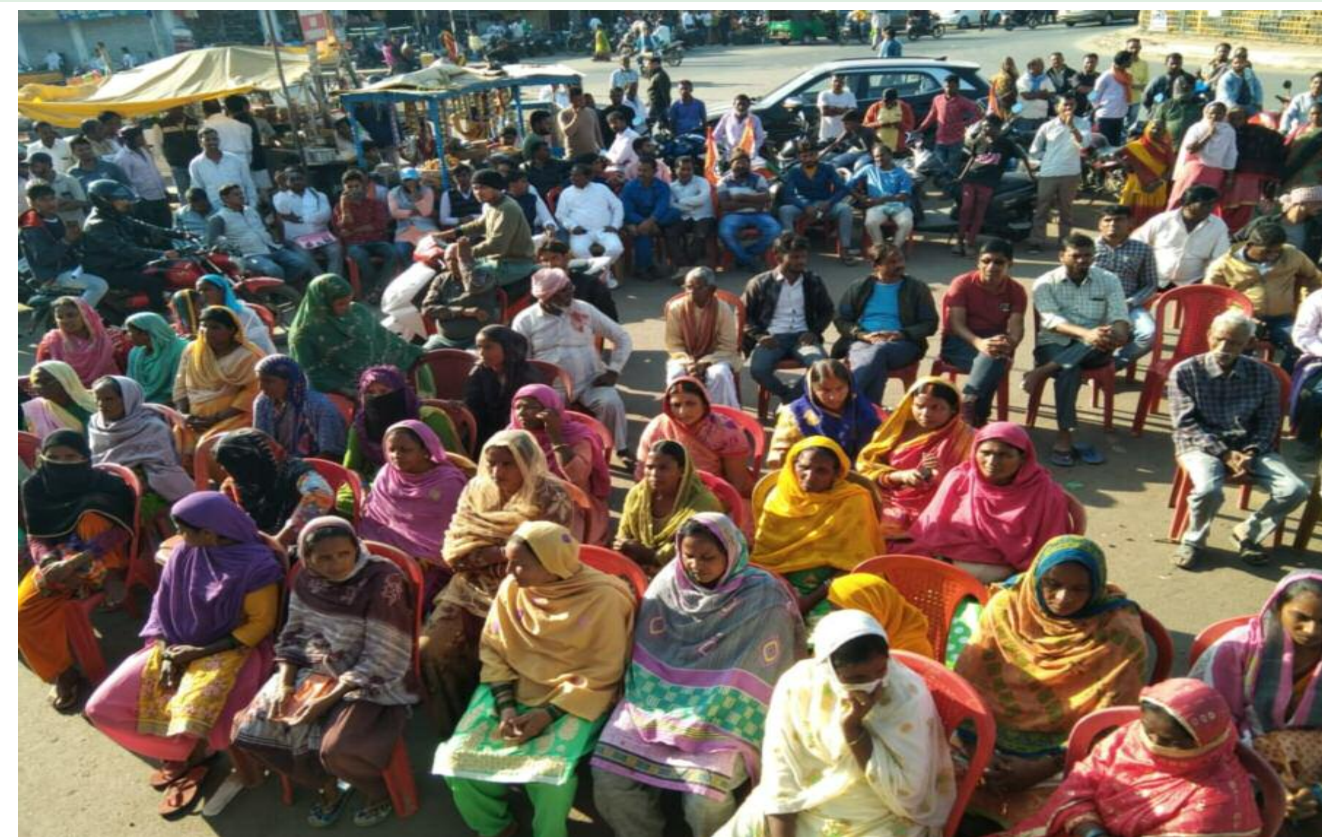
कार्यक्रम में उपस्थित लोग