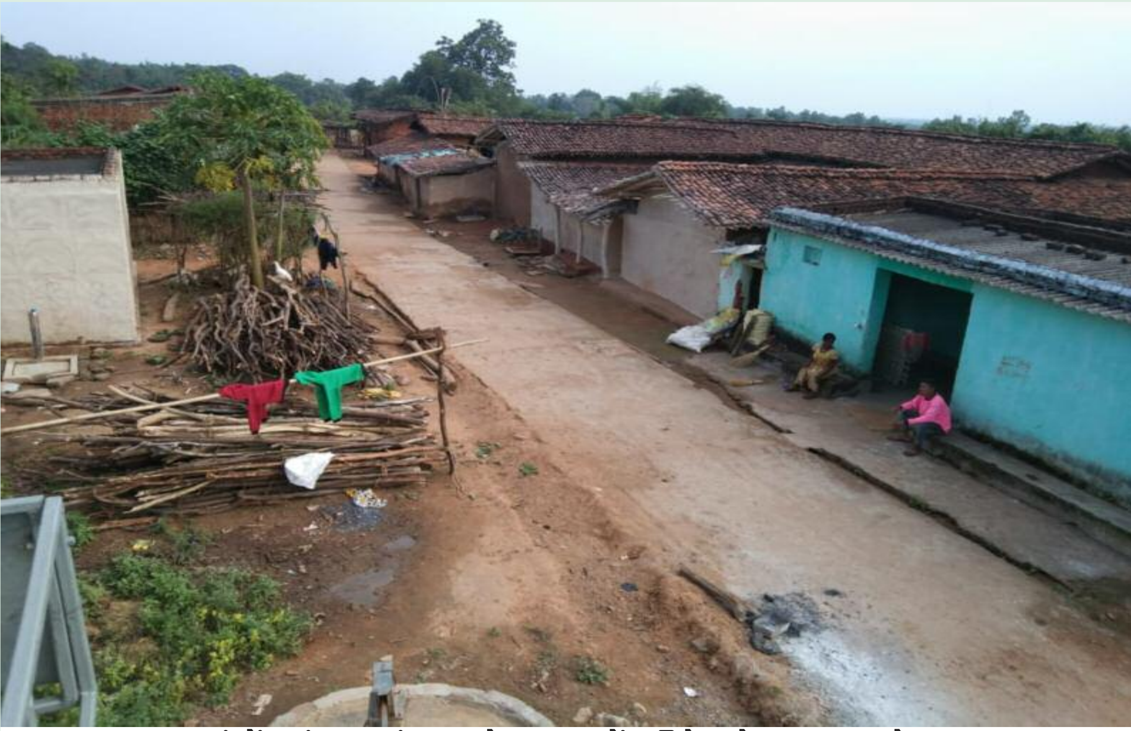
अंगों गांव जहां लालटेन युग में जीने को मजबूर लोग

यहां के किसान काफी मेहनती हैं परंतु बिजली नहीं होने से किसान बिजली उपकरण से खेती करने में असमर्थ रहते हैं। और ना ही आज डिजिटल युग में यहां के किसान बिजली उपकरण के जैसी टीवी, सिंचाई पानी मोटर, सोबाइल आदि का उपयोग नहीं कर पाते हैं। टीवी आदि का इस्तेमाल नहीं होने से सरकार के द्वारा चलाए जा रहे कई योजनाओं के जानकारी से ग्रामीण वंचित रह जाते हैं। किरासिन आदि तेल भी