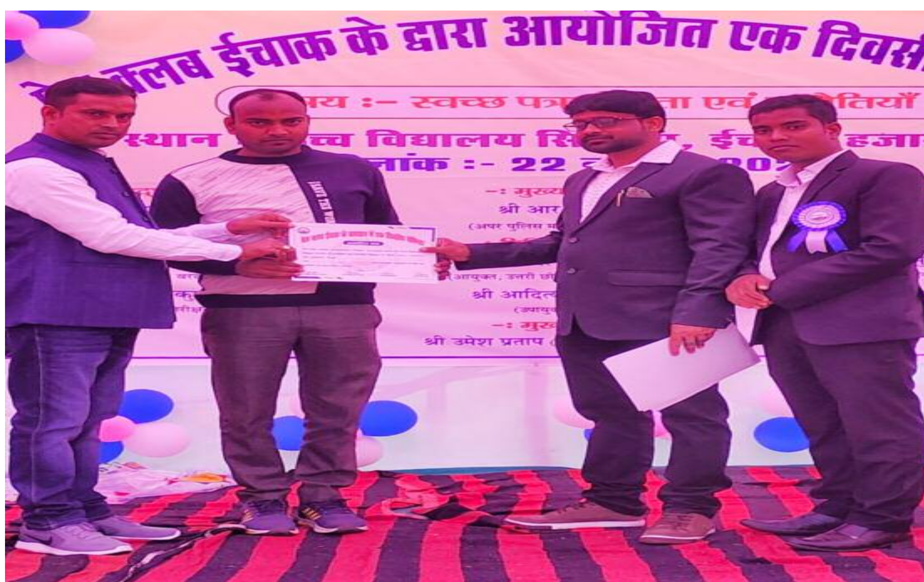
सम्मानित होते बरही अंचल के पत्रकार गण