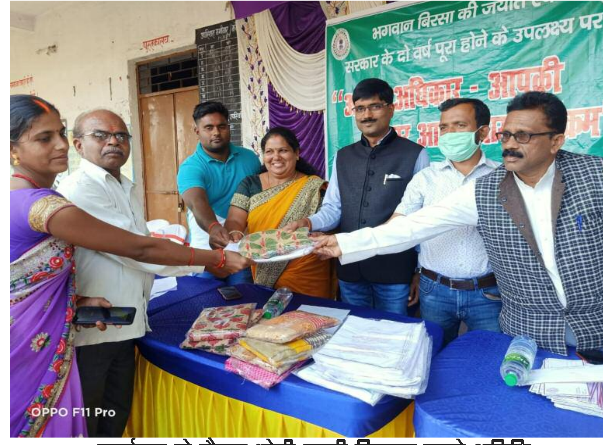
कार्यक्रम के दौरान धोती-साड़ी वितरण करते अतिथि