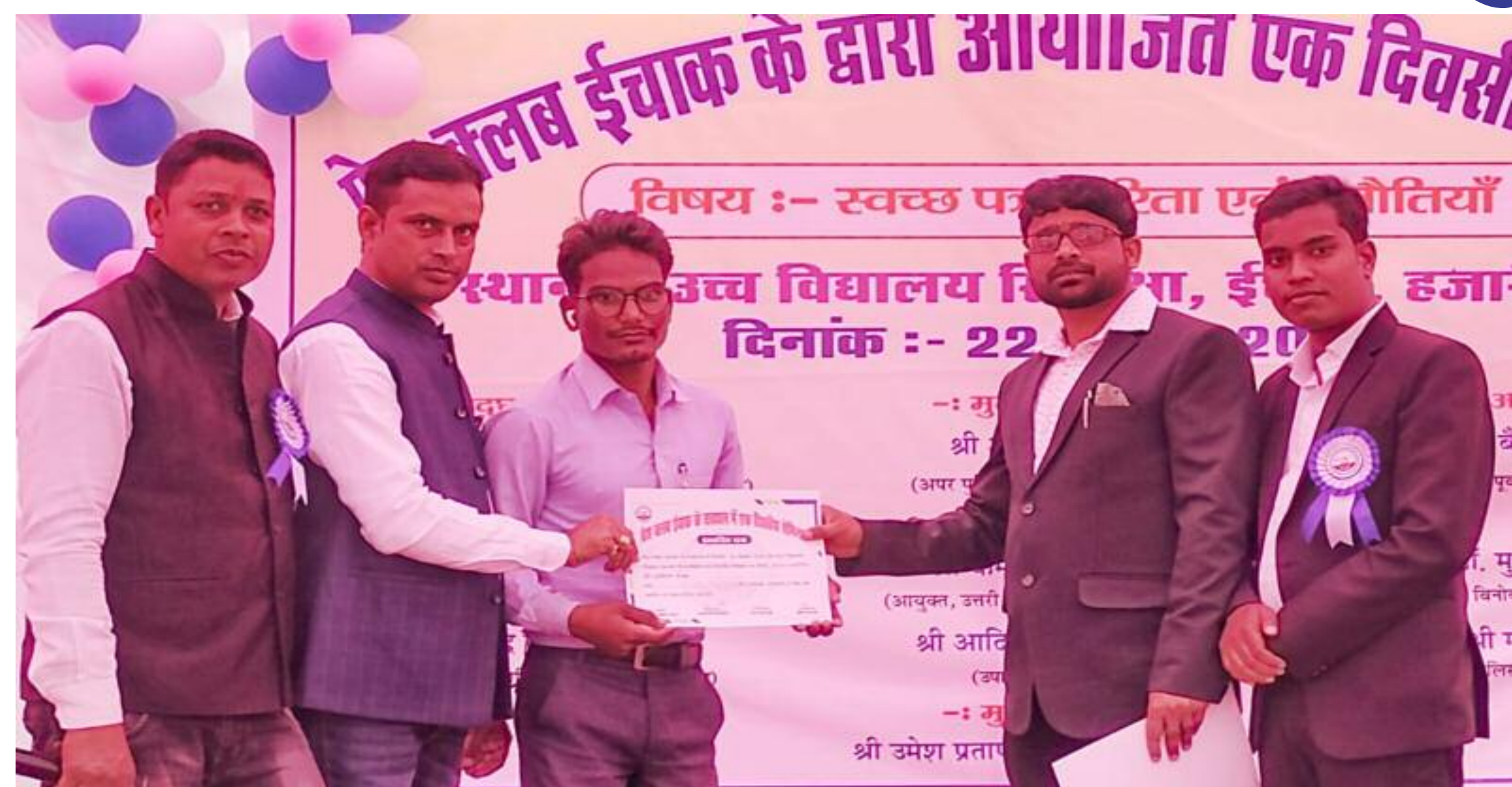
सम्मानित होते बरही अंचल के पत्रकार गण