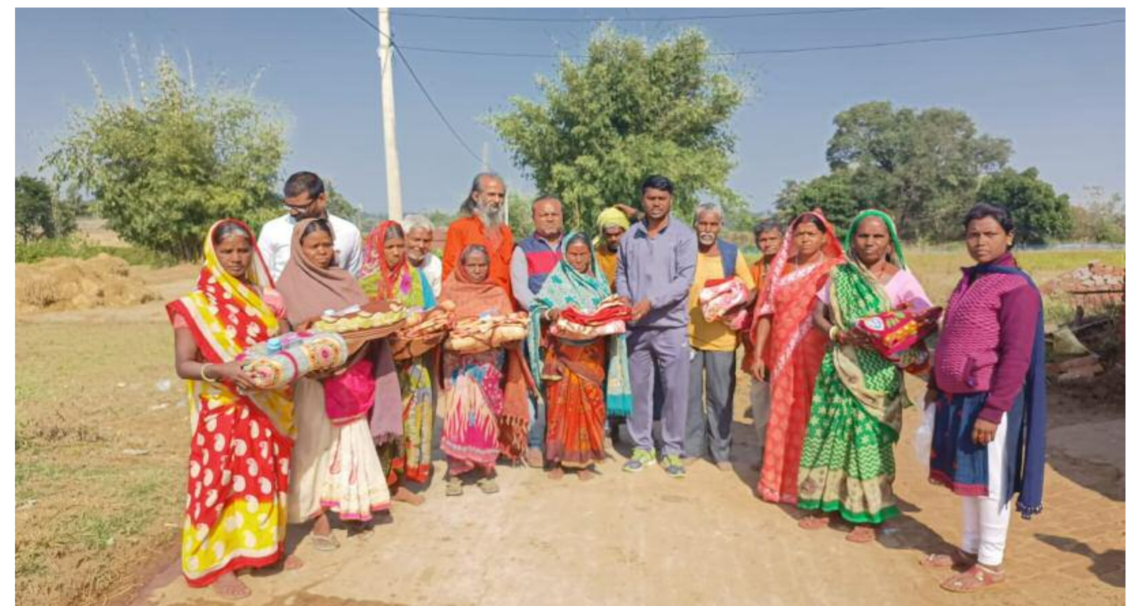
कंबल वितरण करते कार्यकर्ता