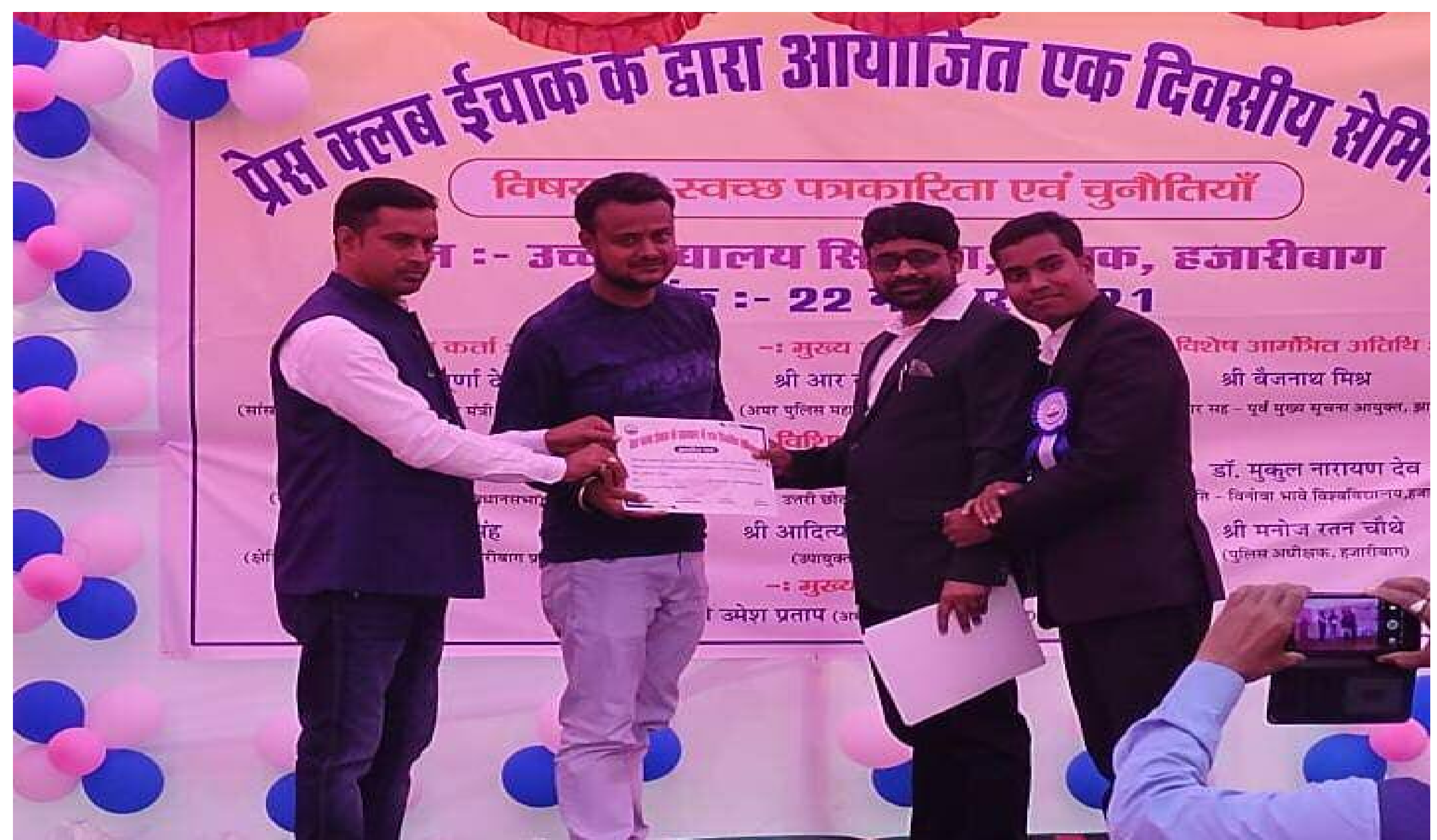
सम्मानित होते बरही अंचल के पत्रकार गण