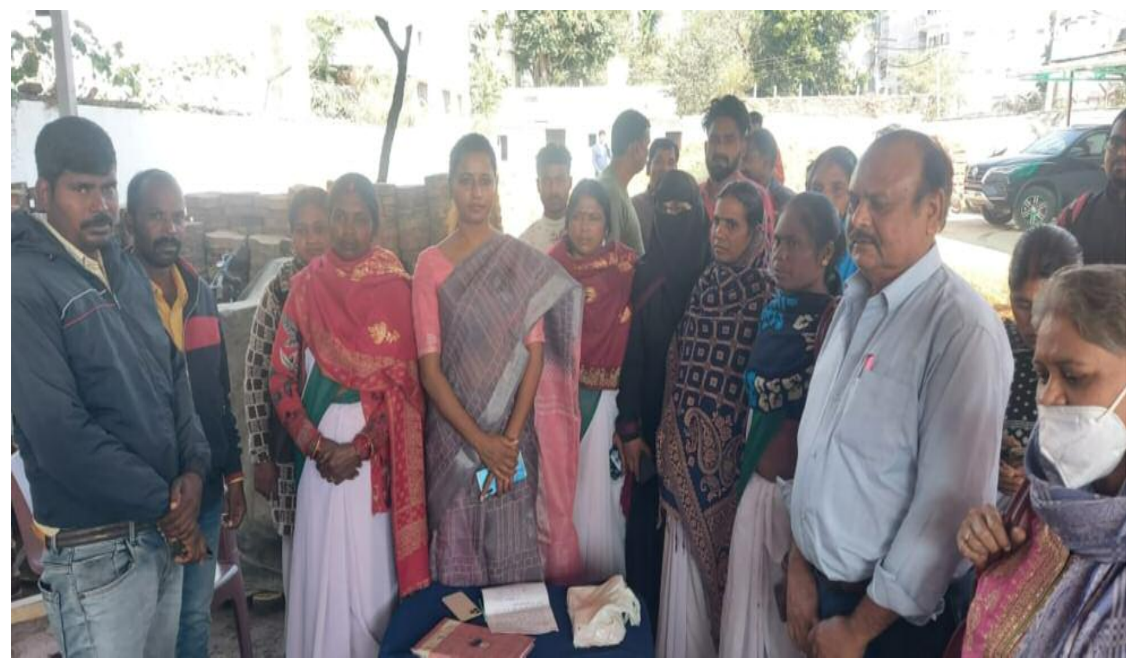
विधायक को आवेदन सौंपते ग्रामीण