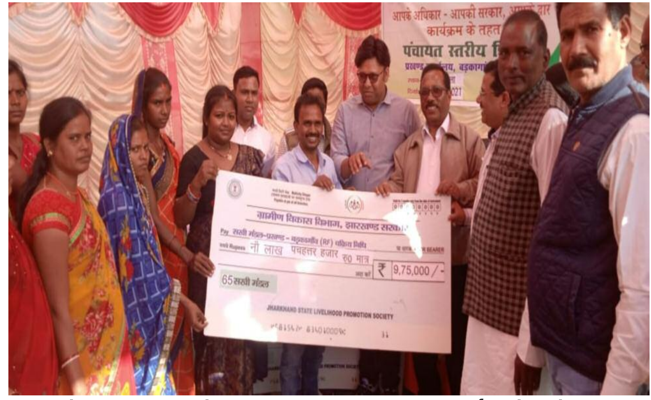
चेक वितरण करते हुए मुख्य अतिथि अपर समाहर्ता राकेश रोशन

बड़कागांव प्रखंड के चेपाकला पंचायत में आपकी अधिकार आपकी सरकार आपके द्वार कार्यक्रम के तहत शिविर का आयोजन किया गया। शिविर में झारखंड सरकार के द्वारा चलाए जा रहे योजनाओं के बारे में ग्रामीणों को विस्तार रूप से जानकारी दी गई। 43 योजनाएं एवं समस्याओं को लेकर सभी विभाग के द्वारा स्टॉल लगाई गई थी। उपस्थित मुख्य अतिथि अपर समाहर्ता राकेश रोशन ने सभी स्थानों पर जाकर निरीक्षण किया एवं ग्रामीणों से योजनाएं एवं समस्याओं को लेकर पूछ-ताछ की। शिविर में वृद्धा पेंशन, सामाजिक सुरक्षा पेंशन, प्रधानमंत्री आवास, पशुपालन, कृषि लोन एवं बीमा के अलावा अन्य योजनाओं से संबंधित मामलों को लेकर ग्रामीण अपना नाम अनलाइन रजिस्ट्रेशन करवाएं। शिविर में कुल 579 लोगों का आवेदन प्राप्त हुआ। जिसमें 10 राशन कार्ड