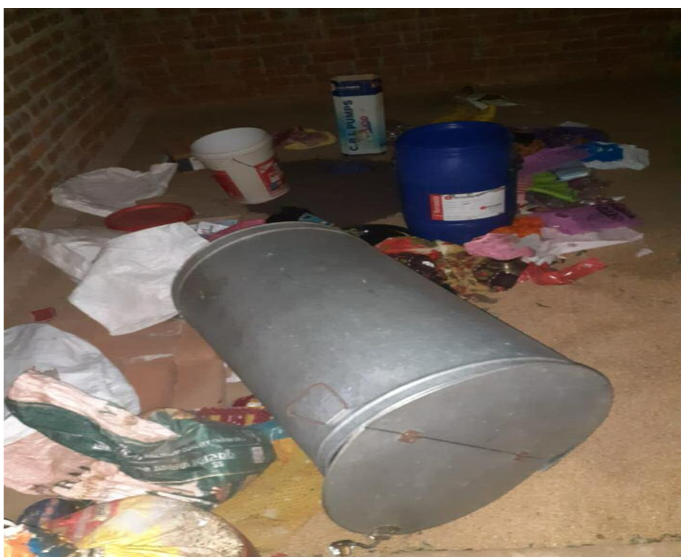
बिखरा पडा समान