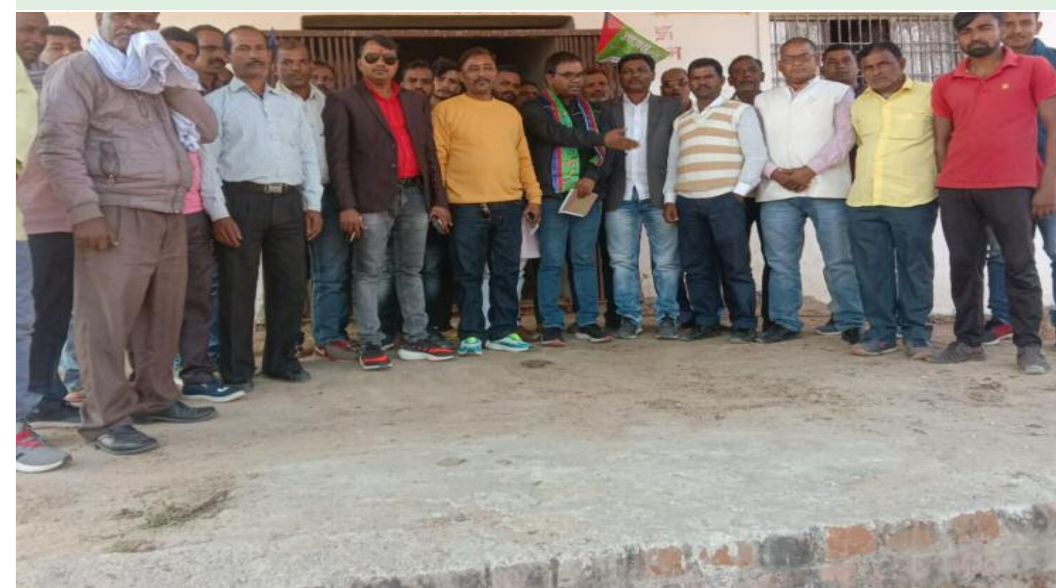
बैठक में शामिल आजसू पार्टी के कार्यकर्ता

आजसू पार्टी ने मनोनीत किए पंचायत प्रभारी, संगठन विस्तार की मिली जिम्मेवारी