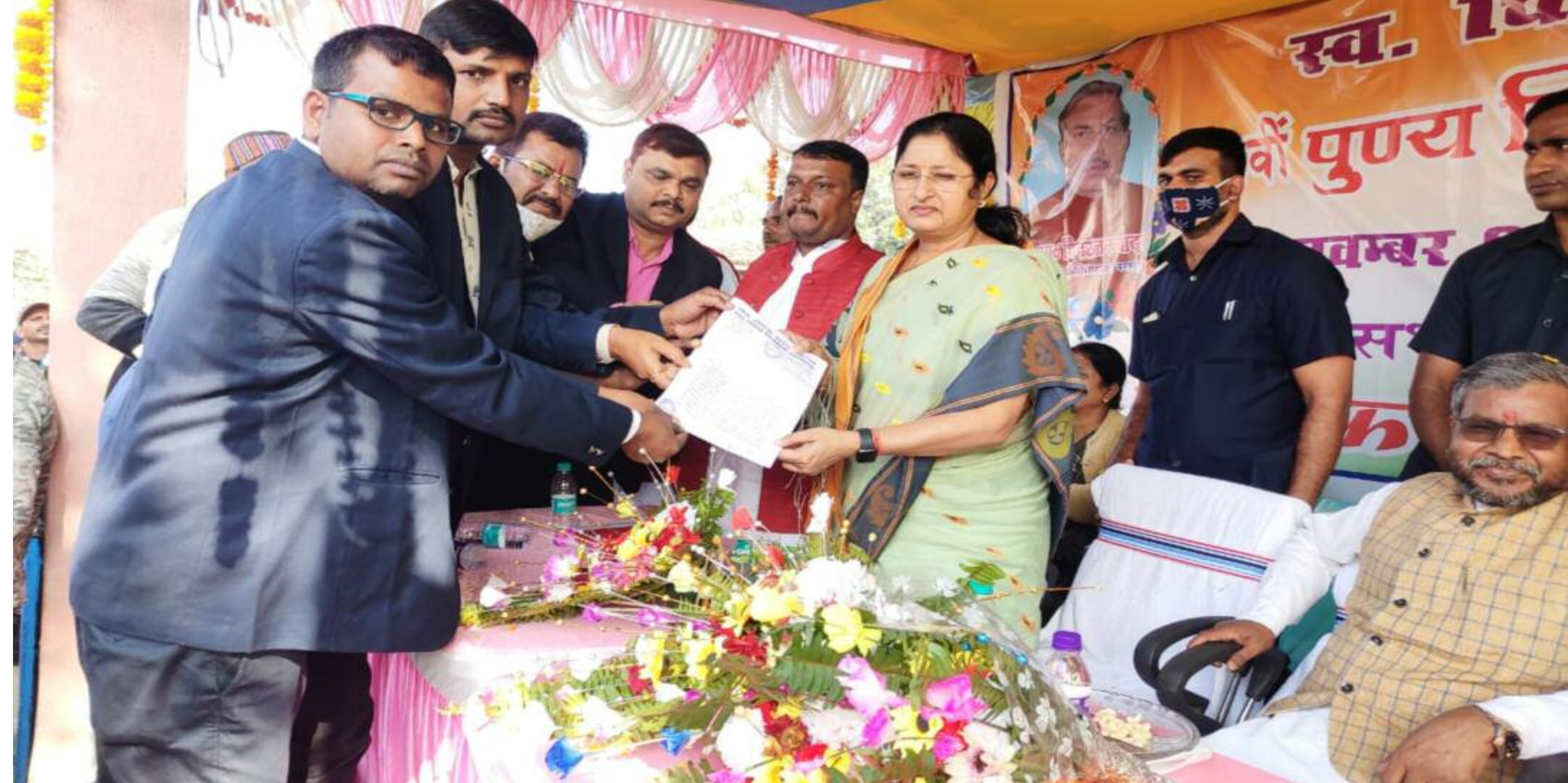
ज्ञापन सौंपते हुए