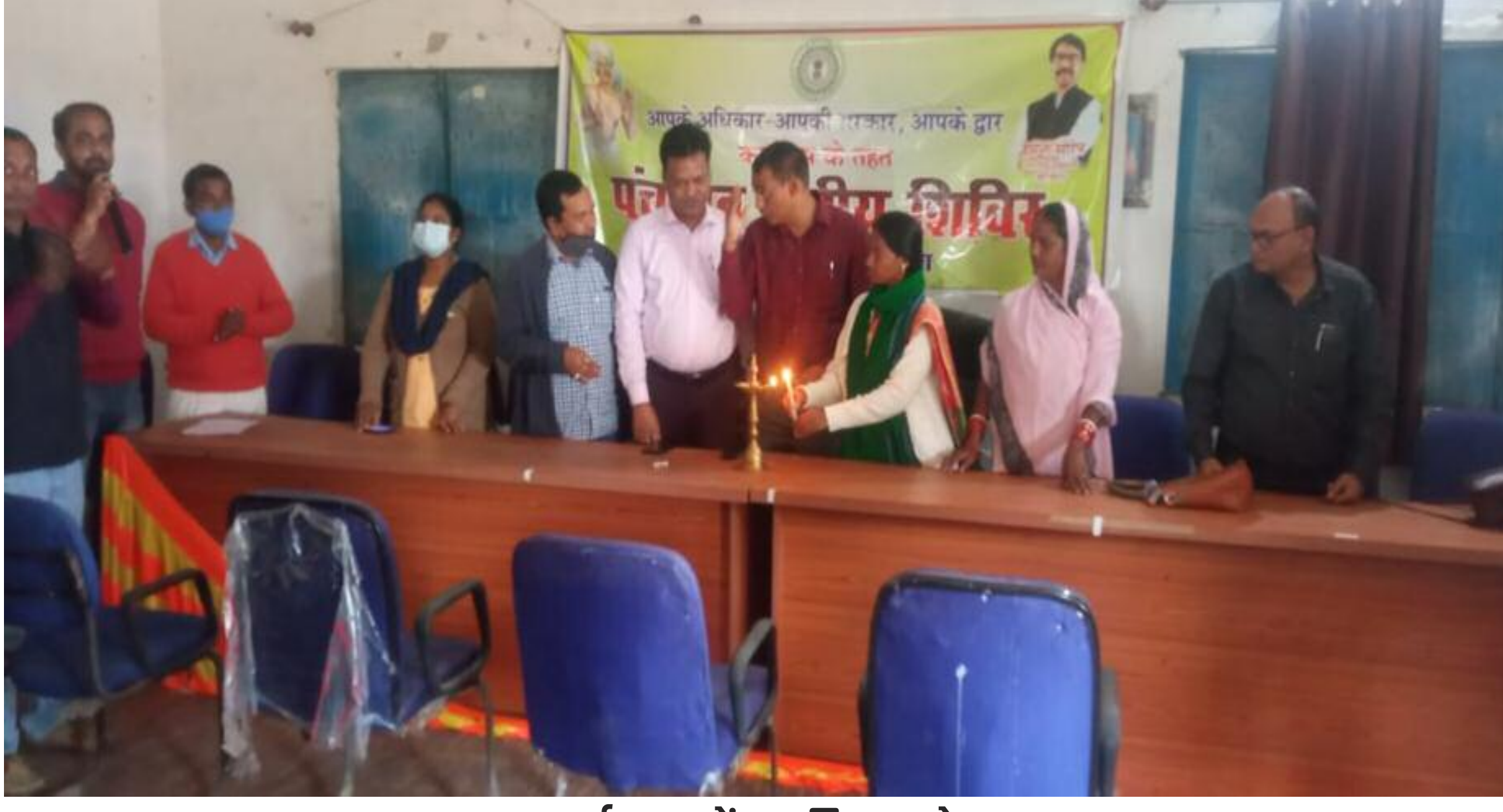
कार्यक्रम में शामिल लोग

झारखंड सरकार महत्वकांक्षी योजना आपके अधिकार आपकी सरकार आपके द्वार के तहत चुरचुर प्रखंड के आंगो पंचायत भवन परिसर में पंचायत स्तरीय शिविर का आयोजन किया गया। जहां आयोजित पंचायत के कई समस्याओं पर पंचायत स्तरीय निष्पादन व सरकार द्वारा संचालित योजनाओं को लाभ हर जरूरतमंद लोग तक इसका लाभ कैसे पहुंचाया जाय जा सके साथ ही केसीसी कृषि विभाग पशुपालन विभाग मत्स्य विभाग पीएम जीवन ज्योति योजना पीएम जीवन सुरक्षा योजना कोरोनावायरस इन श्रम कार्ड ईसराम कार्ड दाखिल 3जी विधवा पेंशन वृद्धा पेंशन सहित कई विभाग के स्टॉल लगाया गया इस शिविर कैंप के माध्यम से जनता के समस्याओं का निष्पादन कैसे हो इस पर मंथ अधिकारी ने लोगों को बताया गया कार्यक्रम का