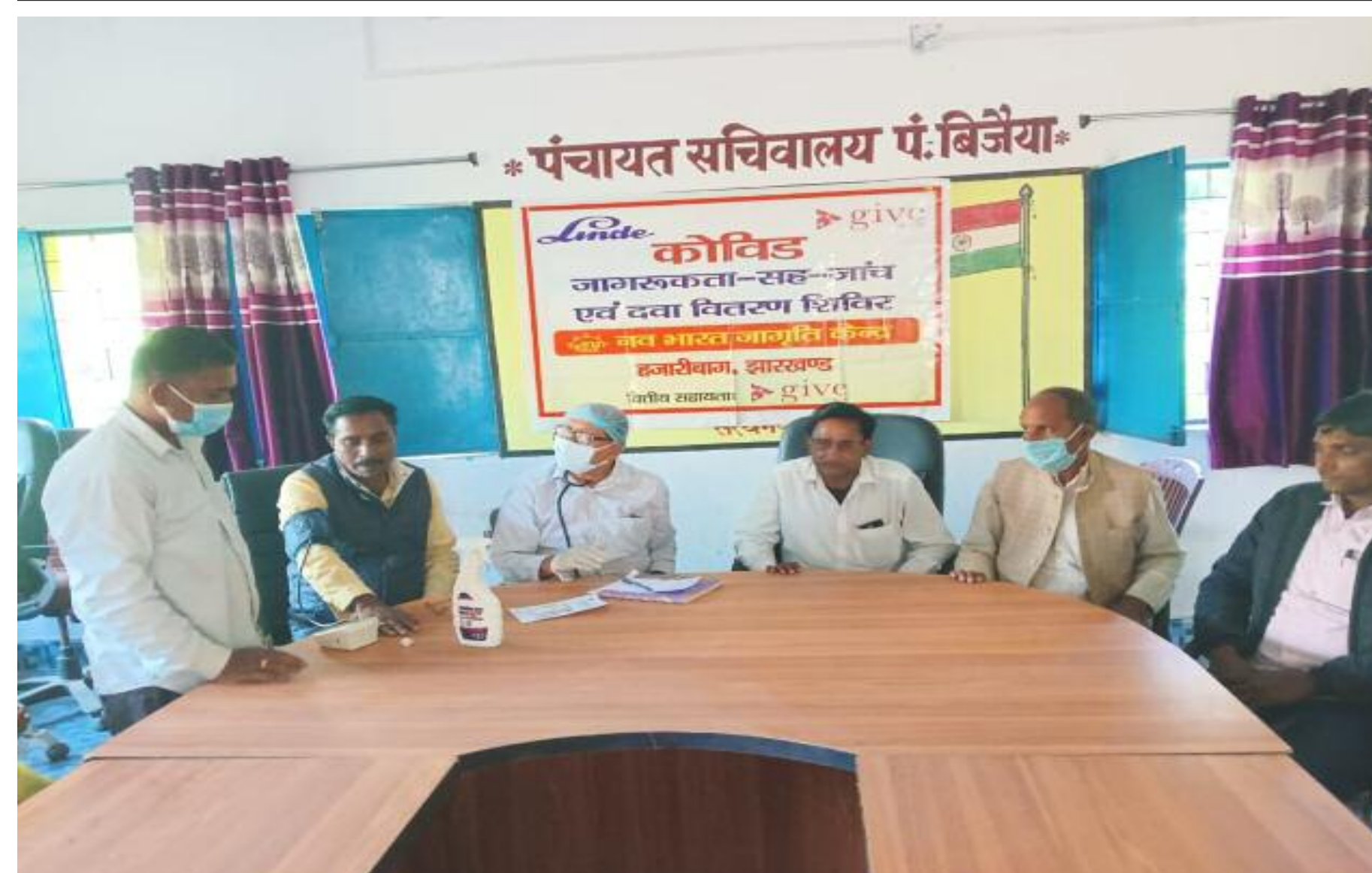
जाँच शिविर में शामिल लोग