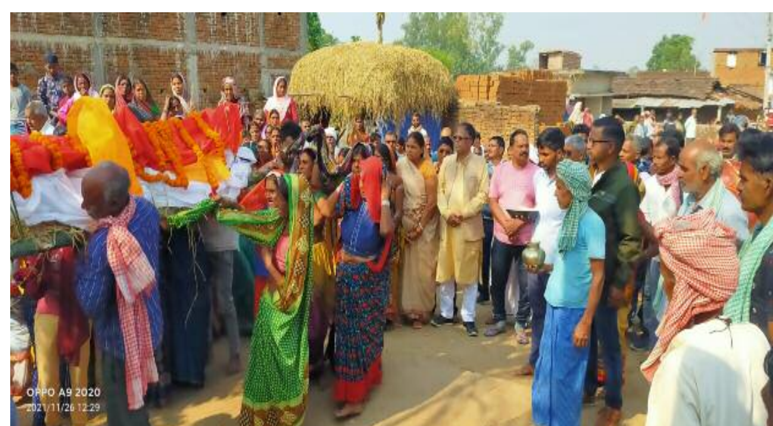
अंतिम यात्रा में शामिल लोग