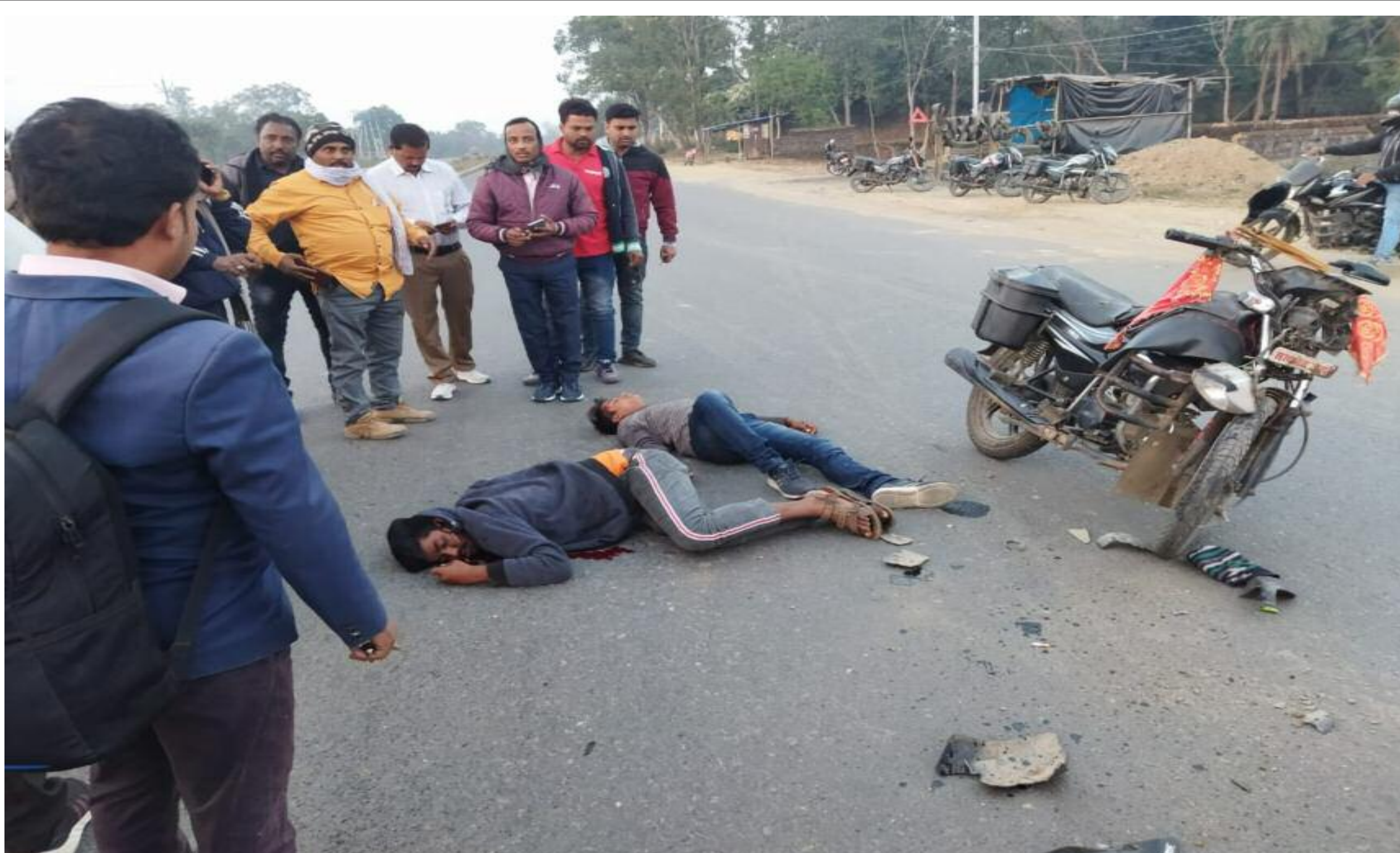
सड़क दुर्घटना में घायल युवक

चंदवारा थाना क्षेत्र अंतर्गत रांची-पटना मुख्य मार्ग स्थित पावर हाउस समीप हाइवा के चपेट में आने से एक युवक की दर्दनाक मौत हो गई। जबकि एक युवक घायल हो गया। जानकारी अनुसार शुक्रवार शाम को गुमो के दो युवक मोटरसाइकिल से चंदवारा की ओर जा रहे थे। इसी बीच पावर हाउस के समीप अज्ञात हाइवा के चपेट में आ गए। जिससे बाइक सवार दोनों युवक सड़क पर गिर गए और घायल हो गए। घायलावस्था में दोनों युवकों को आनन फानन