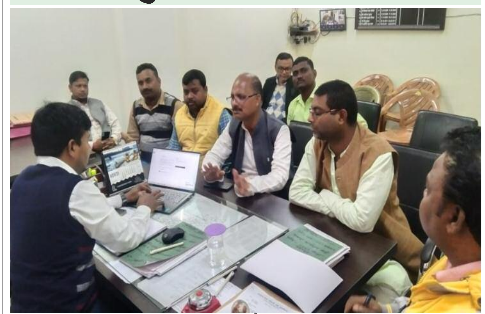
सीओ से वार्ता करते लोग