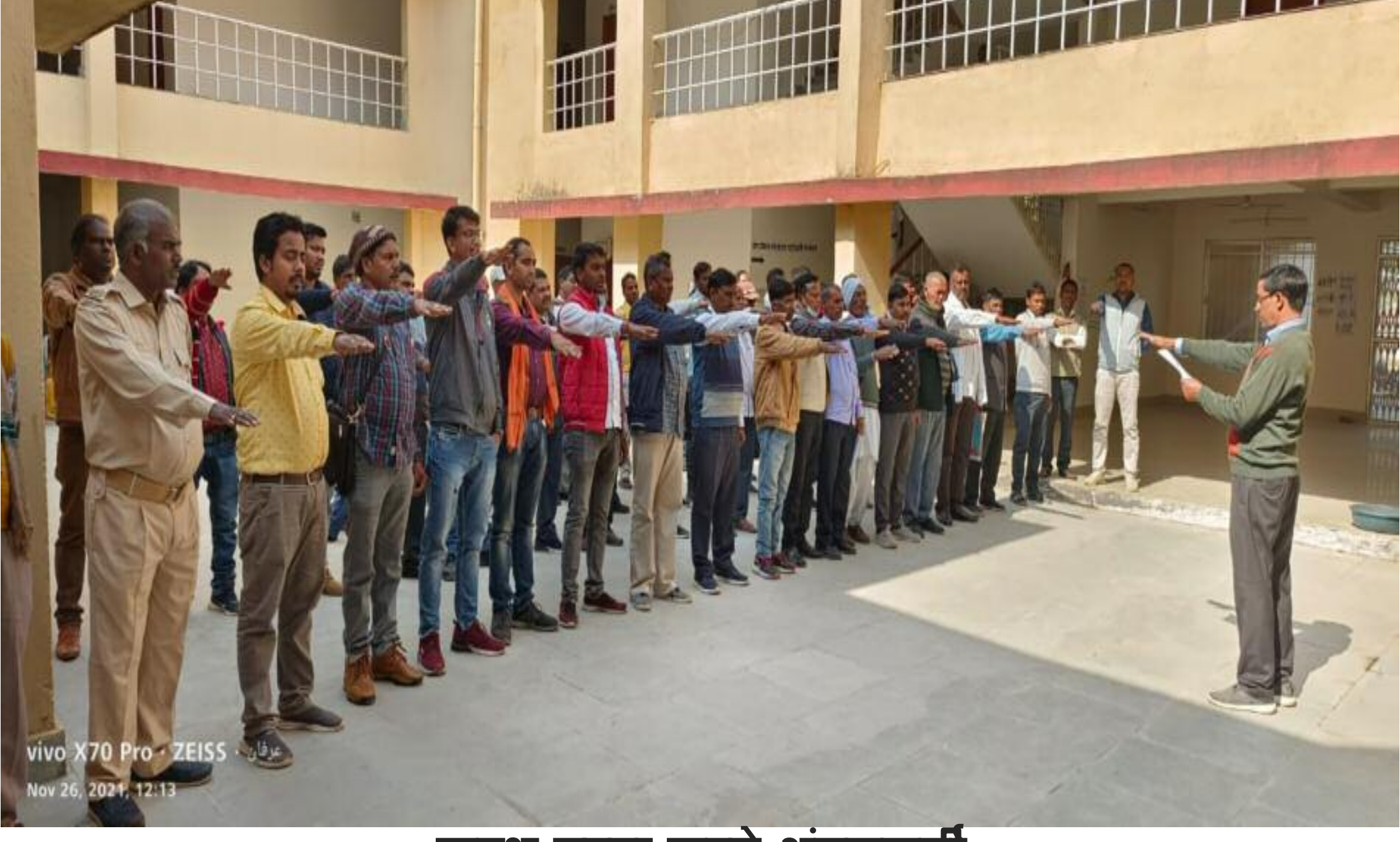
सपथ ग्रहण करते अंचलकर्मी