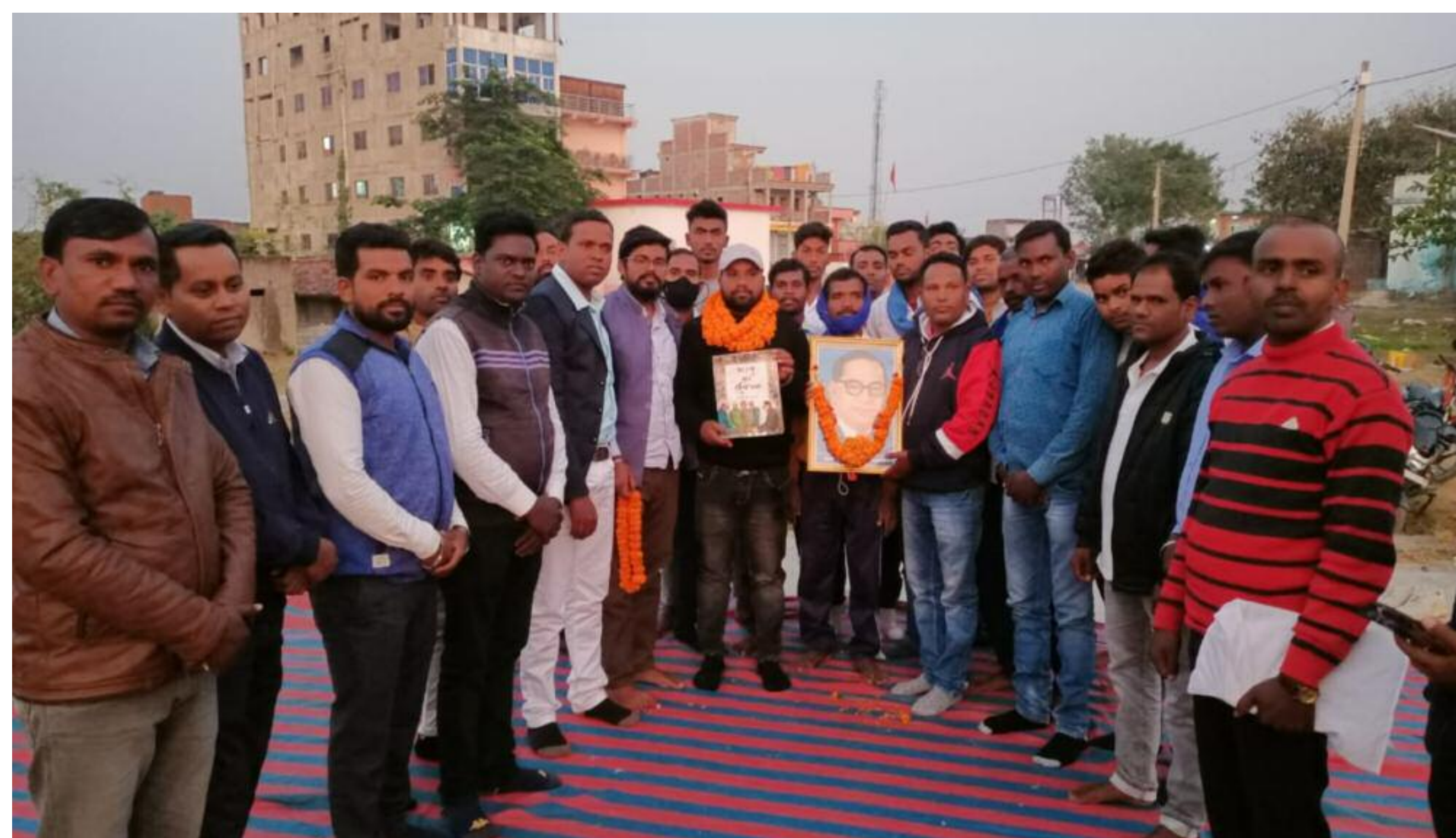
संविधान दिवस मनाते भीम आर्मी के लोग