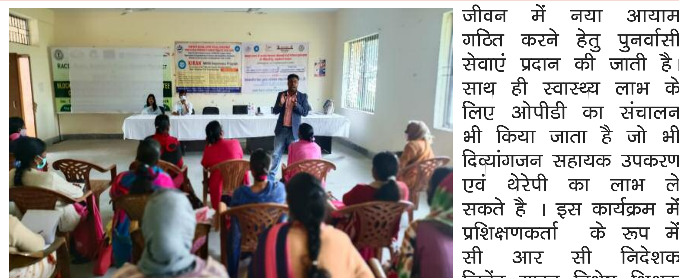
प्रशिक्षण में शामिल लोग

भारत सरकार के दिव्यांग जन सशक्तिकरण विभाग, सामाजिक न्याय व अधिकारिता मंत्रालय द्वारा संचालित समेकित पुनर्वास केंद्र (सीआरसी) नामकुम, रांची एवं प्रखंड कार्यालय नामकुम रांची के सहयोग से पंचायत वार आंगनबाड़ी सेविका सहायिका एवं सुप. रवाइजरो को दिव्यांग जन अधिकार अधिनियम 2016 व इस अधिनियम द्वारा प्राप्त अधिकारों, पुनर्वास के की भी विस्तृत प्रशिक्षण पहलुओं विषयक प्रदान किया गया । ने कहा कि हमारे केंद्र के प्रशिक्षण प्रदान 21 प्रकार की दिव्यांगता की पहचान, लित