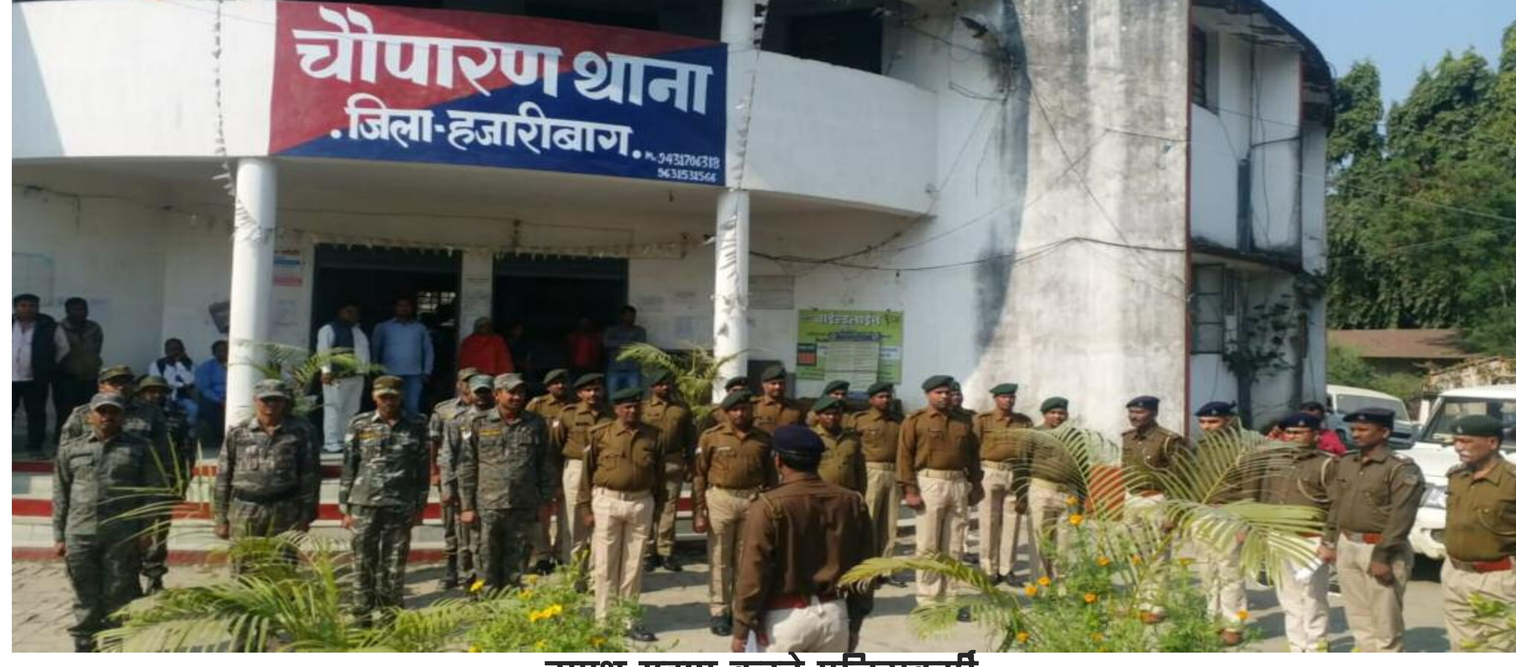
सपथ ग्रहण करते पुलिसकर्मी

बीडीओ व थाना प्रभारी ने संविधान रक्षा का दिलाया शपथ