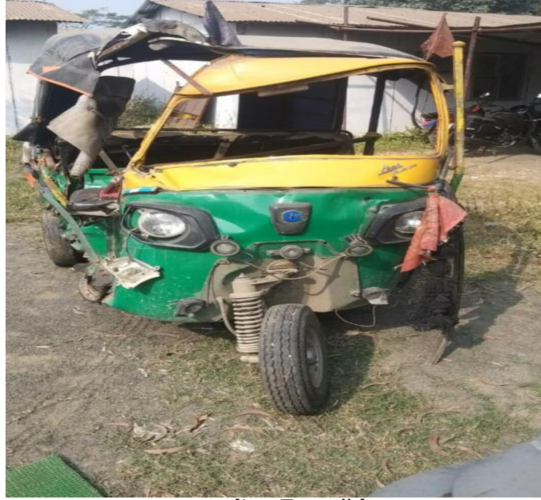
घटना में शामिल ऑटो

चंदवारा थाना क्षेत्र के रांची-पटना रोड़ इन दिनों दुर्घटनाओं का केंद्र बिंदु बना हुआ है। फोरलेन का निर्माण कार्य चलने और जहाँ-तहाँ सड़क की खराब स्थिति के अलावे चालकों की लापरवाही दुर्घटना का मुख्य कारण बन रहा है। आये दिन होने वाली दुर्घटनाओं से लोगों की जान तक जा रही है। बाबजूद इसके दुर्घटना में हताहत होने वाले लोगों को इंसाफ और कानूनी सहयोग देने के बजाय उन्हें दिग्भ्रमित कर मामले को रफादफा करने का गोरखधंधा फलफूल रहा है। इन दिनों रांची-पटना रोड़ पर दुर्घटना होते ही तथाकथिक दलाल सक्रिय हो जाते हैं और अपना खेल शुरू कर दोनों पक्षों के बीच भय का वातावरण पैदा कर सेटिंग-गेटिंग कर उल्लू-सीधा कर अपनी रोटी सेंक लेते हैं। रविवार को इसी तरह की एक वाक्या देखने को मिली। जब शनिवार की शाम जामुखाण्डी के निकट रांची-पटना