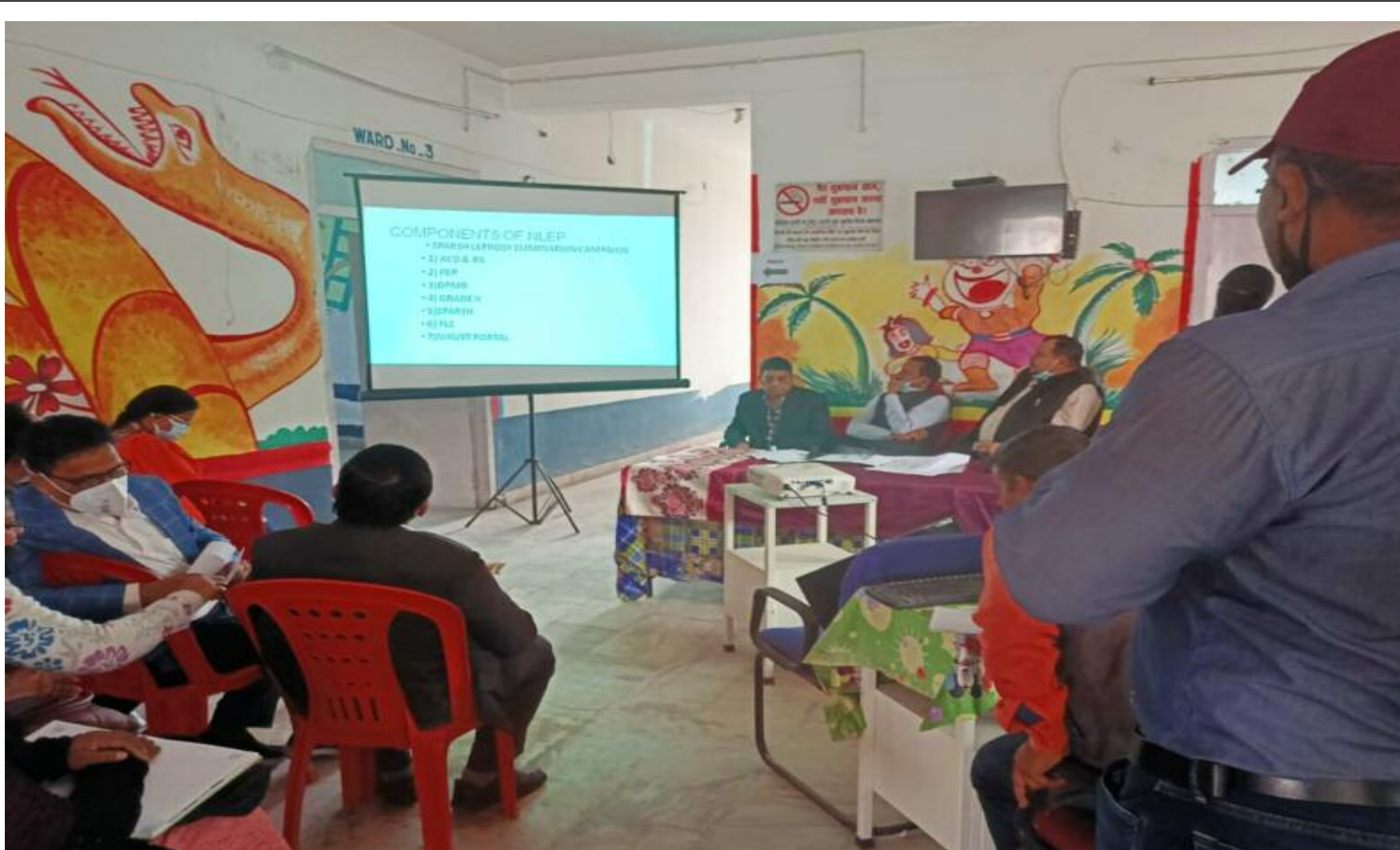
मासिक बैठक में शामिल लोग