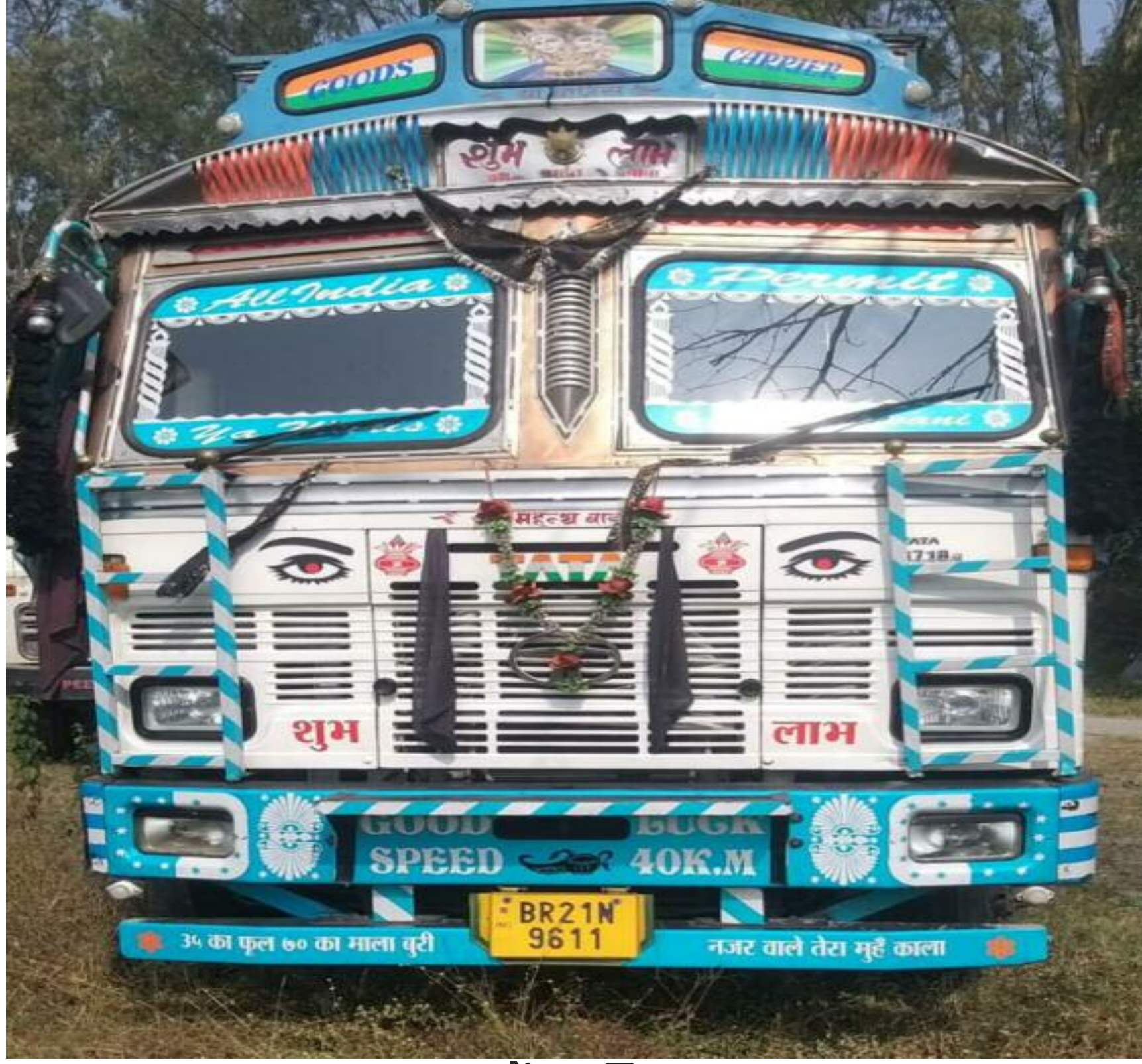
घटना में शामिल ट्रक