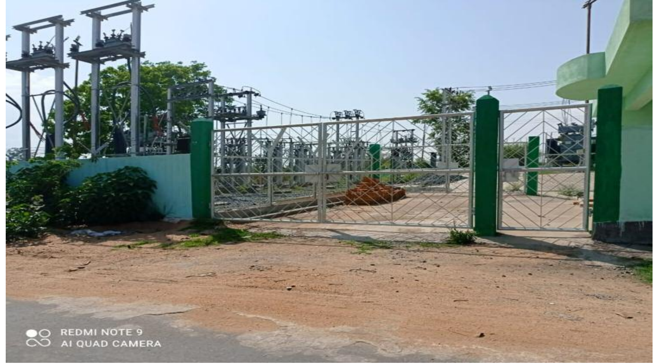
हरली बिजली सबस्टेशन