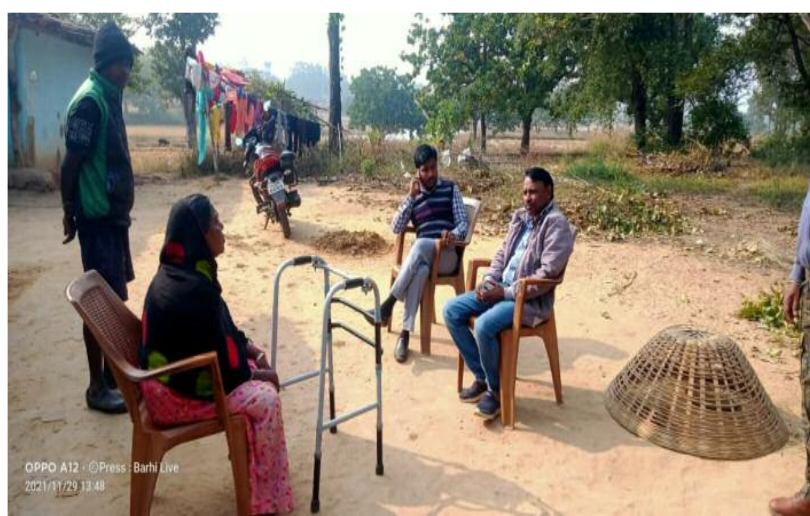
दिव्यांग महिला से वार्ता करते सीओ