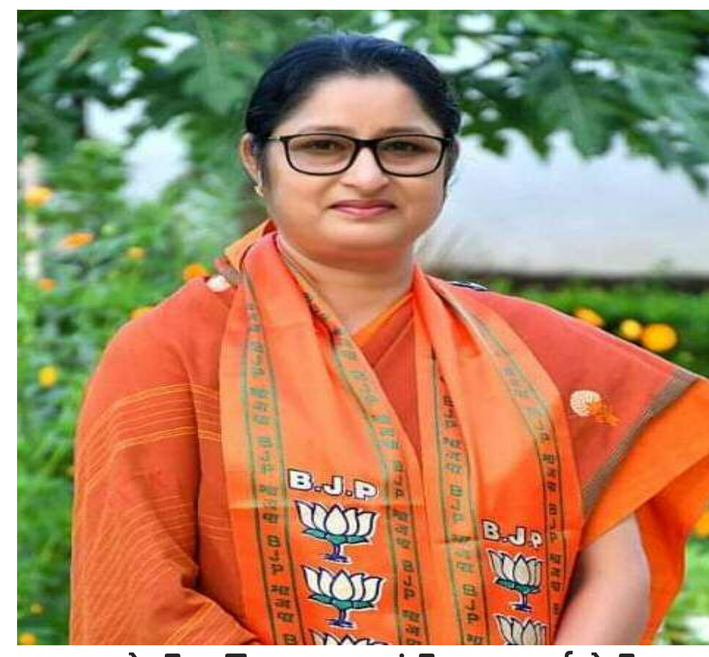
केन्द्रीय शिक्षा राज्यमंत्री अन्नपूर्णा देवी

केन्द्रीय शिक्षा राज्य मंत्री सह कोडरमा विधायक अन्नपूर्णा देवी ने शिक्षा मंत्री जगरनाथ महतो से प्रखंड के मड़मो उत्क्रमित मध्य विद्यालय को उच्च विद्यालय में उत्क्रमित करने की अनुशंसा की है। इस आशय का पत्र उन्होंने शिक्षामंत्री को भेजा है। कहा है कि मड़मो में उमवि तथा उमवि बरवाडीह संचालित हैं। इन दोनों विद्यालयों में करीब 600 विद्यार्थी पढ़ते हैं। मड़मो में