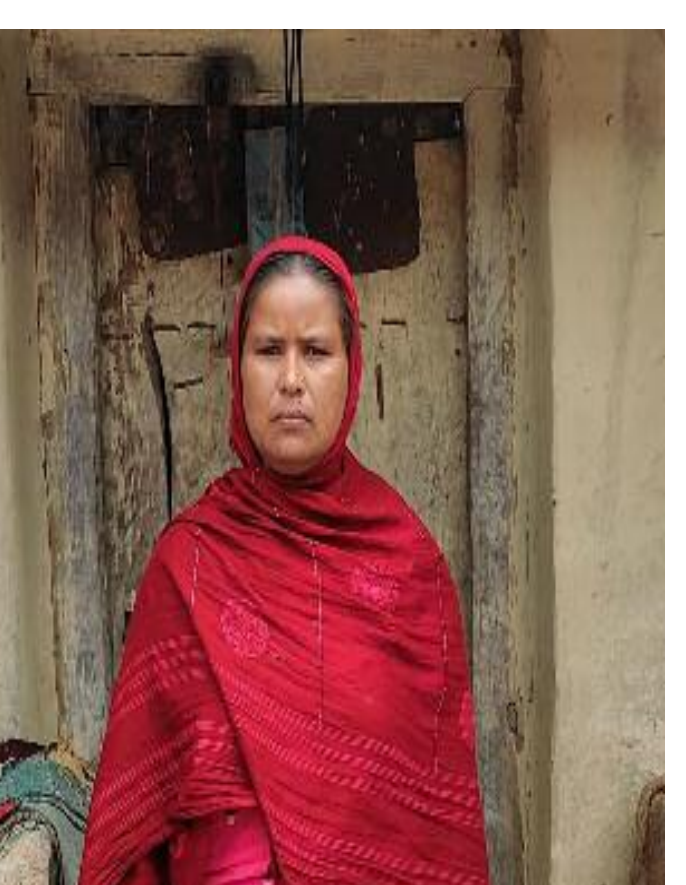
मृतक की पत्नी

भारत के लोगों की मौत चाहे जहां भी हो जाए लेकिन जनाजा या अर्थी अपनी जमीन या मुल्क में ही दफन हो शरीर,यें चाहत सभी को रहता है।और ऐसा ही एक मामला प्रकाश में आया है जहां एक महिला ने अपने एक सप्ताह से मृत पड़े शौहर की जनाजे को ले कर लिए लगातार प्रयासरत हैं,लेकिन लगभग एक सप्ताह होने को चला लेकिन अपने शौहर की शव को दीदार नहीं कर पा रही है। अब भी वो महिला अपने शौहर का दीदार के लिए इंतजार कर रही है।