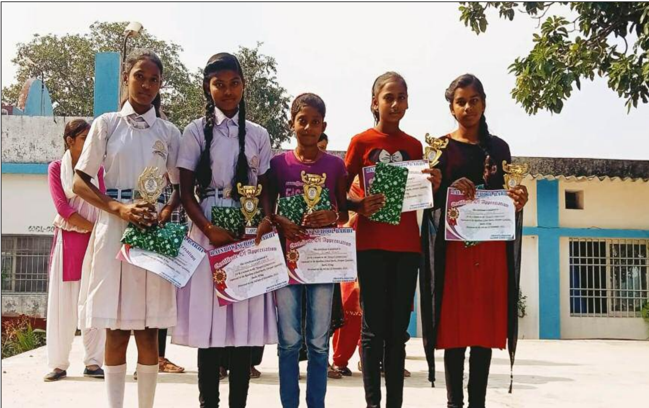
पुरस्कर के साथ सातवी कक्षा की छात्राएं