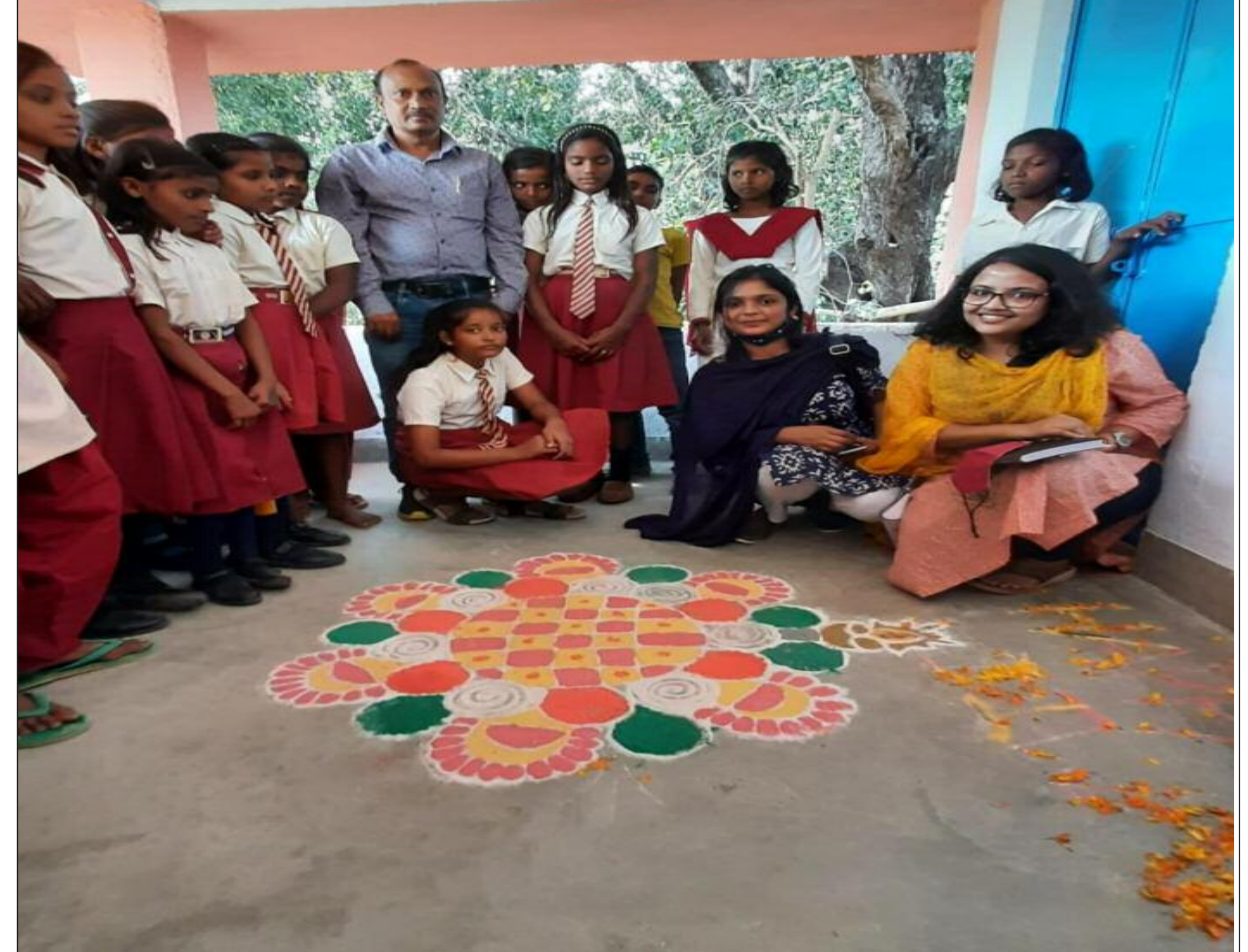
रंगोली के साथ बच्चे व शिक्षक