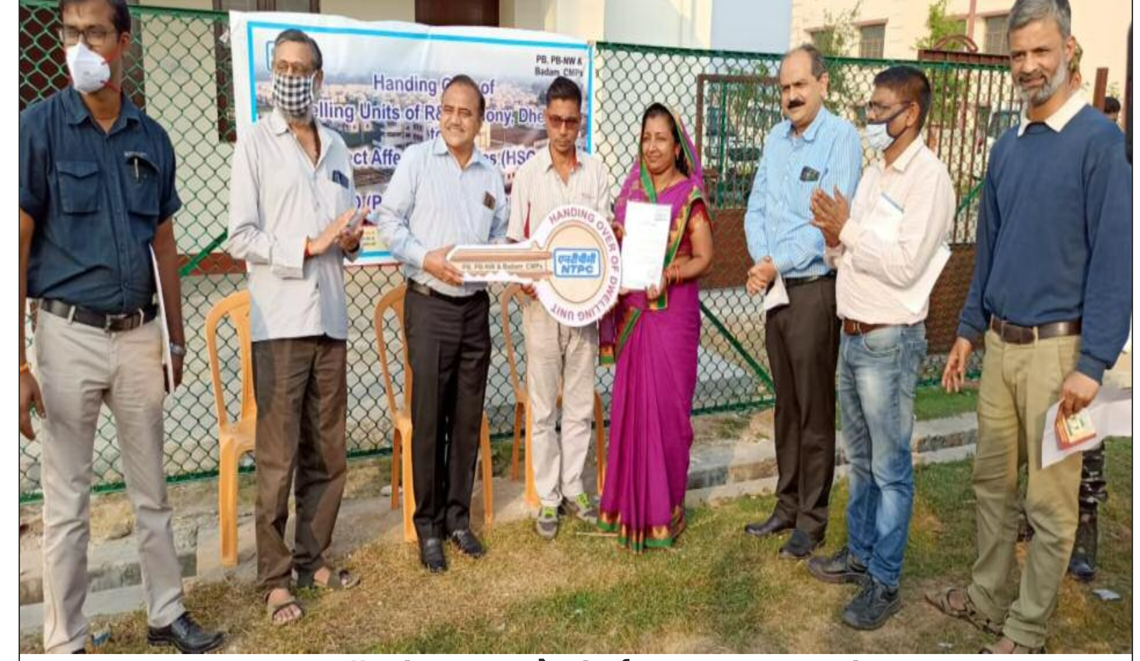
लाभार्थी को चाबी सौंपते ईडी एम बी आर रेडी

एनटीपीसी ने समुदायों की बेहतर और भलाई के प्रति अपनी प्रतिबद्धता में, खनन और औद्योगिक प्रशिक्षण केंद्र से सटे डेंगा में बड़कागांव ब्लॉक के प्रमुख स्थान पर एक पुनर्वास कॉलोनी की स्थापना की है। पकरी बरवाडीह कोयला खनन परियोजना (पीबीसीएमपी) के परियोजना विस्थापित परिवारों की आवास आवश्यकताओं को पूरा करने के लिए, कॉलोनी का निर्माण लगभग 205 एकड़ के विशाल परिसर में किया गया है। 223 करोड़ के लागत से बने एस परिसर में अत्याधुनिक तकनीक से निर्मित 1199 घरों को तैयार किया गया है। परिसर के भीतर प्ले स्कूल, हायर सेकेंडरी स्कूल, स्वास्थ्य केंद्र, सड़क और ड्रेनेज नेटवर्क, बिजली और ओवर हेड टैंक आधारित जल आपूर्ति और सीवेज उपचार संयंत्र जैसी कई सुविधाएं प्रदान की गई हैं। एनटीपीसी जिला