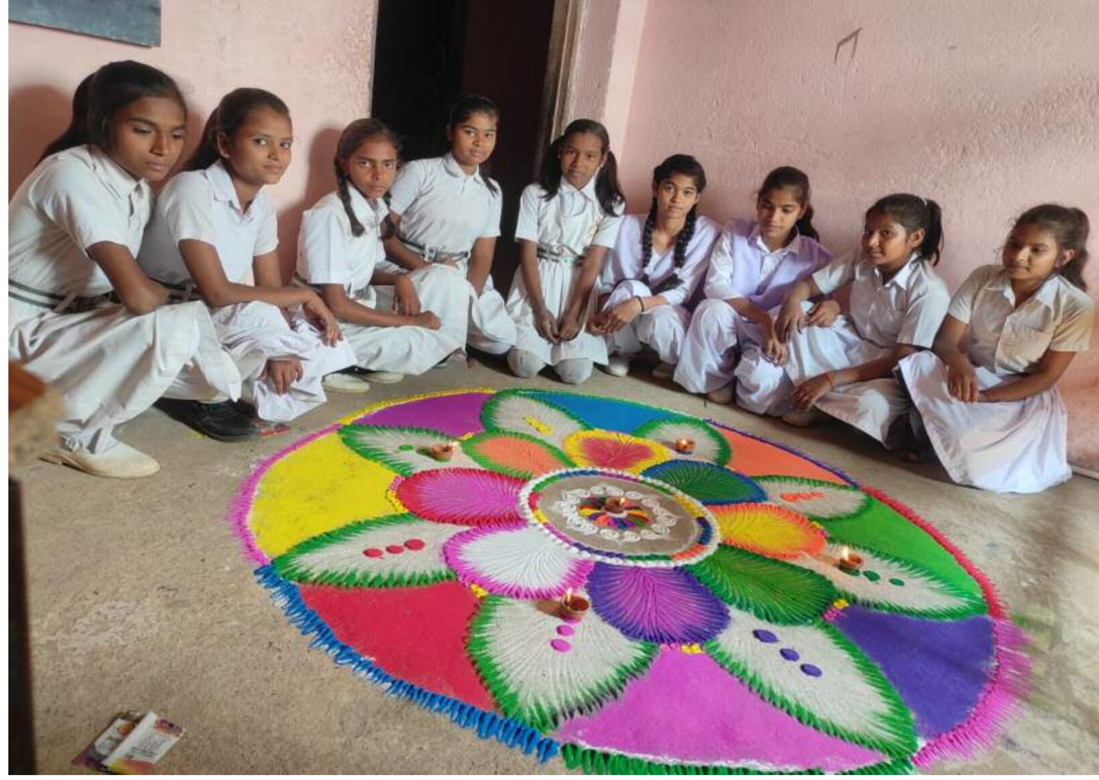
रंगोली बनाती सेंट्रल मिशन स्कूल की बच्चियां