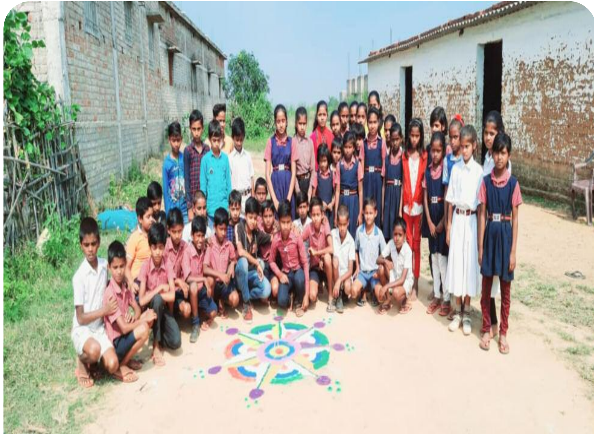
रंगोली बनाते बच्चे