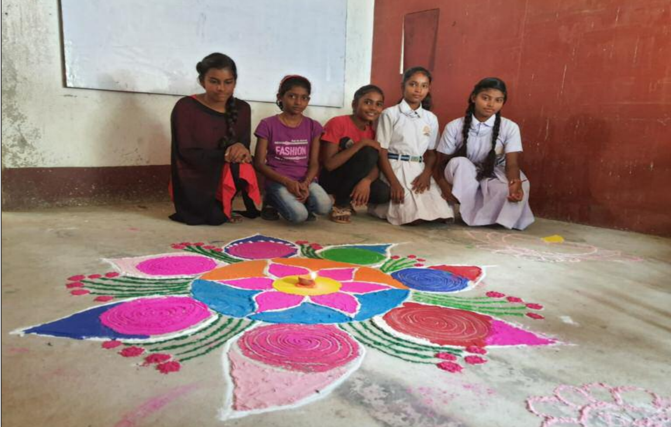
रंगोली के साथ छात्राएं

बरही प्रखंड अंतर्गत शिवपुर गडलाही में स्थित रेनबो स्कूल बरही में दीपावली पर्व को लेकर रंगोली प्रतियोगिता का आयोजन किया गया। जिसमें छठवीं से नवम तक के बच्चों ने भागीदारी ली। प्रतियोगिता में विद्यार्थियों ने बड़-चढ़कर हिस्सा लिया। विद्यार्थियों ने आकर्षक व प्रेरक रंगोली बनाकर कला व अपने कौशल का प्रदर्शन किया। इस प्रतियोगिता में शिक्षकों ने भी हिस्सा लिया। बच्चों ने अलग-अलग विषयों पर रंगोली बनाकर समाज को संदेश देने का प्रयास किया। जिसमें बेटी बचाओ,