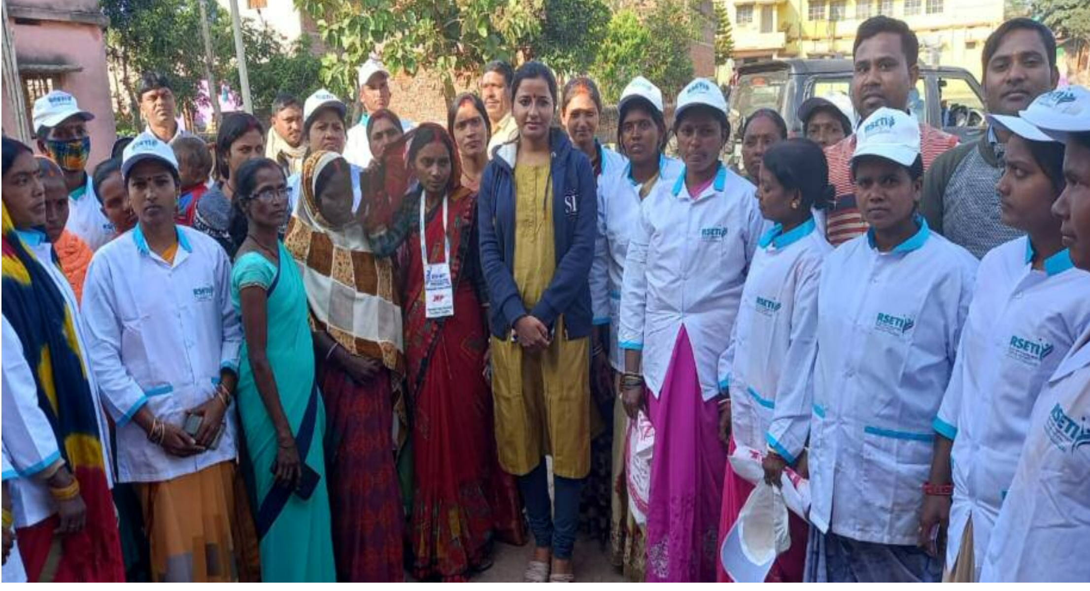
कार्यक्रम के बाद विधायक के साथ शामिल लोग