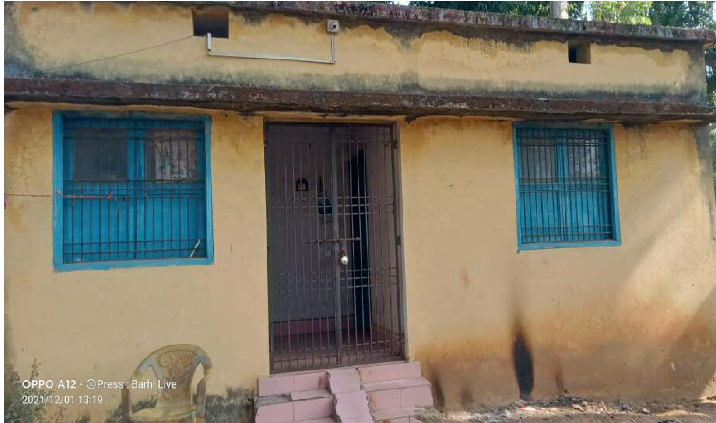
बंद पड़ा पीएचईडी कार्यालय

जिस विभाग के कार्यालय पर स्वच्छता की जिम्मेवारी है। जिस कार्यालय के द्वारा आम जनता को स्वच्छता का पाठ पढ़ाया जाता है। वही कार्यालय बरही में खुद बीमार है। खुद गंदा है। जी हां हम बात कर रहे हैं बरही हजारीबाग रोड के किनारे स्थित बरही का पीएचईडी कार्यालय की। जहाँ गंदगी एवं कचरा का अंबार है। पूरा कार्यालय परिसर में झाड़ी से भरा पड़ा है। इसका मुख्य कारण है कि यहाँ कोई भी अधिकारी नही रहते हैं। कार्यालय हमेशा बंद रहता है। जिसके कारण इस कार्यालय को कोई देखने वाला नहीं है। कार्यालय परिसर के आस पास के दुकानदार कचरा इसी परिसर में फेंक देते हैं। परिसर खुला रहने के कारण लोग इसी परिसर में शौच कर देते हैं। लेकिन इसके बाद भी विभाग एवं वरीय पदाधिकारियों को इसकी परवाह नहीं है। जनकारी हो कि इसी कार्यालय के देख रेख में इनके