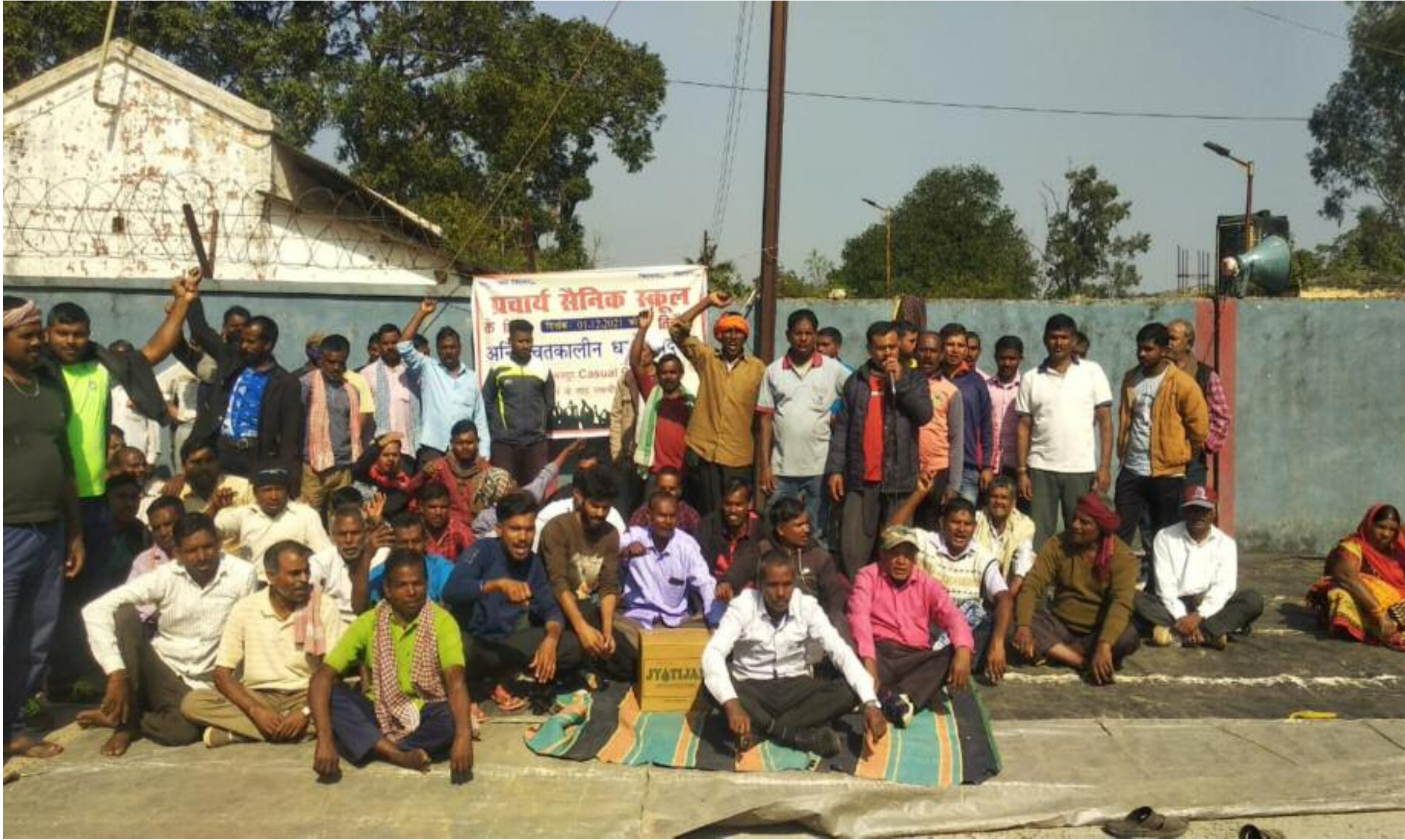
सैनिक स्कूल तिलैया के प्राचार्य के खिलाफ धरना देते मजदूर व नेतागण