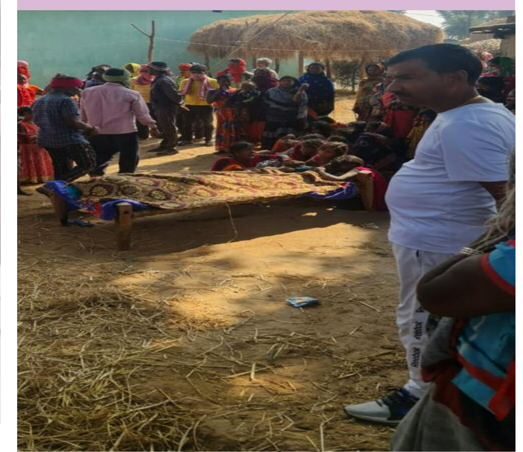
विलाप करते परिजन