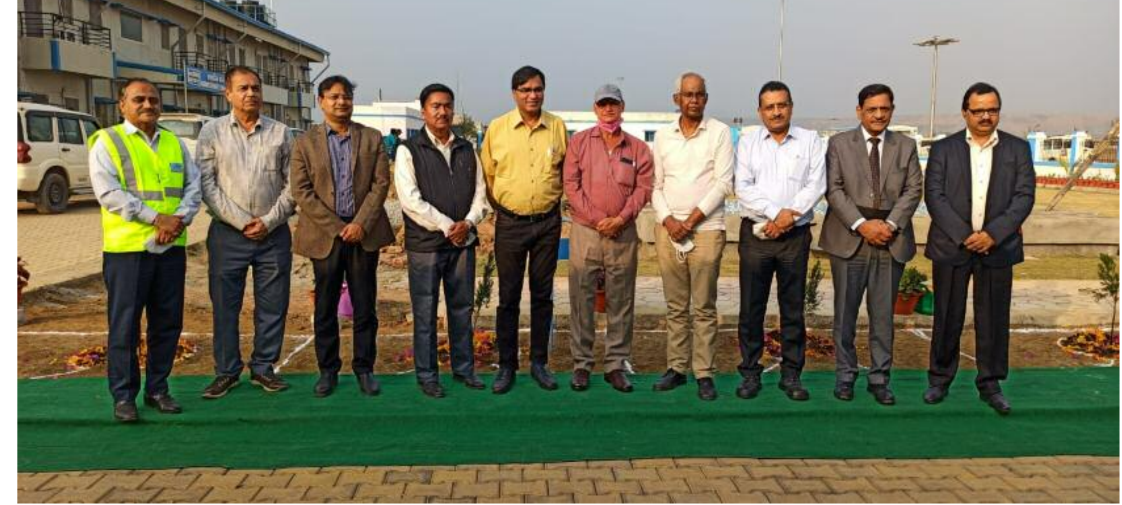
निरीक्षण करते लोग