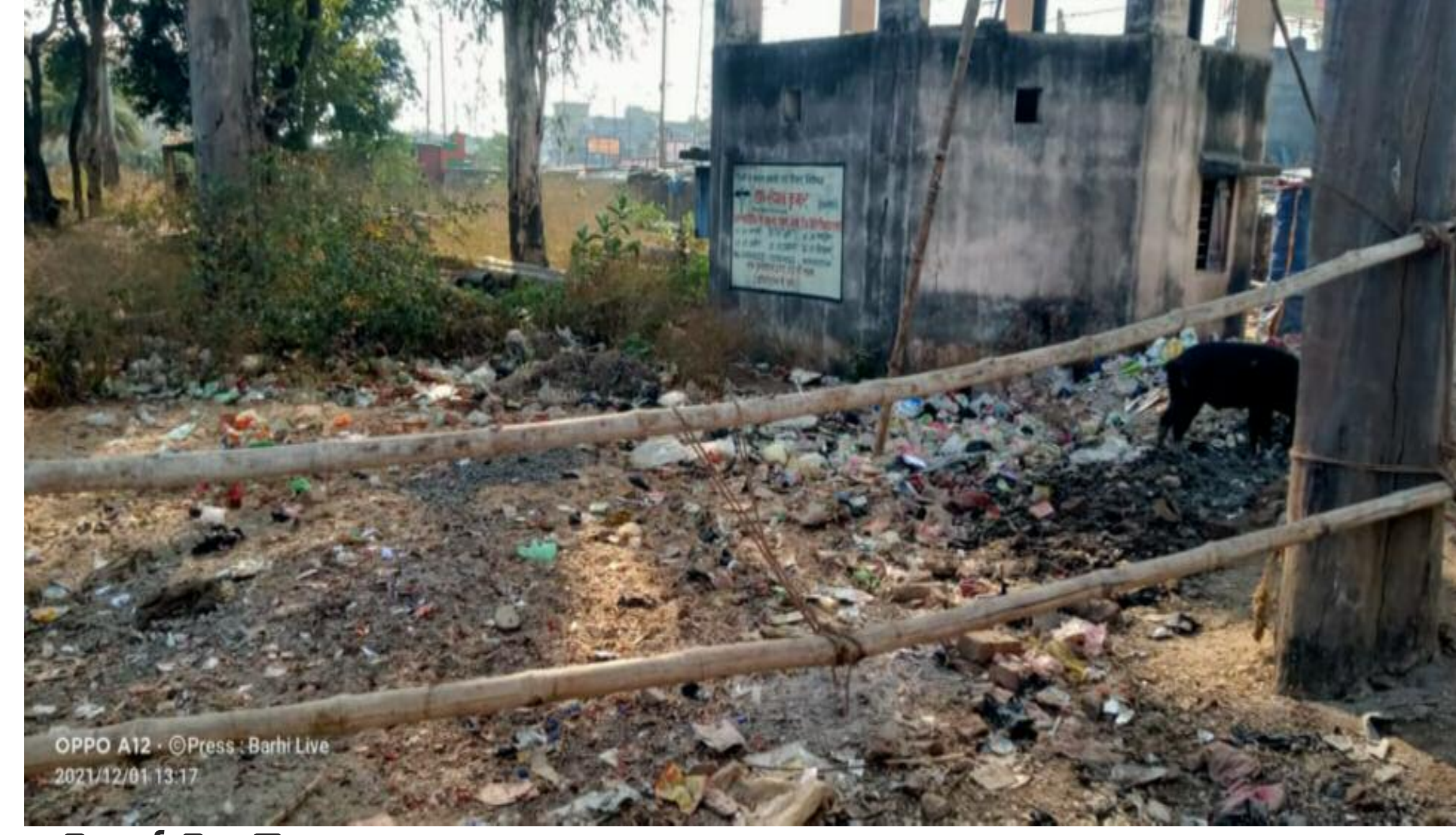
झाड़ी एवं गंदगी से भरा पड़ा पीएचईडी परिसर