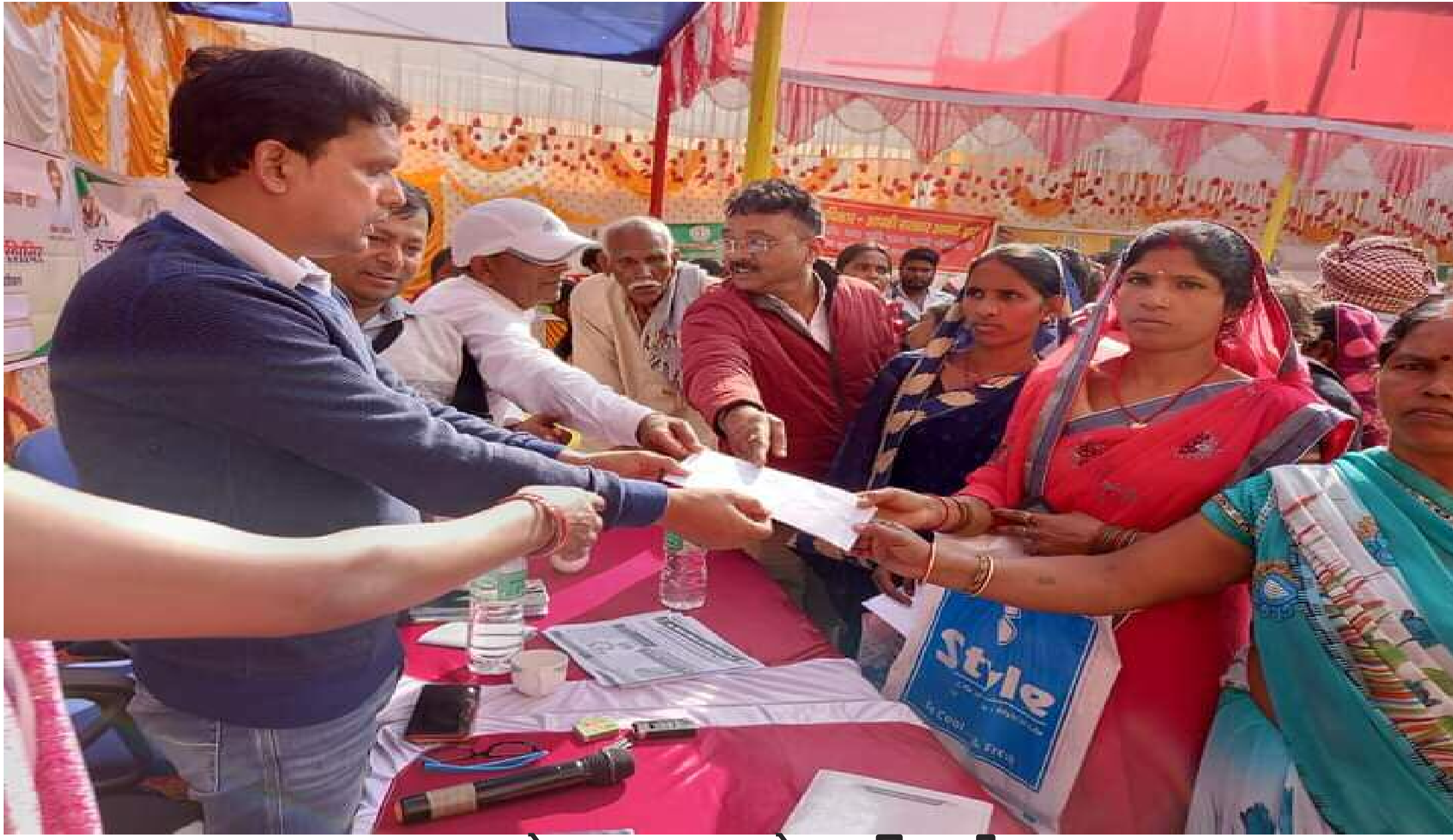
आवेदन प्राप्त करते पदाधिकारी

आपके अधिकार आपकी सरकार सरकार आपके द्वार कार्यक्रम के तहत शुरुवार को 8 जगहों ने शिविर का आयोजन किया गया जिसमें लगाए गए स्टॉलों में विभिन्न योजनाओं के 3995 आवेदन प्राप्त हुए जिसमें 1734 आवेदनों को त्वरित निष्पादन किया गया एवं शेष आवेदनों को प्रक्रियाधीन किया गया। इस क्रम में पदमा के कुट्टीपीसी पंचायत भवन में कुल 364 मामले आए जिनमें 171 मामलों का निष्पादन किया गया, वहीं सदर प्रखंड के गुरहेत पंचायत में लगे शिविर में 518 मामले आए जिनमें 216 मामलों को निष्पादित किया गया, वहीं दारु प्रखंड के जिनगा पंचायत में आयोजित शिविर में कुल 1184 मामले आए जिनमें 418 मामलों को निष्पादित किया