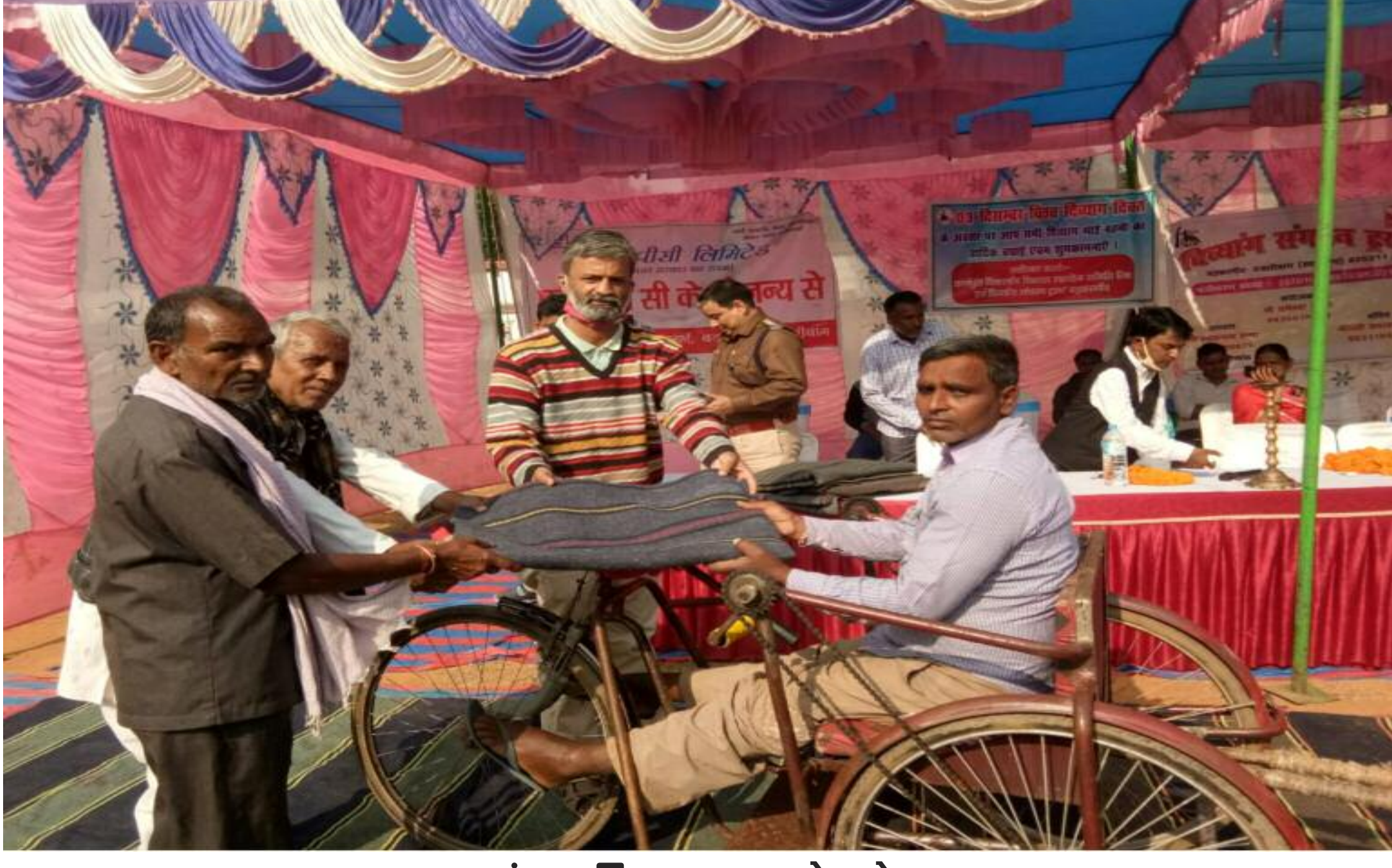
कंबल वितरण करते लोग

एनटीपीसी पकरी बरवाडीह कोयला खनन परियोजना ने बड़कागांव ब्लॉक प्रशासन और बड़कागांव विकलांग ट्रस्ट के सहयोग से विश्व दिव्यांग दिवस मनाया। इस अवसर पर एनटीपीसी के आरएंडआर विभाग ने बड़कागांव में एक समारोह का आयोजन किया जिसमें विभाग के द्वारा विकलांग लाभार्थियों के बीच 100 कंबल का वितरण गया। कार्यक्रम के दौरान सरकारी अधिकारियों ने विकलांग लोगों के लिए सरकार की विभिन्न योजनाओं के बारे में बताया। मौके पर मुख्य अतिथि एसडीपीओ अमित कुमार सिंह, आरएनआर