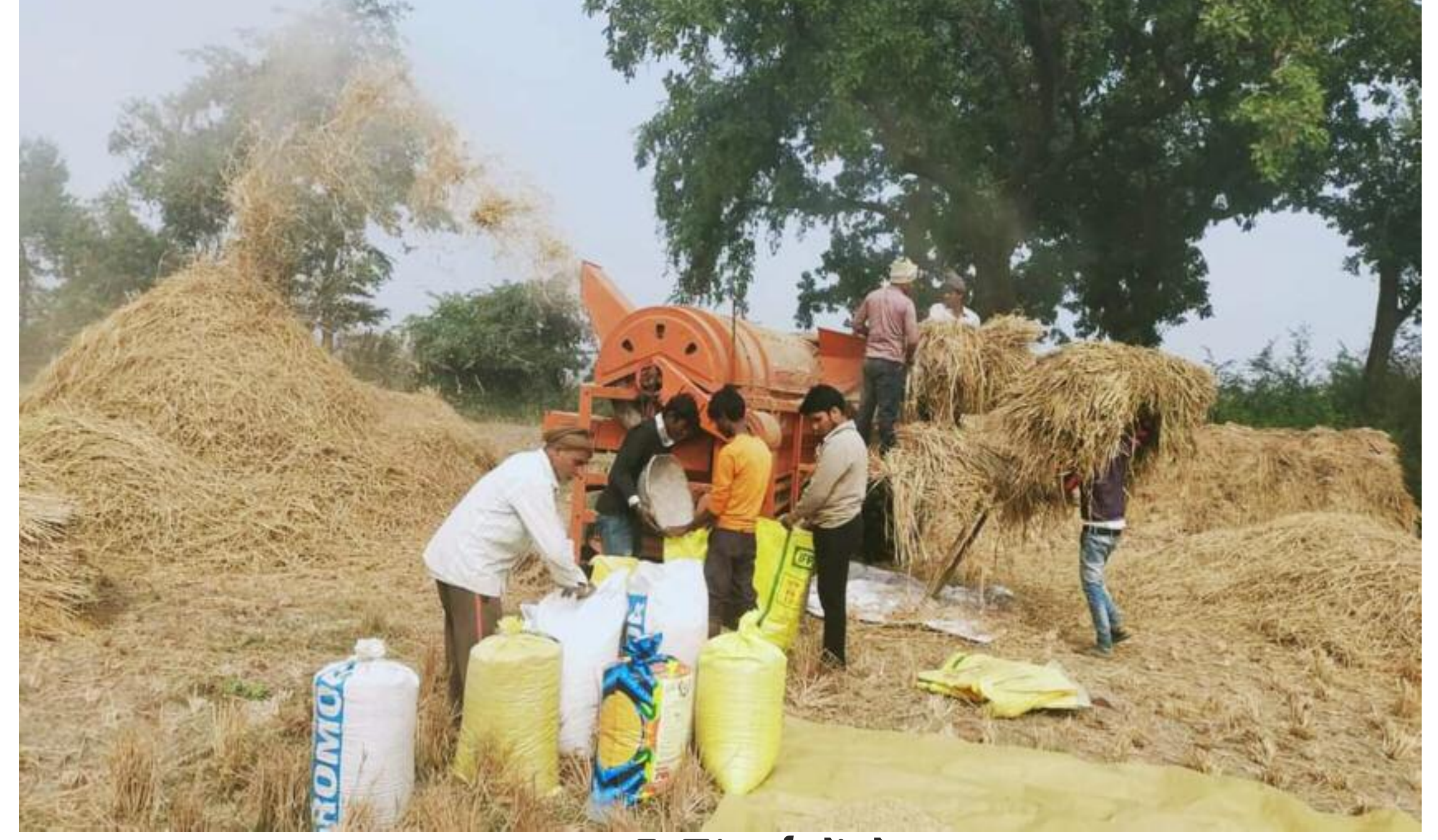
धान की मिंजाई में थ्रेसर

बदलते समय के साथ ही खेती-किसानी में काफी बदलाव आते जा रहे हैं। खेती में ट्रैक्टर का उपयोग तो काफी वर्षों से होता आ रहा है। लेकिन अब क्षेत्र में धान की मिंजाई में थ्रेसर ने अपना स्थान बना लिया है। नयी तकनीकों ने कृषि में उत्पादन एवं सरलता को नये आयाम तो दिये ही हैं किन्तु उन परंपरागत तरीकों को पूरी तरह से खत्म करने में भी कोई कसर नहीं छोड़ा है। ट्रैक्टर के प्रयोग ने गोवंश की उपयोगिता को खत्म किया तो वहीं धान मिंजाई में भी गोवंश का स्थान थ्रेसर ने ले लिया है। टाटीझरिया, ध. रमपुर, मंडपा, डहरभंगा, भराजो, झरपो, बेडम, कोल्ह, केसडा, खैरा, बेडमक्का, होलंग, बेरहो, डुमर, मुरुमातु, बौधा, अमनारी, खंभवा, नारायणपुर, गोधिया आदि गांवों में थ्रेसर से 900-1100 रुपये प्रति