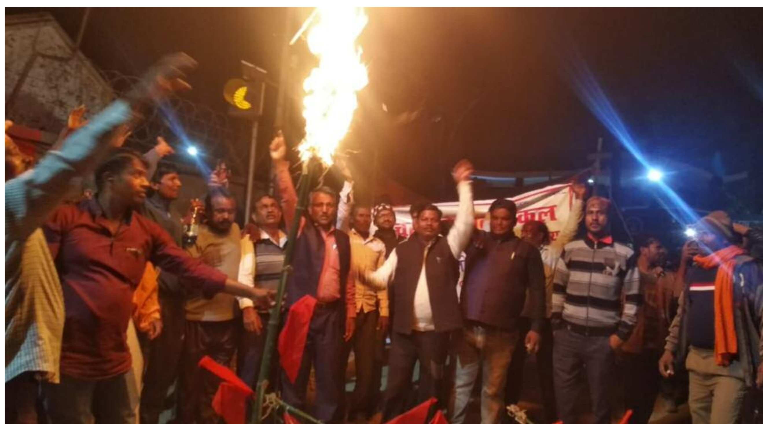
पुतला दहन करते मजदूर