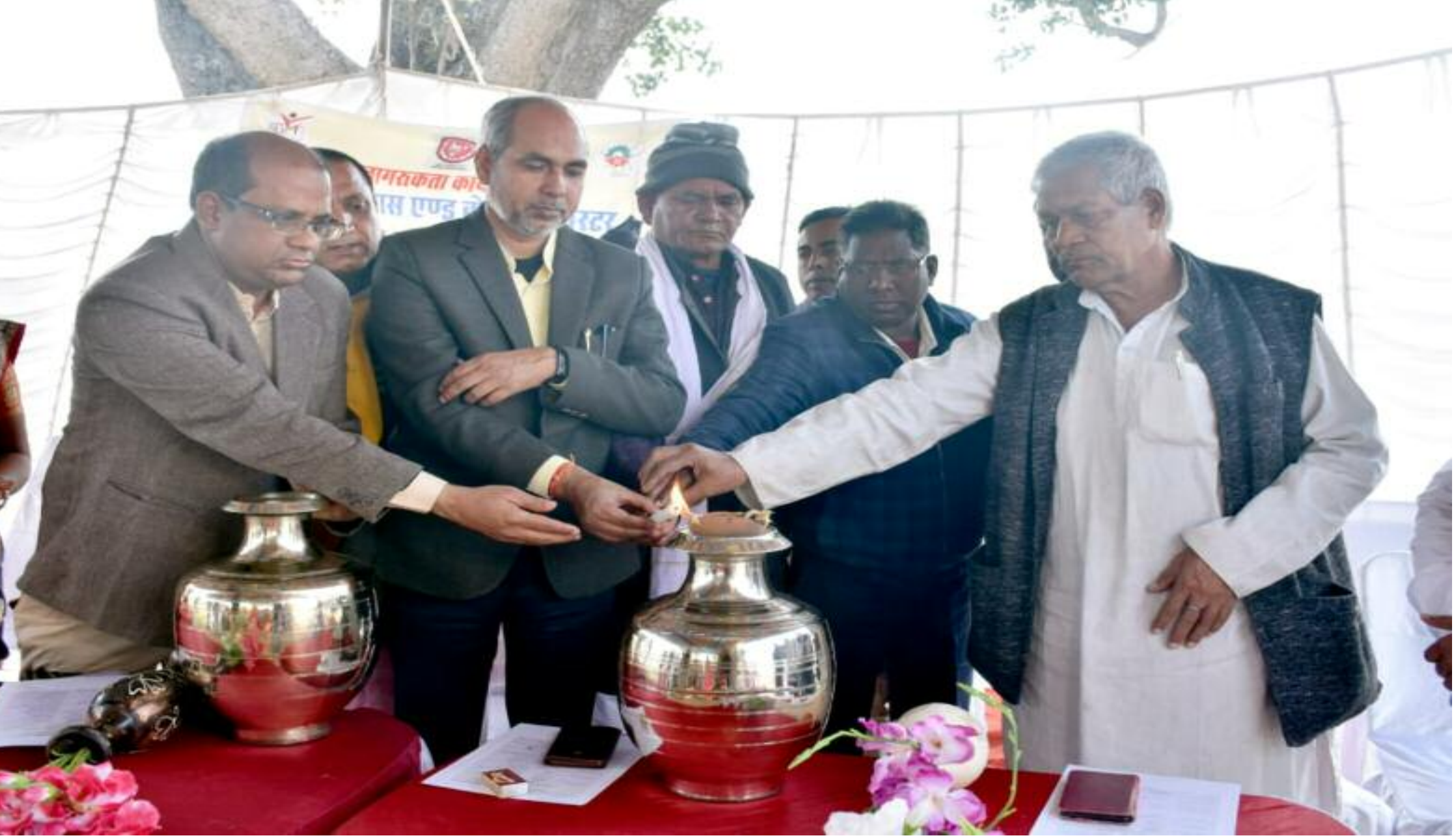
ब्रास एंड ब्रॉन्ज कलस्टर के कार्यक्रम का उद्घाटन करते अतिथि