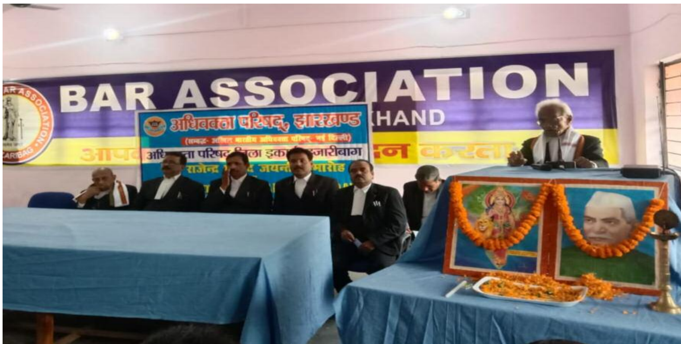
श्रद्धांजलि आर्पित करते अधिवक्ता अधिवक्ता