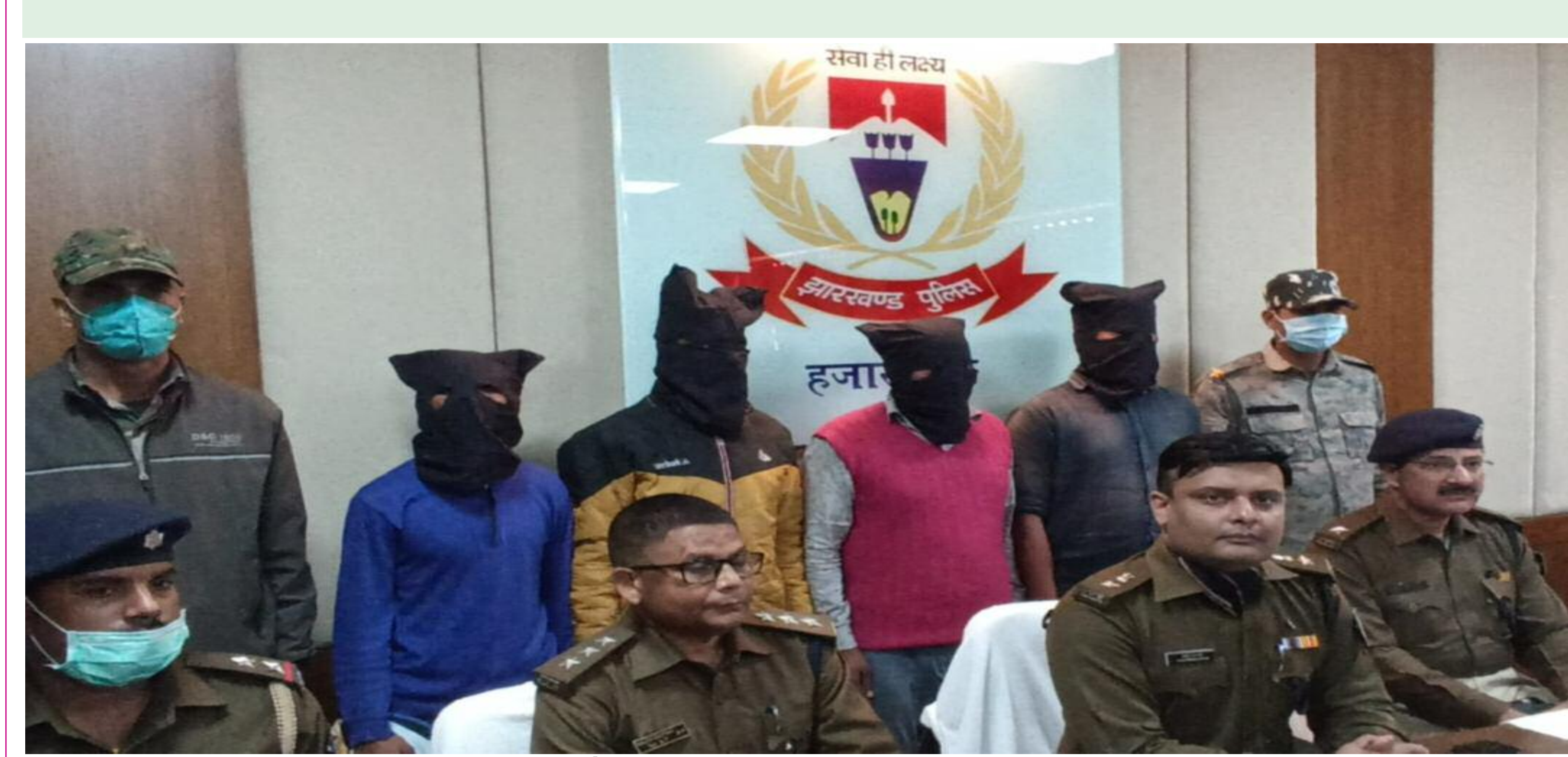
प्रेस वार्ता कर जानकारी देते एसपी एवं डीएसपी