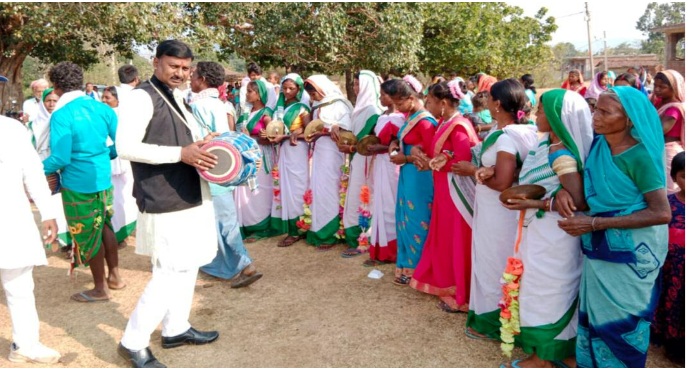
आदिवासी नृत्य करती सखी मंडल से जुड़ी महिलाएं