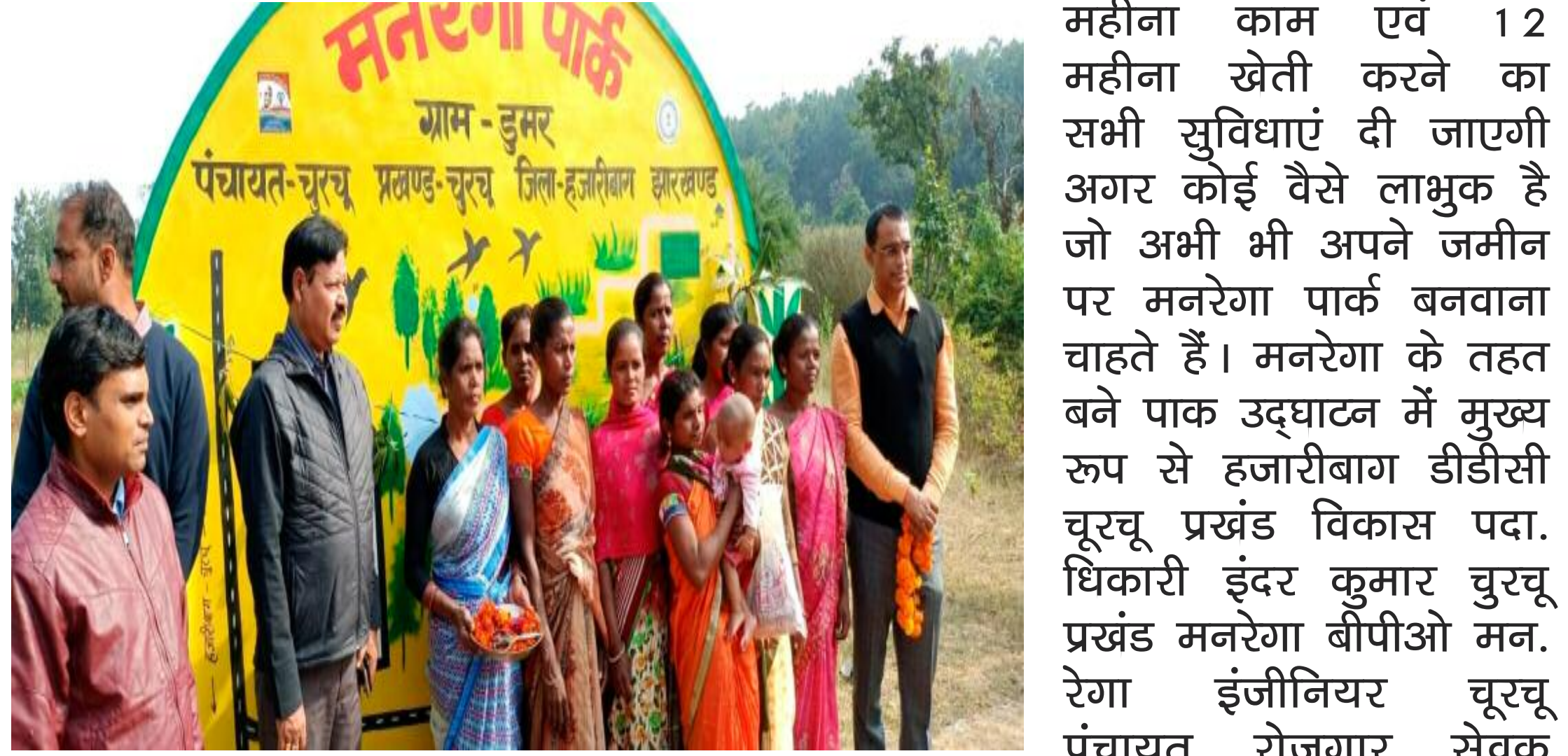
मनरेगा पार्क का उद्घाटन करते

चुरचू प्रखंड चुरचू पंचायत डूमर में 3 एकड़ पर बने मनरेगा पार्क का हजारीबाग डीडीसी ने किया उद्घाटन जिसमें मनरेगा पार्क में कूप बकरी सेड गया सेड सुवर सेड साथ ही फूल बागवानी जैसे पार्क में सभी प्रकार का पैथे लगाए गये हैं। डीडीसी ने सभी मनरेगा से जितने भी बने पार्क के लाभुक को बताया कि मनरेगा योजना से आप लोग को हर योजना दिया जाएगा