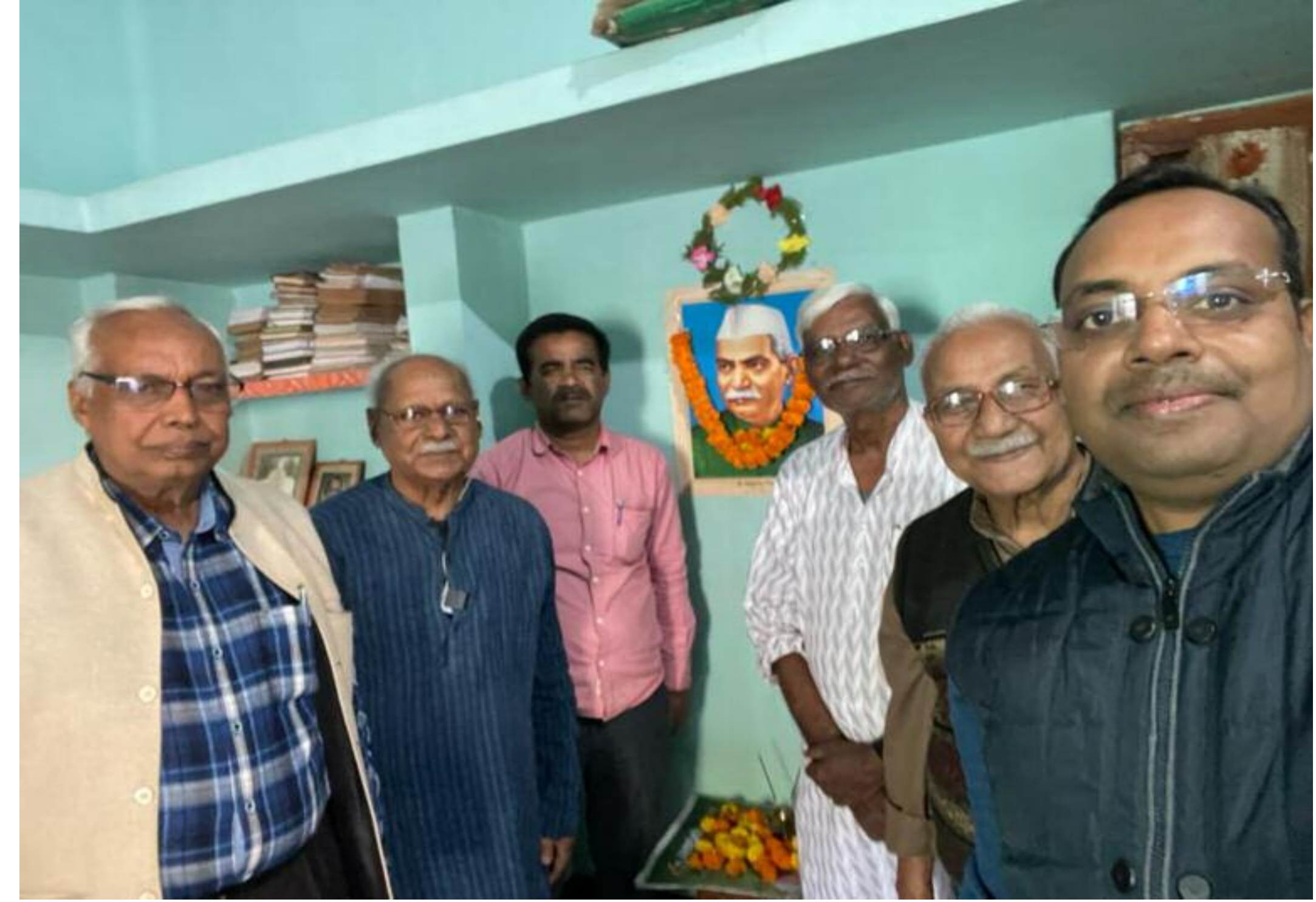
जयंती सभा में शामिल लोग