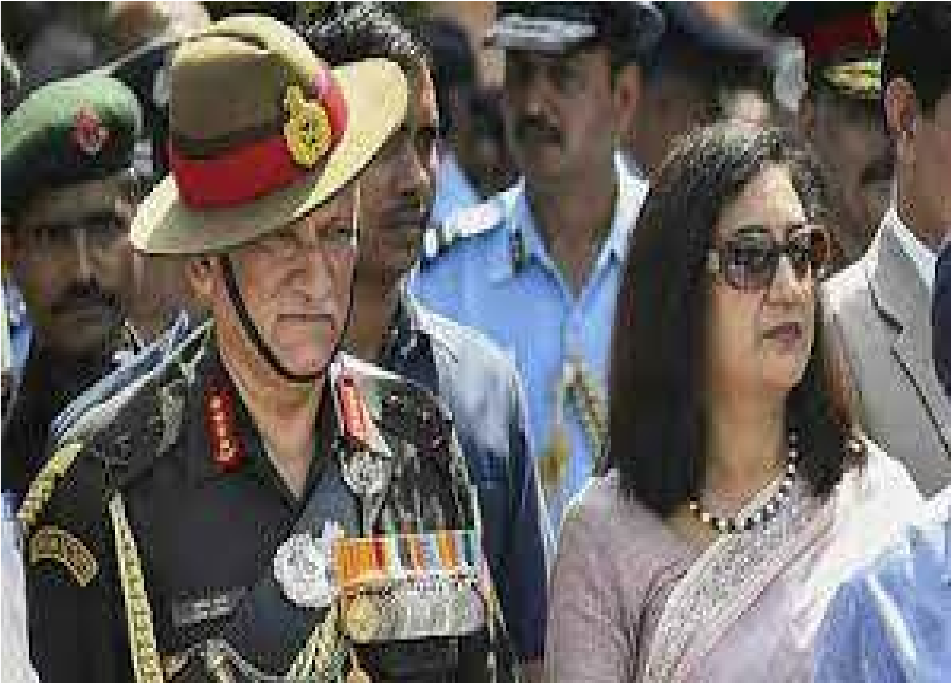
सीडीएस बिपिन रावत एवं उनकी धर्मपत्नी (फाइल फोटो)