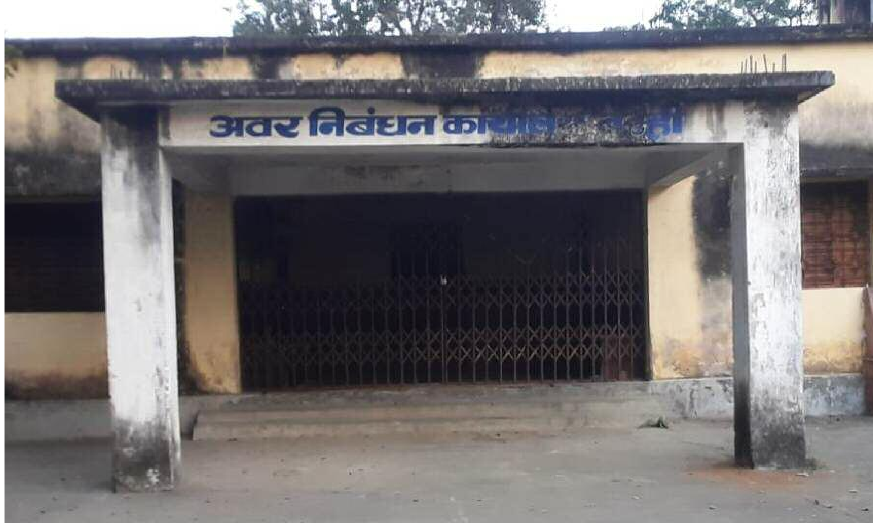
विरान पडा निबंधन कार्यालय