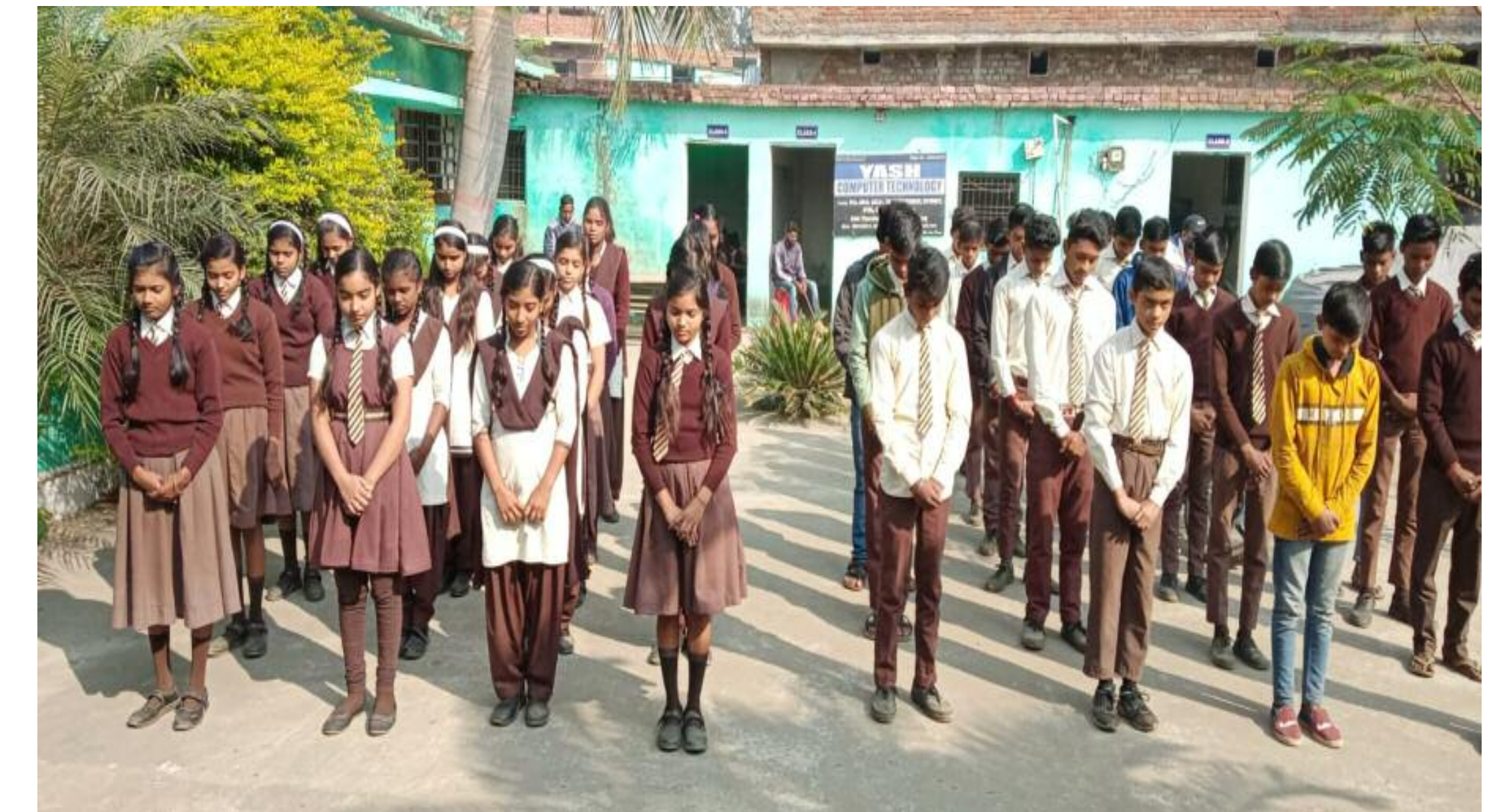
शोक सभा में शामिल लोग