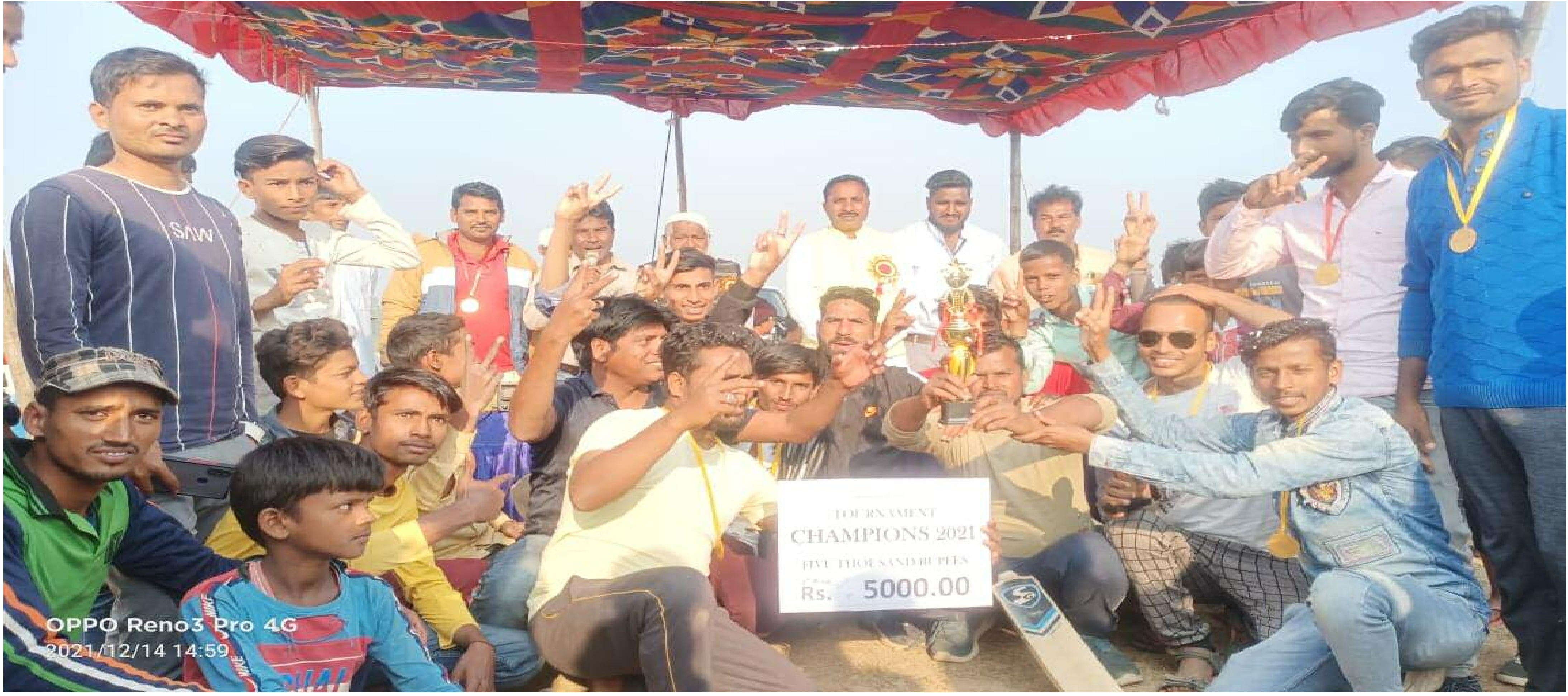
विजेता टीम को पुरस्कृत करते अतिथि