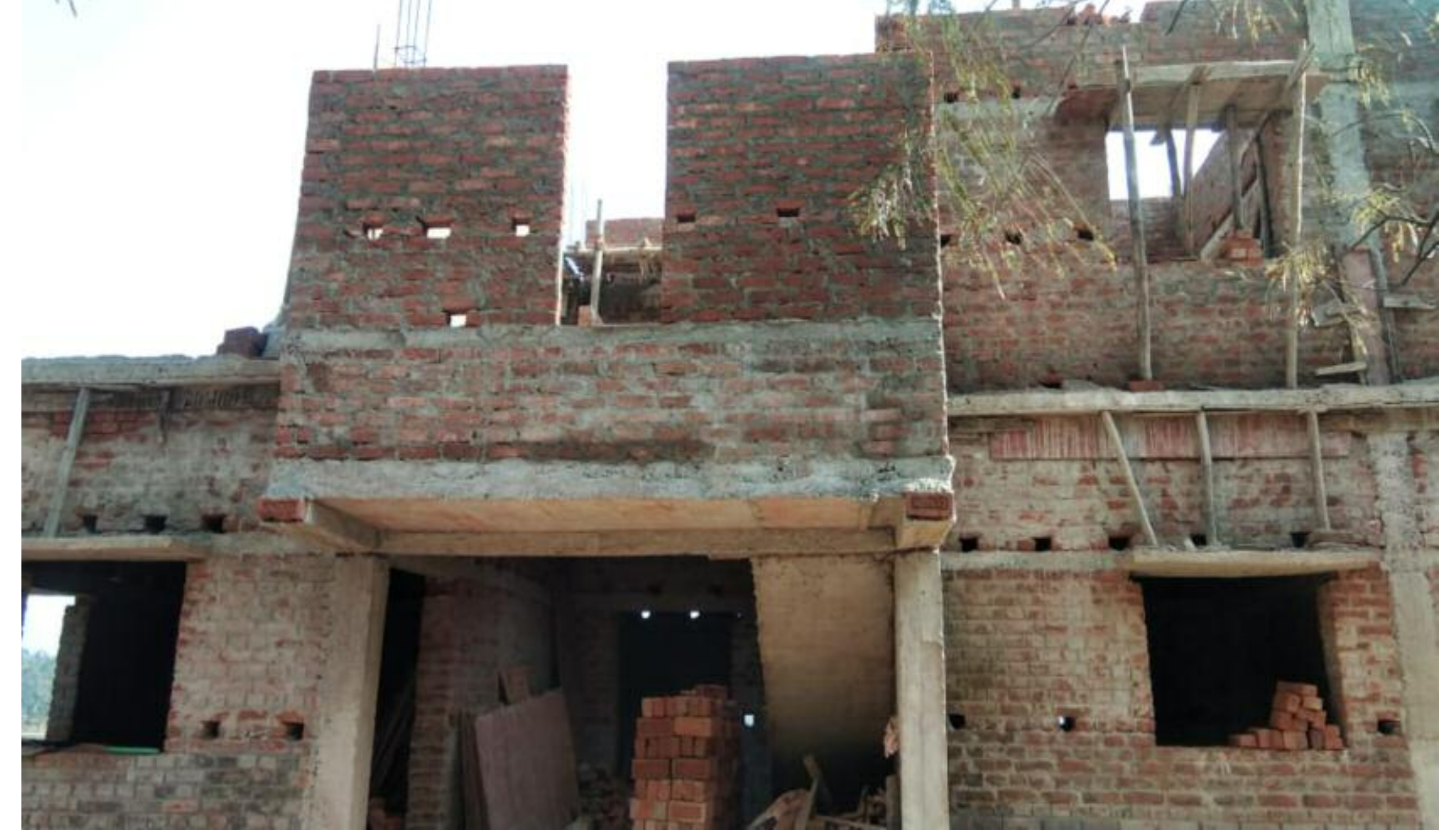
निर्माणाधीन स्वास्थ्य उपकेंद्र भवन

टाटीझरिया के होलंग स्थित निर्माणाधीन स्वास्थ्य उपकेंद्र भवन निर्माण में घोर अनियमितता बरतने का आरोप स्थानीय ग्रामीणों एवं जनप्रतिनिधियों ने लगाया है। जानकारी के अनुसार यह स्वास्थ्य उपकेंद्र भवन निर्माण विभाग के द्वारा लाखों रुपये खर्च कर बनाया जा रहा है। स्थानीय जनप्रतिनिधि व ग्रामीणों ने उक्त भवन निर्माण में प्राक्कलन को नजरअंदाज कर काम करवाये जाने का आरोप लगाया है। कहा कि कई बार उनके द्वारा स्वास्थ्य उपकेंद्र बनाने की मांग की गई तब जाकर इसे स्वीकृति मिली। लेकिन टेकेंदार द्वारा भवन निर्माण में घटिया किस्म के ईंट और सामान का प्रयोग किया जा रहा है। जो कतई बर्दाश्त नहीं किया जाएगा।