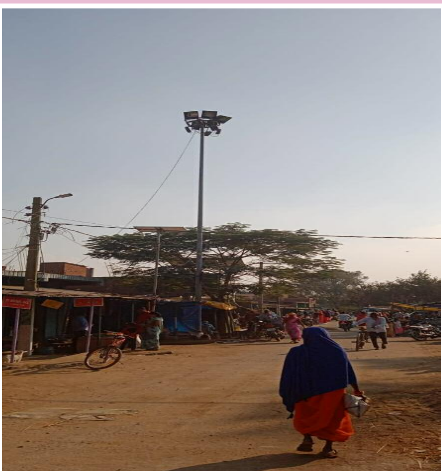
खराब पड़ा स्ट्रीट लाइट

प्रखंड के झरपो बुध बाजार चौक का स्ट्रीट लाइट वर्षों से खराब पड़ा हुआ है। इसे देखने वाला कोई नहीं है। लाखों रुपये की लागत का स्ट्रीट लाइट झरपो के बुधबाजार चौक पर लगा हुआ है। यहां सप्ताह में दो दिन बाजार लगता है जो शाम तक रहता है। लाइट नहीं रहने से अंधेरे में सब्जी विक्रेता और ग्रामीणों को काफी परेशानियां उठानी पड़ती है। यहां छोटी-बड़ी 30 दुकानें हैं और यहां गाड़ियों का भी ठहराव होता है। यहां अश्विनी दुर्गा पूजा