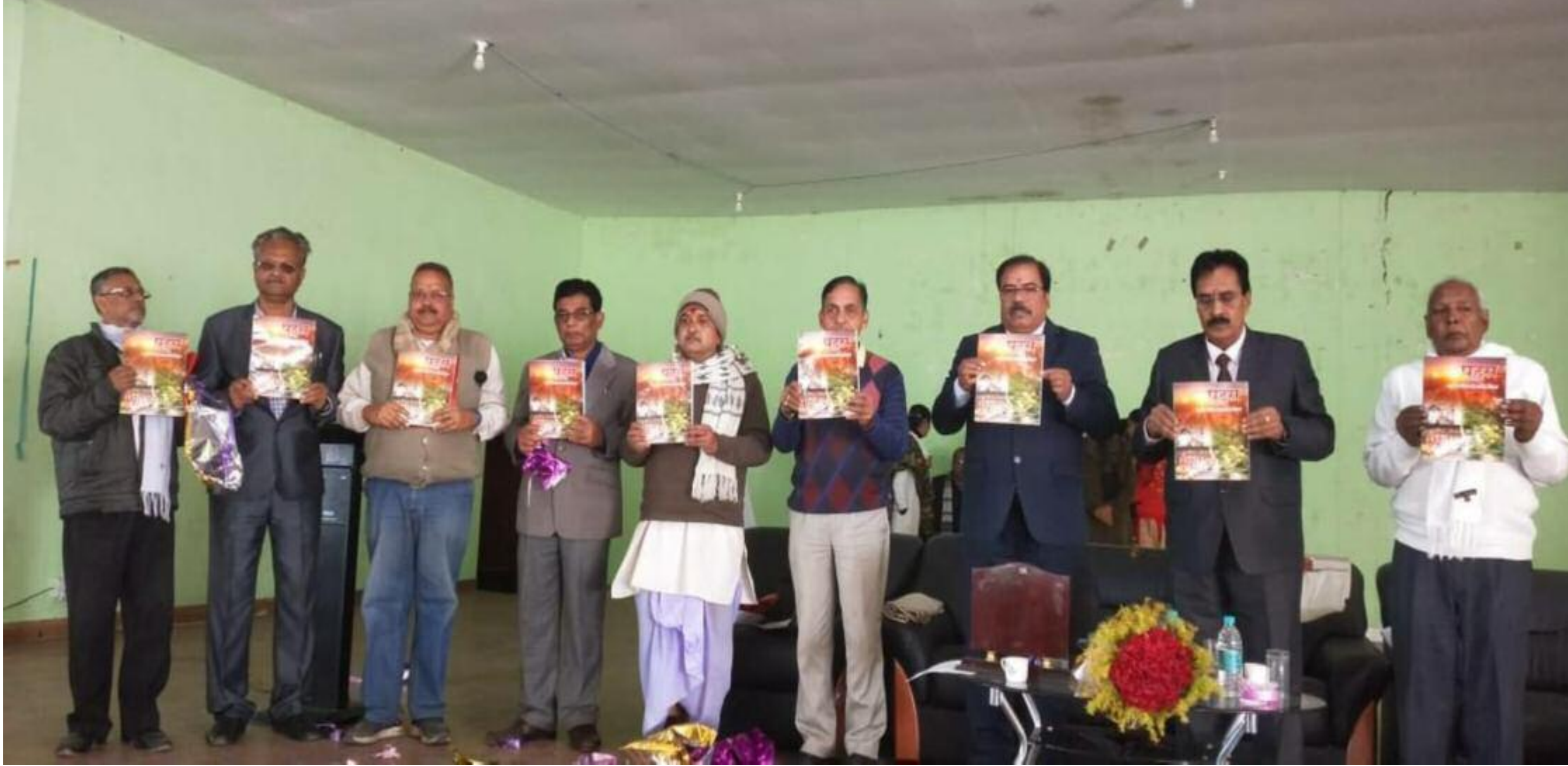
पुस्तक का विमोचन करते अतिथि