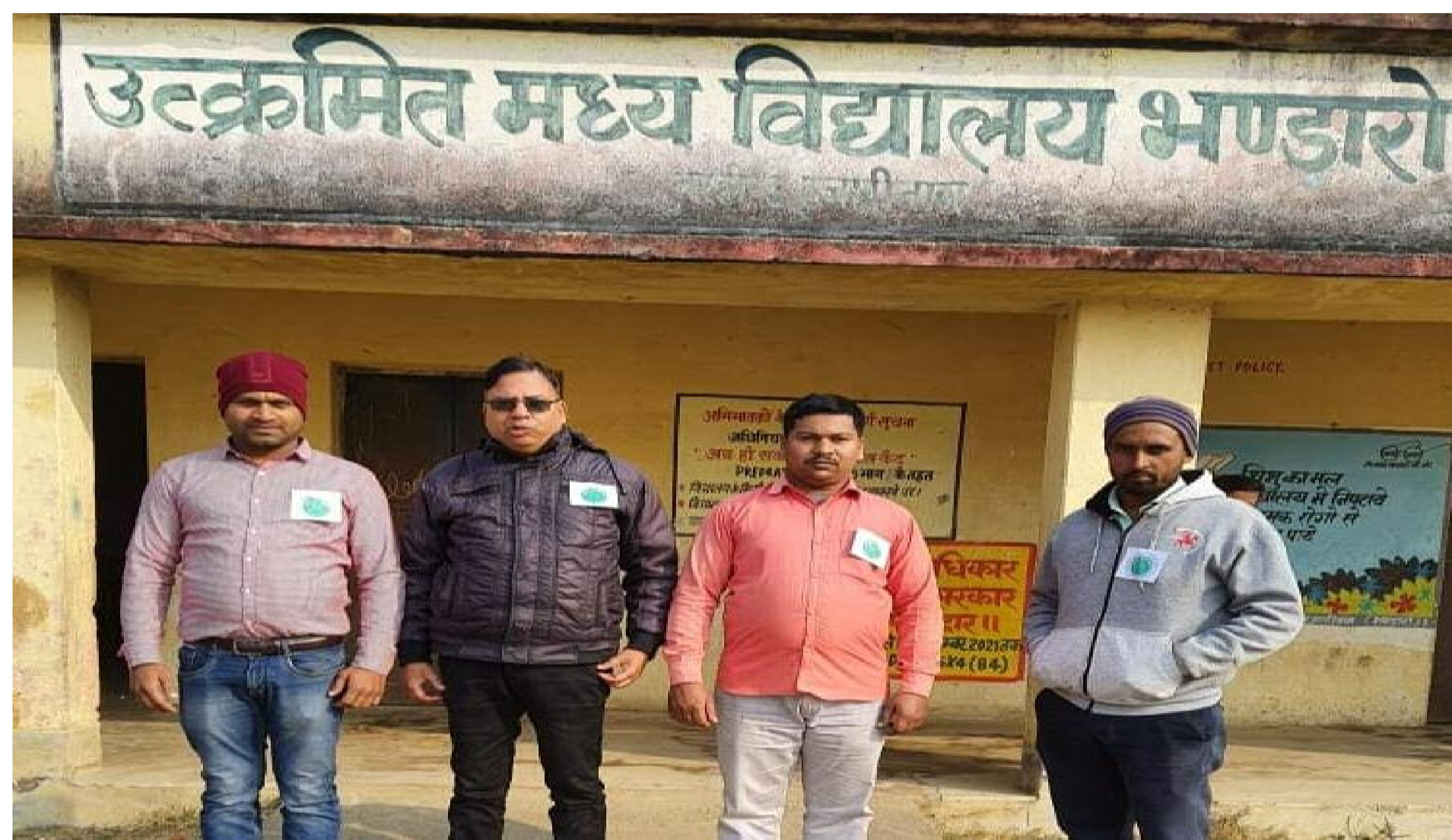
विरोध जताते शिक्षक