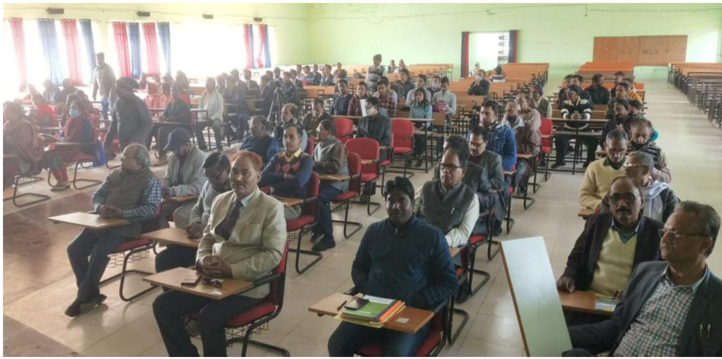
कार्यक्रम में शामिल लोग

22 मार्च 2020 से लॉकडाउन के दौरान 7 अप्रैल 2020 से आधुनिक तकनीकी सुविधाओं के बगैर इस कॉलेज के शिक्षकों ने ऑनलाइन कक्षा लेने का बीड़ा उठाया। आज इस कॉलेज के पीजी के विद्यार्थियों ने उत्कृष्ट प्रदर्शन कर कॉलेज को गौरवान्वित किया है। इस कॉलेज में सिविल सर्विसेज एस्पिरेशन क्लब का गठन किया गया है, इसमें विद्यार्थियों की निरुत्थुक सिविल सर्विसेज की परीक्षा की तैयारी कराई जाएगी। इस कॉलेज में विद्यार्थियों के लिए वातानुकूलित अध्ययन कक्षा विद्यमान है। कॉलेज में सप्ताह में विद्यार्थियों का एक दिन लाइब्रेरी में पुस्तकों का अध्ययन करना जरूरी कर दिया जाएगा। आधारभूत संरचनाओं के अभाव में कॉलेज में बाह्य एवं इंडोर खेल जारी है। प्राचार्य ने कहा कि पुस्तक पत्रिका हजारीबाग के प्रकृति की प्रतीक है। उन्होंने कहा कि इस