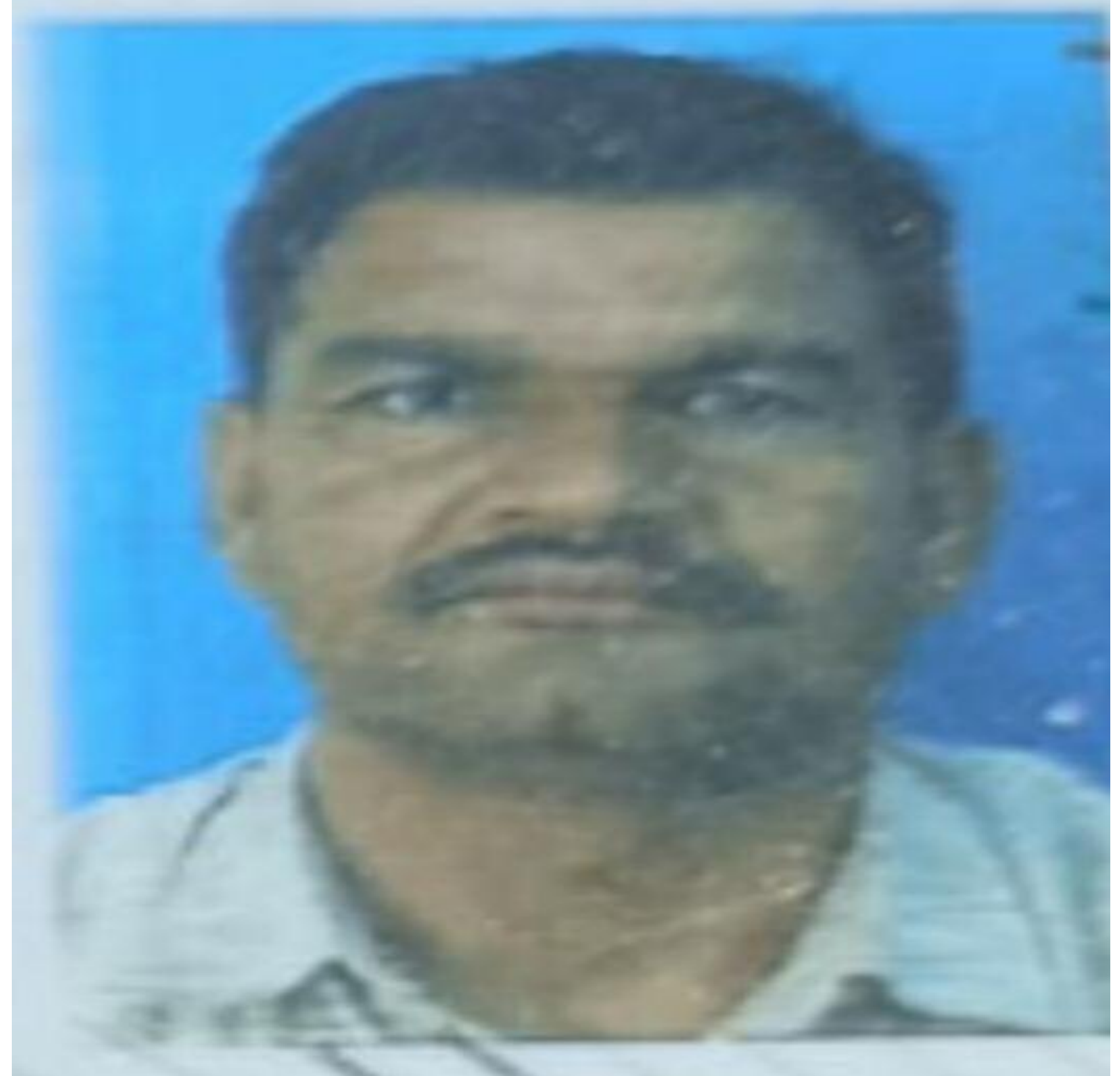
मृतक का फाइल फोटो

हजारीबाग के विष्णुगढ़ थाना क्षेत्र के अचलजामो में कुट्टी काटने के दौरान मशीन में फंस जाने से युवक की मौत हो गई। युवक राजस्थान भरतपुर का रहने वाला था। वह गांव-गांव में घूम कर कुट्टी काटने का काम करता था। बुधवार की सुबह कुट्टी काटने के दौरान युवक मशीन में फंस गया। घटना की सूचना मिलते ही विष्णुगढ़ थाना प्रभारी घटनास्थल पर पहुंचकर शव को कब्जे में कर पोस्टमार्टम के लिए भेज दिया।