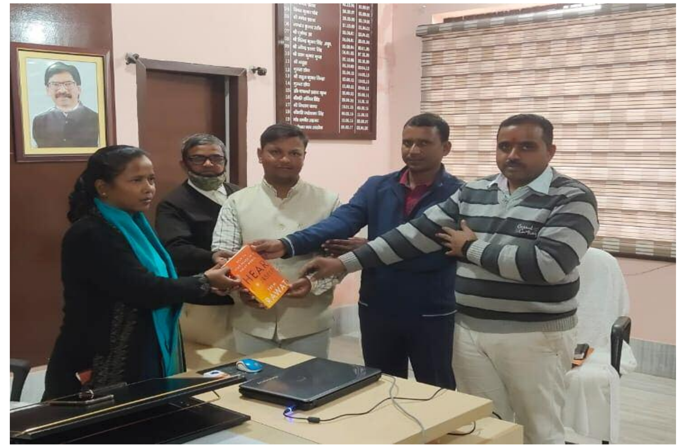
एसडीओ को पुस्तक भेंट करते हुए