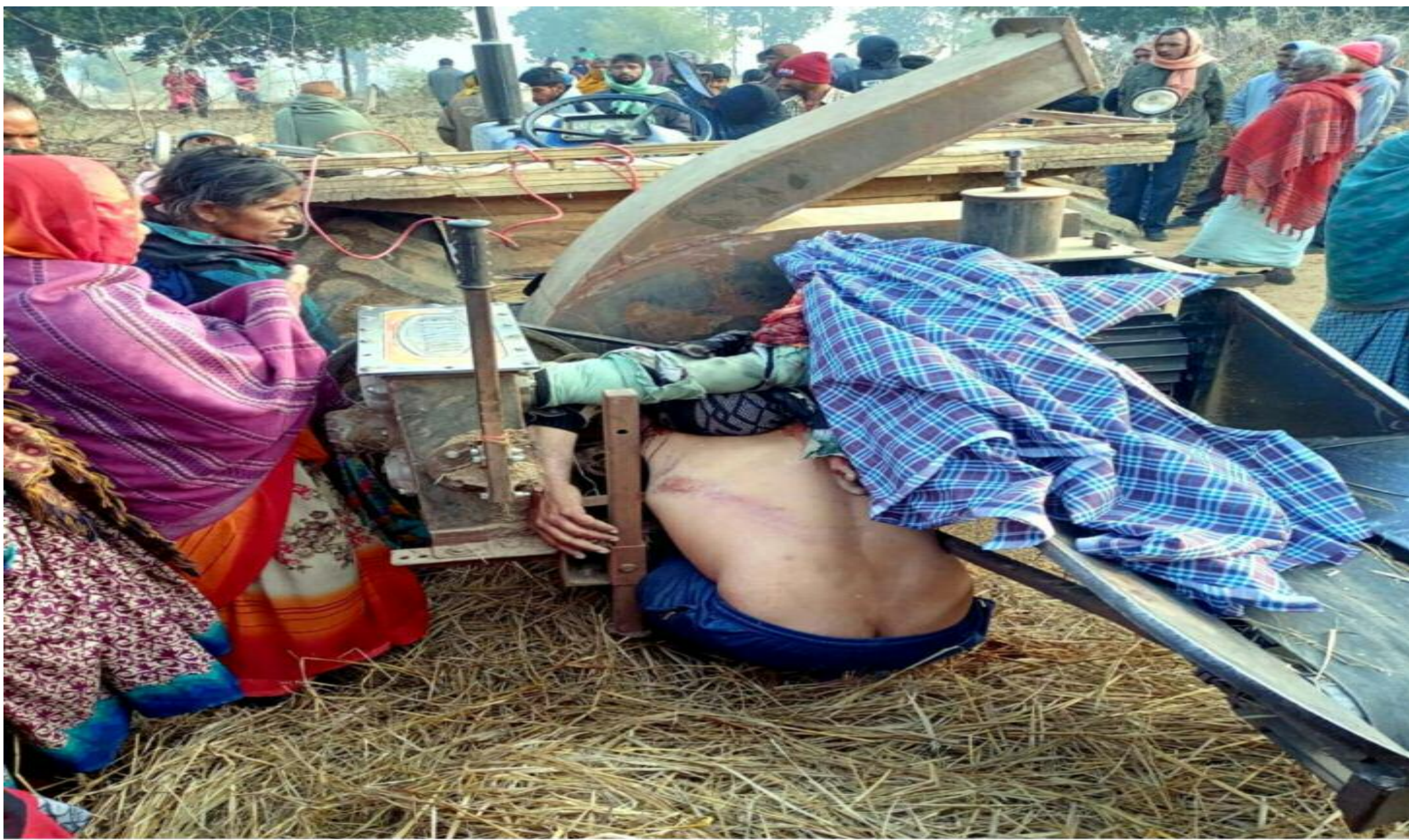
विष्णुगढ़ में हादसे के बाद जुटे ग्रामीण

अपेम लाइव : विष्णुगढ़ मिथिलेश कुमार बर्मन