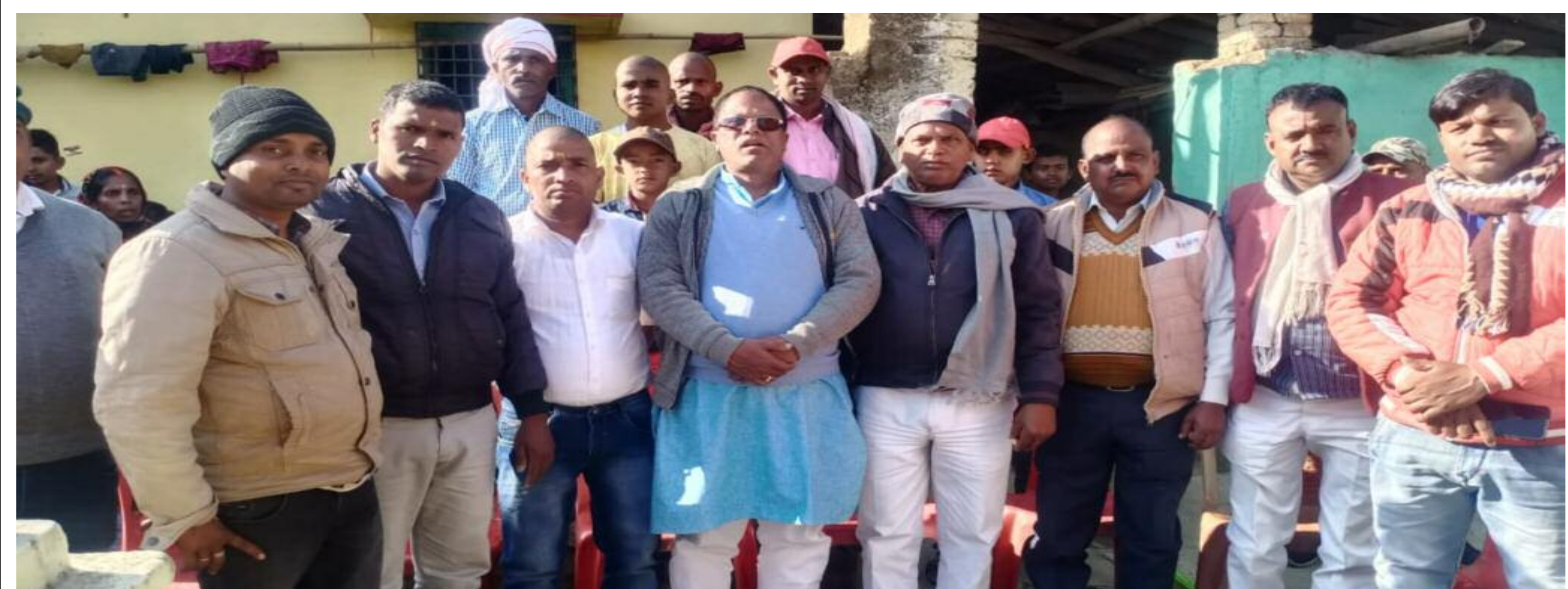
श्राद्ध कार्यक्रम में शामिल पूर्व विधायक व अन्य