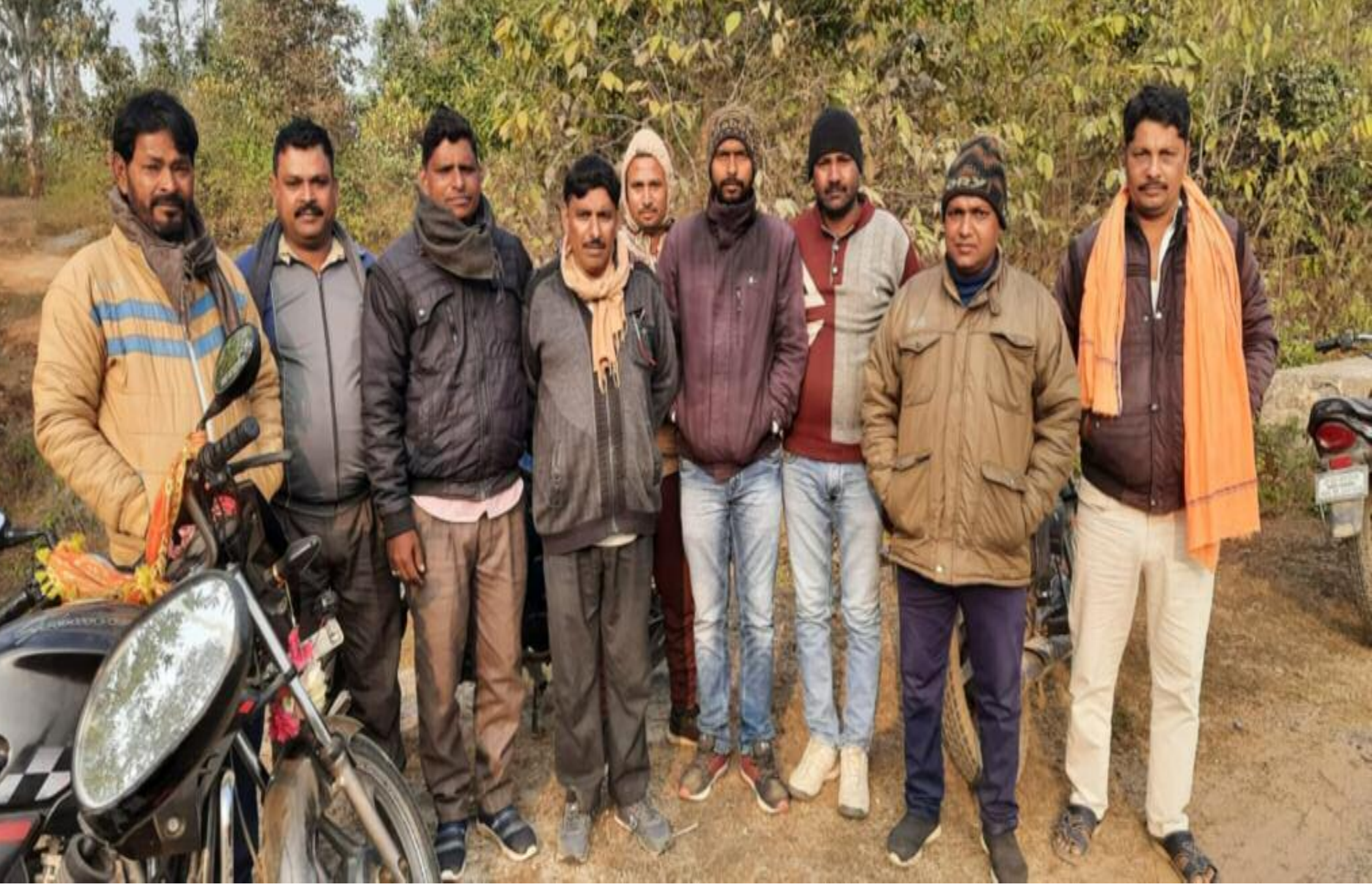
जंगल बचाओ अभियान में शामिल लोग

बरकठठा: प्रखंड के कोनहरा कला, कुमरडीहा जंगल में लोग धड़ल्ले से जंगल कि कटाई कर रहे हैं। साथ ही कुछ लोगों के द्वारा वन भूमि पर अतिक्रमण करते हुए फसल लगा दिया गया है। इसकी सूचना कई बार वन विभाग के अधिकारियों को दिया गया है। परंतु अबतक उचित कानूनी कार्रवाई नहीं करने के कारण जंगल काटने और अतिक्रमणकारियों के हौसले बुलंद हैं। शनिवार को कुछ ग्रामीण समाजसेवी लोगों ने जंगल बचाव अभियान चलाया और जंगल काट रहे लोगों को खड़े साथ ही पर्यावरण के विषय में जानकारी देते हुए जंगल नहीं काटने की सलाह दी। वहीं वन विभाग के