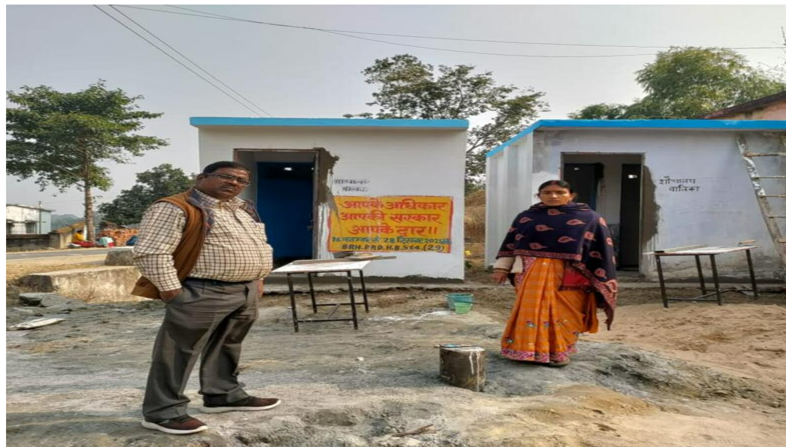
डीप बोरिंग दिखाते हुए

शौचालय को पुनः मरम्मत कर उपयोग लायक बनाना एनटीपीसी का दायित्व बनता है। एनटीपीसी हमेशा ही अपने दायित्व का निर्वाह करते हुए एवं बच्चों एवं अध्यापकों के भविष्य को ध्यान में रखते हुए सीएसआर के माध्यम से जो भी खराब पड़े हुए शौचालय हैं। उनको चालू करना चाहती। पानी का समुचित व्यवस्था करना एनटीपीसी का दायित्व बनता है। यदि किसी भी विद्यालय से एक अच्छे नागरिक एवं छात्र अच्छा कब निकलता है उन्हें यह जरूर एहसास होगा कि एनटीपीसी ने हमेशा ही अच्छा काम करती है। वह जिस भी प्रयोजना में या सरकार के किसी भी विभाग में जब होंगे तो उनको एनटीपीसी