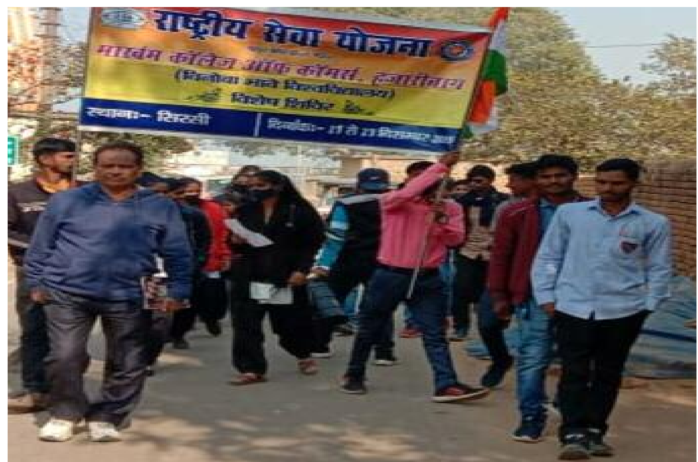
स्वच्छता अभियान में शामिल लोग

हजारीबाग : 22 दिसंबर रू स्थानीय सिरसी गांव में मार्खम कॉलेज के एनएसएस इकाई एक के तत्वावधान में सात दिवसीय विशेष शिविर के दूसरे दिन स्वयंसेवकों ने वीमीक्रॉन कोरोना वायरस जागरूकता अभियान चलाया। इस दौरान स्वयंसेवकों ने घर-घर सर्वेक्षण कर कोविड-19 महामारी में कोरोना बीमारी से सुरक्षा के लिए वैक्सिनेशन के महत्व की जानकारी दी। स्वयंसेवकों ने प्रत्येक घर में वैक्सीनेशन से वंचित घरवालों की जानकारी ली। स्वयंसेवकों ने पाया कि गोद लिए गए गांव सिरसी में पूर्व में चलाए गए वैक्सीनेशन जागरूकता अभियान से ग्रामवासियों में वैक्सीनेशन के प्रति काफी जागरूकता आई है। वैक्सीनेशन जागरूकता अभियान के पश्चात स्वच्छ भारत मिशन के तहत स्वयंसेवकों ने गांव की सफाई अभियान