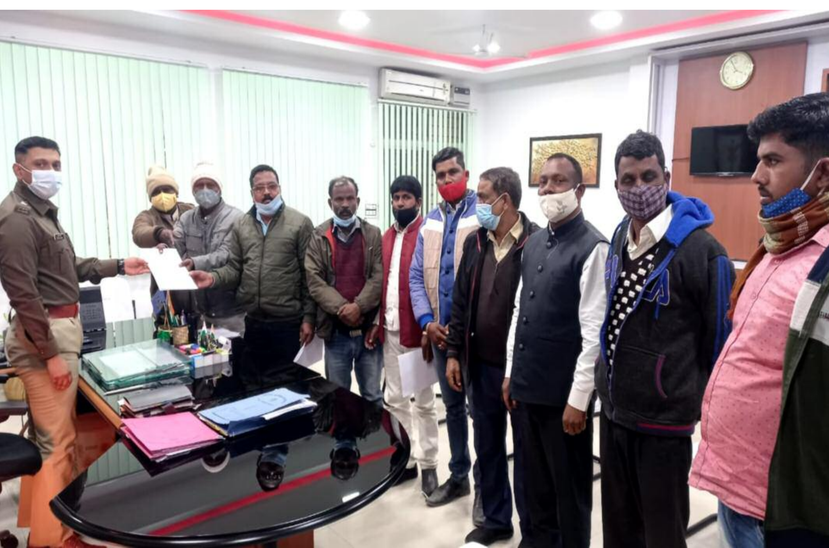
एसपी को ज्ञापन सौंपते दलित उत्पीड़न समिति के लोग