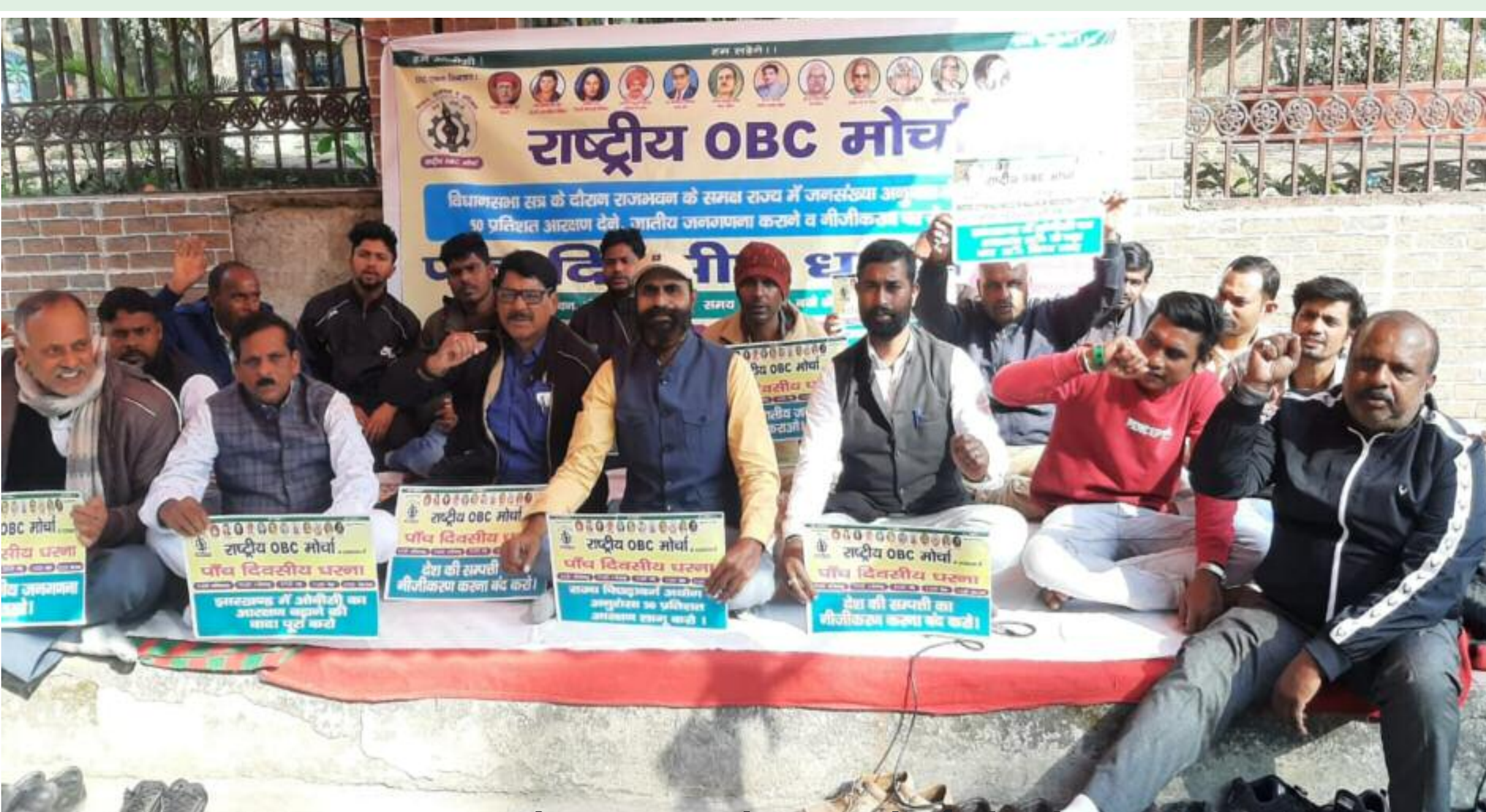
धरना में शामिल ओबीसी मोर्चा के लोग