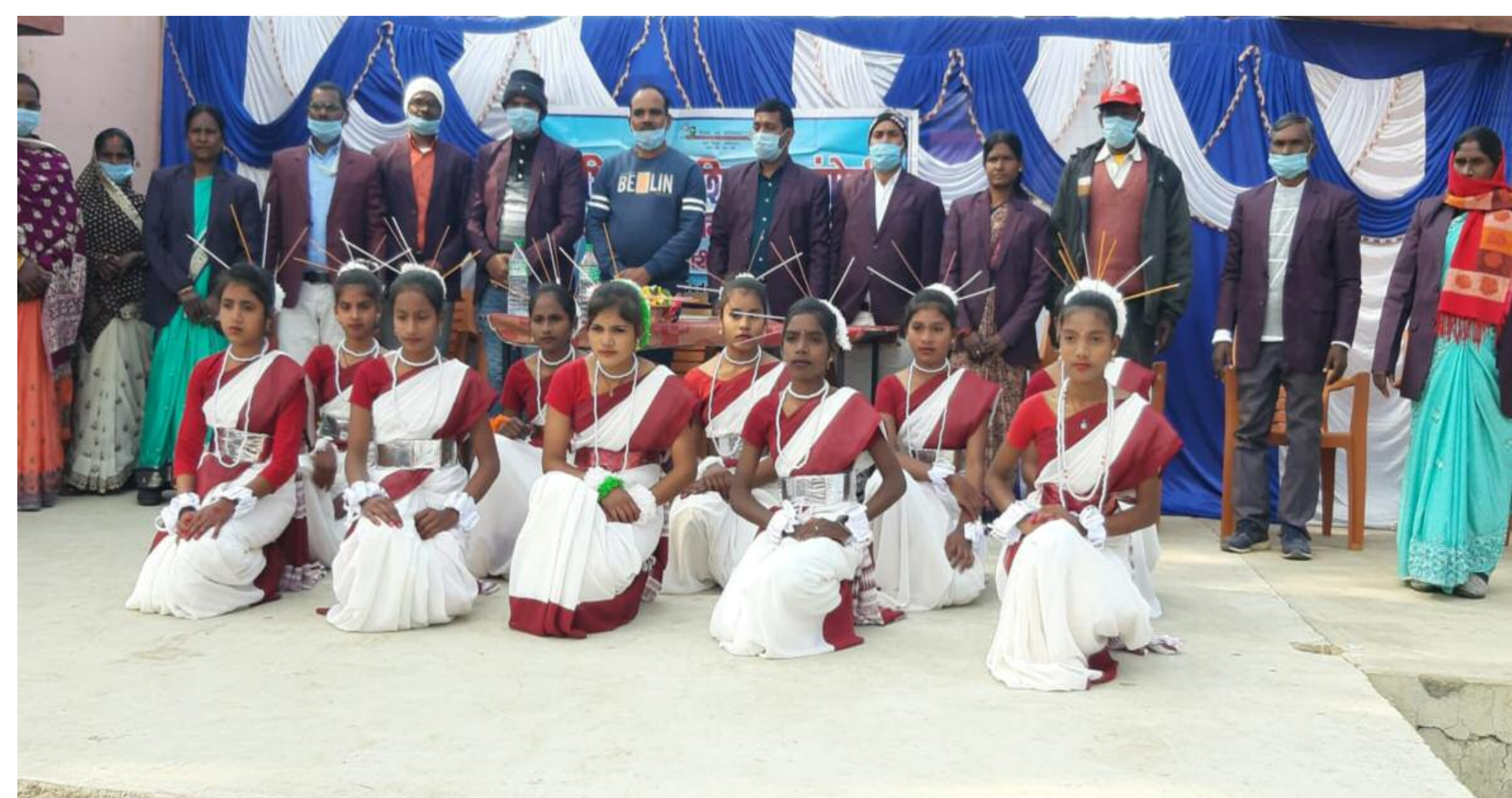
कार्यक्रम में शामिल छात्र व शिक्षक