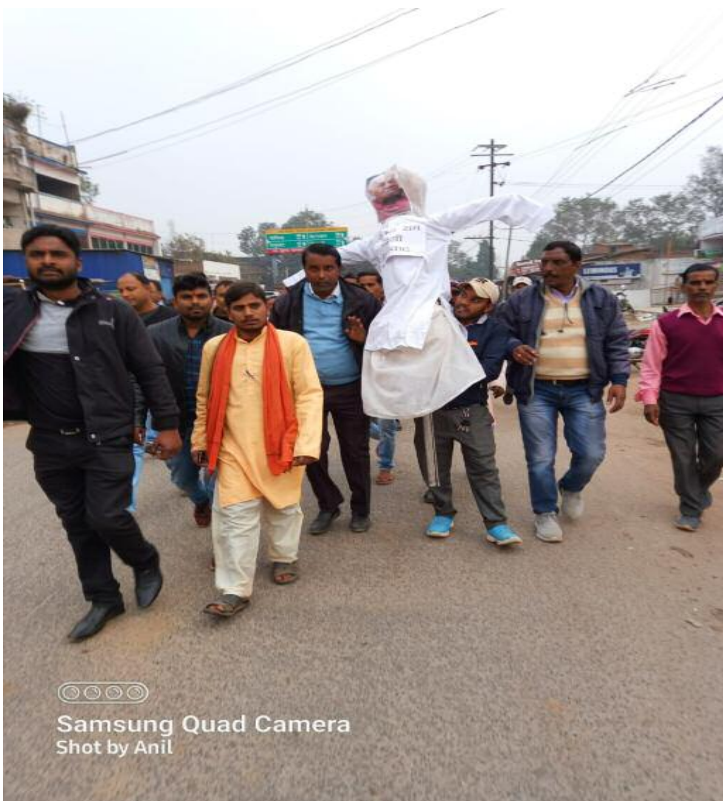
विरोध मार्च में शामिल ब्राह्मण समाज के लोग