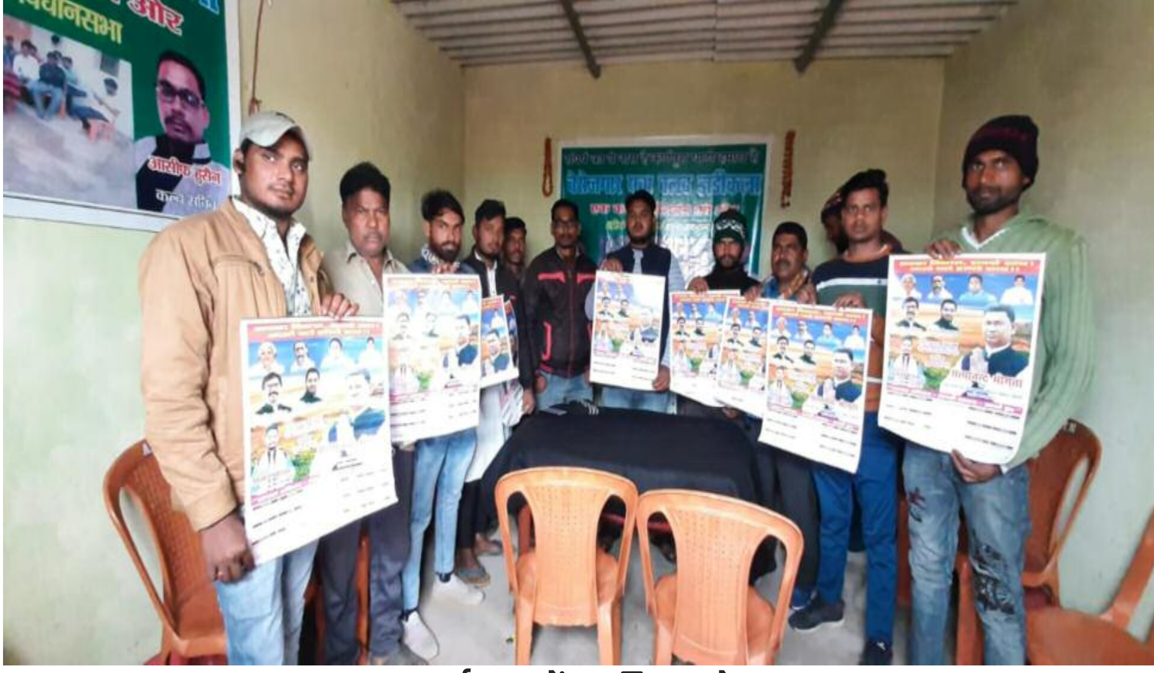
कार्यक्रम में शामिल लोग