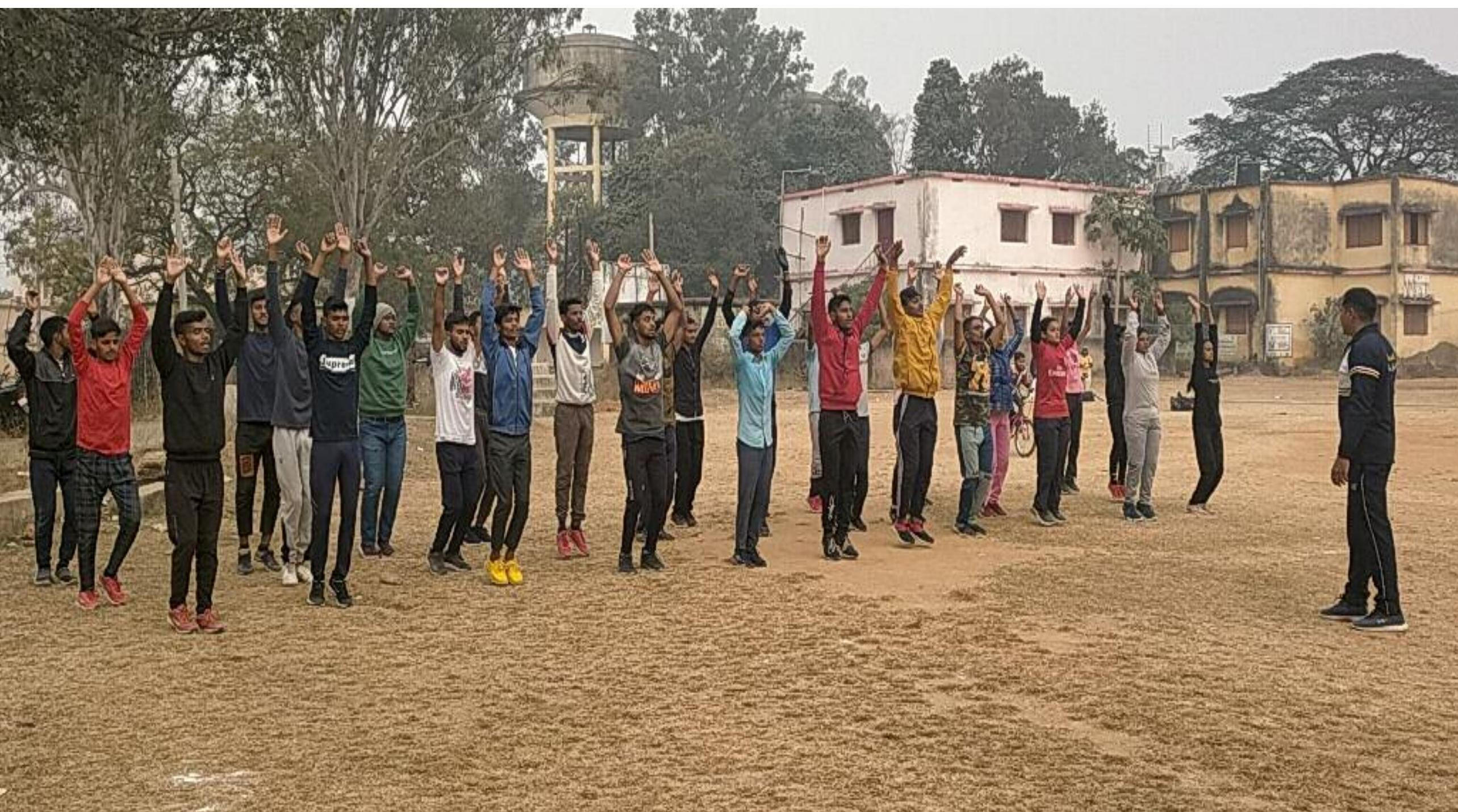
शारीरिक फिटनेस क्लास में शामिल प्रतिभागी

3 जनवरी 2022 से होगा थ्योरी क्लास चालू, नामांकन के लिए मो0 7070459803 , 6200832770, 8709962329 पर करें संपर्क, फिटनेस क्लास जारी