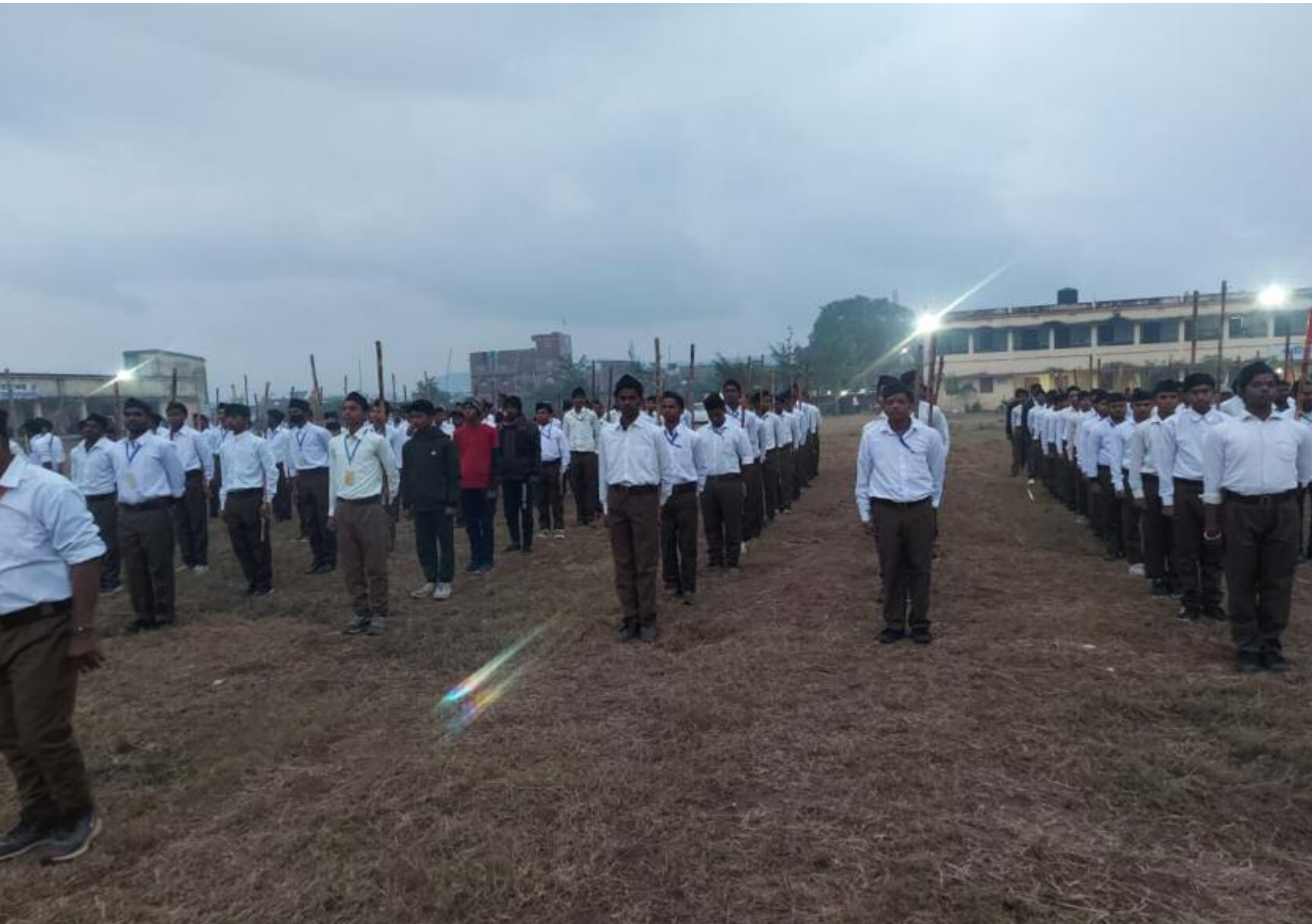
शाखा में शामिल राष्ट्रीय स्वयंसेवक संघ के लोग

बड़कागांव गुरुदयाल महतो बालिका उच्च विद्यालय प्रांगण में राष्ट्रीय स्वयंसेवक संघ की ओर से संचालित सात दिवसीय शाखा प्रशिक्षण कार्यक्रम बुधवार को संपन्न हो गया। प्रशिक्षण शिविर कार्यक्रम में राष्ट्रीय स्वयंसेवक संघ के जिले से कुल 192 सदस्य गण शामिल हुए। राष्ट्रीय स्वयंसेवक संघ शाखा प्रशिक्षण शिविर में शारी. रिक, मानसिक, बौद्धिक, व्यायाम, दंड प्रहार एवं न्यूथ(कराटे) का प्रशिक्षण दिया गया। राष्ट्रीय स्वयंसेवक संघ शाखा का सात दिवसीय प्रशिक्षण शि. विर का आयोजन किया गया जिसमें 7 दिनों तक शारीरिक, मानसिक, बौद्धिक, व्यायाम, दंड प्रहार एवं न्यूथ(कराटे) का प्रशिक्षण दिया गया। मुख्य अतिथि