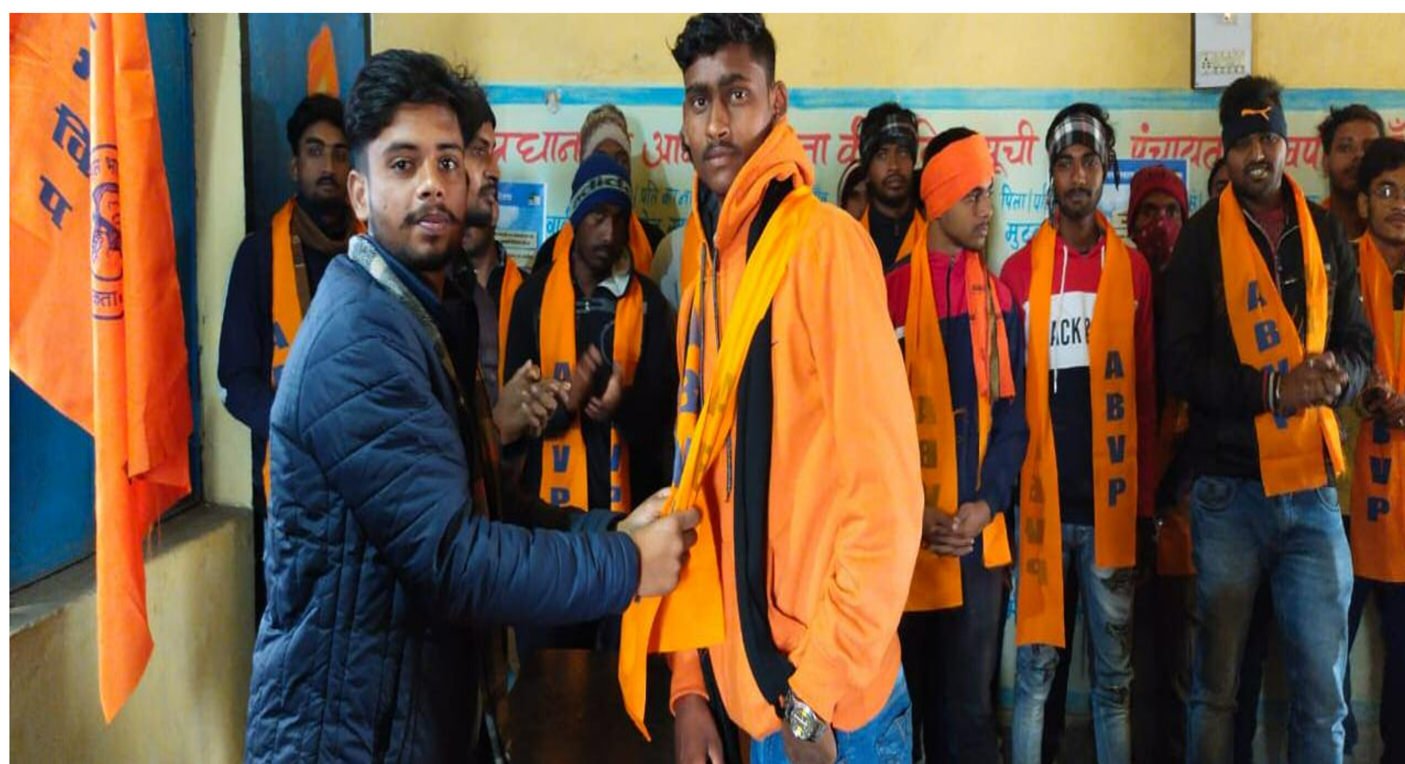
कार्यकर्ता का स्वागत करते हुए