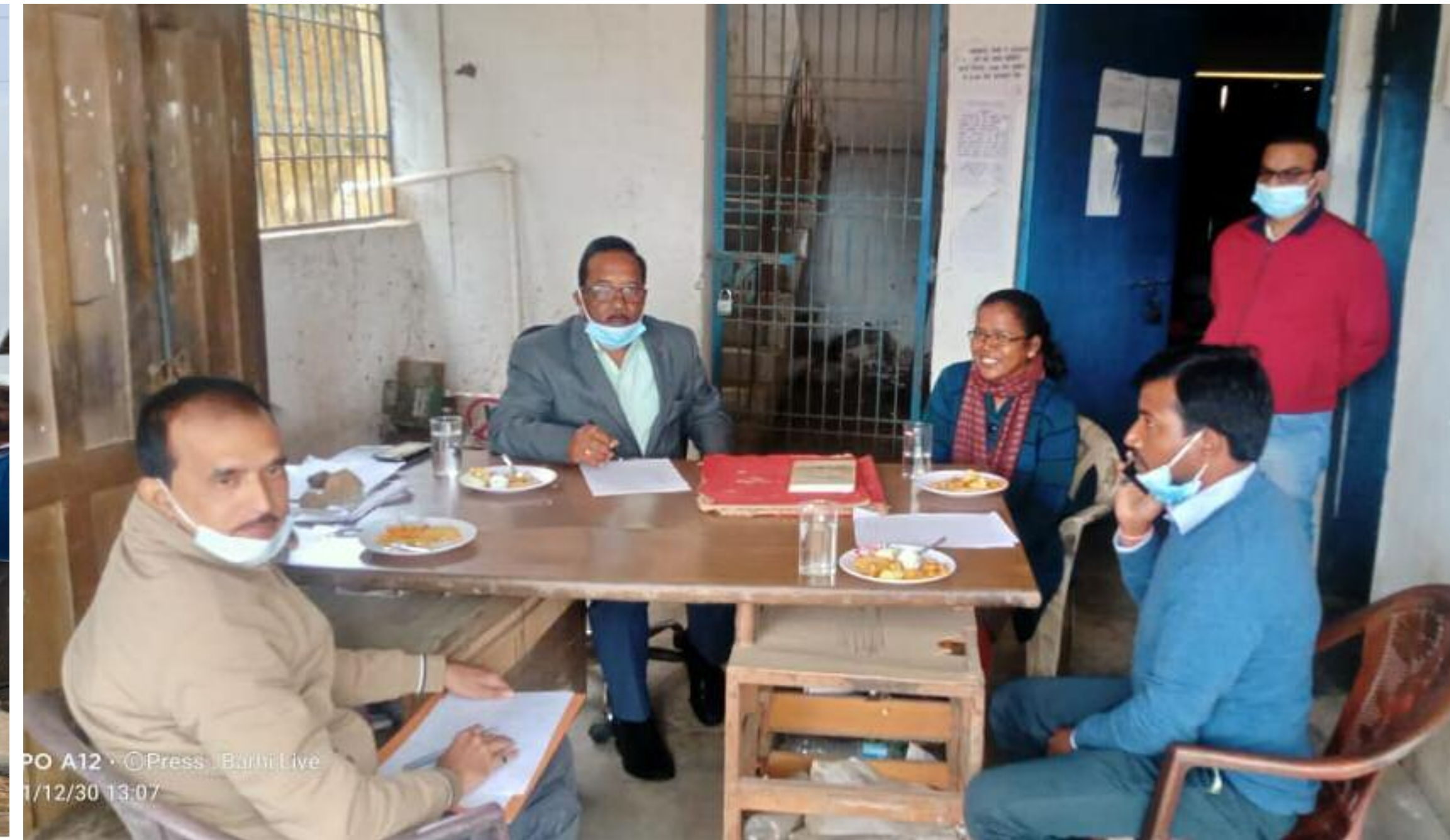
निरिक्षण करते हुए