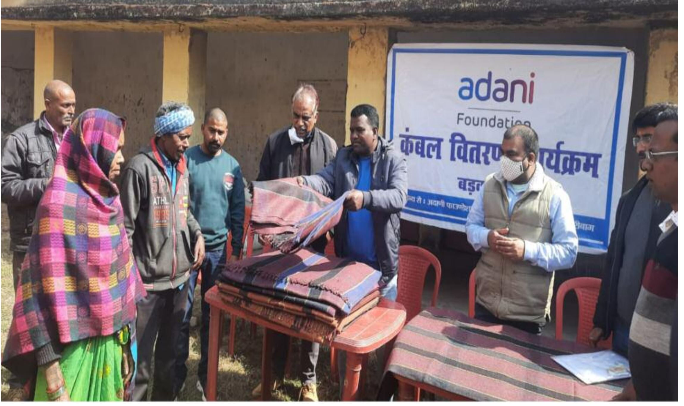
कंबल वितरण करते अधिकारी

बडकागाँव अडाणी फाउंडेशन की ओर से सामुदायिक विकास कार्यक्रम के तहत शुक्रवार को गाली प्राथ. मिक विद्यालय में ग्रामीणों के बीच कंबल का वितरण किया गया। कुल 280 जरूरतमंद लोगों के बीच कंबल का वितरण किया गया इस कंपनी का ठंड में कंबल पाकर ग्रामीण बेहद खुश नजर आए। इस अवसर पर अडाणी गा. डुलपारा कोथला खनन परियोजना के अधिकारियों ने कहा कि आने वाले समय में अडाणी फाउंडेशन की ओर से इलाके के