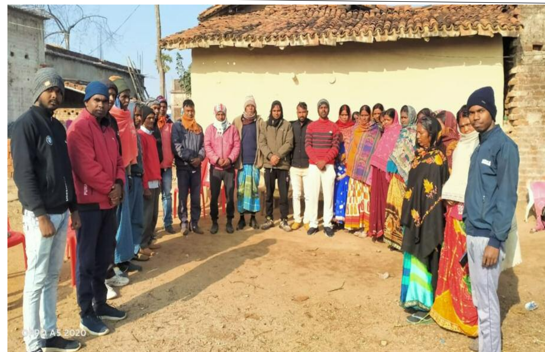
बैठक में शामिल लोग