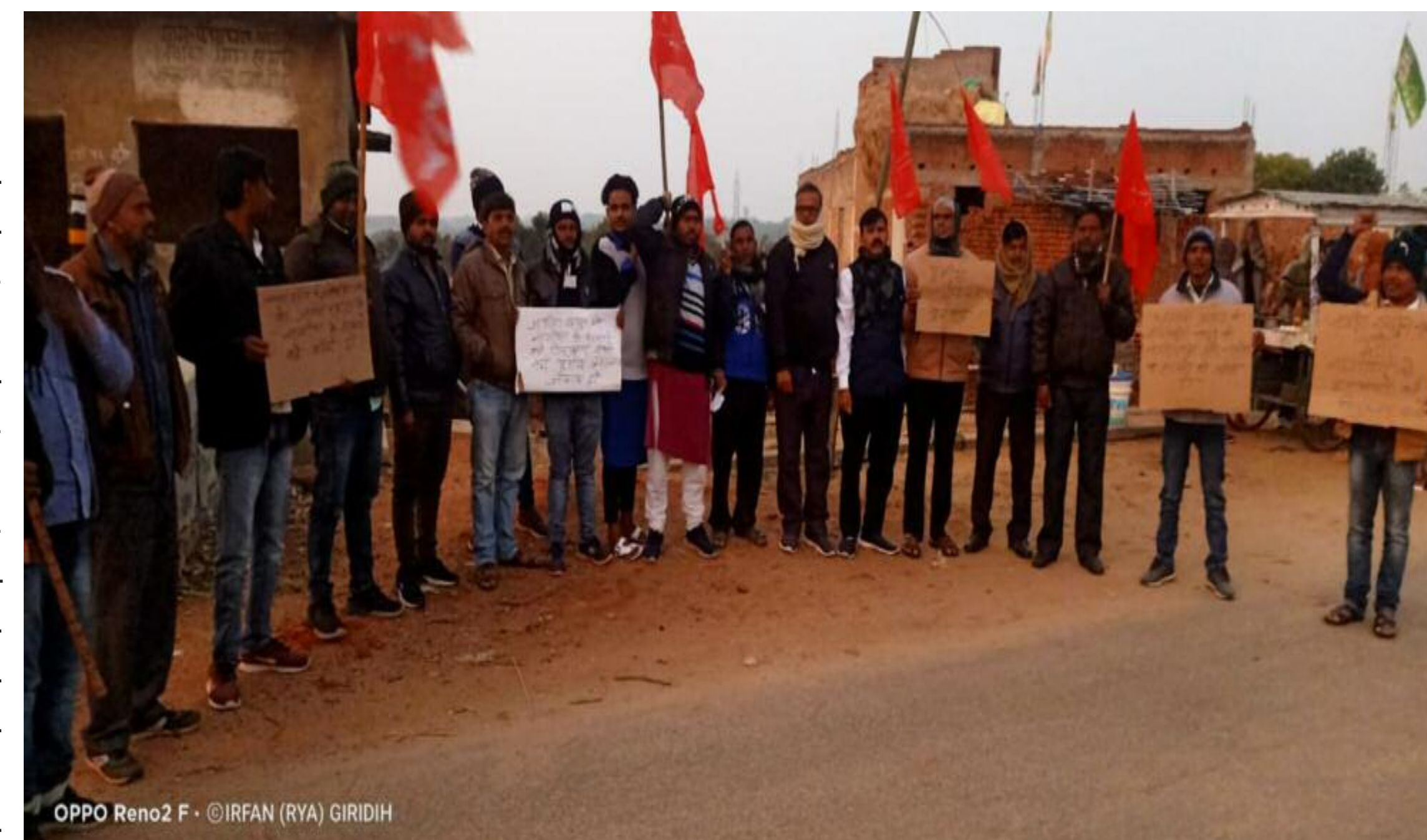
प्रतिरोध मार्च में शामिल लोग