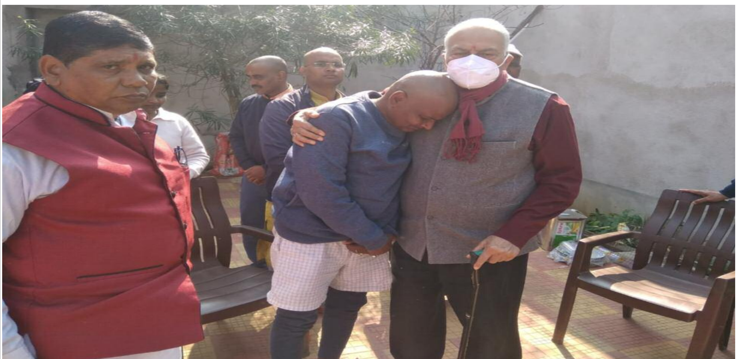
सांत्वना देते पूर्व केंद्रीय मंत्री यशवंत सिन्हा

पूर्व केंद्रीय मंत्री यशवंत सिन्हा श्राद्ध कार्यक्रम में शामिल होकर शोकाकुल परिवार को बंधाया ढाढ़स