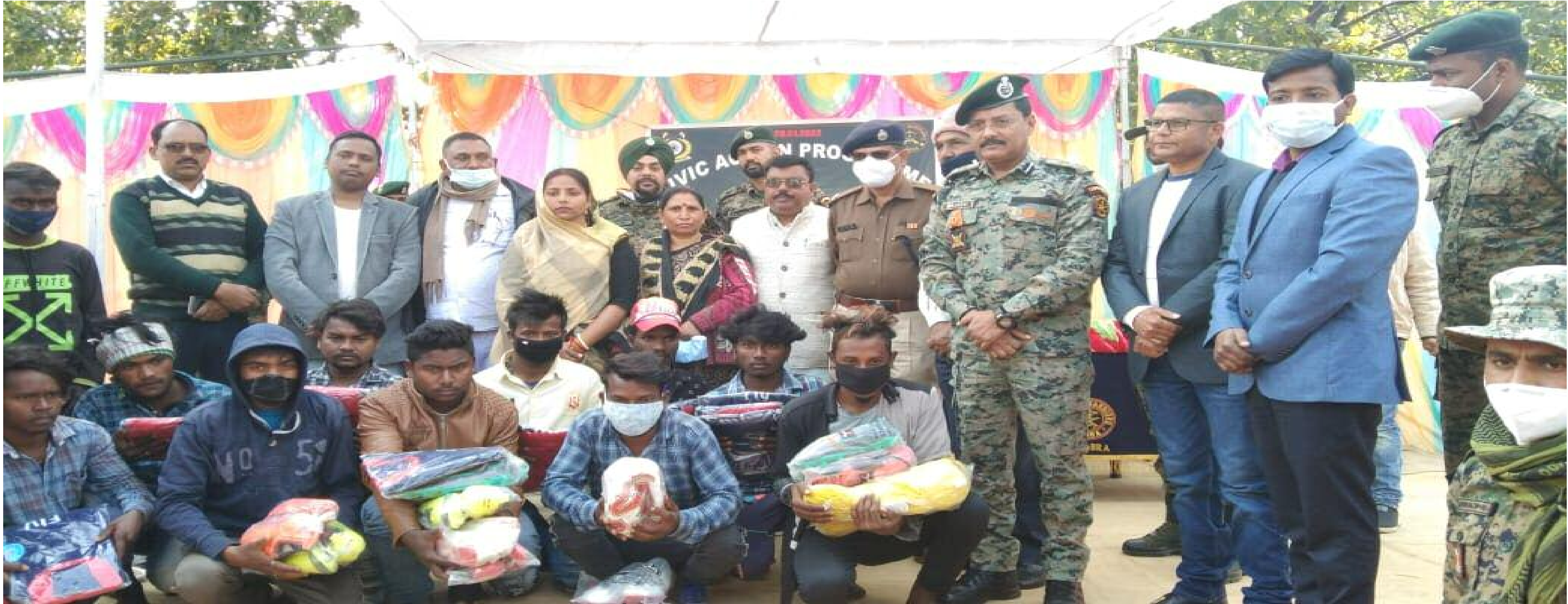
कम्बल, मच्छरदानी, बैग व फुटबॉल किट का वितरण करते अधिकारीगण

सिविक एक्शन प्रोग्राम के तहत 520 लोगों को कम्बल, मच्छरदानी, स्कूल बैग, और फुटबॉल किट का वितरण किया