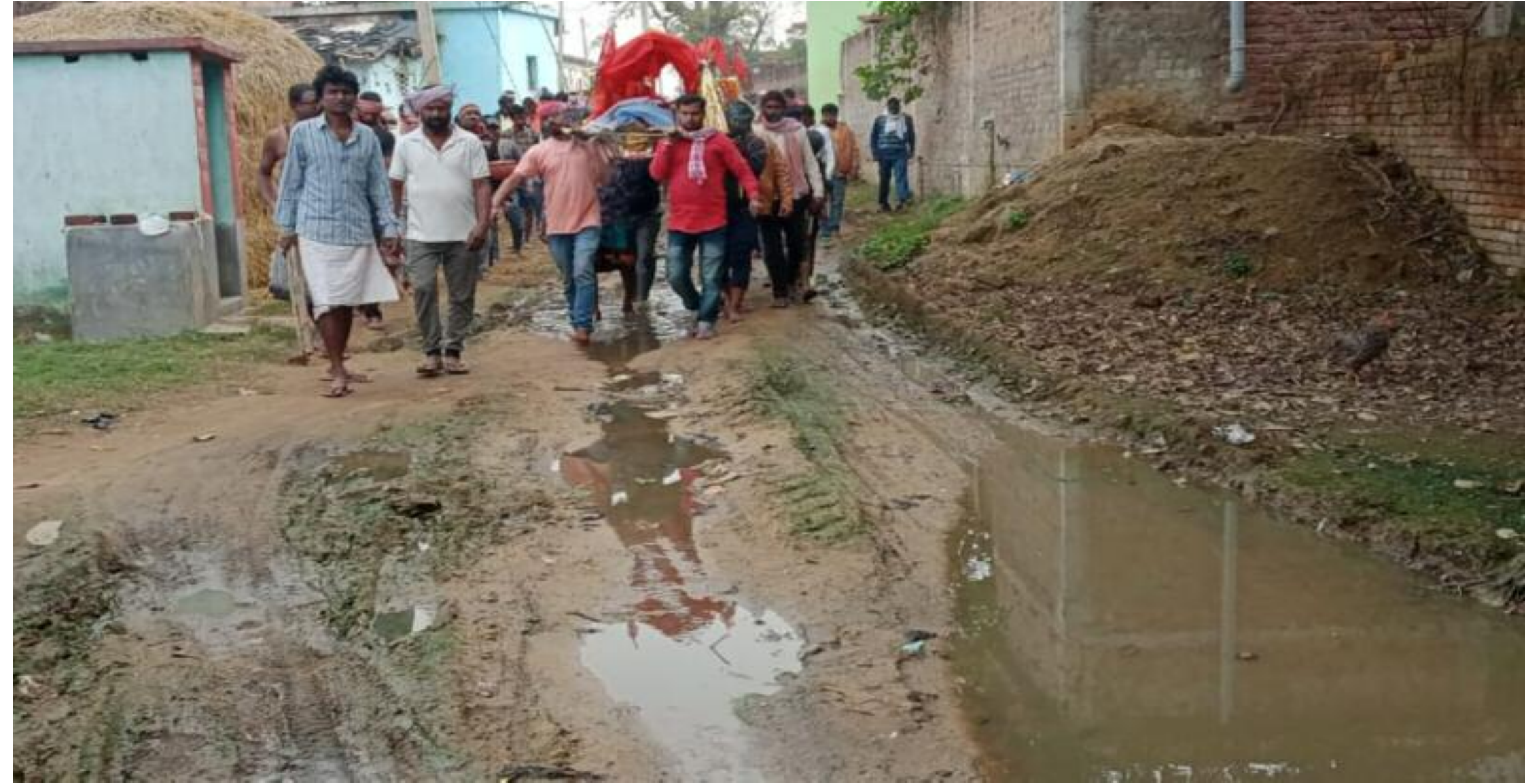
जर्जर रोड से गुजरते अंतिम संस्कार में शामिल ग्रामीण

बडकागाँव : प्रखंड अंतर्गत मध्य पंचायत के ठकुर मो. हल्ला का शमशान जाने वाली मार्ग इन दिनों बंद से बदतर हो गई है। रोड में पैदल चलना भी ग्रामीणों को मुश्किल हो गया है। उक्त मार्ग में नाली का व्यवस्था नहीं होने के कारण ठकुर मोहल्ला का पानी इसी रास्ते से होकर खुले में बह रहा है। जिससे रोड में कीचड़ एवं गंदा पानी से हमेशा भरा रहता है। उक्त जर्जर मार्ग से आवागमन कर रहे हैं लोगों को दुर्गंध एवं मच्छरों का सामना करना पड़ता है। अन्य दिनों के अलावा स्थानीय लोगों के लिए समस्या तब बड़ी हो जाती है जब ग्रामीणों को