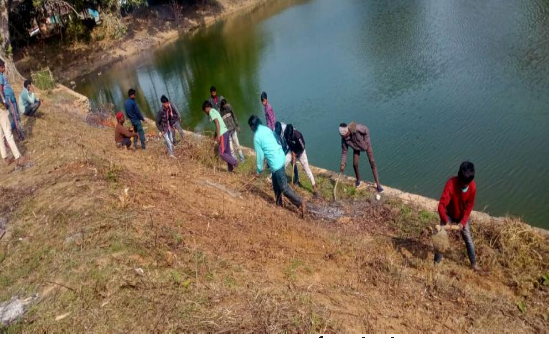
तालाब की साफ सफाई करते लोग