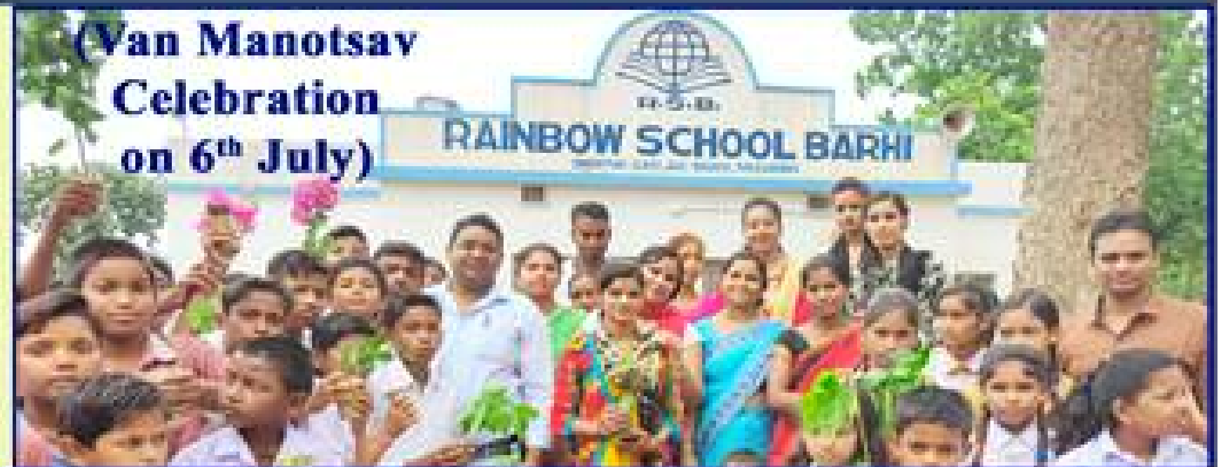
(Van Manotsav Celebration on 6 th July)

Built a Bright Future for Your Child. Give Your Child Education of Heart & Soul