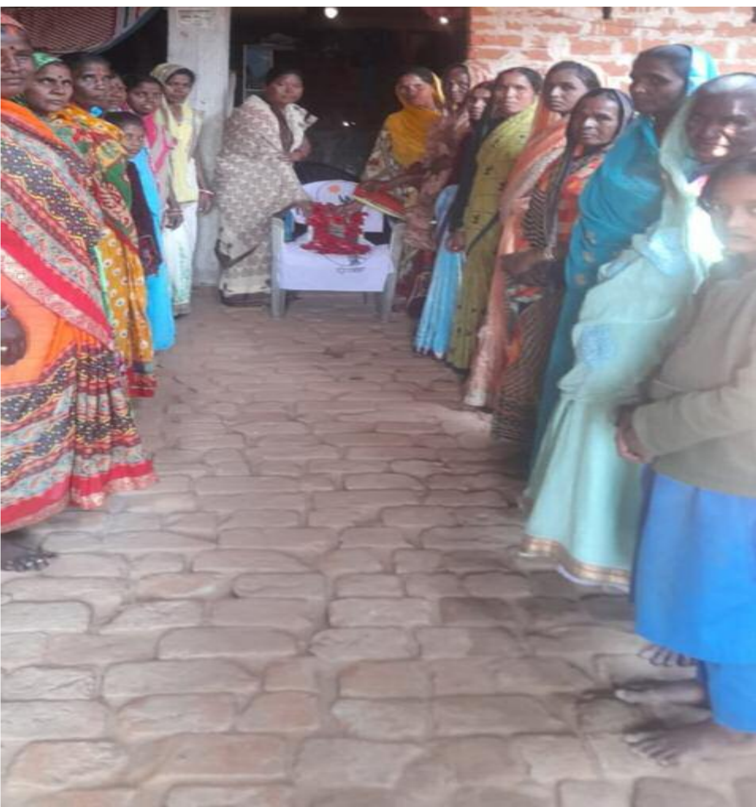
कार्यक्रम में शामिल महिलाएँ