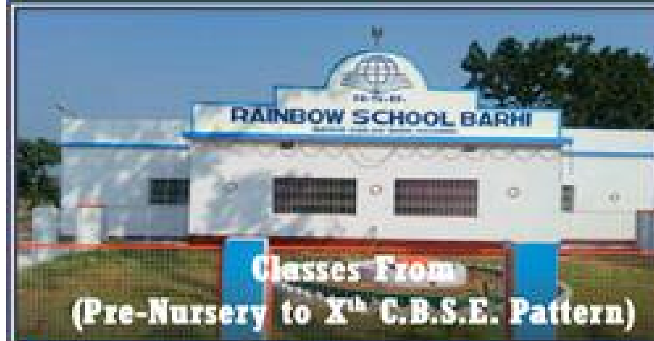
Classes From (Pre-Nursery to X th C.B.S.E. Pattern)

(A Better Educated Generation, A Better Future For Our Nation)