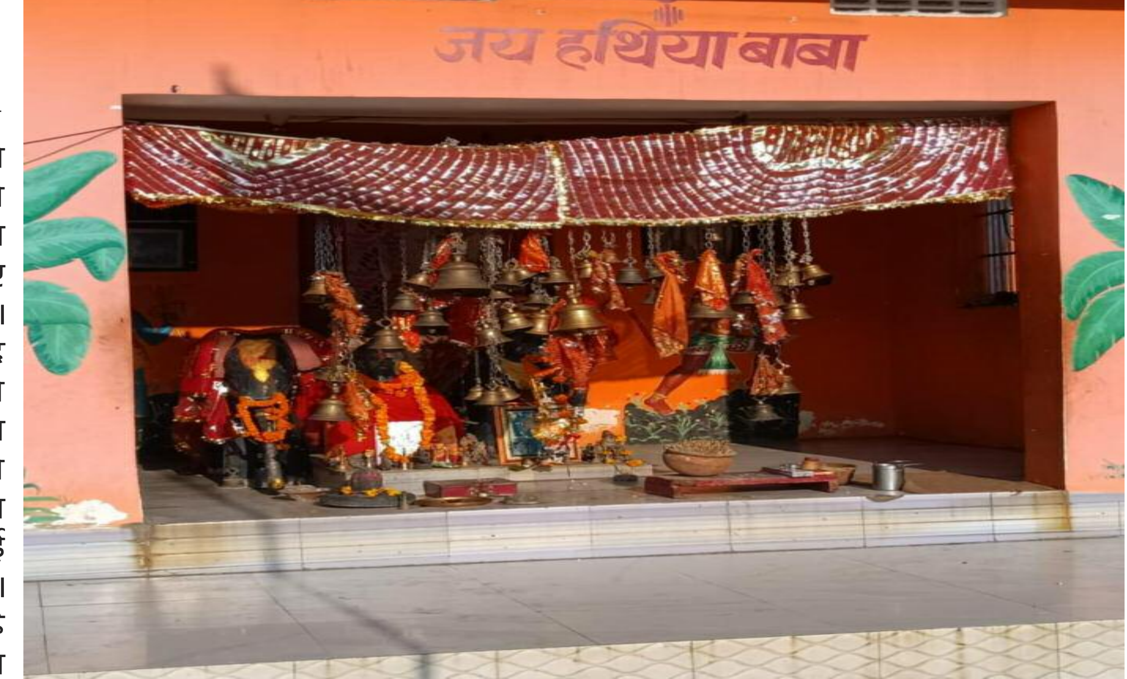
हथिया बाबा मंदिर

लगातार दनुवा घाटी में हो रहे दुर्घटनाओं से पदाधिकारियों सहित चौपारण वासियों के लिए चिंता का विषय बना हुआ। लाख कोशिशों के बावजूद दुर्घटनाओं का दौर रुकने का नाम ही नहीं ले रहा है। अब सवाल ये उठने लगा है कि आखिर दुर्घटना हो कैसे रहा है कहीं कोई दैविक शक्ति तो नहीं। सवाल उठना भी लाजमी है कई दशक पूर्व जब सिंगल रोड हुवा करता था उस समय यही दनुवा घाटी में खूब खूनी खेल चला।