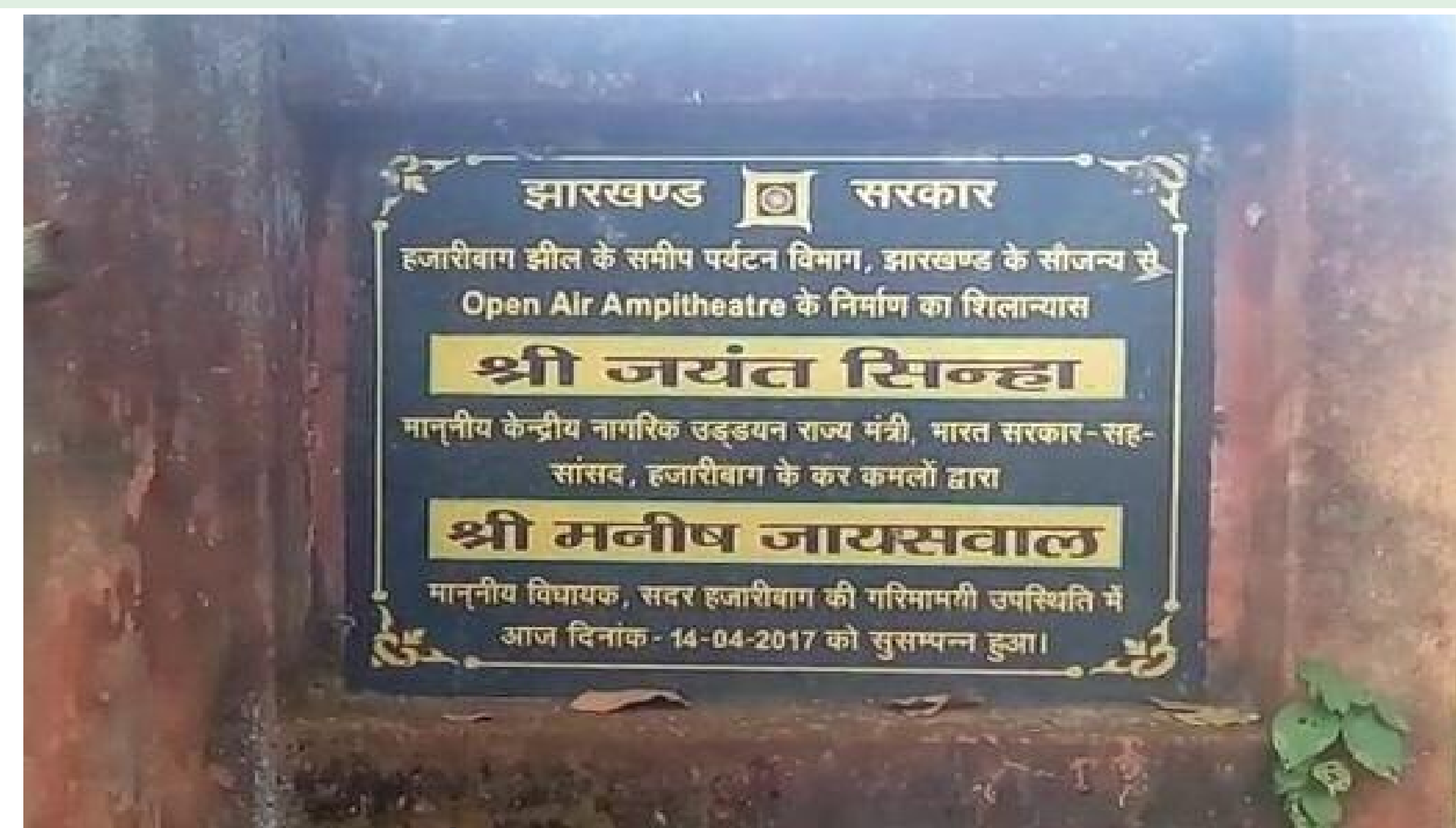
कार्य का शिलान्यास किया गया शिलापट्ट

हजारीबाग झील परिसर में पर्यटन विभाग झारखंड सरकार के द्वारा स्थानीय कलाकारों एवं युवाओं के मनोरंजन के लिए ओपन एमपी थियेटर का निर्माण करवाया जा रहा था। जिसका शिलान्यास 2017 में तत्कालीन नागरिक उड्डयन मंत्री एवं वर्तमान सांसद जयंत सिन्हा, एवं विधायक मनीष जायसवाल के द्वारा किया गया था परंतु अब यह अधूरा पड़ गया है। जिसका हाल अब बेहाल है पता करने पर पता चला कि फंड की कमी से काम को अधूरा छोड़ दिया गया। इधर सोमवार को हजारीबाग आर्ट एंड कल्चर की सचिव ने बताया कि यहां की लोकल कलाक.