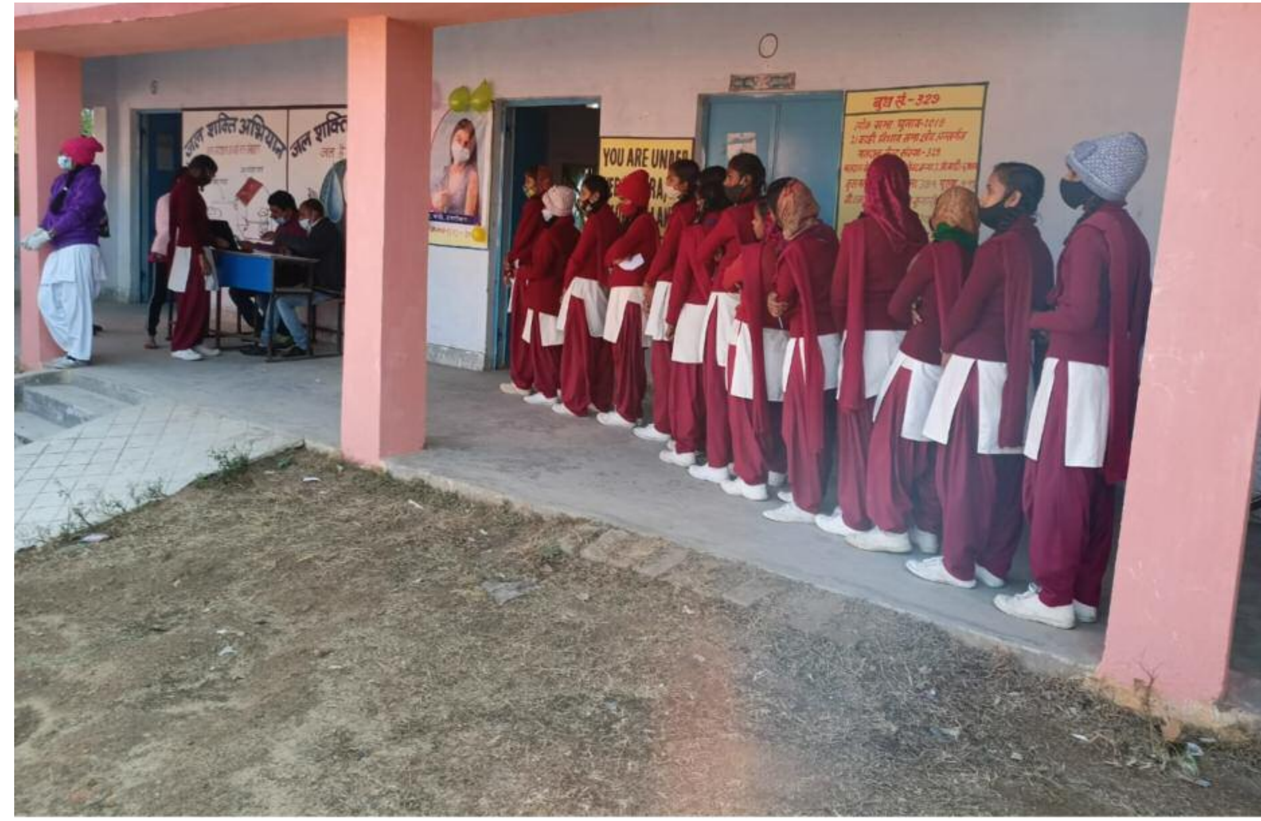
वैक्सीन लेती छात्राएँ