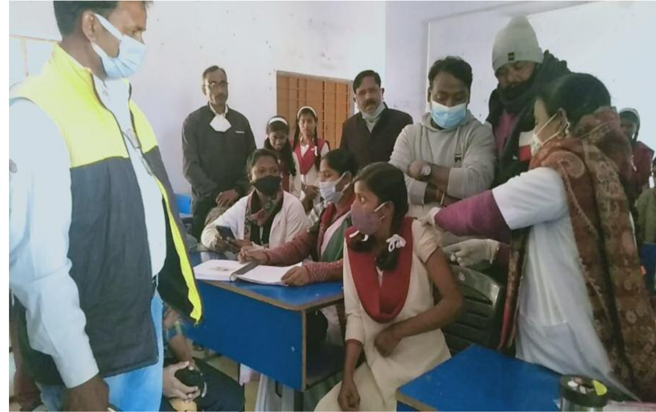
वैक्सीन लेते छात्र छात्राएँ