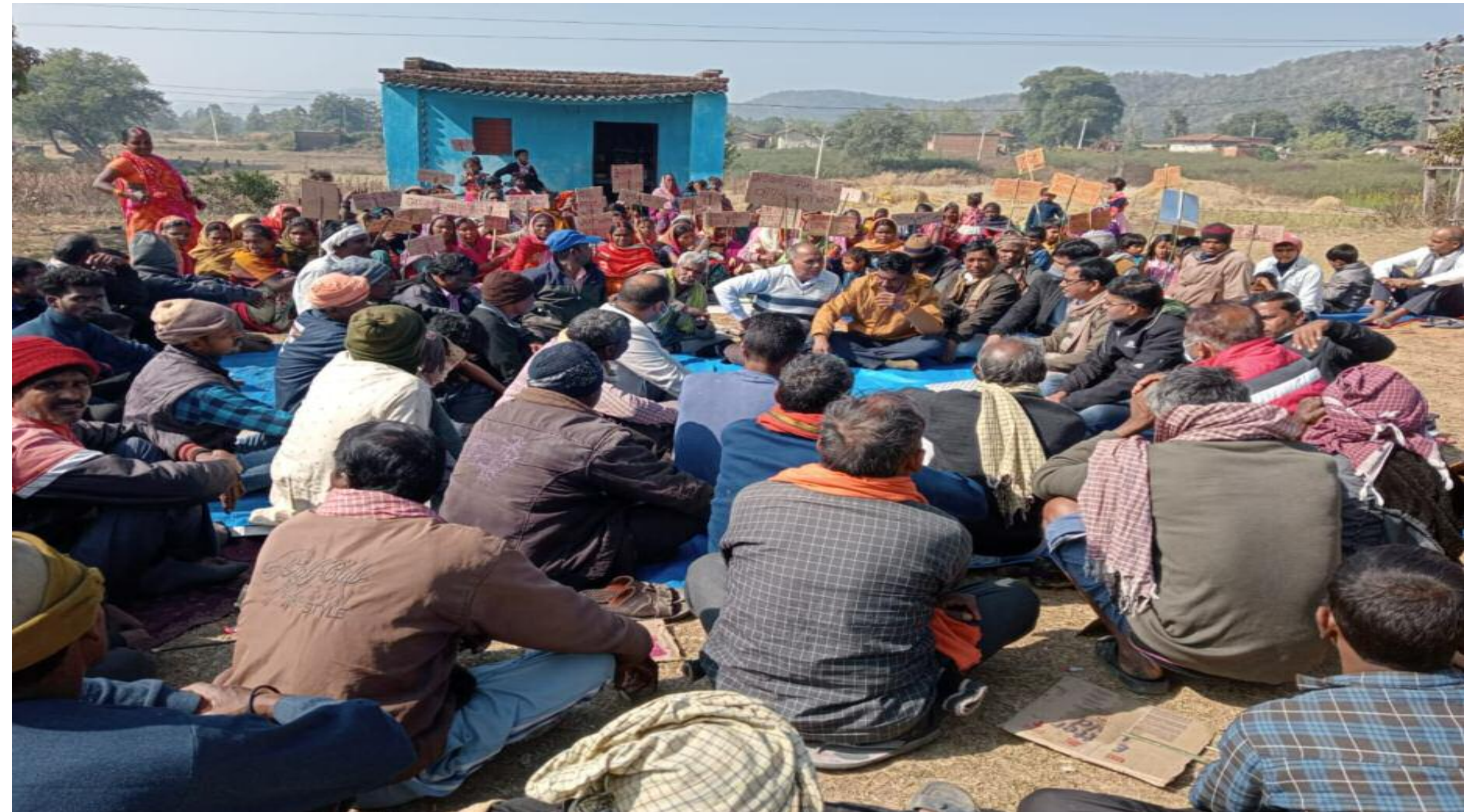
बैठक में शामिल लोग