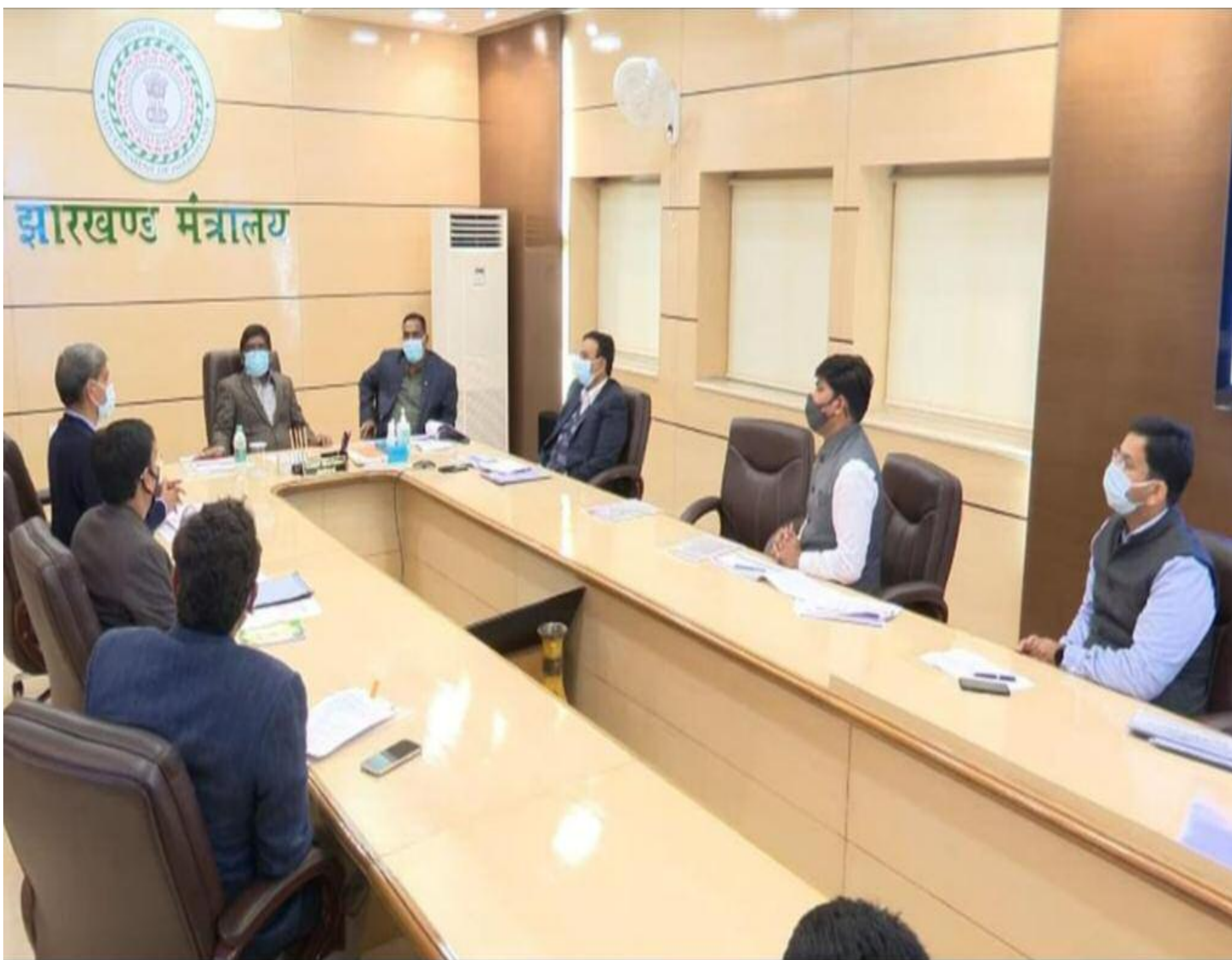
बैठक में शामिल सीएम हेमंत सोरेन व अन्य