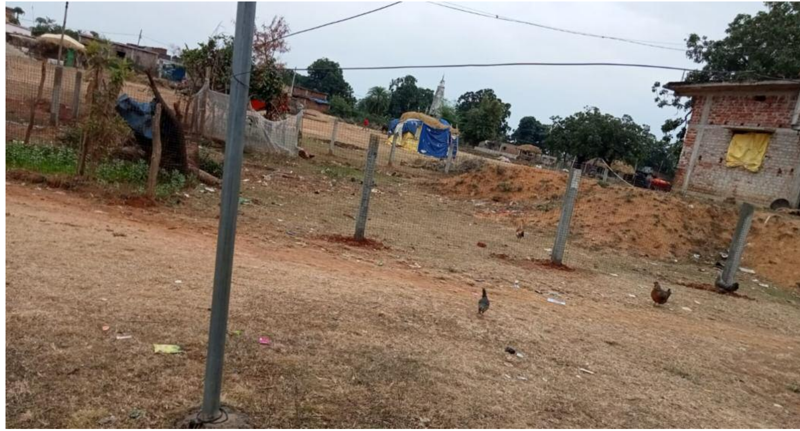
अतिक्रमण कर कब्जा किया हुआ जमीन