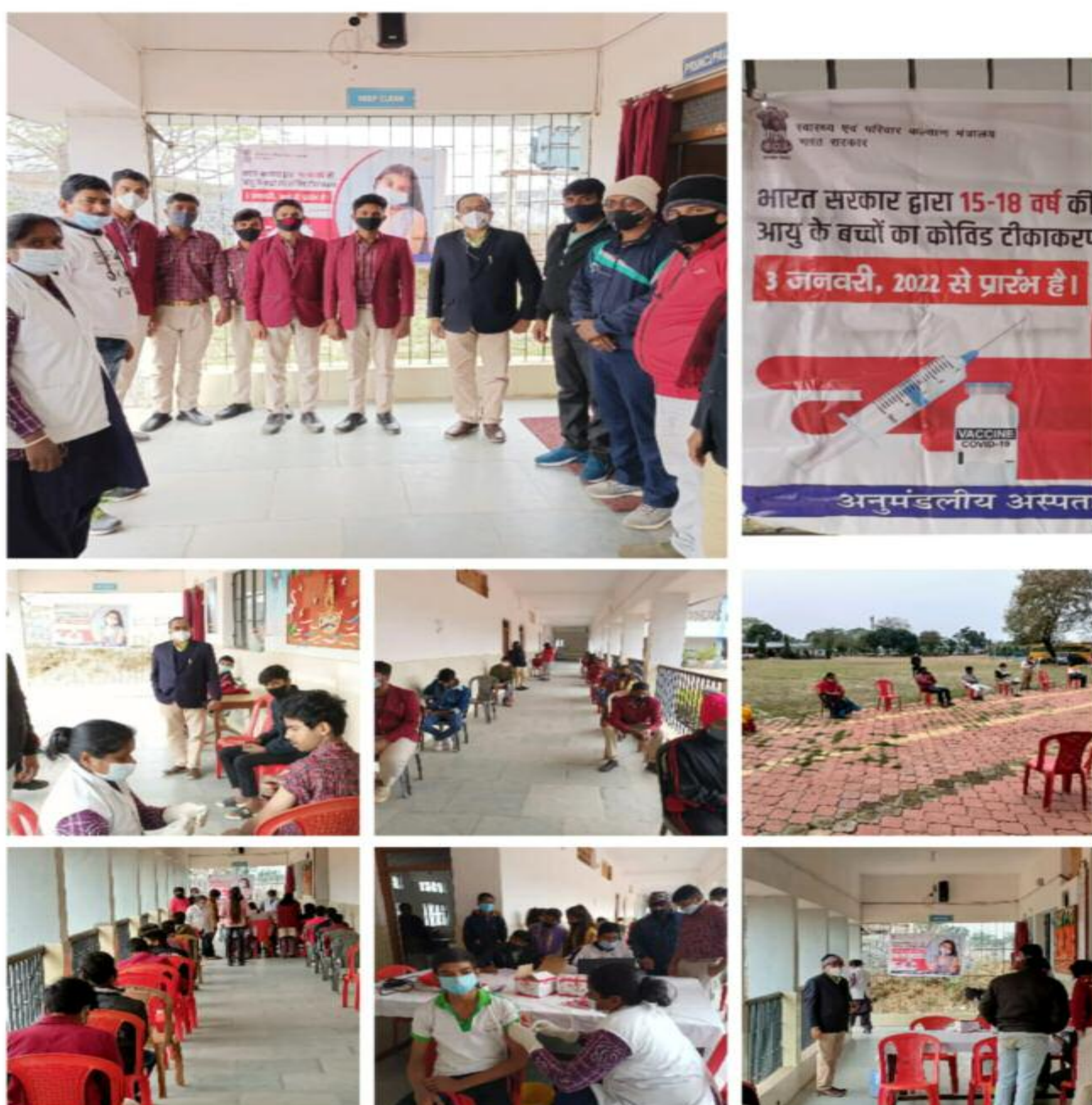
कोविड टीका लेते डीएवी स्कूल के बच्चे

अपेम लाइव: बरही सोनू पंडित/ बिरेन्द्र कुमार