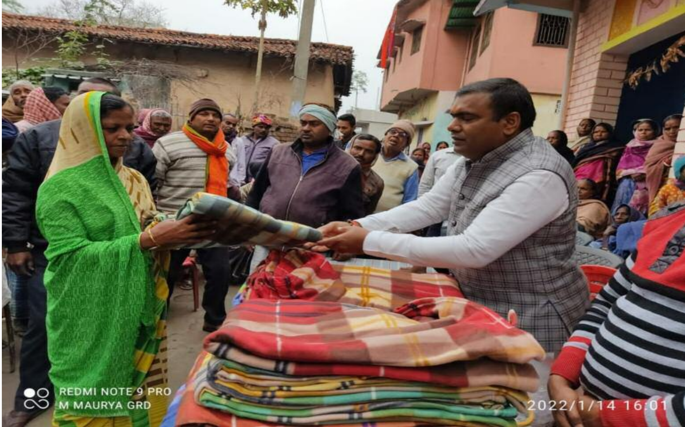
कम्बल वितरण करते मंडल कमिटी के लोग