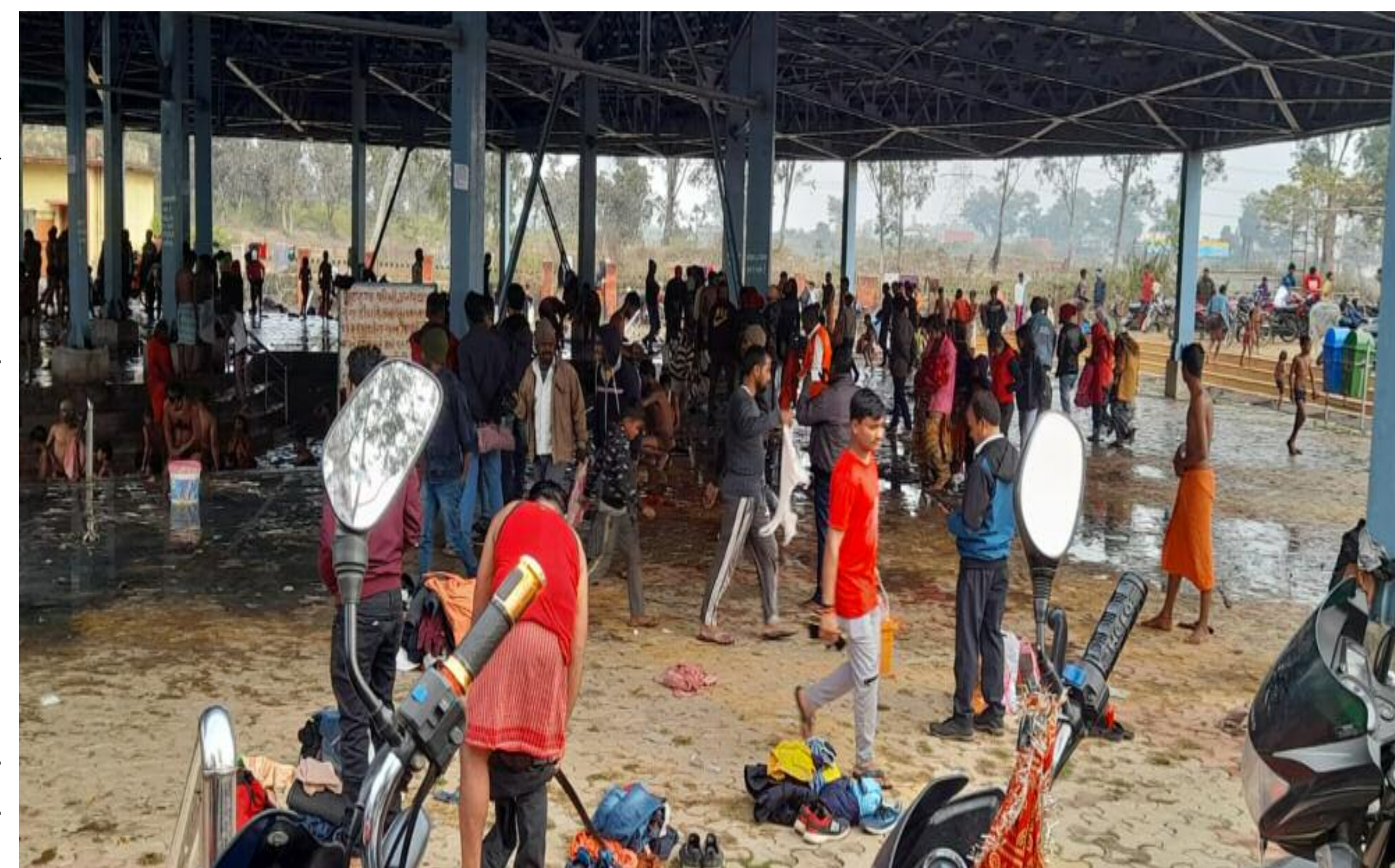
सूर्यकुण्ड में उमड़ी श्रद्धालुओं की मिड

बरकठ : प्रखण्ड के प्रसिद्ध ऐतिहासिक स्थल सूर्यकुण्डधाम में मकरसंक्रांति को लेकर शुक्रवार को भारी संख्या में लोग पहुंचे एवं गर्म कुंड में डुबकी लगायी। बताया जाता है कि सुबह 4 बजे से ही श्रद्धालुओं की भीड़ जुटने लगी जहाँ महिलाओं की काफी भीड़ उमड़ी लोगों ने कुंड में स्नानादि कर मंदिर में पूजा अर्चना और दान पुण्य किया। बता दें कि सूर्यकुण्डधाम के ऐतिहासिक व धार्मिक महत्व के कारण मकरसंक्रांति के अवसर पर हर साल भीड़ उमड़ती है। इस वर्ष कोरोना के कारण बीते वर्षों की अपेक्षा भीड़ कम थी। दूसरे राज्यो से आनेवाले श्रद्धालु इस बार नहीं पहुंच सके। गौरतलब है कि मकर स्नान को लेकर लोगों में खासा उत्साह देखा