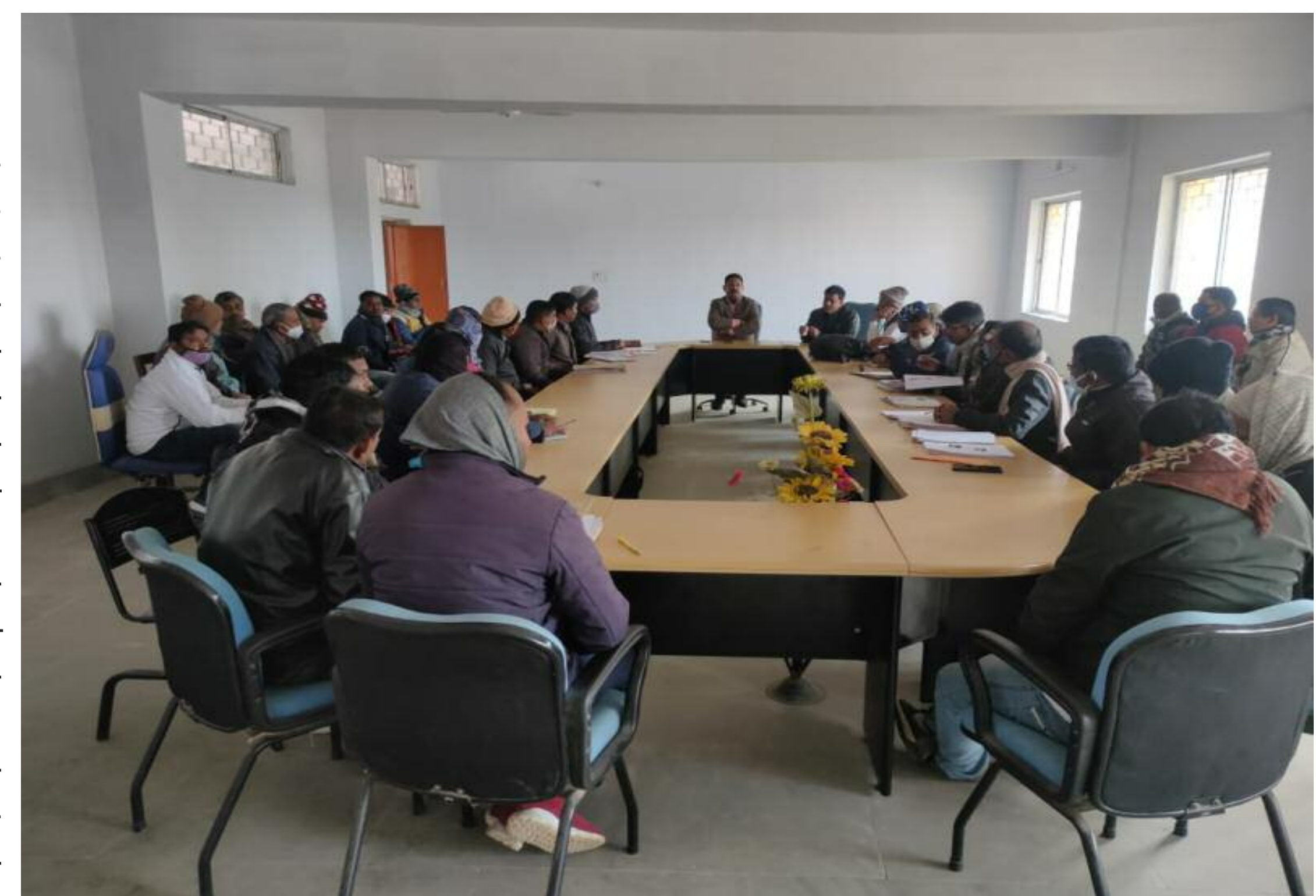
बैठक में शामिल अधिकारी व ग्रामीण

गावां, गिरिडीह : गावां प्रखंड मुख्यालय के सभागार में सोमवार को मतदाता सूची विखंडन को लेकर बीएलओ एवं पंचायत सचिव के साथ बैठक किया गया। बैठक में मुख्य रूप से जिला पंचायती राज पदाधिकारी उपस्थित थे। उन्होंने बताया कि त्रिस्तरीय पंचायत चुनाव को लेकर मतदाता सूची में विखंडन का कार्य किया जा रहा है। आज के बैठक में अब तक मतदाता सूची विखंडन के लिए जो भी कार्य किया गया उन सभी कार्यों का पुनरीक्षण किया गया और आवश्यक दिशा निर्देश दिए गए। बताया कि मतदाता सूची में किसी तरह का त्रुटि नहीं रहे और बेहतर