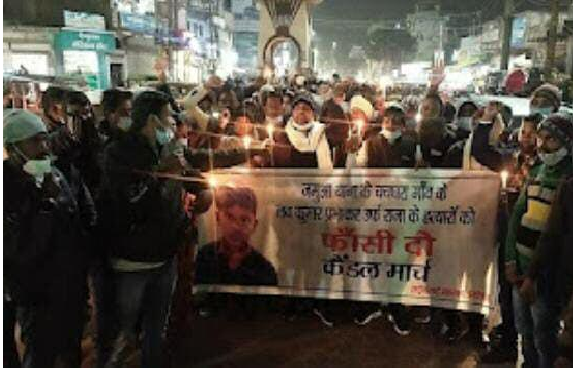
कैंडल मार्च में शामिल लोग