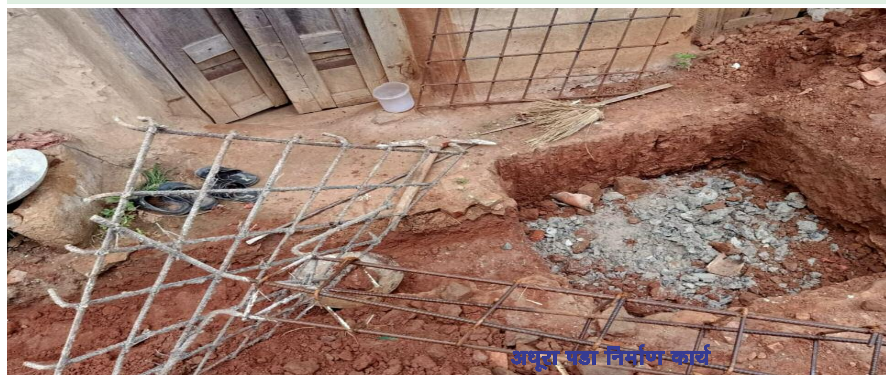
अपूर्व पडा निर्माण कार्य

अपनी ही जमीन पर गृह निर्माण करने से रोक रहे हैं दबंग, करमा का है मामला, प्रशासन से न्याय की गुहार सीओ ने एसडीएम से किया दंडाधिकारी प्रतिनियुक्ति की आग्रह,