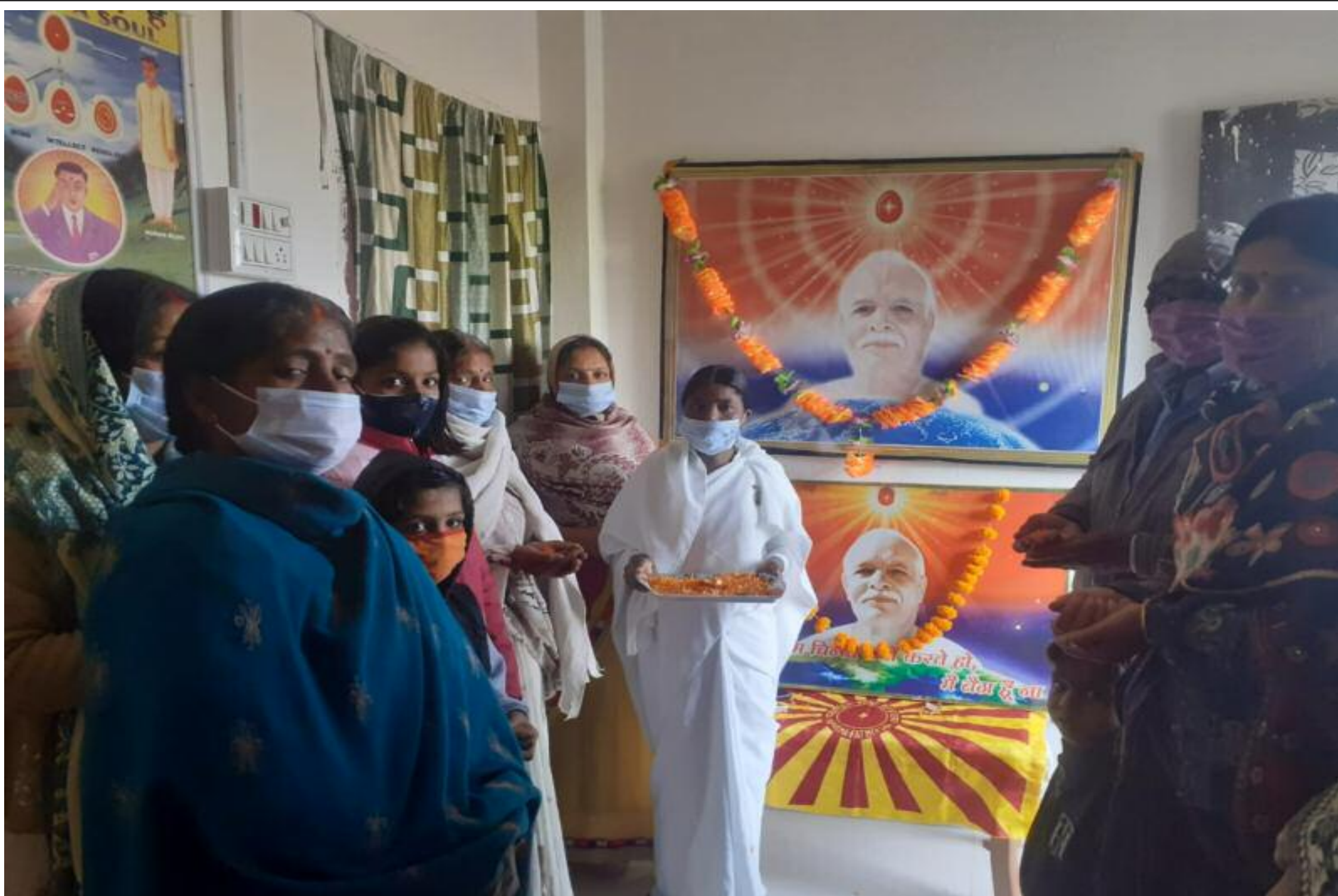
स्मृति दिवस मनाते ब्रह्मा कुमारी से जुड़े लोग