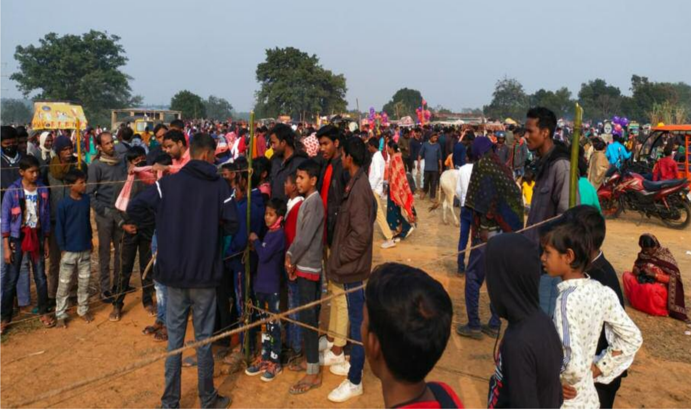
मेले में आनन्द लेते बच्चे

गिरीडीह जिला के पीरटांड प्रखंड में ग्राम चंपानगर में मेले का आयोजन किया गया जिसमें मेले में काफी भीड़ देखी गई। जो कोरोना के गाइड लाइन का धजिया उड़ाते देखा गया, कोई भी व्यक्ति मास नहीं लगया था, और नाही सोशल डि. स्टेंस का नियम का पालन कर रहा था। किसी को कोई डर नहीं था। राज्य में लगातार कोरोना का मामला बढ़ रहा है मगर जिला प्रसासन सोई हुई है। और न किसी ने भी इस मेले पर रोक लगाई लेकिन इस वर्ष मेले के अध्यक्ष के द्वारा मेले का आयोजन पर रोक लगाई गई। फिर भी लोकल दुकानदार के द्वारा मेला लगया गया। लोकल