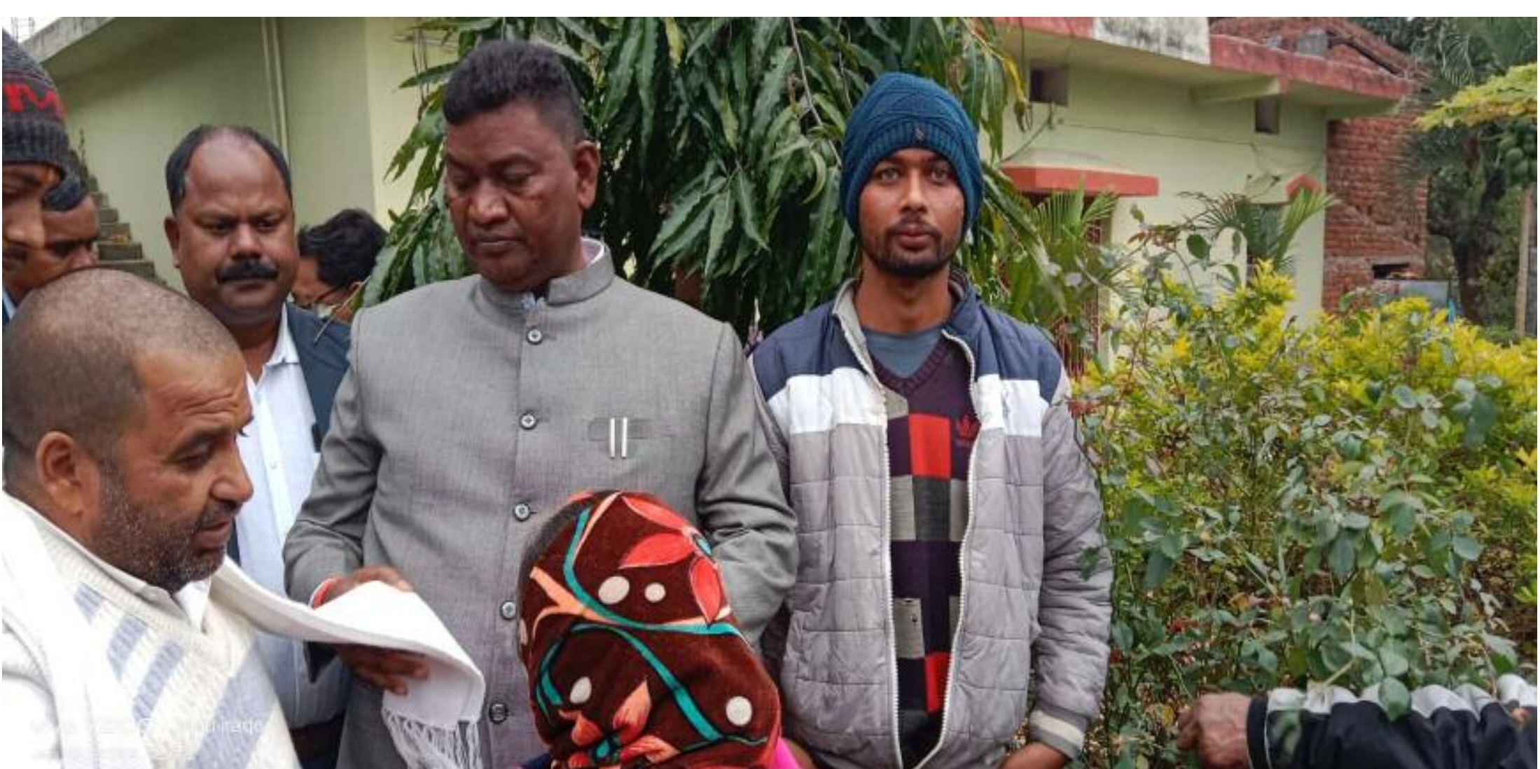
सत्यानंद भोक्ता से मुलाकात करते लोग