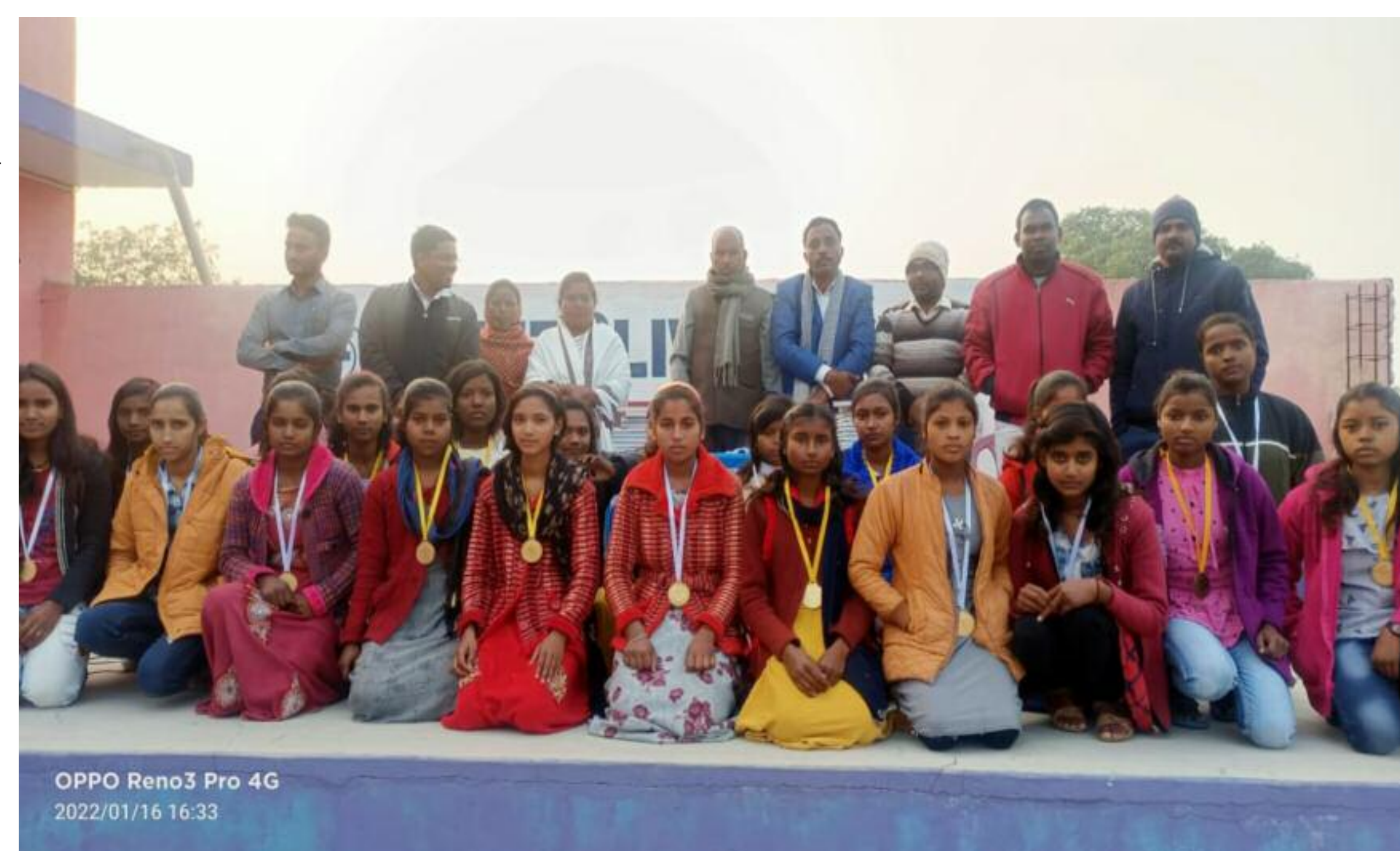
पुरस्कृत हुए छात्र व उपस्थित शिक्षक