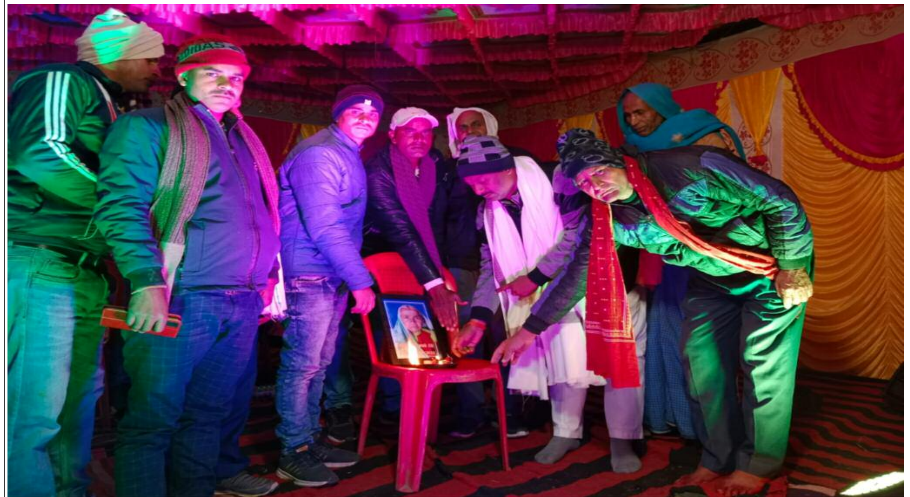
एकादश में जागरण कार्यक्रम का सुभारम्भ करते लोग

अपेम लाइव: बरही सोनु पंडित/ बिरेन्द्र कुमार