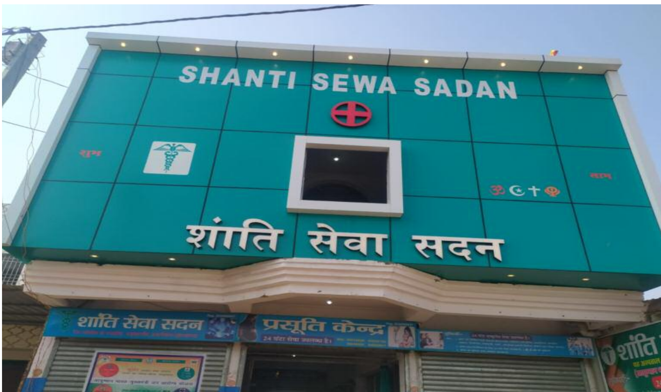
शांति सेवा सदन

हजारीबाग रोड प्रेम नगर स्थित शांति सेवा सदन में सी एच आर के तहत सिविल सर्जन हजारीबाग के निर्देश पर महिलाओं का बंध्याकरण परिवार नियोजन किया गया। कुल 30 महिलाओं का बंध्याकरण किया गया। हलाकों का बंध्याकरण कराते वाले लाभुक महिलाओं के खाते में प्रोत्साहन राशि के रूप में 1000 भेजी जाएंगी। कुल 30 महिलाओं का परिवार