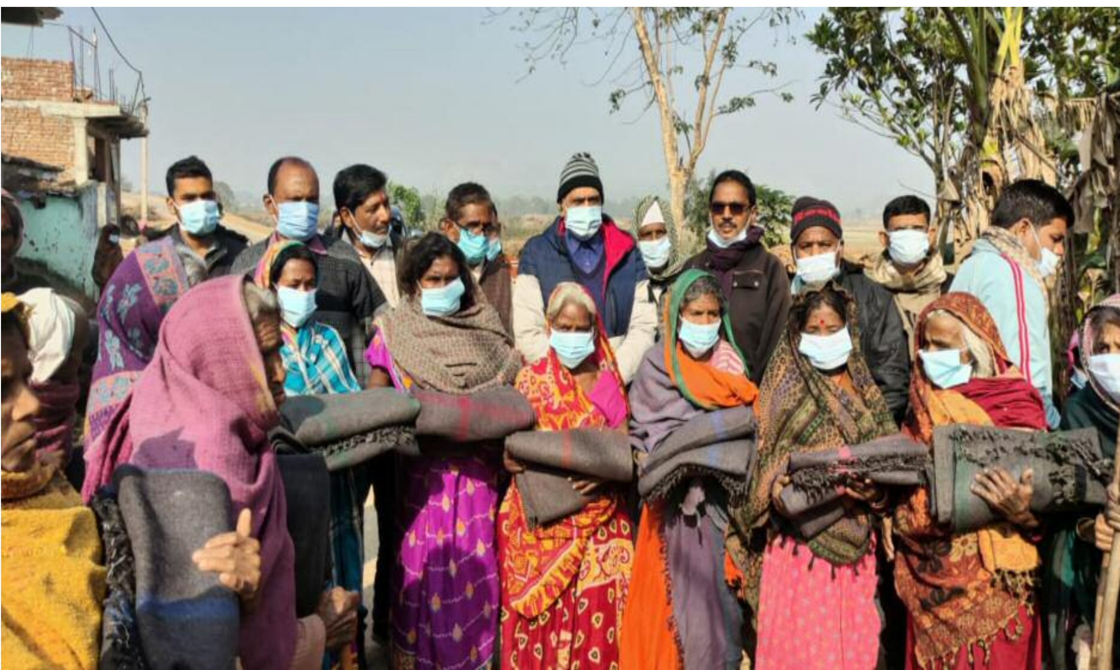
बुजुर्गों को कंबल वितरण करते भाजपा नेता