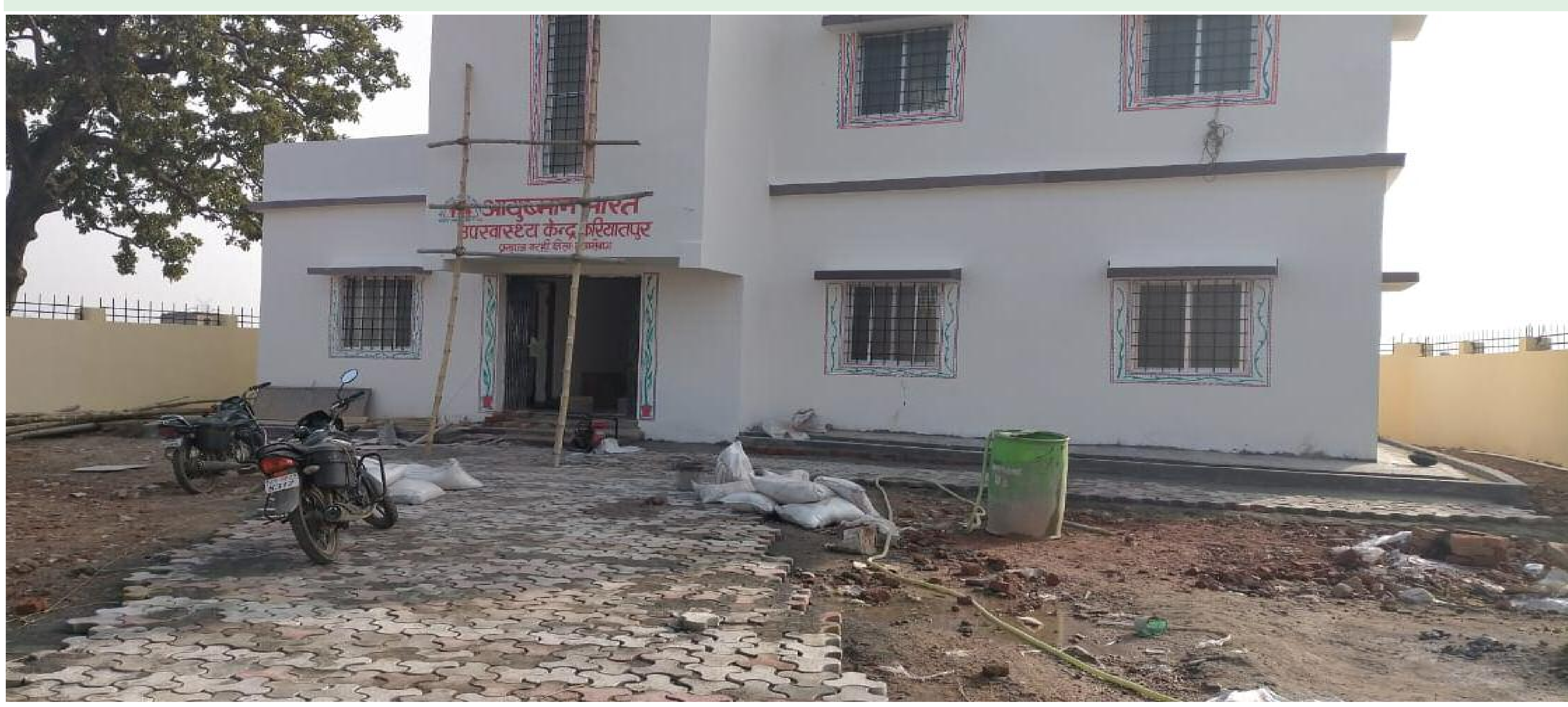
बेतरतीब तरीके से लगाया गया पेबर ब्लॉक

अपेम लाइव: बरही सोनु पंडित/ बिरेन्द्र कुमार