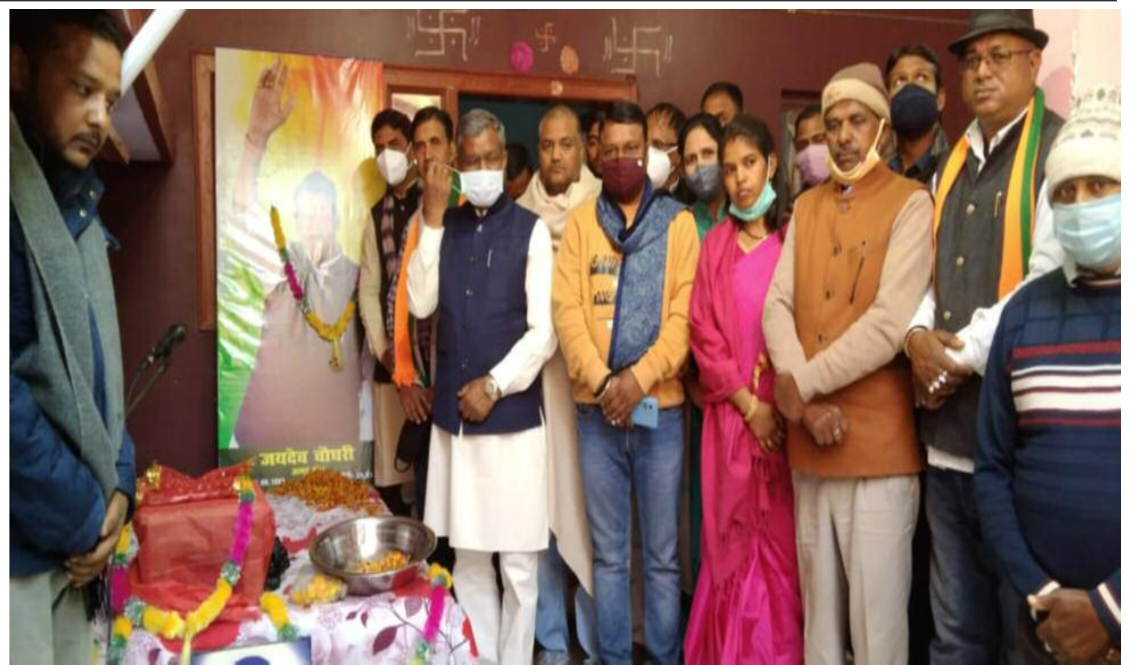
श्रद्धांजली अर्पित करते पूर्व मुख्यमंत्री व अन्य