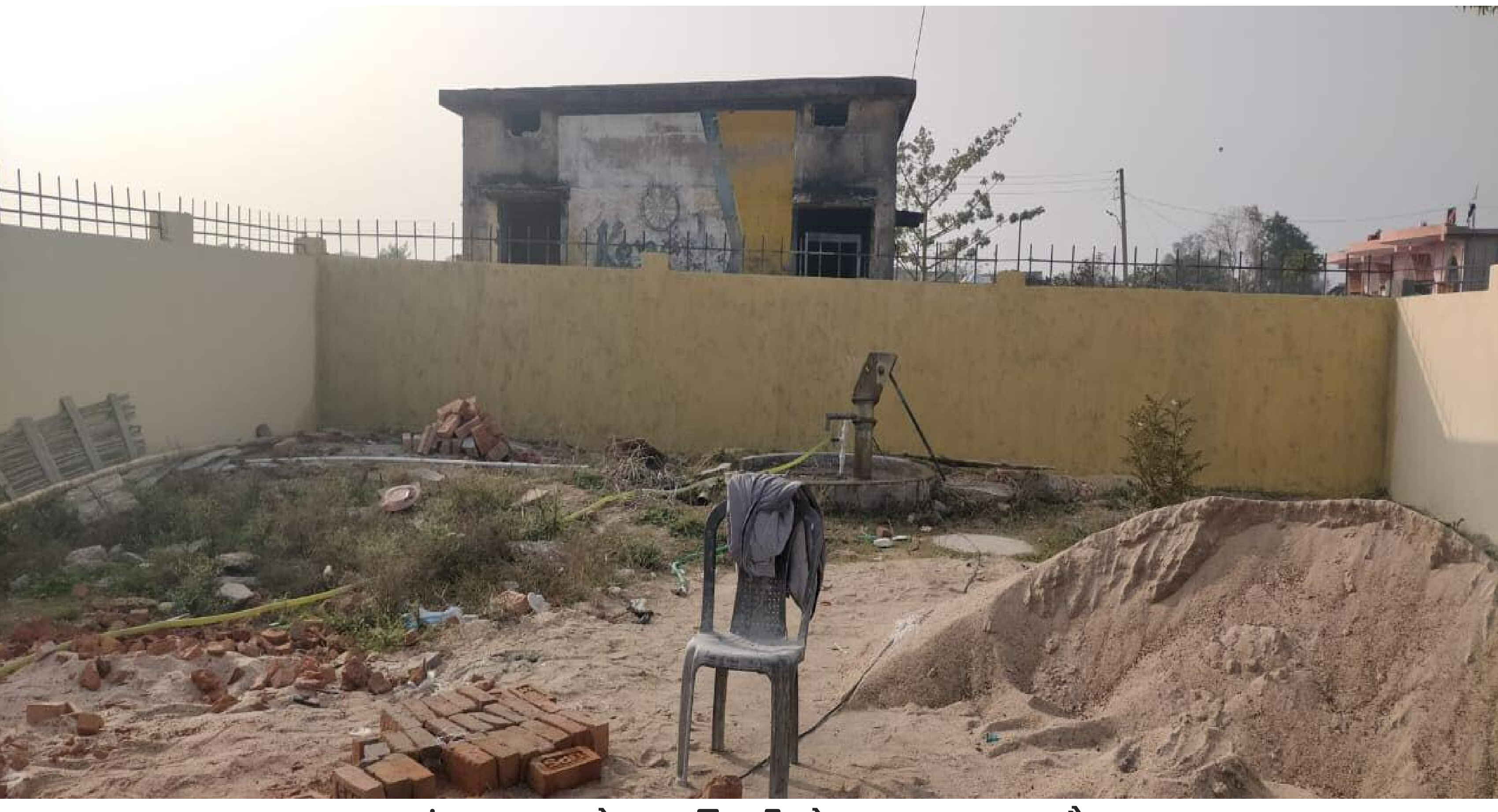
कंडम भवन को पाहरदीवारी से बाहर रखा गया है।

टीकू केशरी बरही प्रखंड अंतर्गत करियातपुर में बन रहे उप स्वास्थ्य केंद्र भवन निर्माण में घोर अनियमितता बरती जा रही है। प्राप्त जानकारी के अनुसार उक्त भवन 34 लाख की लागत से बनाया जा रहा है। लेकिन इसके निर्माण में घटिया सामग्री का उपयोग किया जा रहा है। अपेम लाइव की टीम ने मंगलवार को निर्माणाधीन भवन का निरीक्षण किया। निरीक्षण के समय मौके पर न तो संवेदक मिले और न ही कोई कनीय अभियंता। मौके पर टाइल्स का काम कर रहे कुछ मजदूरों से जब पूछा गया कि किस संवेदक के द्वारा इसे बनाया जा रहा है। तब उसने सही तरीके से नहीं बता पाया कि उक्त भवन निर्माण किस एजेंसी के द्वारा किया जा रहा है। क्योंकि न तो निर्माण स्थल पर एजेंसी को कोई बोर्ड लगा है। न ही योजना की जानकारी दी गई है। मजदूरों ने