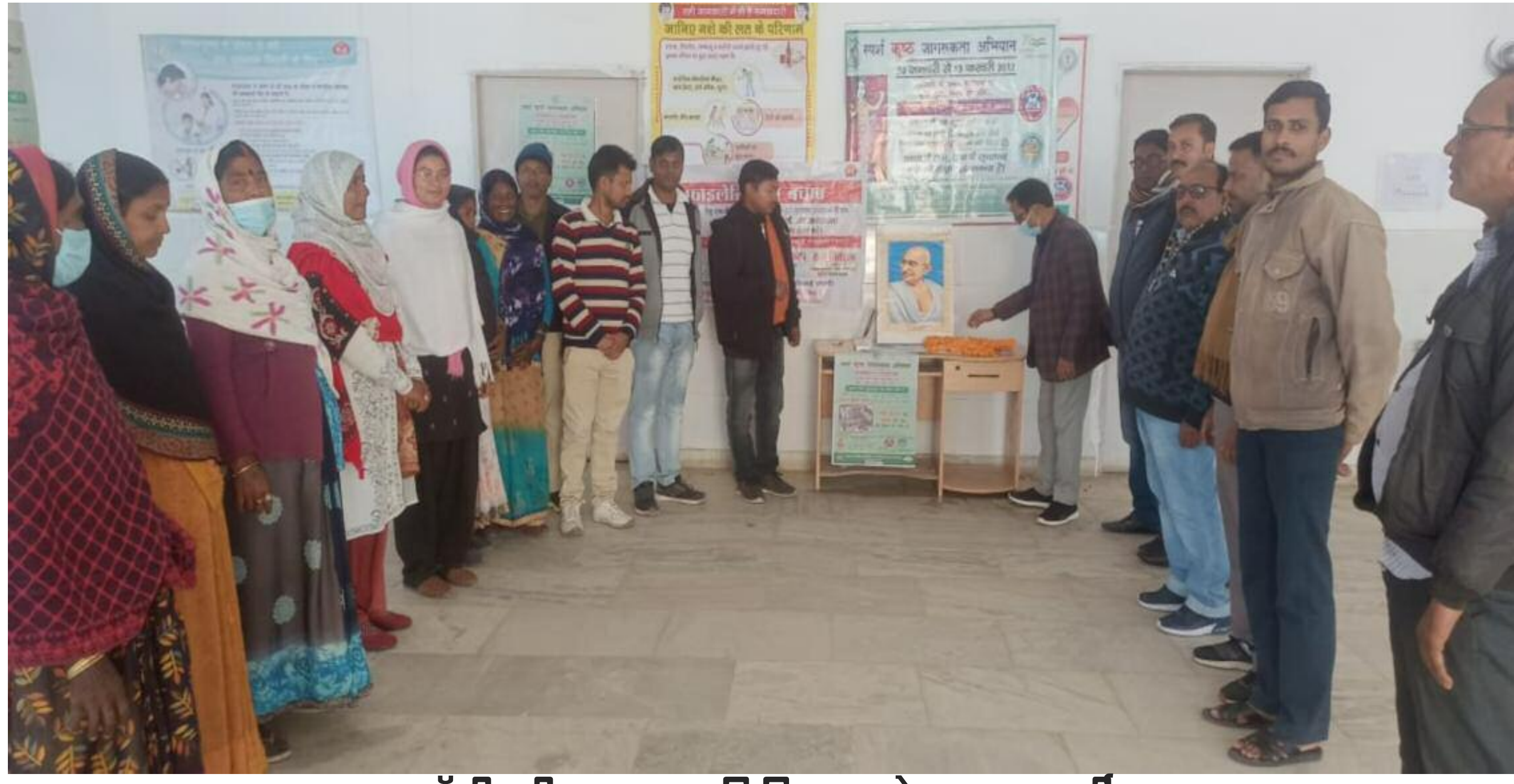
गांधी जी का पुण्य तिथि मनाते स्वास्थ्यकर्मी