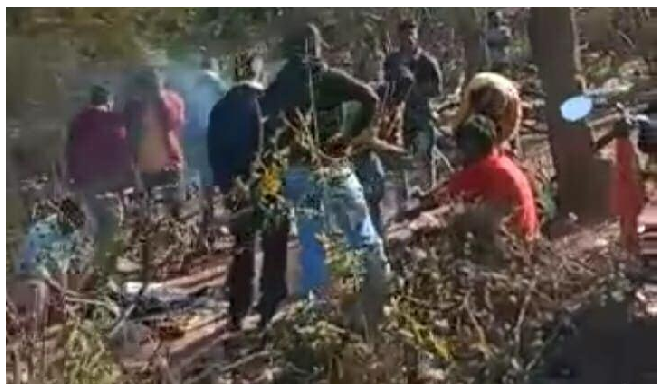
जंगल में लगा असामाजिक तत्वों का जमावड़ा

बरसोत से जीतपुर जाने वाली सड़क के किनारे स्थित ललमटिया जंगल में खुले आम असुरक्षित तरीके से देशी एवं विदेशी शराब की बिक्री हो रही है। ग्रामीणों ने बताया कि प्रत्येक रविवार को इस जंगल में असामाजिक तत्वों का जमावड़ा लगता है। शराब एवं सुबर की मांस परोसी जाती है। इतनाही नहीं इसी जंगल में अलग अलग रिकानों पर जुआड़ियों का भी अड्डा लगता है। प्रत्येक रविवार को मानो पूरा जंगल एवम आस पास के क्षेत्र में ऐसे लोगों का कब्जा रहता हो। ग्रामीणों ने बताया कि