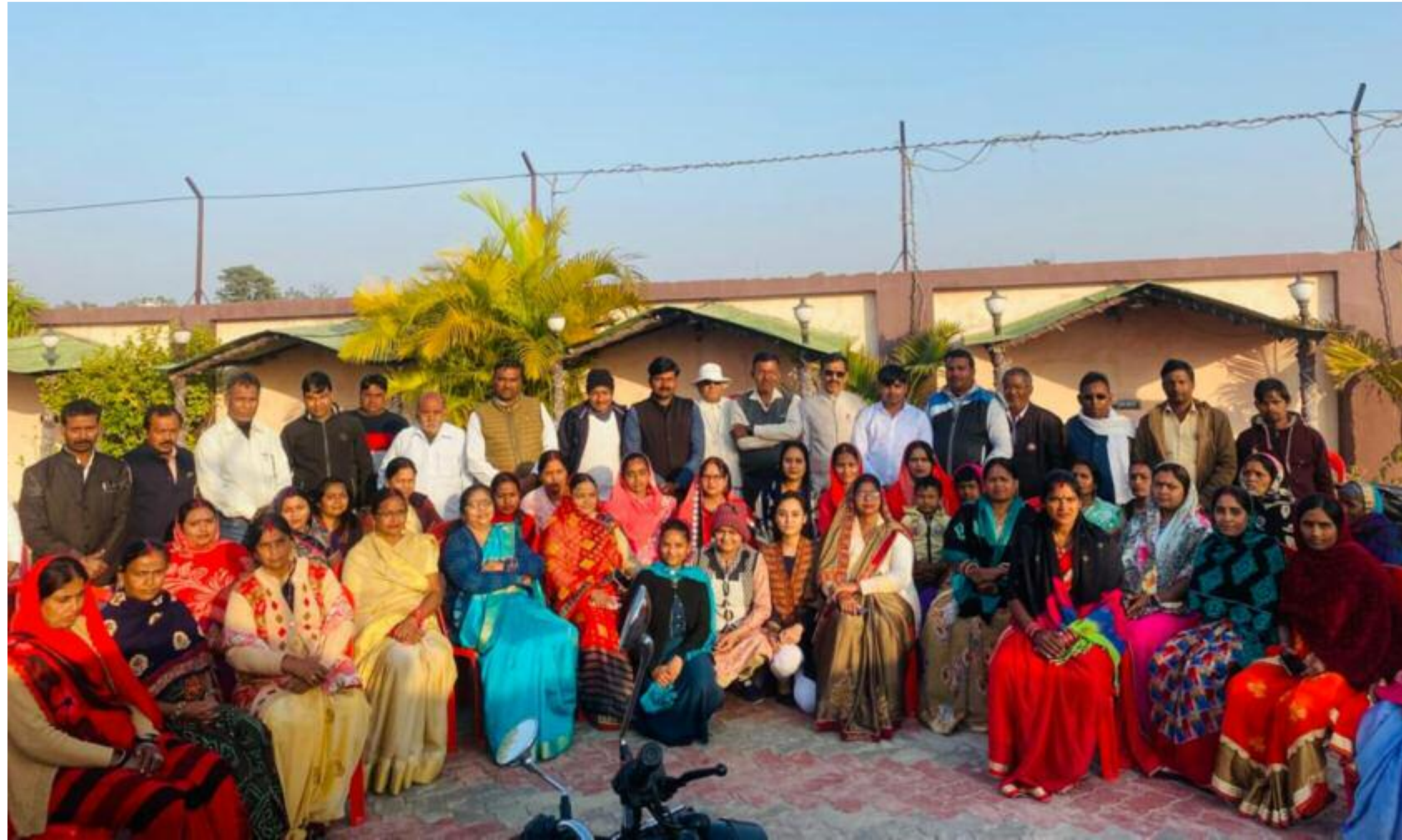
नगर केशरवानी वैश्य सभा की बैठक में शामिल लोग

अपेम लाइव : बरही सोनु पंडित / बिरेन्द्र कुमार