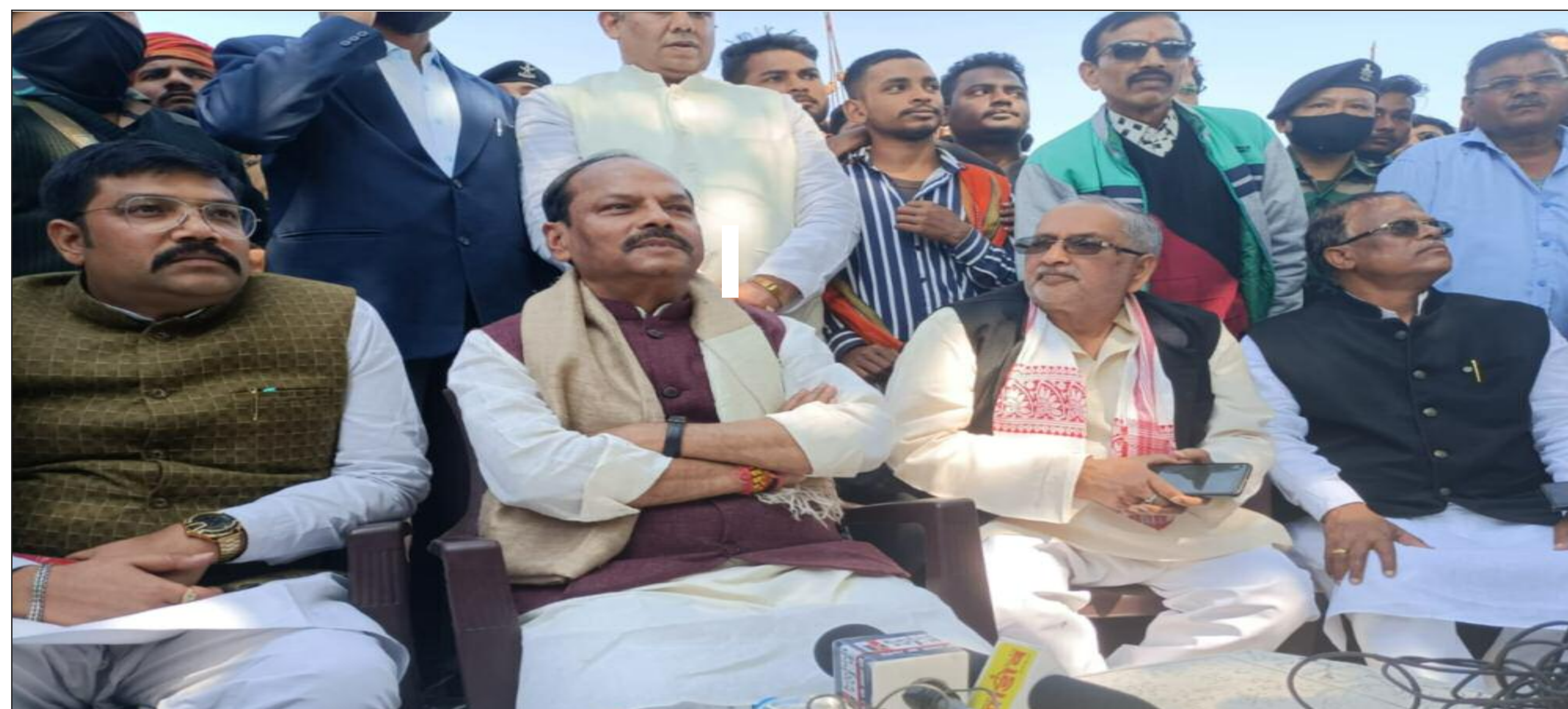
पत्रकारों से वार्ता करते रघुवर दास