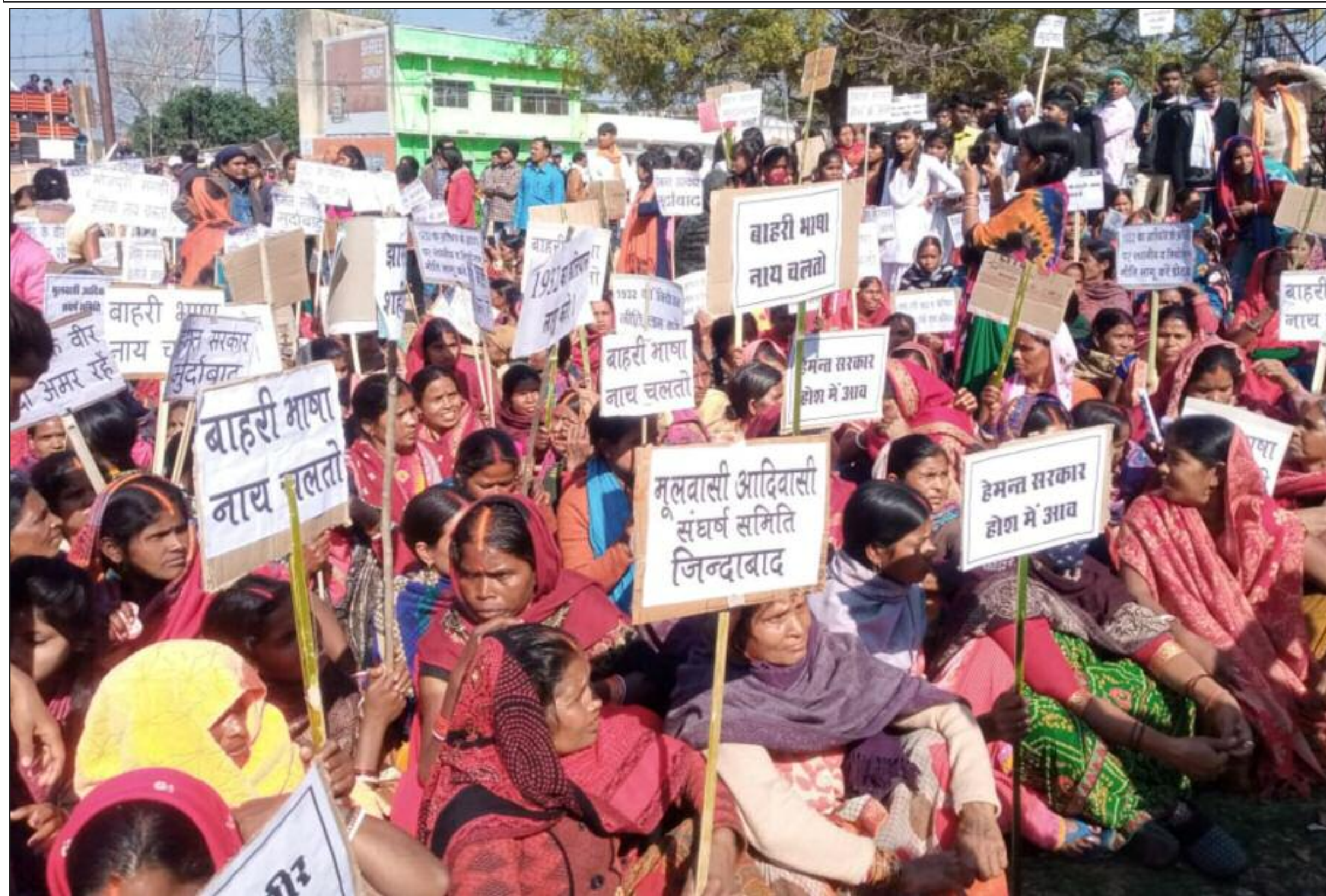
विष्णुगढ़ में जनसभा को संबोधित करते आदिवासी मूलवासी नेता व अतिथि