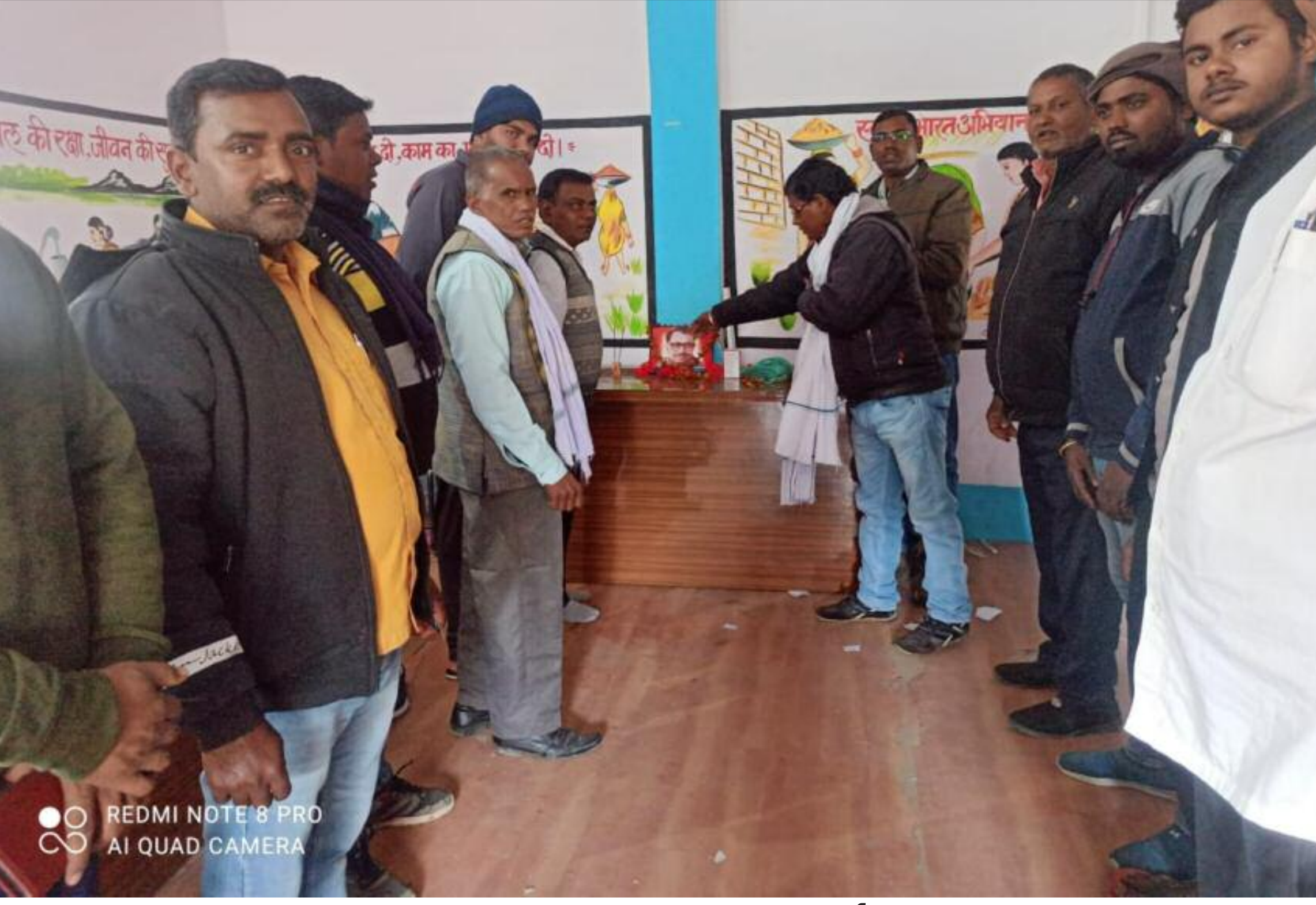
पुण्यतिथि मनाते भाजपाई।