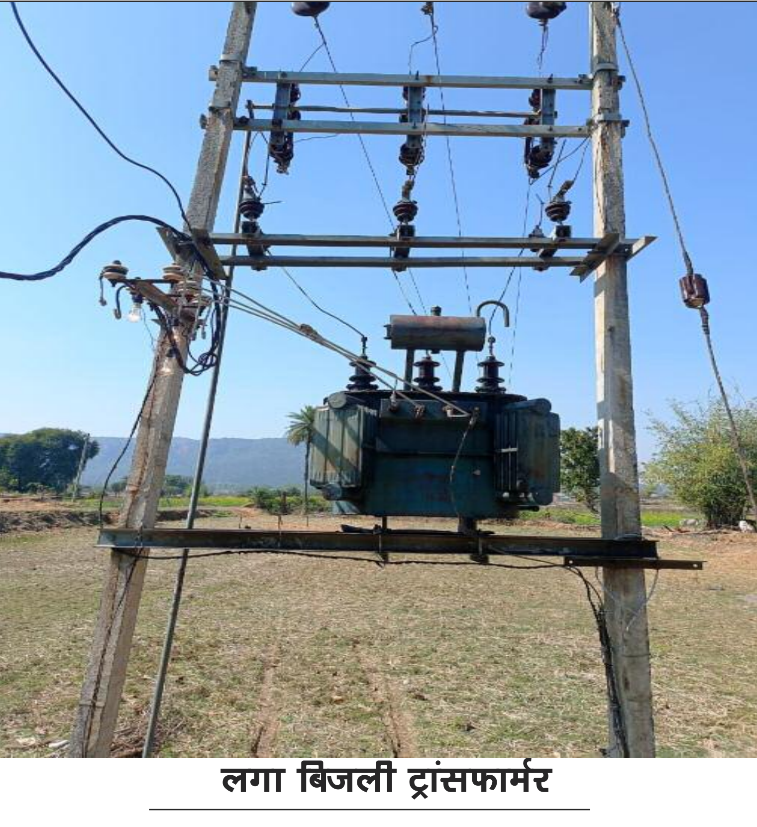
लगा बिजली ट्रांसफार्मर