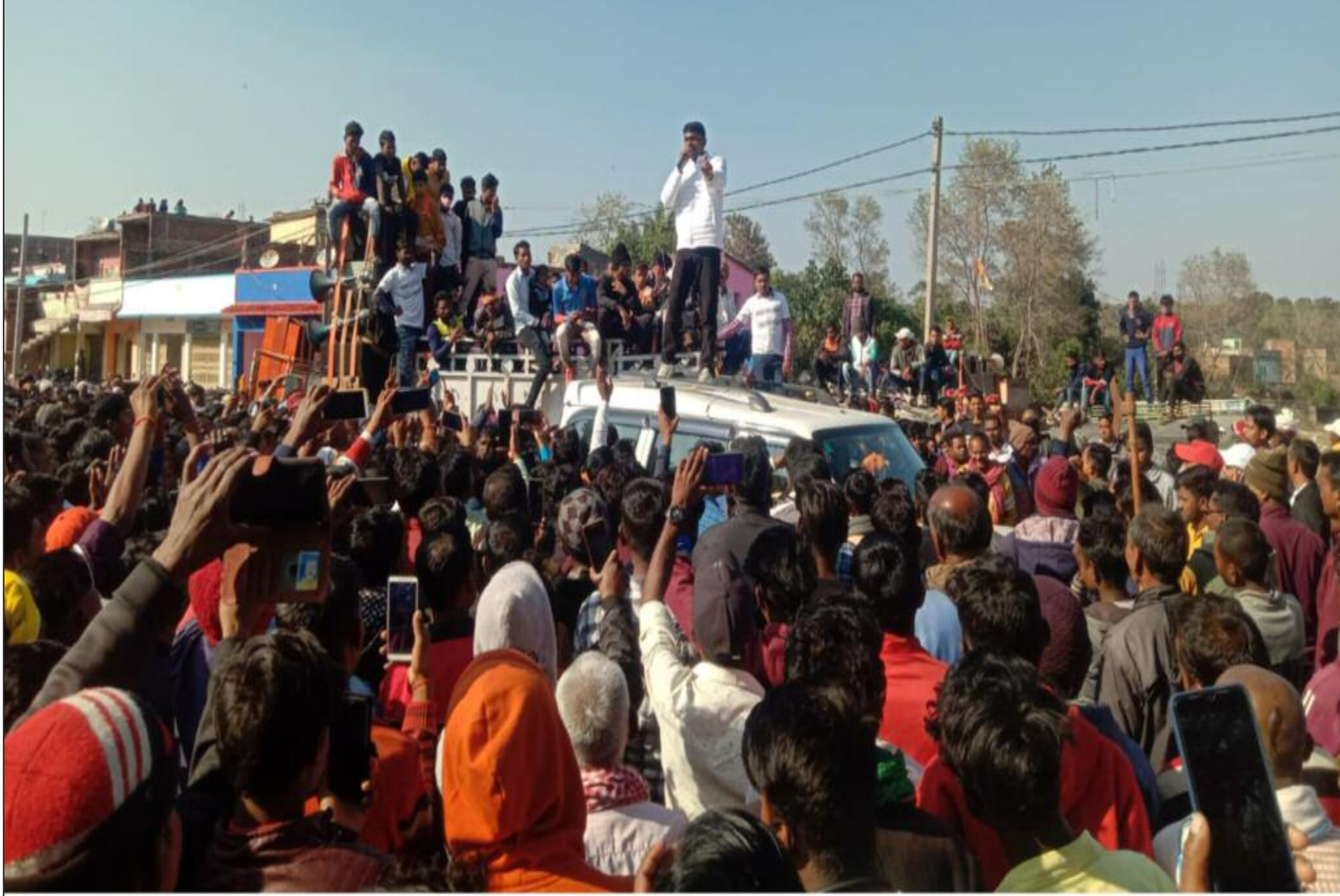
विष्णुगढ़ में स्थानीयता नीति तय करने को लेकर निकले जुलूस में शामिल लोग