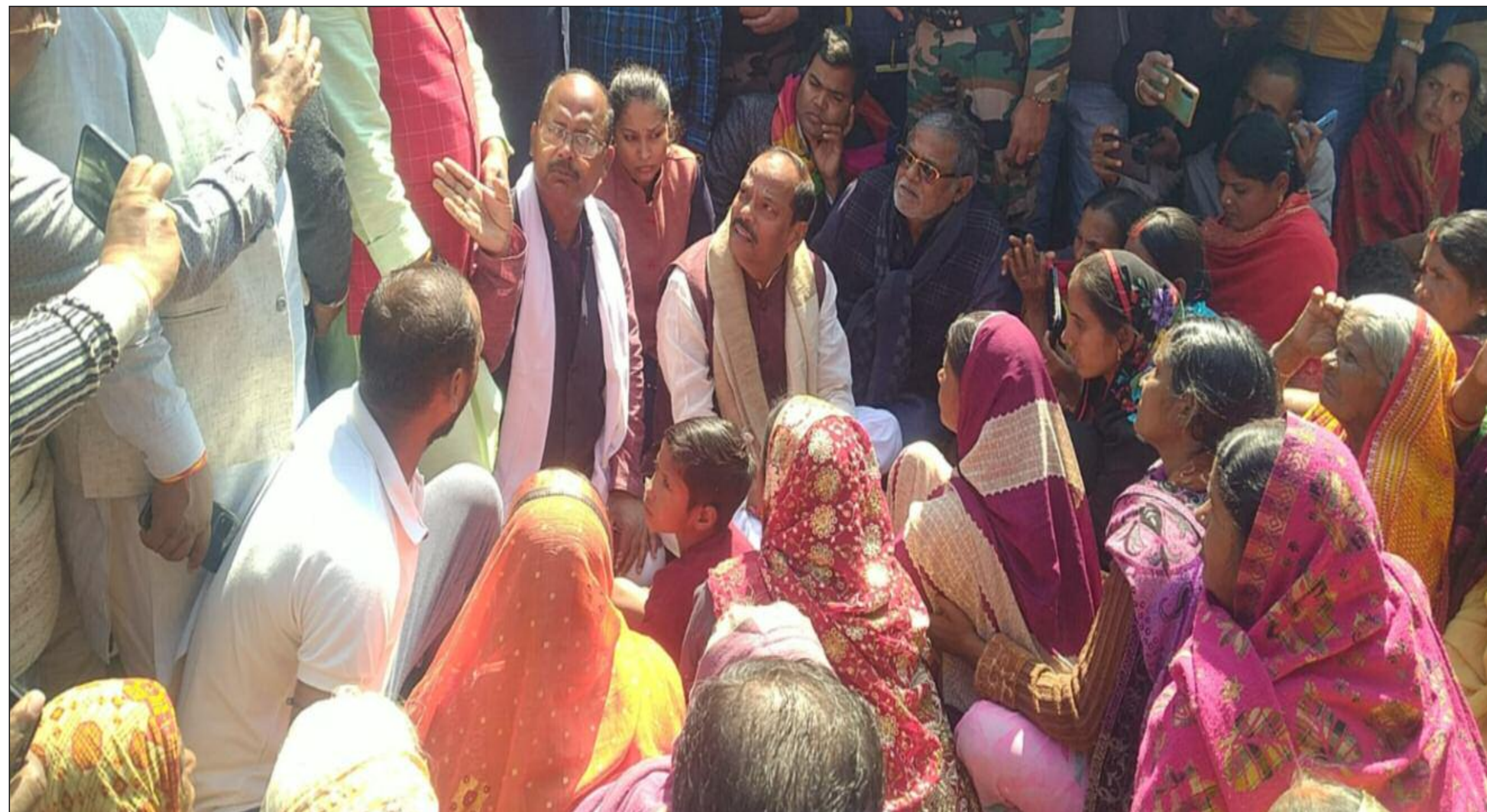
मृतक के परिजन से घटना की जानकारी लेते रघुवर दास