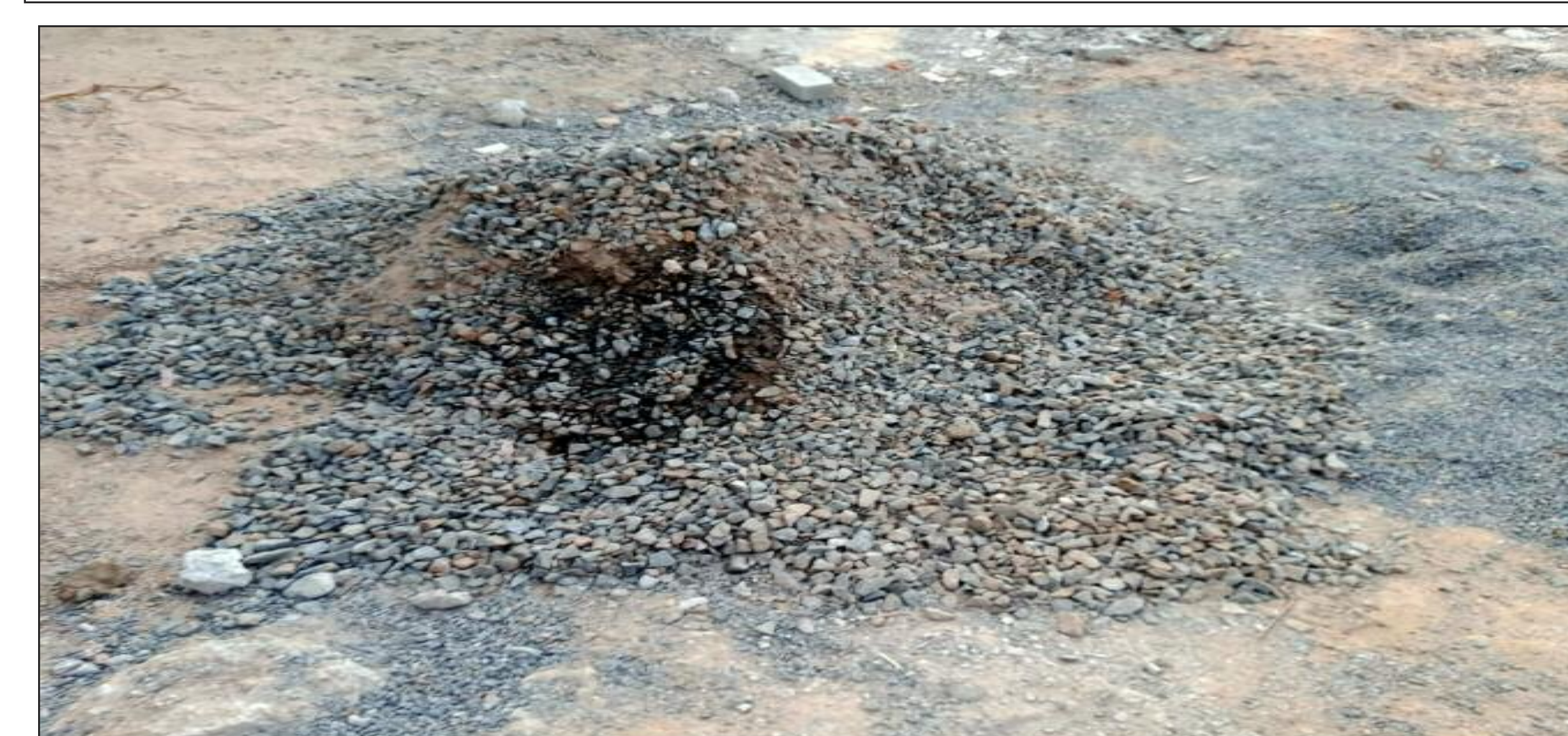
मिट्टी से भरा गिट्टी