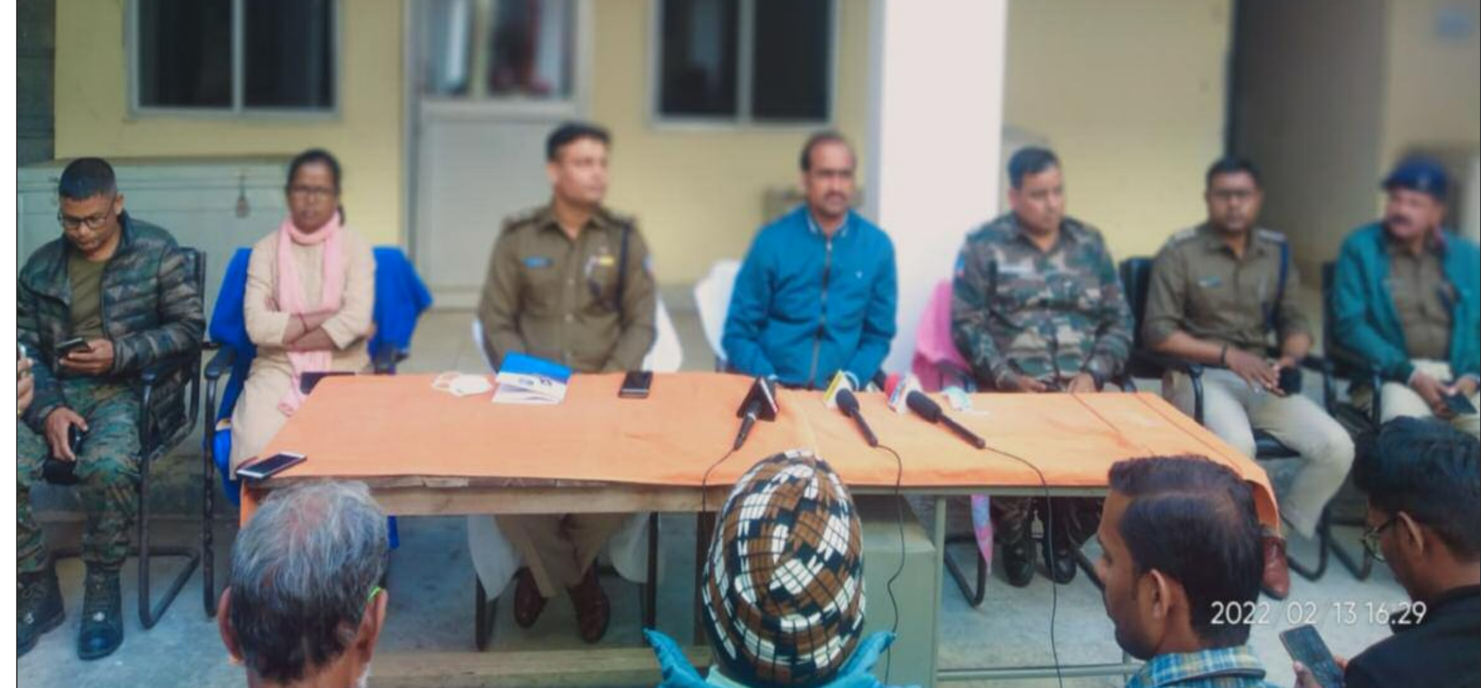
बरही थाना में प्रेस वार्ता करते एसपी एवं डीसी

रूपेश हत्याकांड के बाद चार एफआईआर, डीसी एसपी ने की बरही थाना में प्रेस वार्ता, शांति की अपील