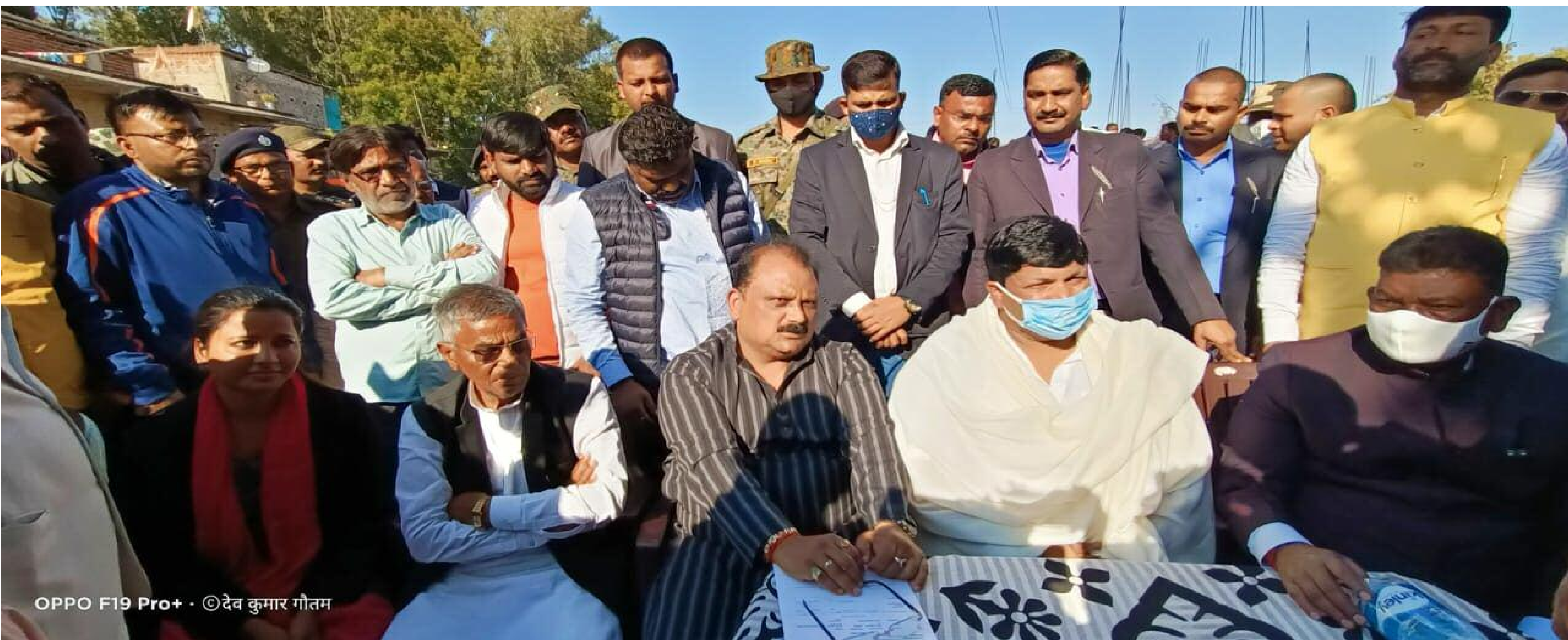
पीड़ित परिवार से मिलते मंत्री एवं विधायक गन

दोषियों को सजा दिलाने का दिया भरोसा, मंत्री कोटे से एक एक लाख सहयोग की घोषणा