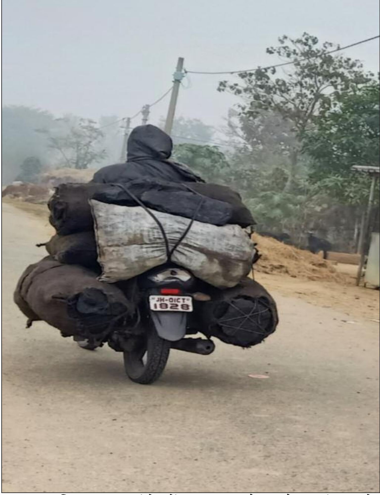
प्रखण्ड सहित इन प्रखंडों में आता है और ईट के कोयला मोटर साइकिल से ब्यवसाई को बेचा जा रहा

कान्हाचट्टी : कान्हाचट्टी प्रखण्ड सहित जिले के कई ऐसे ऐसे प्रखण्ड हैं जहां पर बंगला ईट के ब्यवसाई सरकार को लाखों नहीं करोड़ों रुपये की चुना प्रति वर्ष लगा रहे हैं। कान्हाचट्टी प्रखण्ड सहित जिले के लगभग प्रखंडों में बंगला ईट का ब्यवसाई चल रहा है। जिसमें जो वर्तमान में कोयला भट्टा लगाने के लिए उपयोग किया जा रहा है। वह किसी डिपो या खदान से नहीं बल्कि चोरी के कोयला से भट्टा में कोयला उपयोग हो रहा है। कान्हाचट्टी, इटखोरी, मयूरहैंड, चतरा सदर एवं गिधौर पथलगाड़ा आदि प्रखंडों में टन्डवा और पिपरवार से चोरी की कोयला से बंगला ईट के ब्यवसाई चल रहा है। बताते चलें कि कान्हाचट्टी