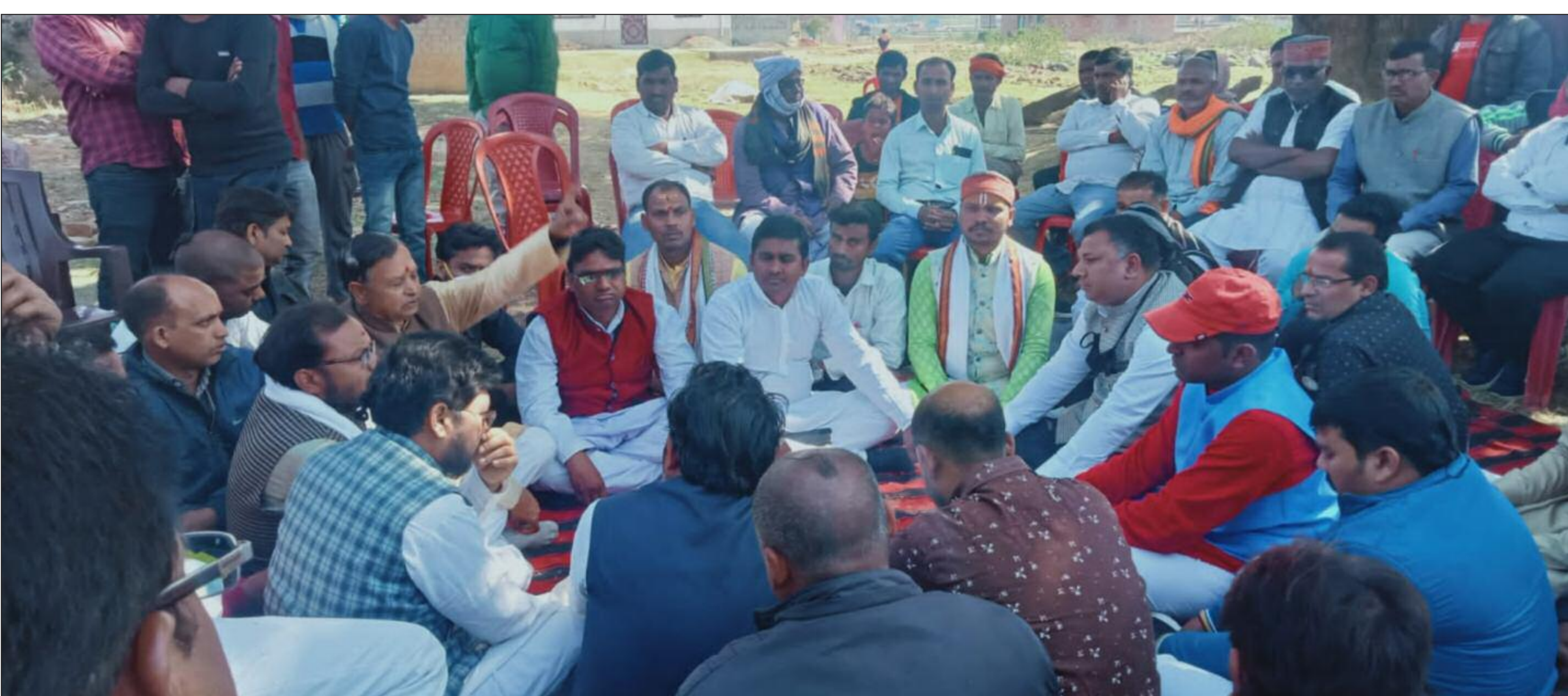
पीड़ित परिवार से मिलते अंतर्राष्ट्रीय ब्राह्मण महासंघ के लोग,

मृतक की ओर से निशुल्क केश लड़ने का घोषणा, आर्थिक सहयोग भी किया