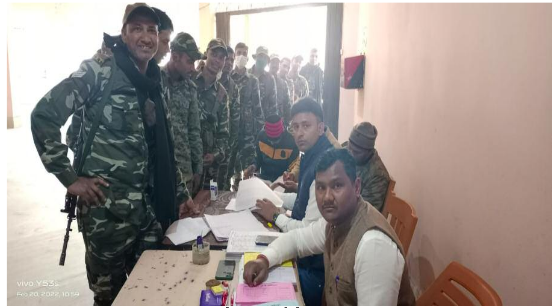
चुनाव में भाग लेते पुलिसकर्मह

झारखण्ड पुलिस मेंस एसोसिएशन के हजारीबाग जिले का चुनाव में बरही अनुमंडल पुलिस पदाधिकारी कार्यालय में बने बूथ पर सम्पन्न हुआ। इस चुनाव में कुल अलग अलग पद के लिए 24 प्रत्याशियों ने भाग लिया। चुनाव के लिए बरही, बडकागाँव एवम हजारीबाग सदर में मतदान केंद्र बनाया गया, चुनाव सात पदों के लिए किया गया जिसमें सभापति, उपसभापति, सचिव, कोषाध्यक्ष, संयुक्त सचिव, केंद्रीय सदस्य एवम