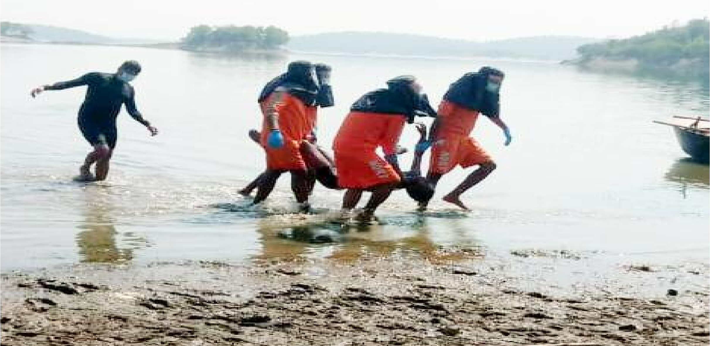
तिलैया डैम से शव निकालते एनडीआरएफ की टीम

चंदवारा थाना क्षेत्र के जामुखाण्डी के निकट तिलैया डैम में शनिवार को डूबे युवक का शव 72 घण्टे के बाद मंगलवार को निकाल लिया गया। इसके लिये रांची से आए एनडीआरएफ की टीम को काफी मशक्कत करना पड़ा। एनडीआरएफ के इंस्पेक्टर मो. शाहनवाज आलम के नेतृत्व में जवानों ने डैम के गहरे पानी के कई हिस्सों में खोजबीन जारी रखा। उन्होंने बताया कि डैम की चौड़ाई हवा के वेग होने के कारण शव को खोजने में समय लगा। इधर डैम से जैसे ही शव बाहर निकला पास के माहौल काफी गमगीन हो