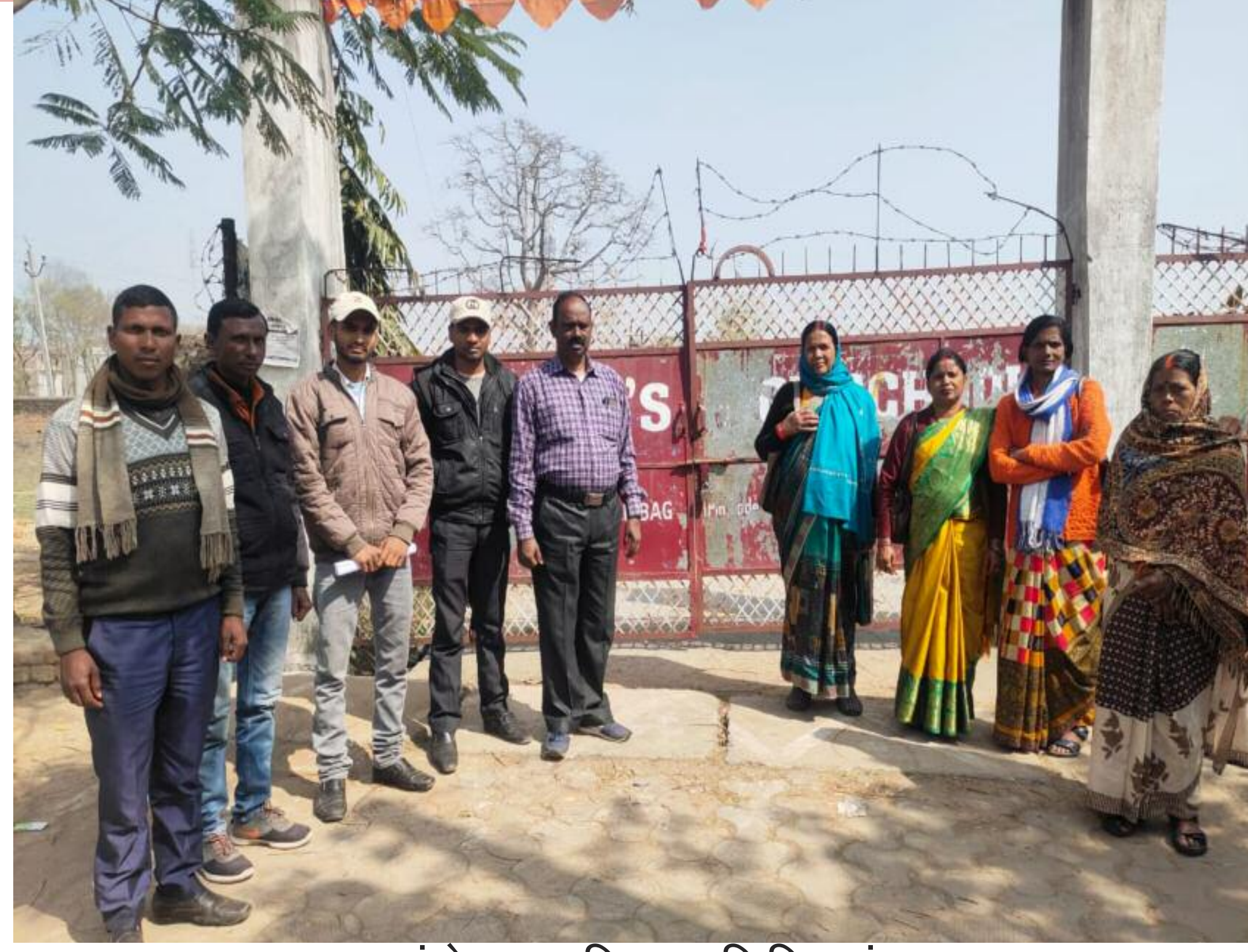
आंदोलनरत शिक्षक, शिक्षिकाएं।