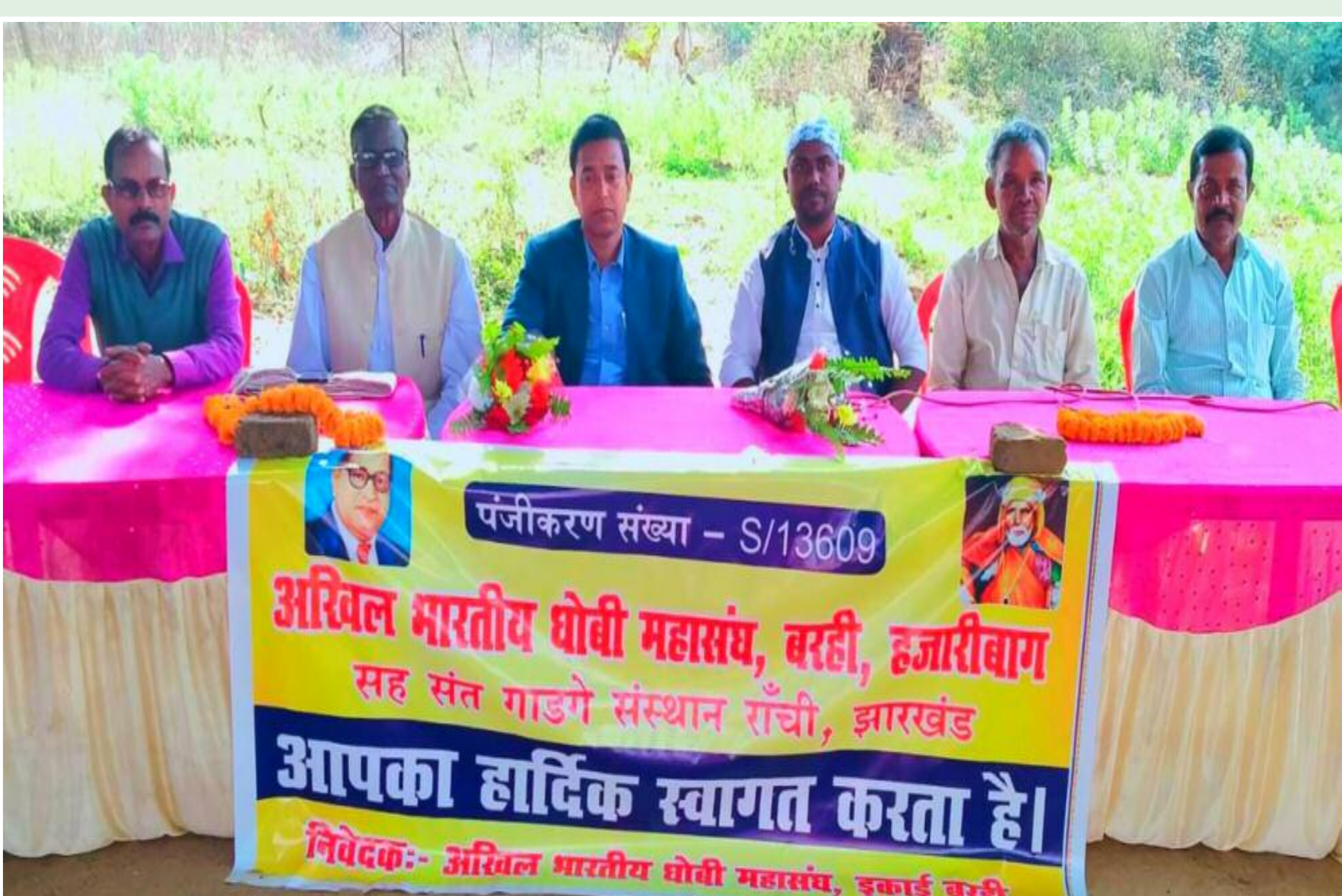
गाड़गे जी महाराज की जयंती में शामिल लोग