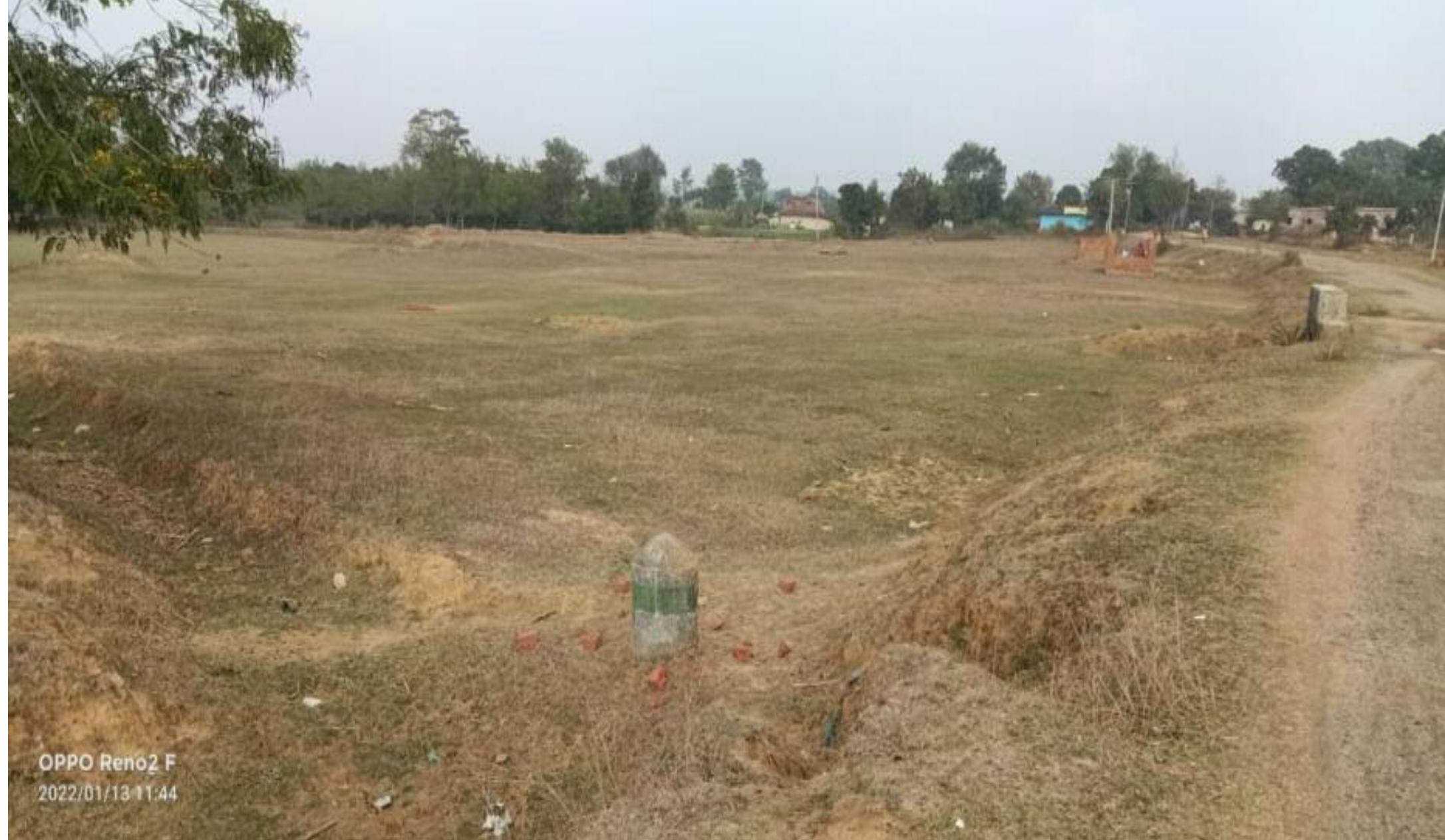
कि चारु पंचायत के हेसापरम गांव के खाता 20 के लगभग 200 एकड़ जमीन की मामला को

कान्हाचट्टी : प्रखण्ड के चारु पंचायत के हेसापरम के खाता नम्बर 20 के प्लॉट नम्बर 1,2,178,180,392,404,14,37,182,410,430,192,46,54,191,441,444,195,67,73,249,454,462,256,88,90,259,469,467,269,167,118,280,486,494,283,135,150,308,266,311,161,169, सहित कुल 54 प्लॉट के लगभग 200 एकड़ जमीन को कब्जा मुक्त करने के लिए अंचल अधिकारी ने पहल शुरू कर दी है। गुरुवार को अंचल उपनिरीक्षक एवं अंचल निरीक्षक के जांच प्रतिवेदन के आलोक में अंचल अधिकारी ने ऊक्त खाता में अवैध रूप से जोत कोड और कब्जा करने वाले किसानों को इस्तेहार के माध्यम से 28 फरवरी तक दावा करने की समय सीमा दिया गया है। अंचल से जो इस्तेहार निकाला गया है उसका पत्रांक 93 दिनांक 22 फरवरी 2022 है। जिसमें कहा गया है कि ऊक्त जमीन में किसी को कोई दावा आपत्ति हो तो वो 28 फरवरी तक अंचल कार्यालय में आकर लिख कर दें। अन्यथा इस जमीन पर किसी का दावा नहीं समझा जाएगा। बताते चलें