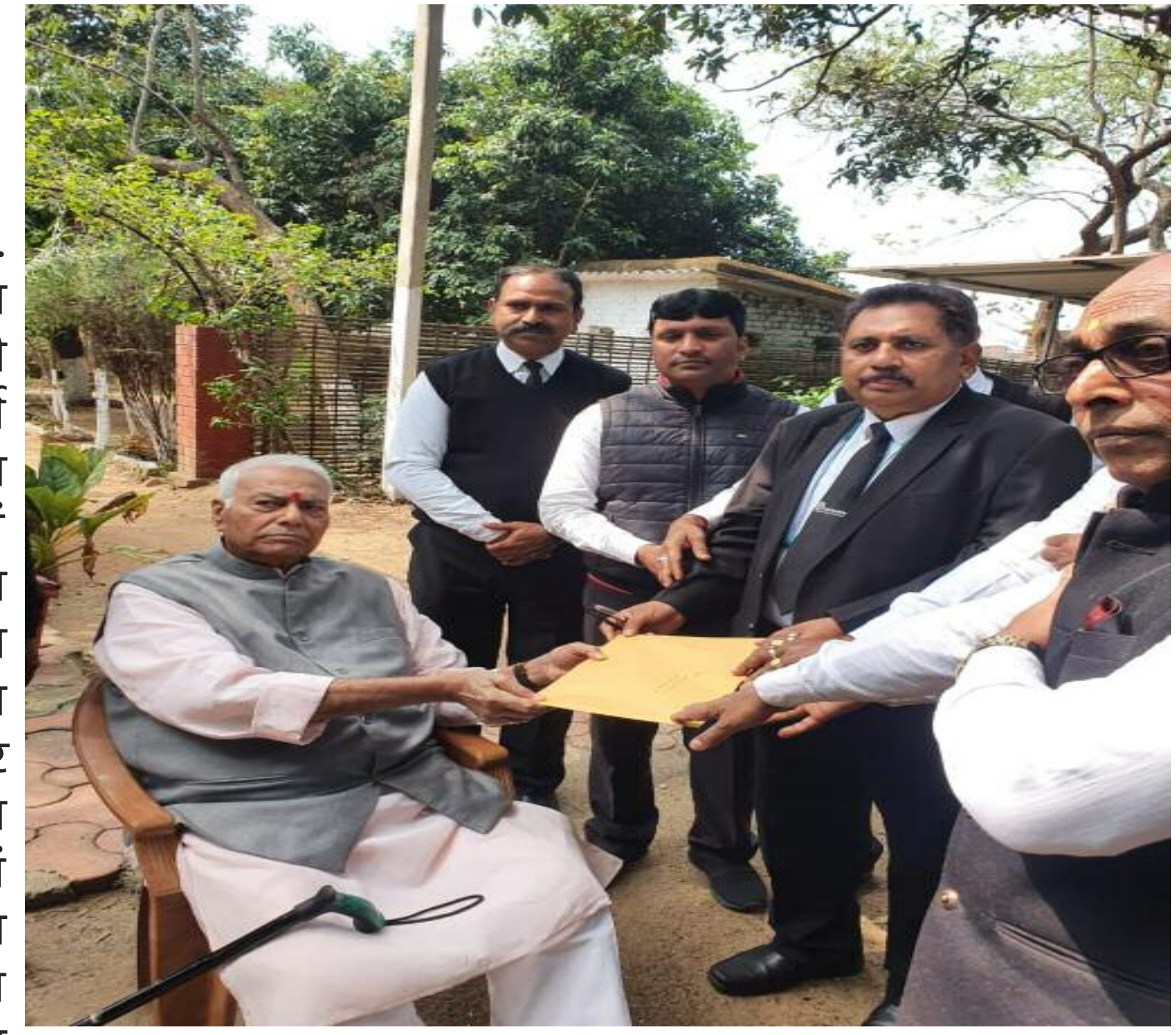
ज्ञापन सौंपते सहारा इंडिया के कर्म

सहारा के सम्मानित निवेशकर्ता व कार्यकर्ताओं का सेबी के विरुद्ध राष्ट्रव्यापी आंदोलन को लेकर पूर्व केंद्रीय वित्त मंत्री जसवंत सिन्हा से हजारीबाग में मुलाकात कर ज्ञापन सौंपा है। इस दौरान रीजनल प्रमुख ने सेबी एवं सहारा इंडिया प्रकरण को लेकर जसवंत सिन्हा विस्तार रूप से जानकारी दी एवं 24000 करोड़ वापस कराने हेतु समस्त आकड़े को बखूबी प्रस्तुत कर समाधान कराने की मांग की। मौके पर