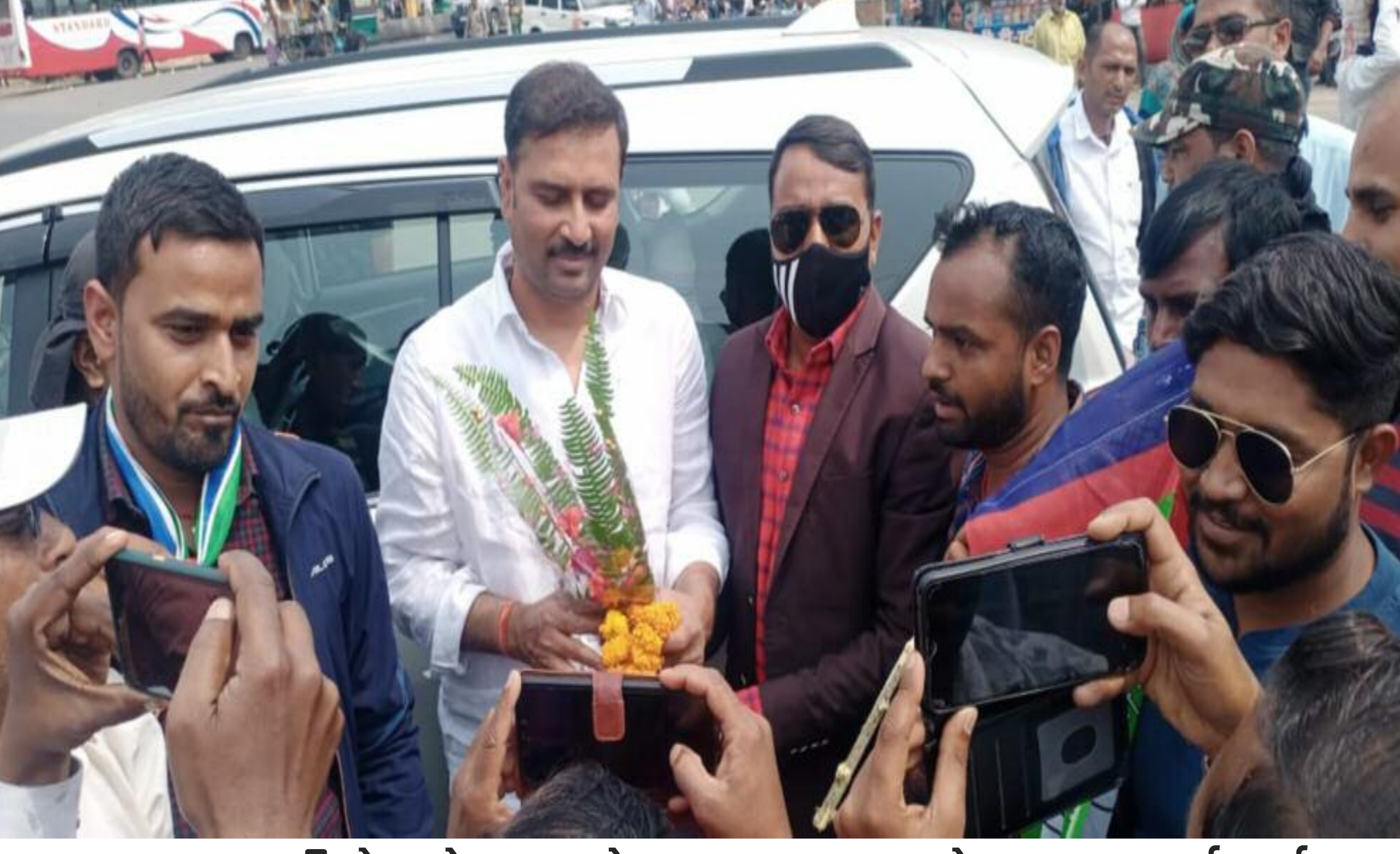
आजसू सुप्रीमो सुदेश महतो का स्वागत करते आजसू कार्यकर्ता