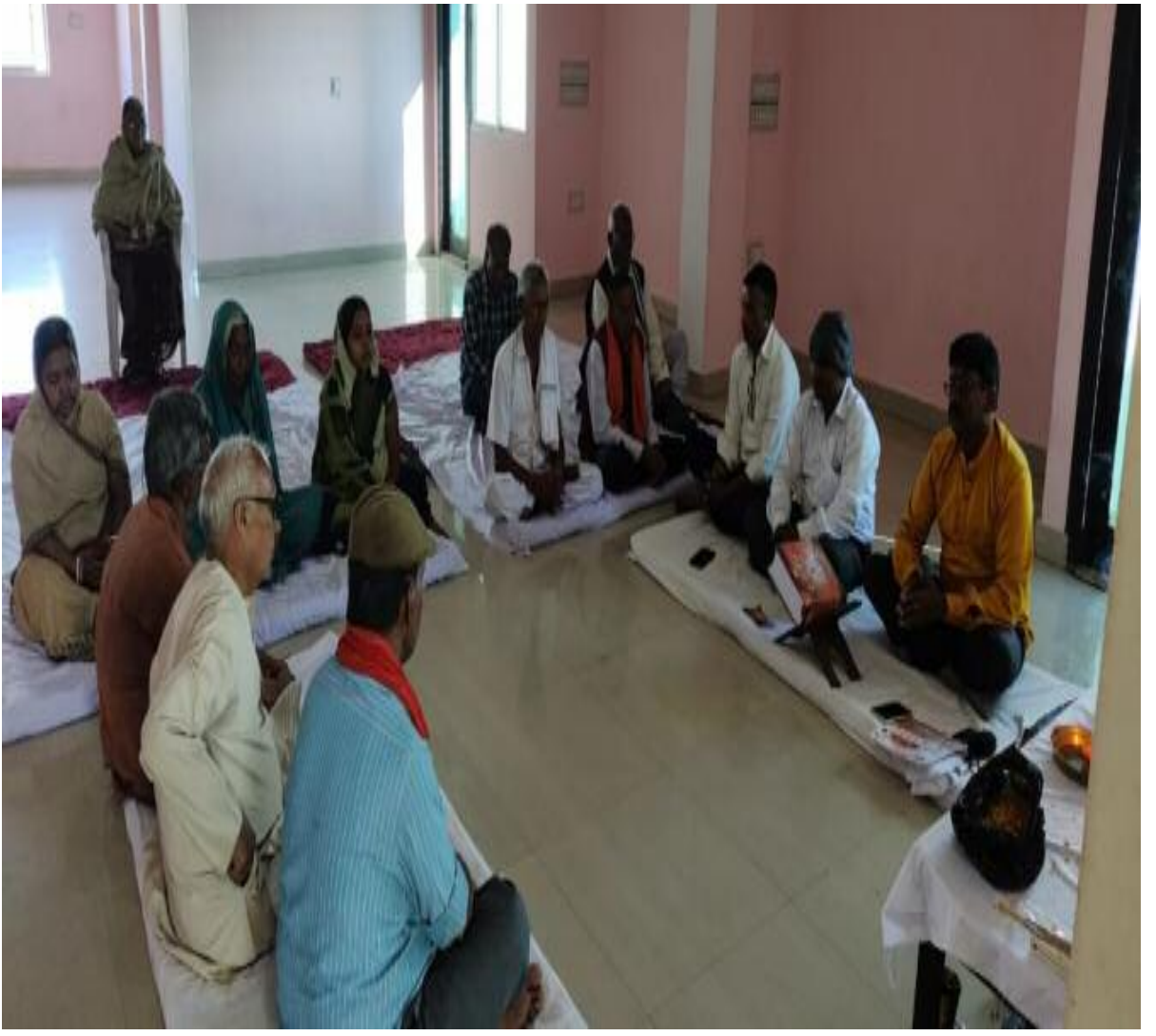
सत्संग गोष्ठी में शामिल श्रद्धालु

शकुंतला पैलेस बरही में ब्रह्म विद्या विहंगम योग की ओर से सत्संग गोष्ठी का आयोजन