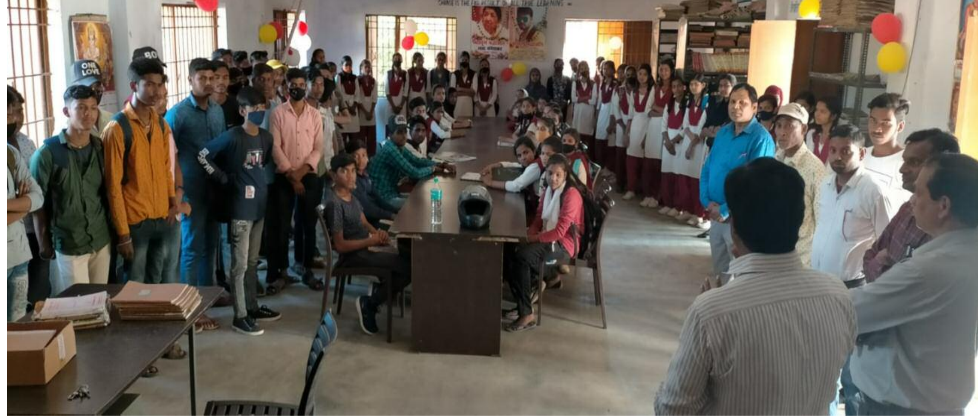
पुस्तकालय की जानकारी लेते अम्बेदकर कोचिंग के छात्र एवं छात्राएं

पुस्तकालय के अध्यक्ष एवं सचिव ने दी पुस्तकालय की जानकारी, पुस्तकालय के महत्व से हुए अवगत