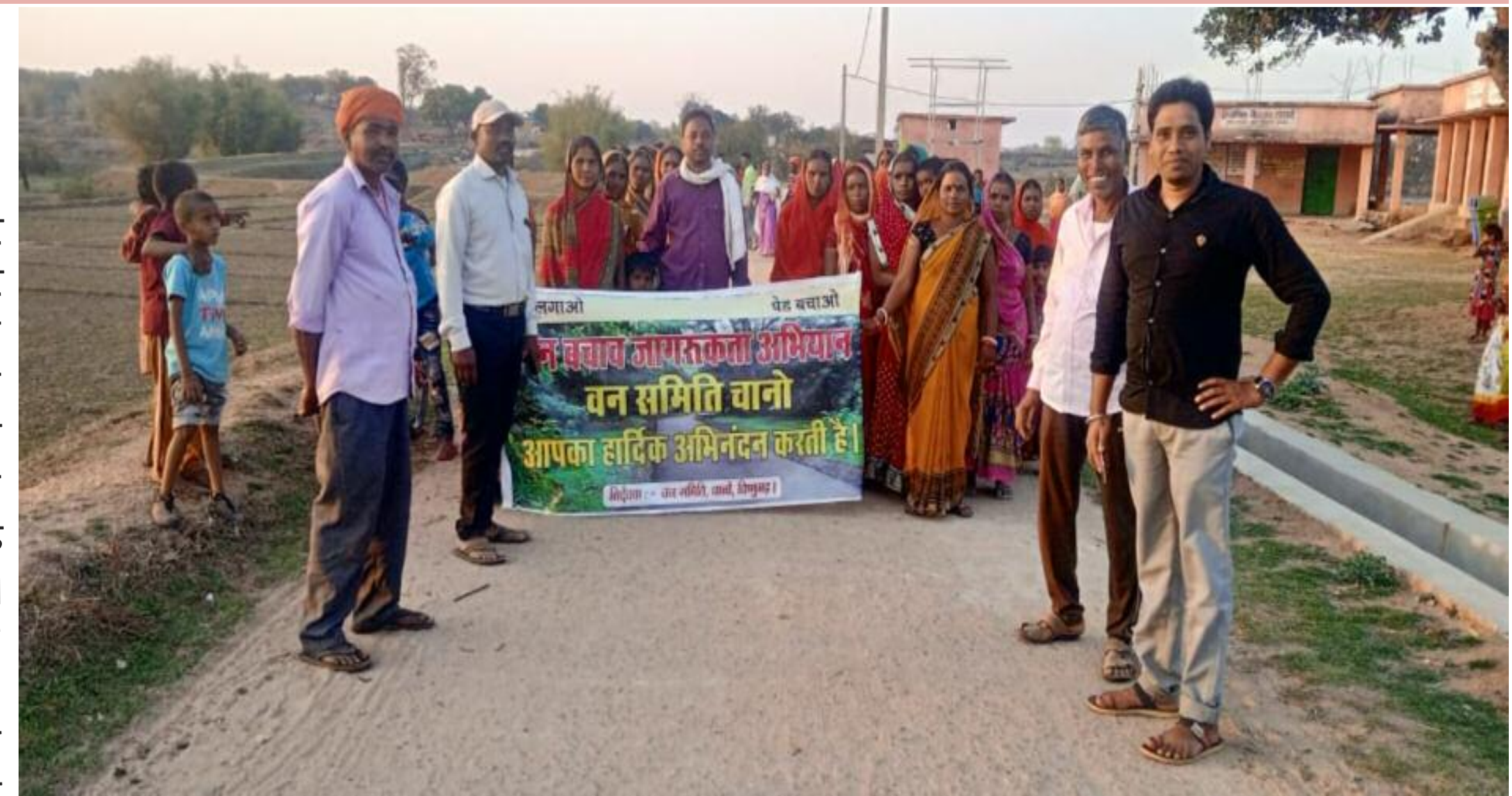
चानो में वन बचाने को लेकर जागरूकता अभियान में शामिल महिलाएं

चानो पंचायत में सोमवार को जंगल बचाने को लेकर वन समिति चानो के तत्वाधान में वन बचाओ जागरूकता अभियान चलाया गया। अभियान में खासकर महिलाओं ने बढ़ चढ़कर भाग लिया। जागरूकता अभियान में नागी, बंदखारो, उच्चाधाना, मंगरो तथा चानो गांव के विभिन्न टोलों में चलाया गया। जिसमें जंगल की अवैध कटाई नहीं करने, किट्टी के खेत से गोबर गो. इत्र नहीं चुनने तथा जंगल में आग नहीं लगाने समेत जंगल बचाने से संबंधित नारे लगाकर लोगों को जागरूक किया गया। जुलूस के पश्चात स्थानीय फुटबॉल मैदान में बैठक की गई। बैठक में पूर्व मुखिया डुमरचंद महतो ने कहा कि जंगल की रक्षा करना,