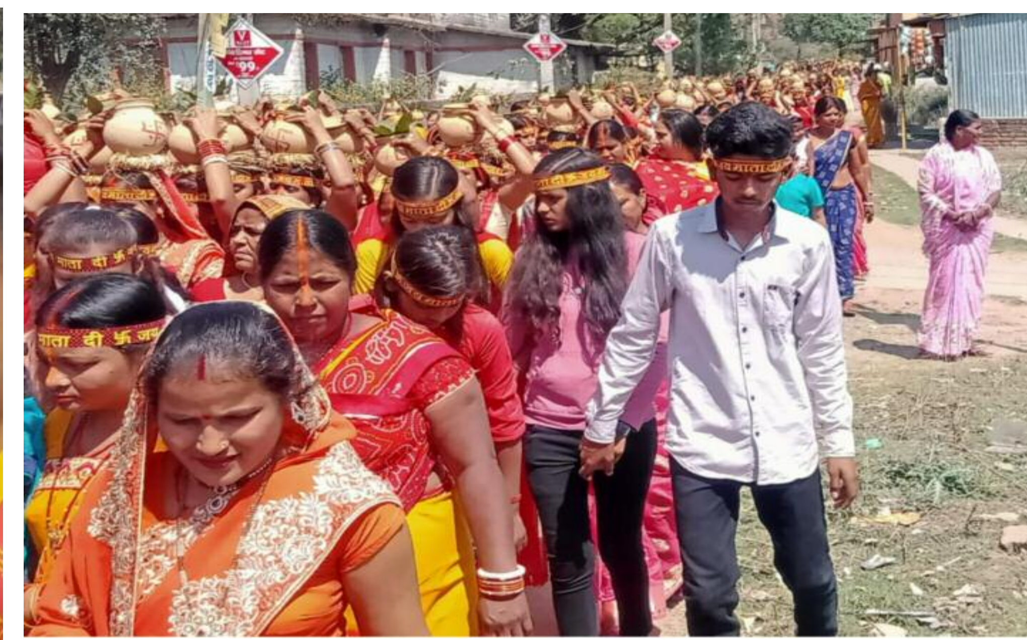
कलश यात्रा में शामिल श्रद्धालु